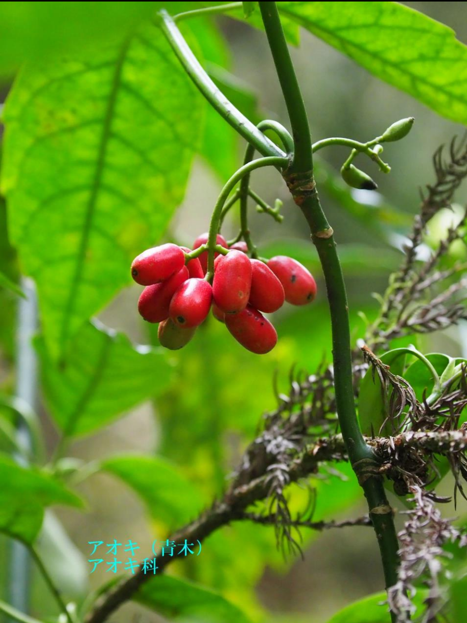
アオキ (青木) アオキ科