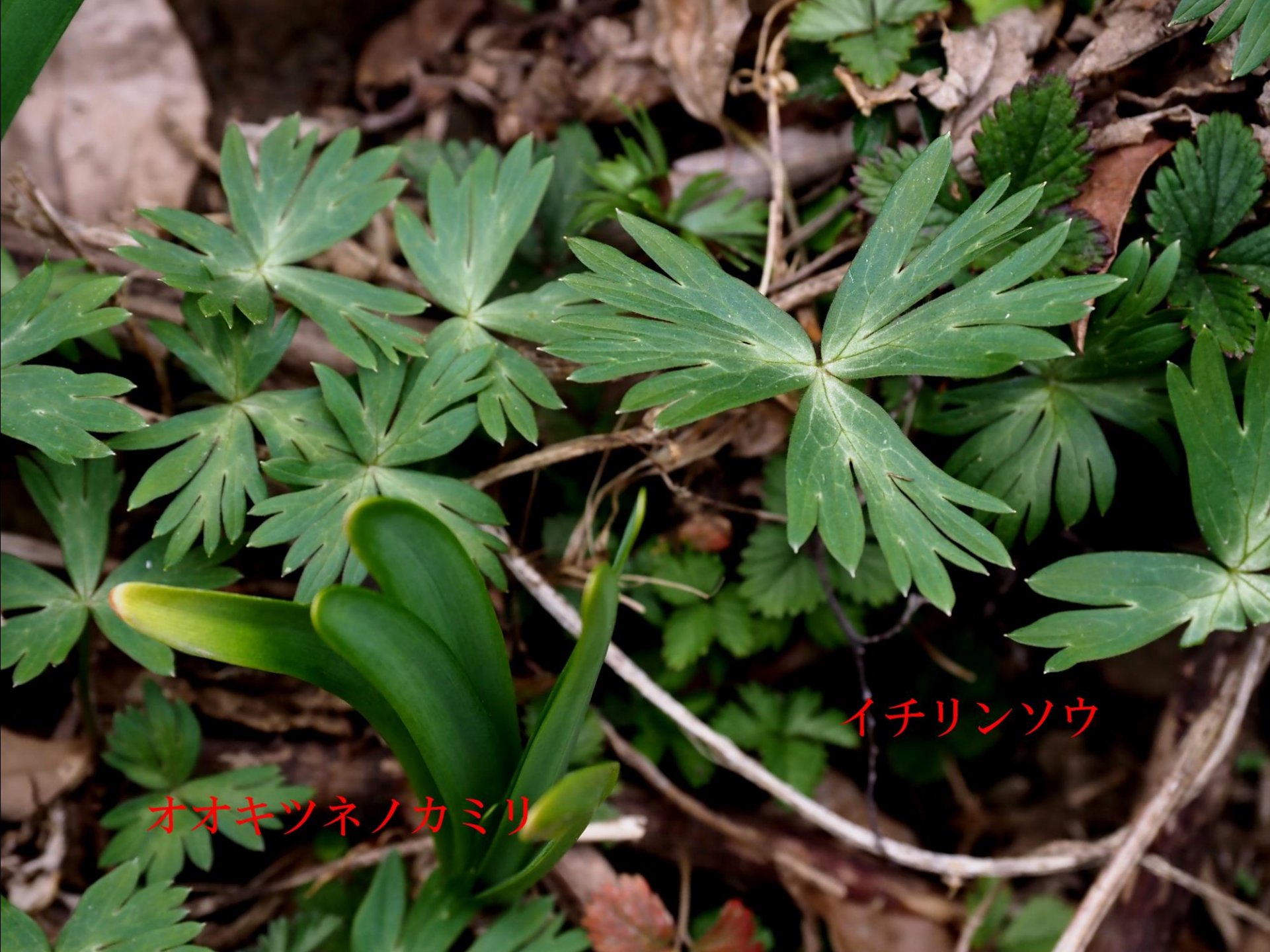
オオキツネノカミリ