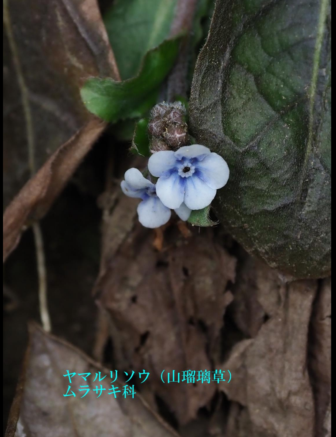
ヤマリソウ (山瑠璃草) ムラサキ科