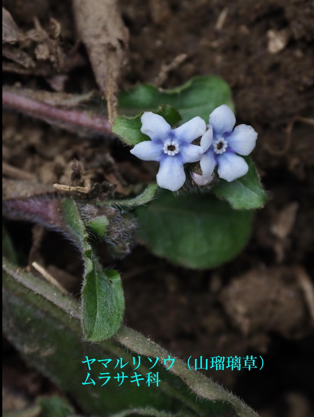
ヤマリソウ (山瑠璃草) ムラサキ科