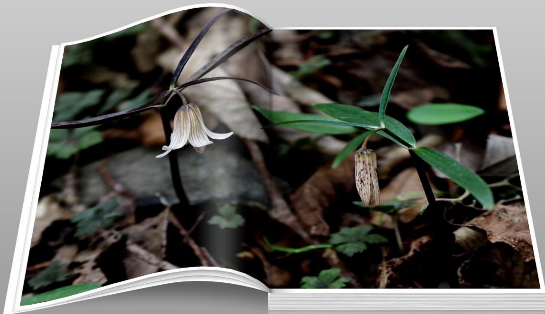
ホソバナコバイモ (細花小貝母) ユリ科