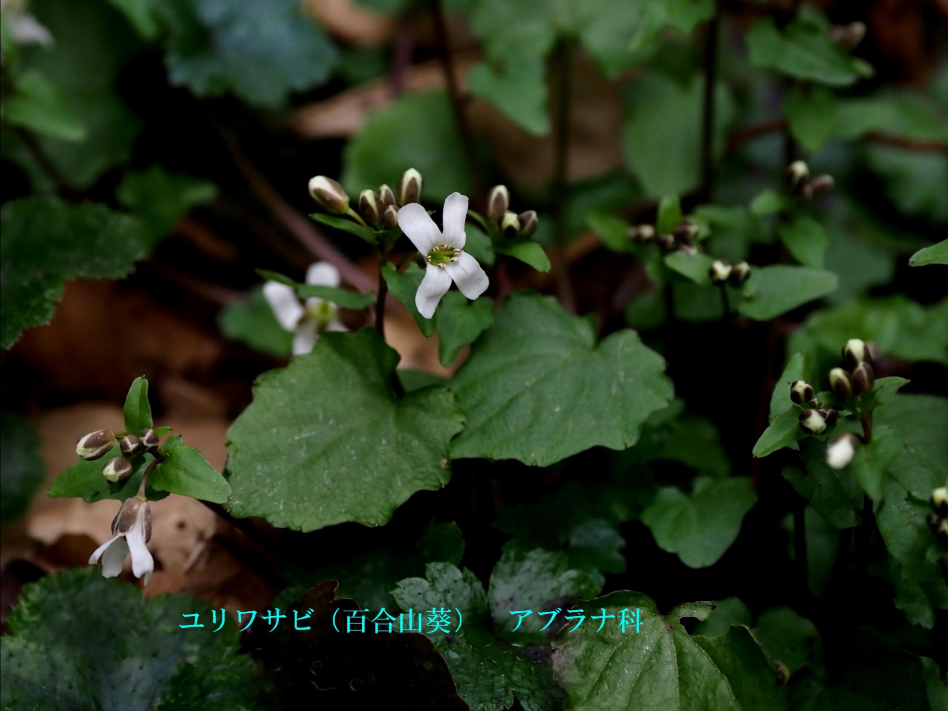
ユリワサビ (百合山葵) アブラナ科