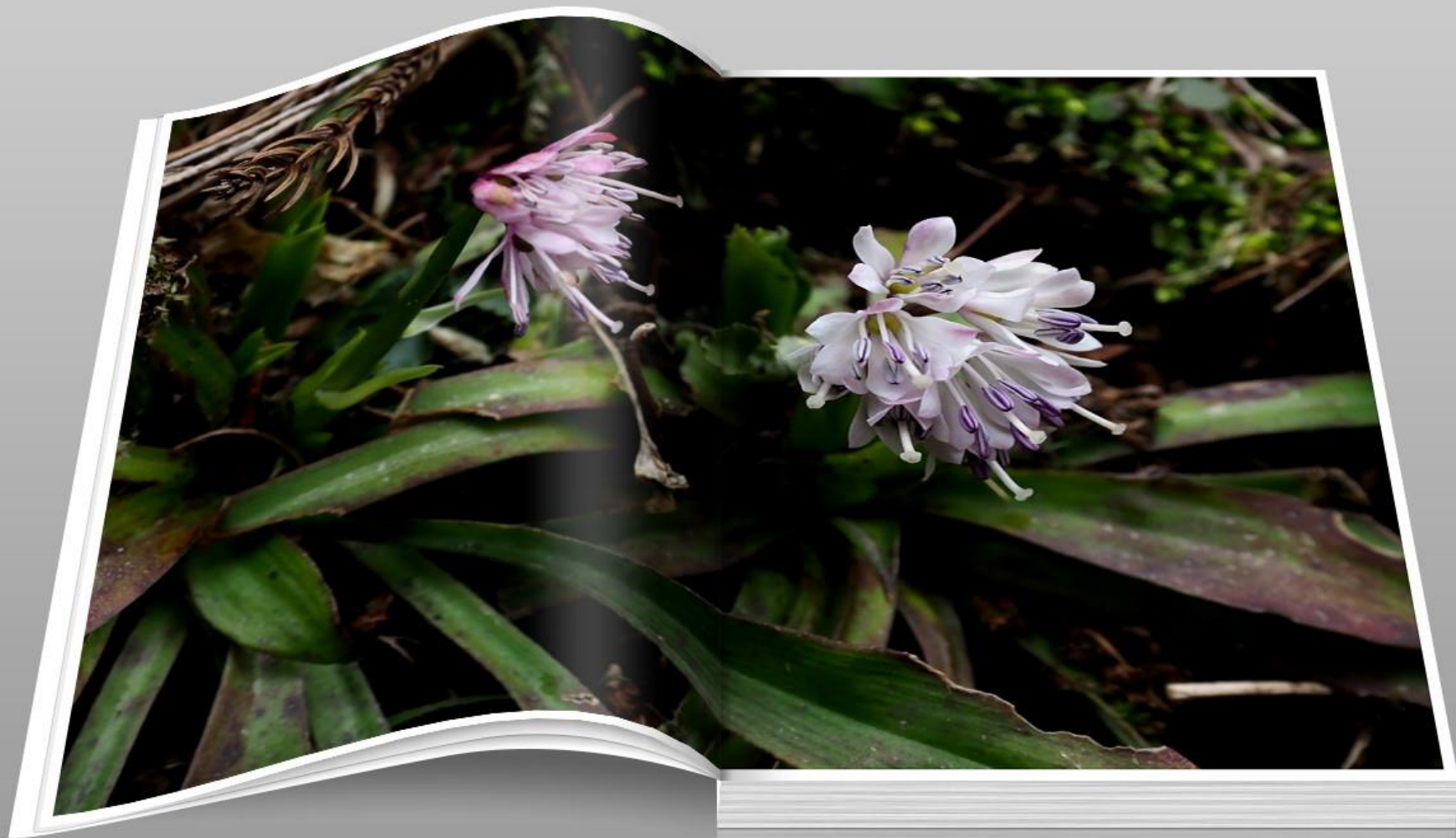
ツクシシヨウジョウバカマ（筑紫猩々袴） ユリ科