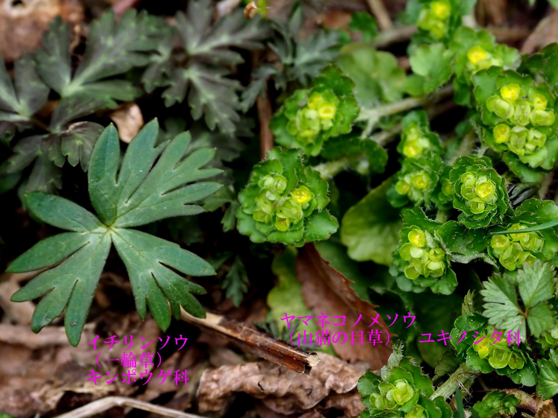
イチリンソウ (一輪草) キンポウゲ科