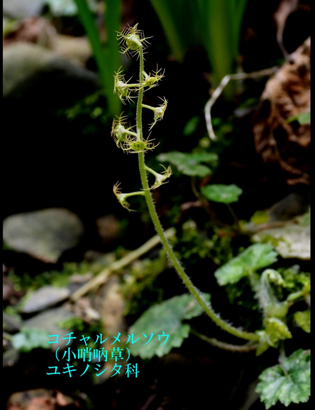
コチャルメルソウ (小哨唸草) ユキノシタ科