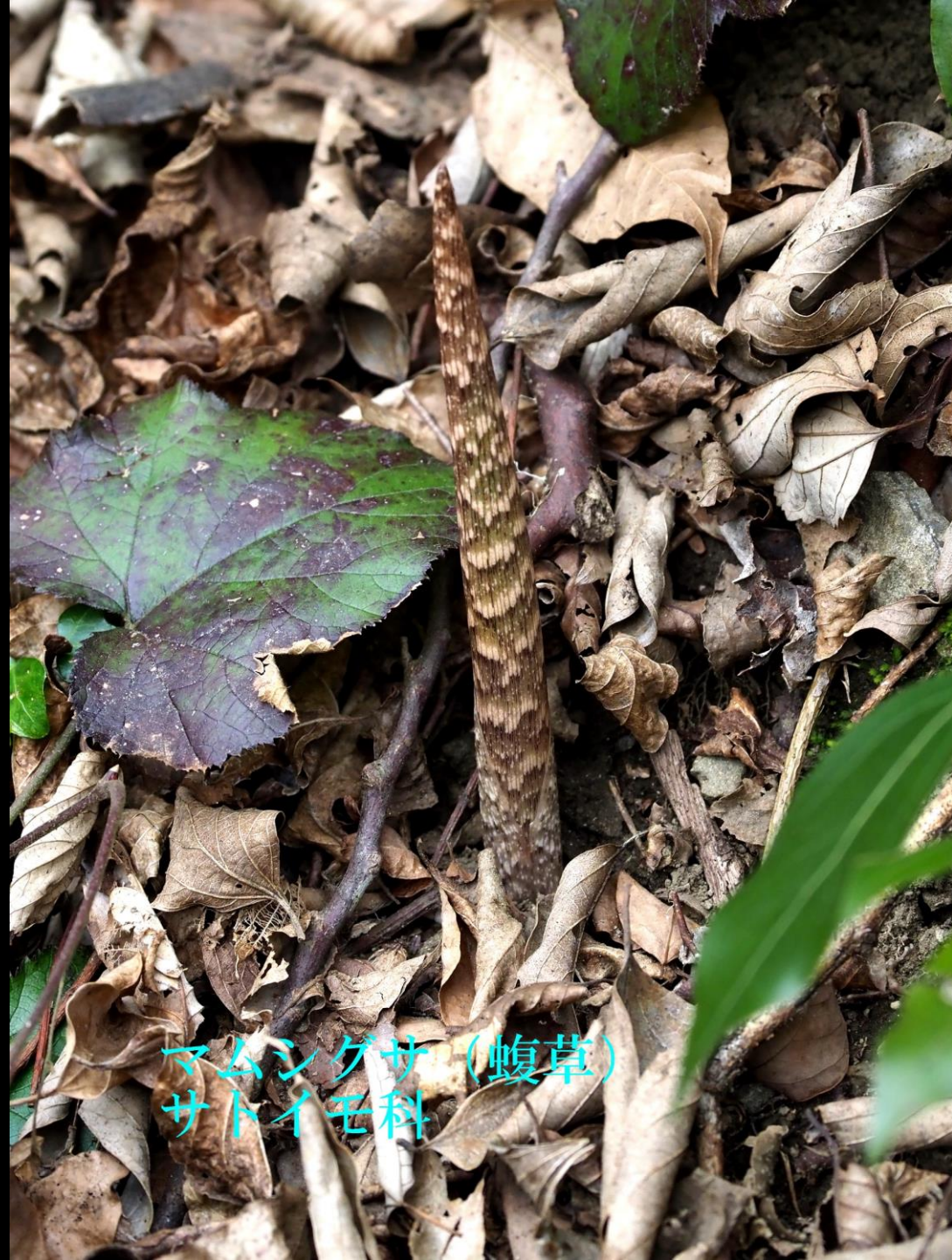
マムシゲサ (蝮草) サトイモ科