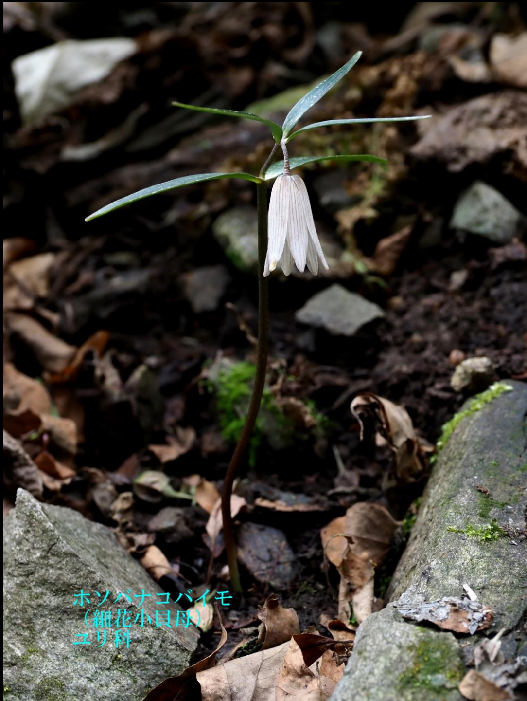
ホソバナコバイモ (細花小貝母) ユリ科