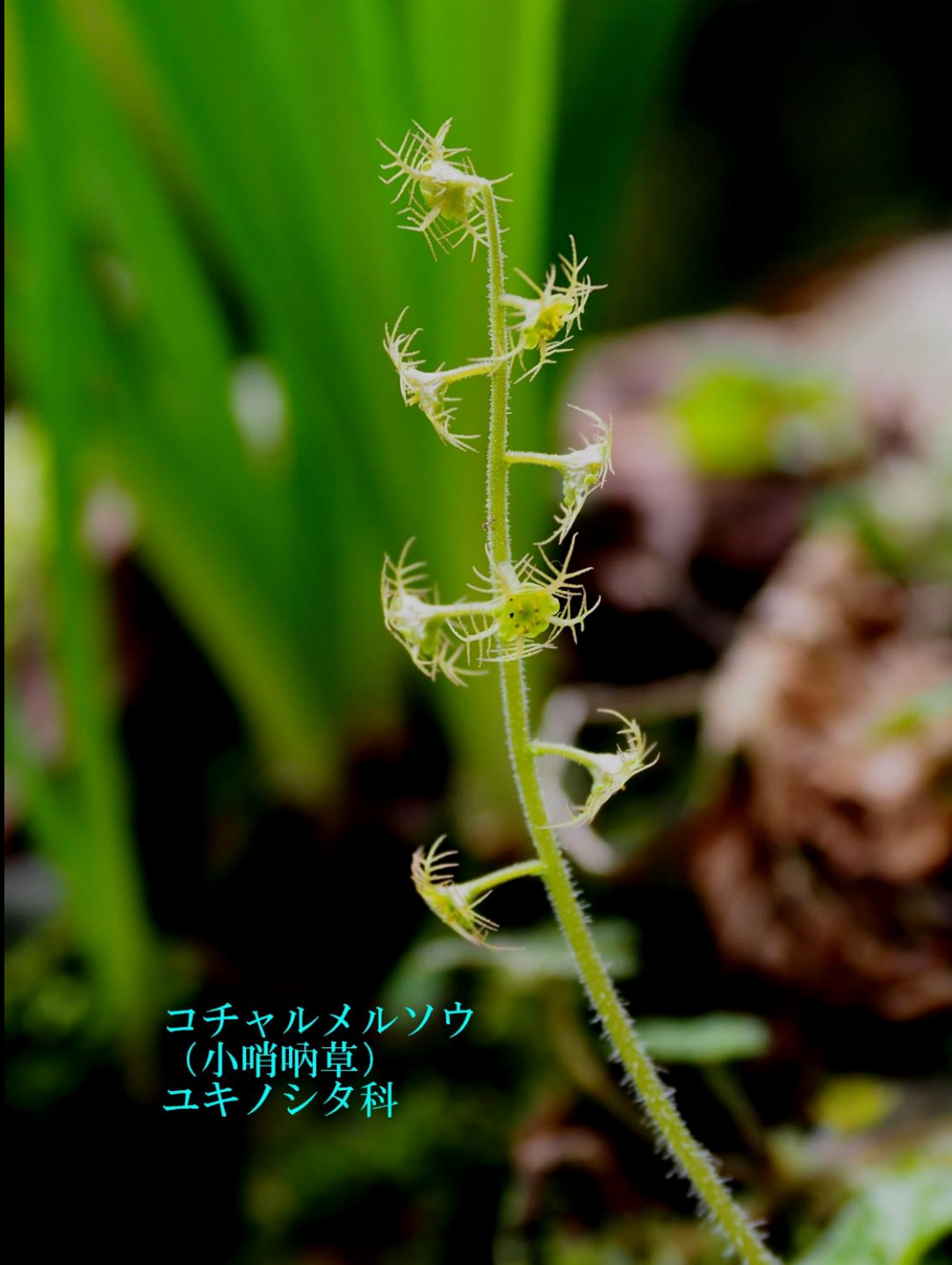
コチャルメルソウ (小哨唸草) ユキノシタ科