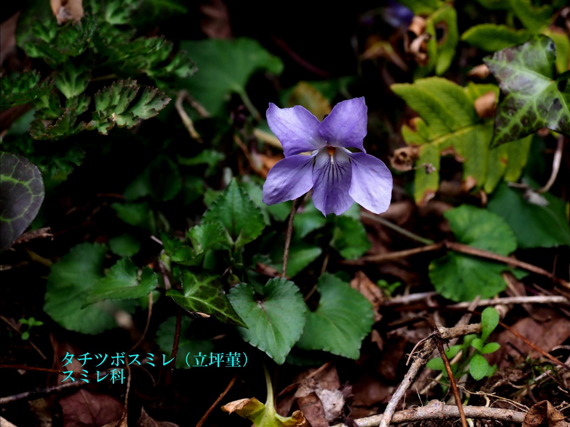
タチツボスミレ (立坪堇) スミレ科