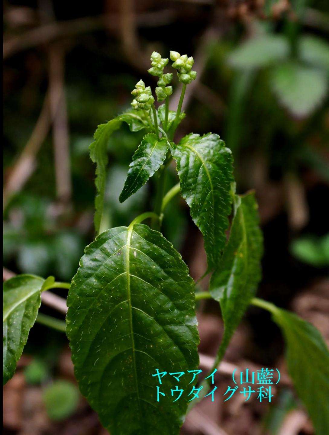
ヤマアイ (山藍) トウダイグサ科