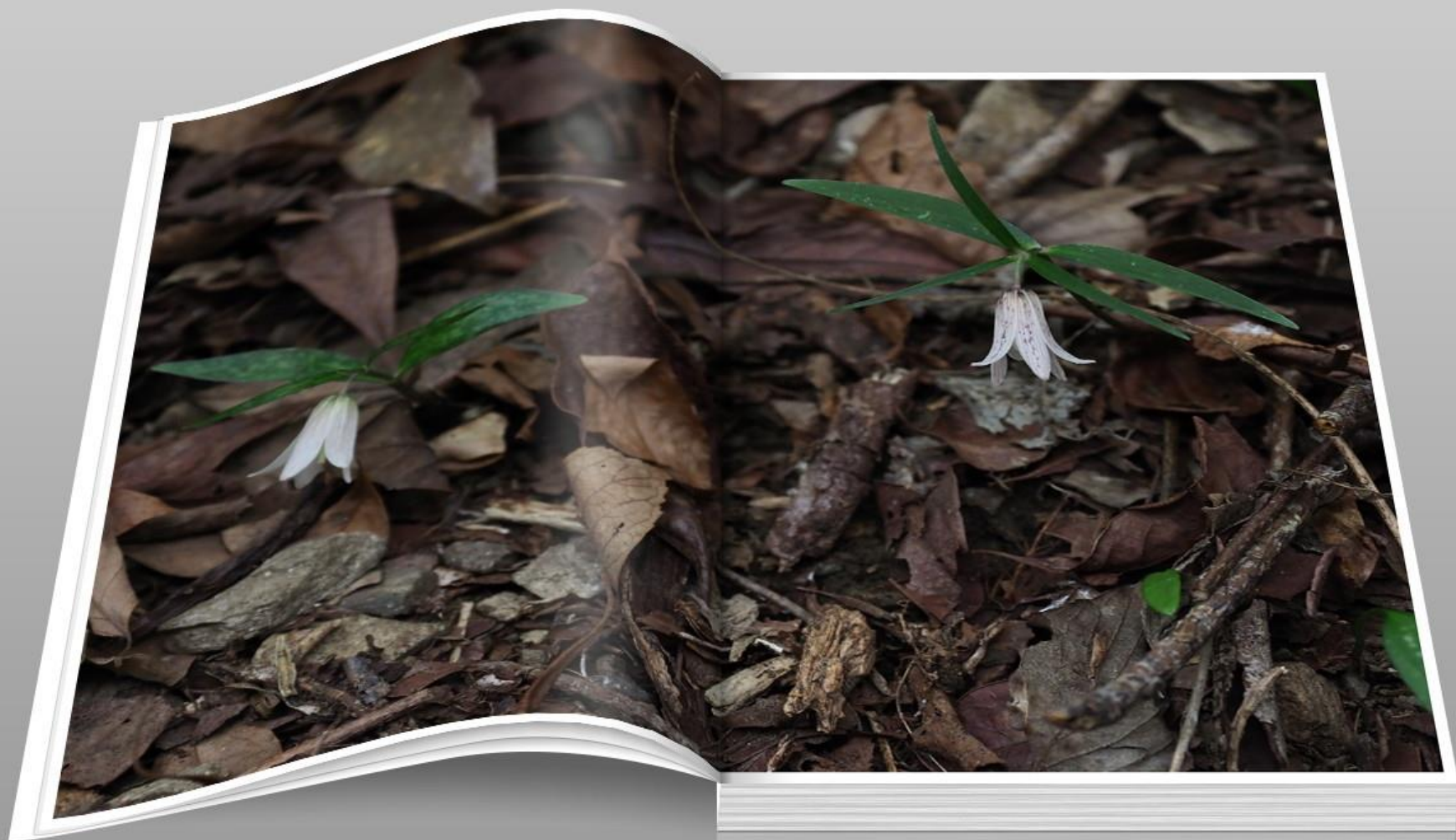
ホソバナコバイモ（細花小貝母） ユリ科