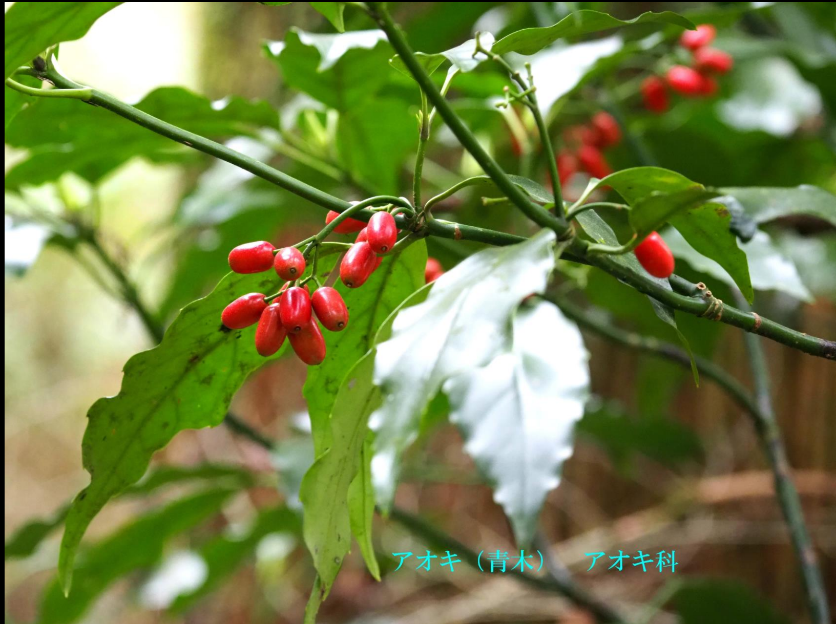
アオキ (青木) アオキ科