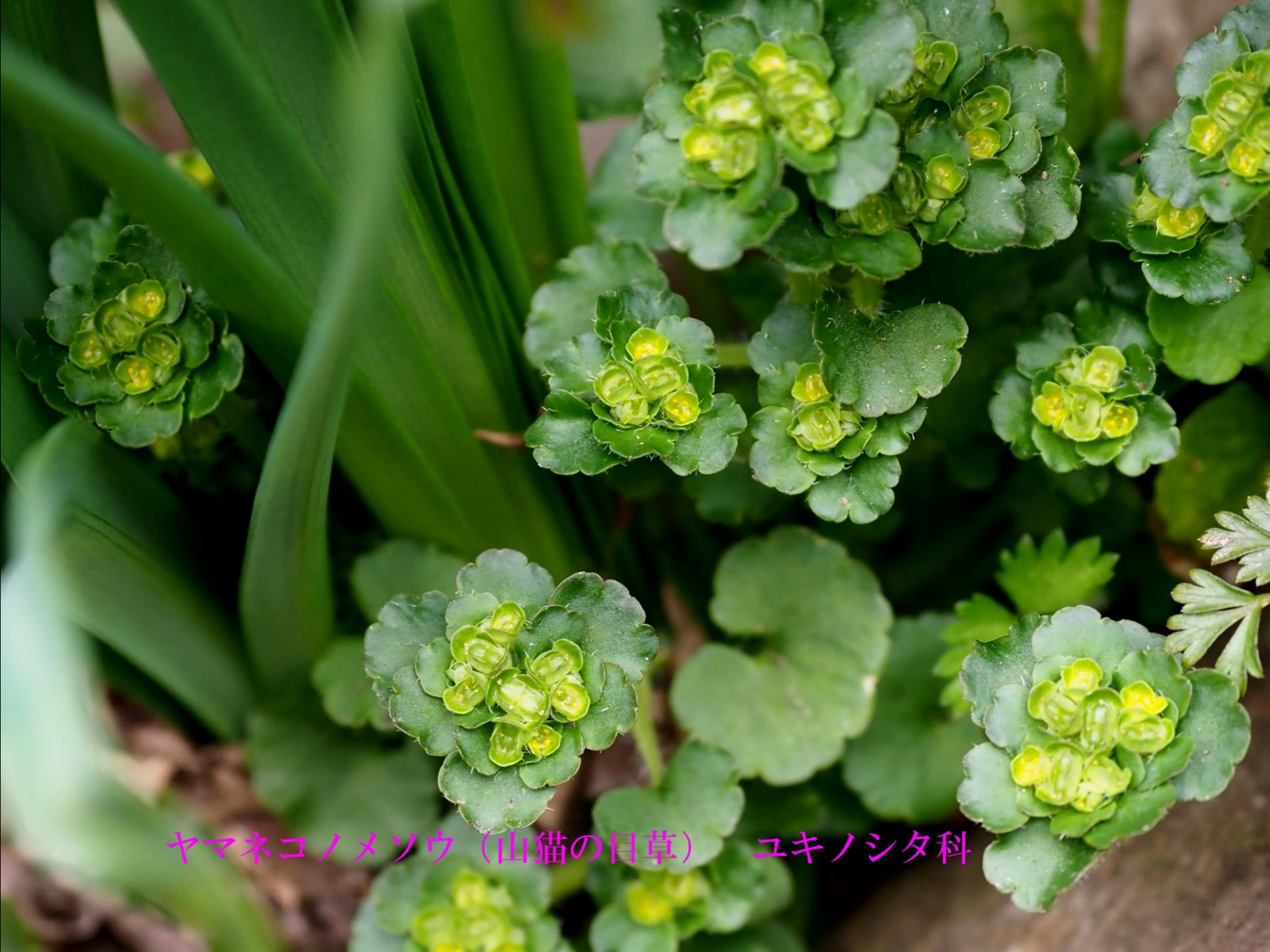
ヤマネコノメソウ（山猫の目草） ユキノシタ科