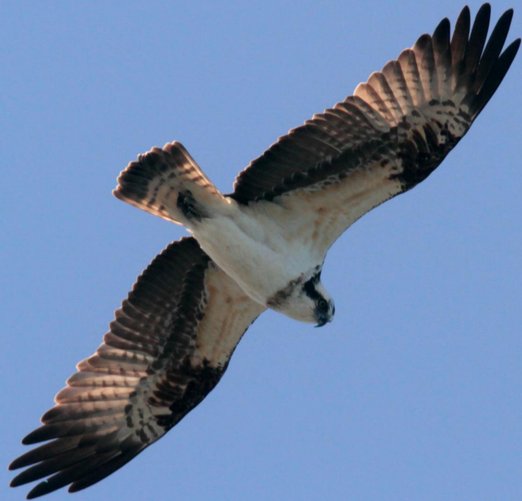
ミサゴ (鵟) ワシタカ科 L=メス64cm