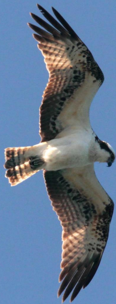
ミサゴ (鵟) ワシタカ科 L=オス54cm