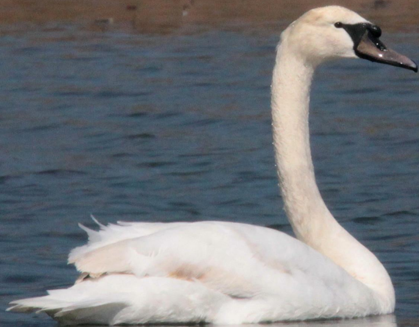
コブハクチョウ（瘤白鳥） ガンカモ科 L=152cm