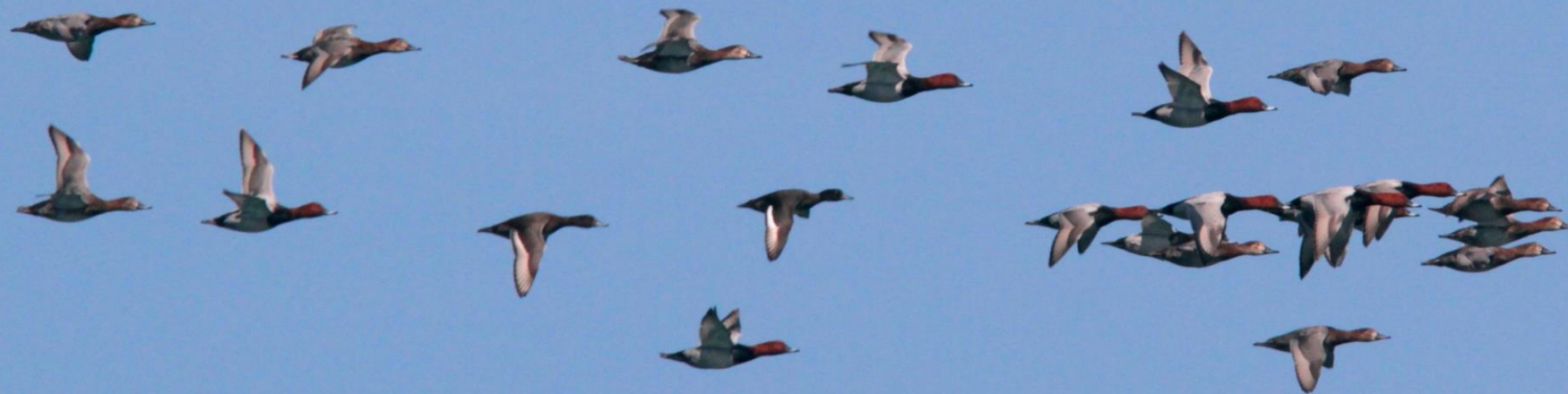
ヒドリガモ（緋鳥鴨） ガンカモ科 L=49cm