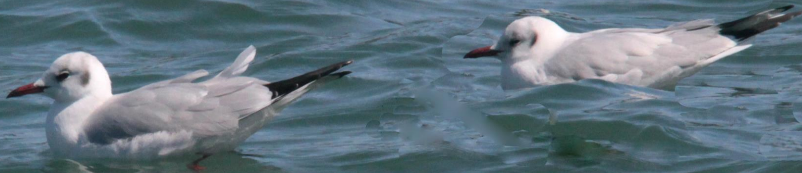
ユリカモメ（百合鷗） カモメ科 L=40cm