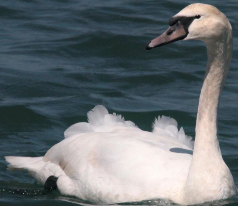
コブハクチョウ（瘤白鳥） ガンカモ科 L=152cm