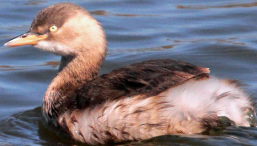
カイツブリ (鳩) カイツブリ科 L=26cm