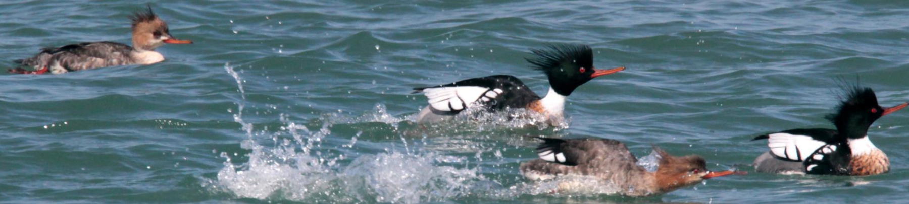
ウミアイサ（海秋沙） ガンカモ科 L=55cm