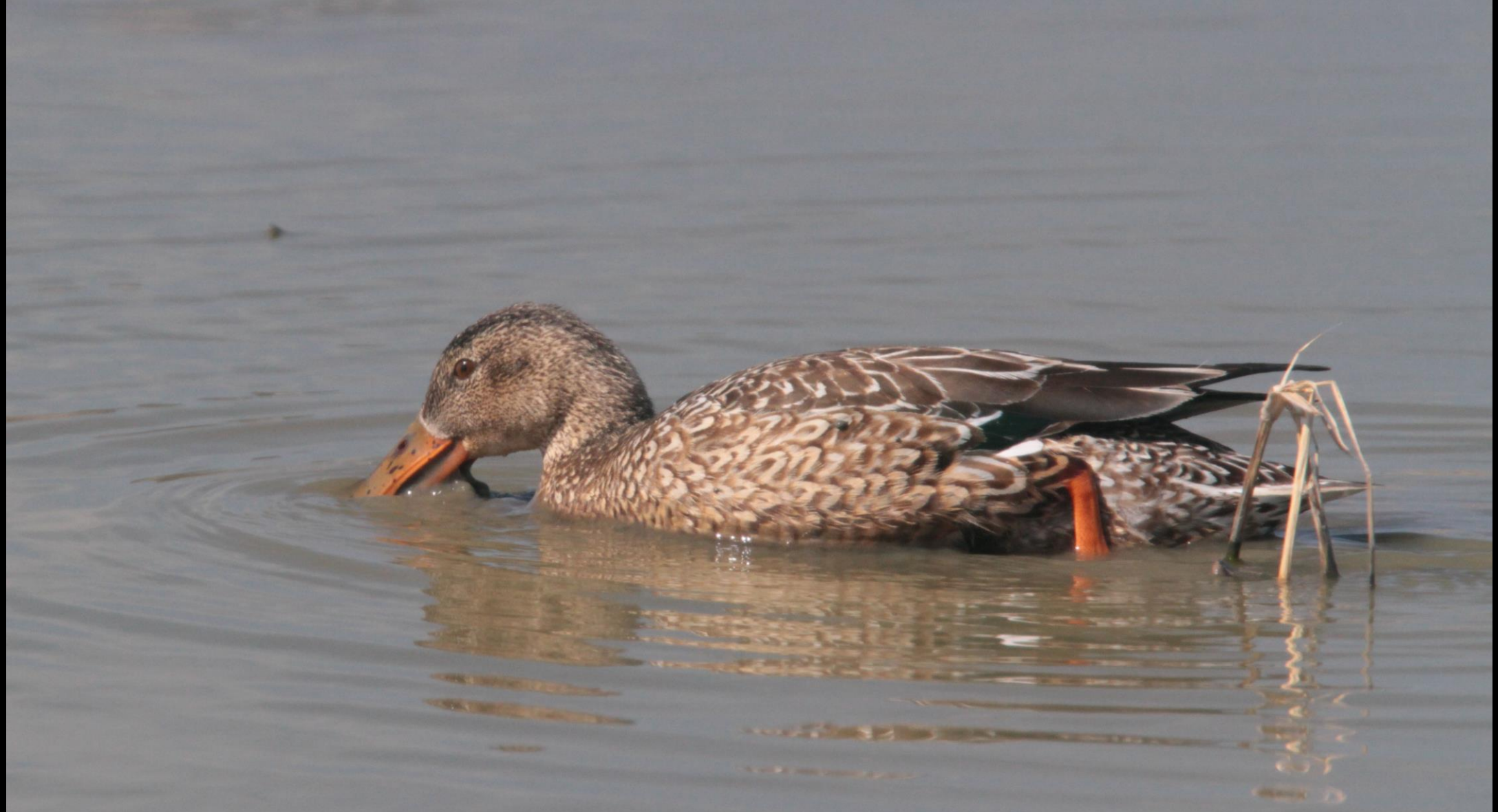
ハシビロガモ（嘴広鴨）メス ガンカモ科 L=50cm