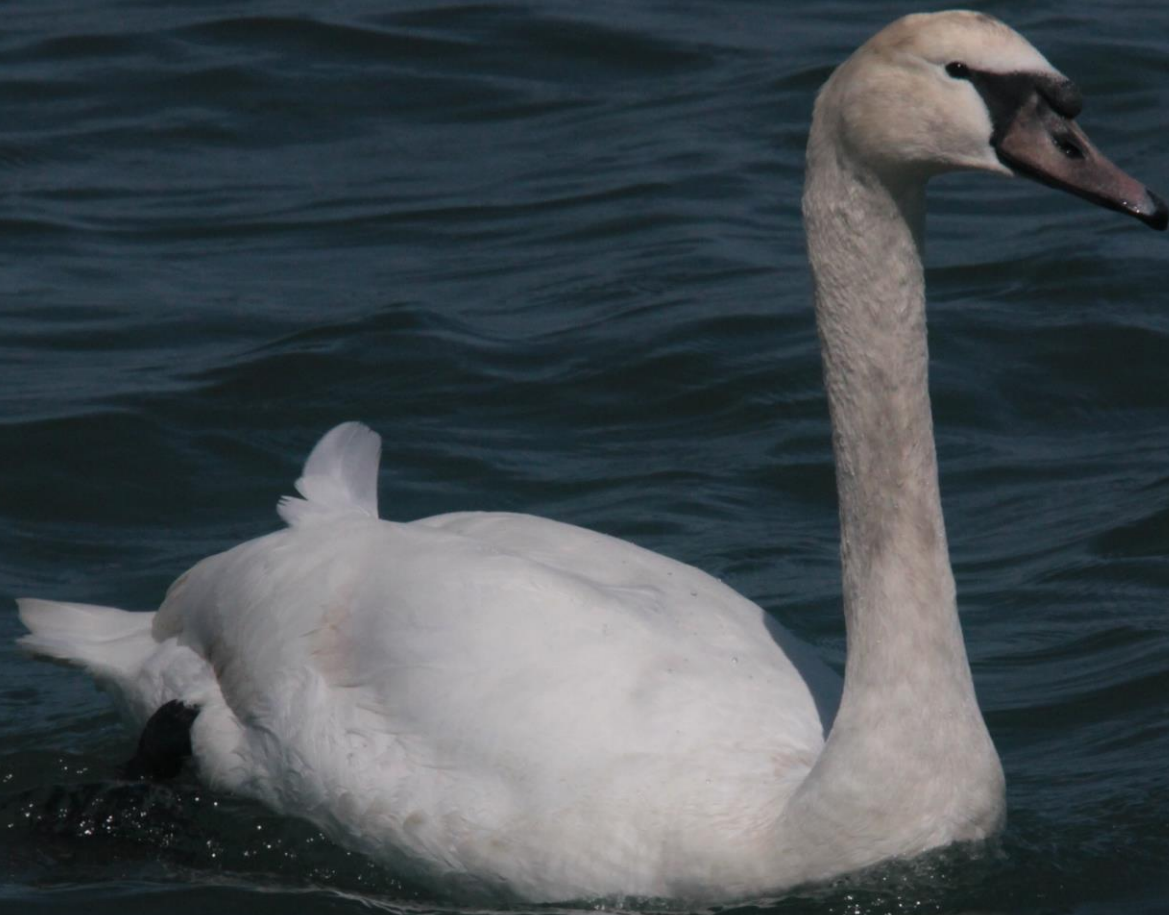
コブハクチョウ (瘤白鳥) ガンカモ科 L=152cm