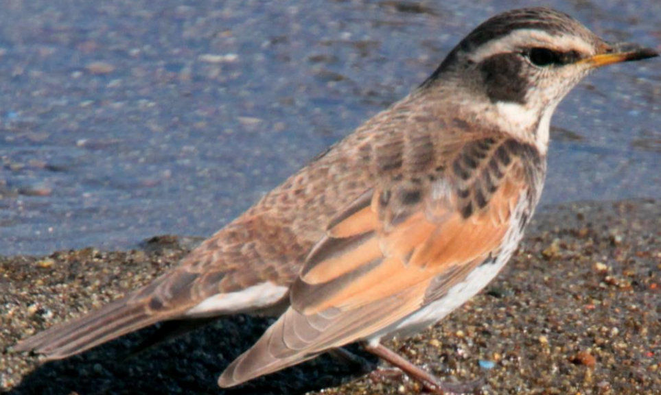
ツグミ (鶉) ヒタキ科 L=24cm