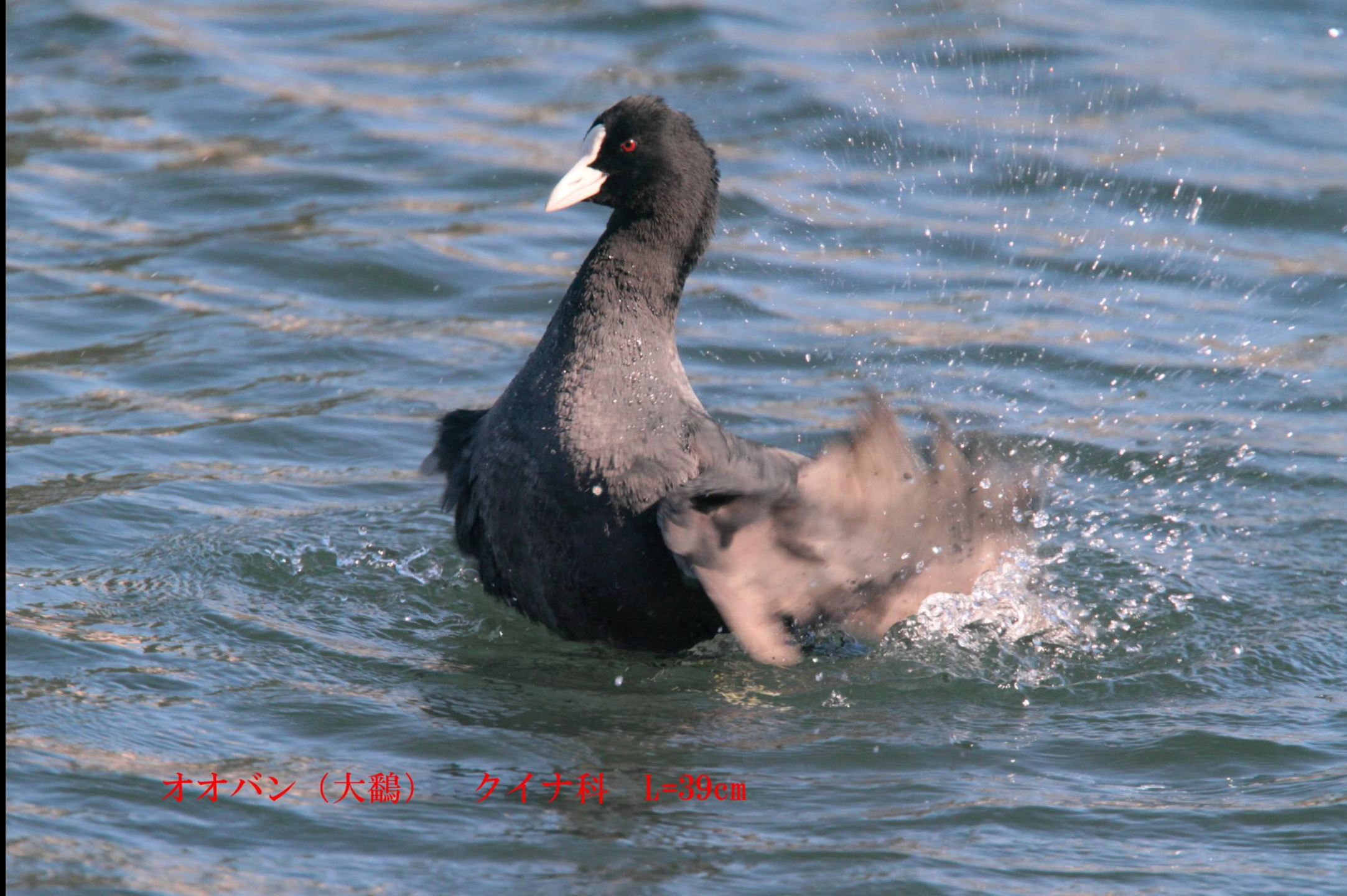
オオバン (大鵜) タイナ科 L=39cm