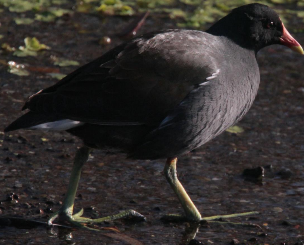
バン（鵜） クイナ科 L=32cm