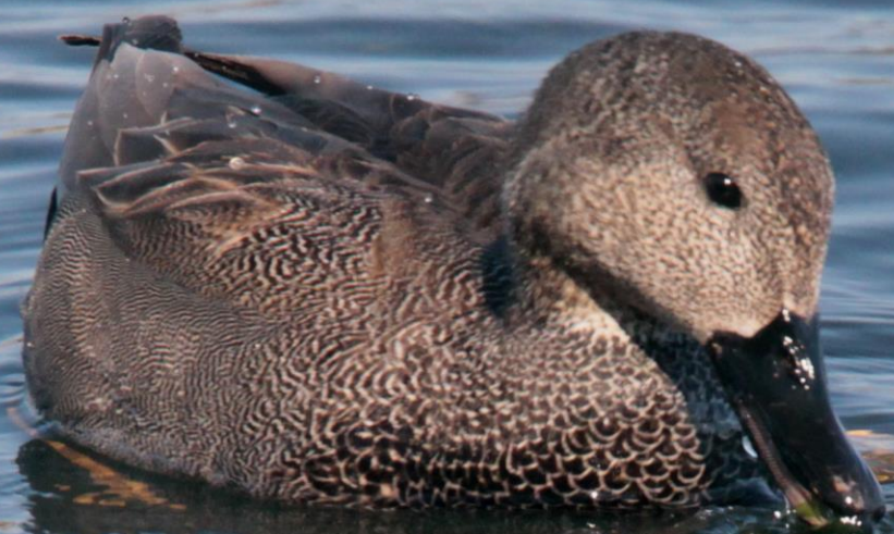
オカヨシガモ（丘葦鴨）オス ガンカモ科 L=50cm