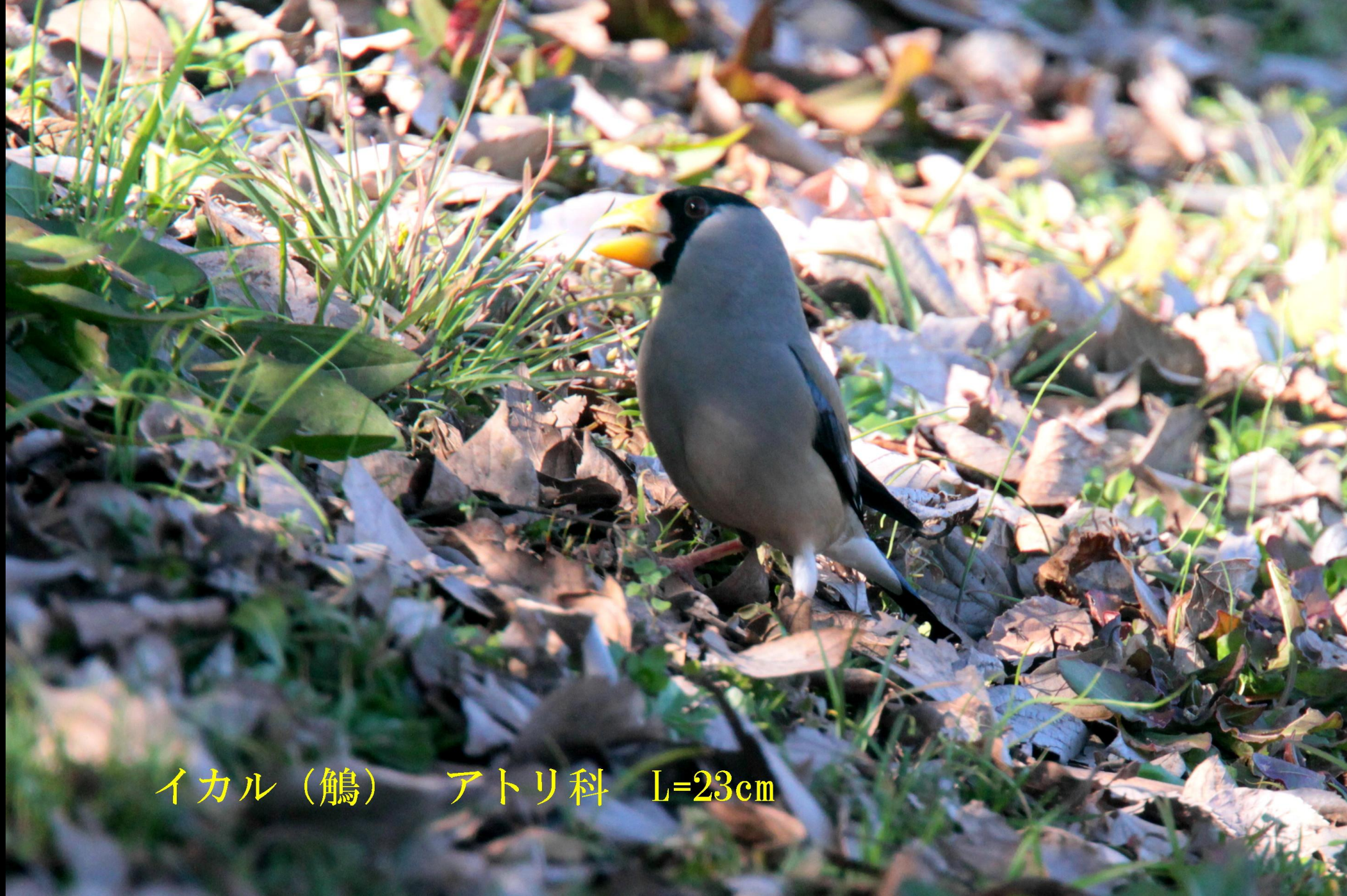
イカル（鶇） アトリ科 L=23cm