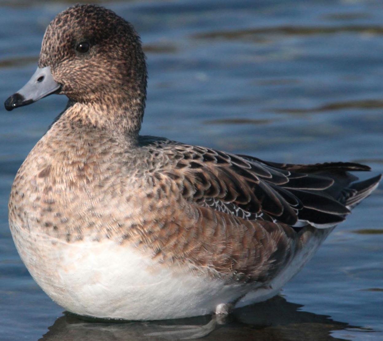
ヒドリガモ (緋鳥鴨) メス ガンカモ科 L=49cm