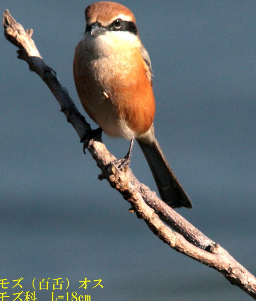
モズ（百舌）オス モズ科 L=18cm