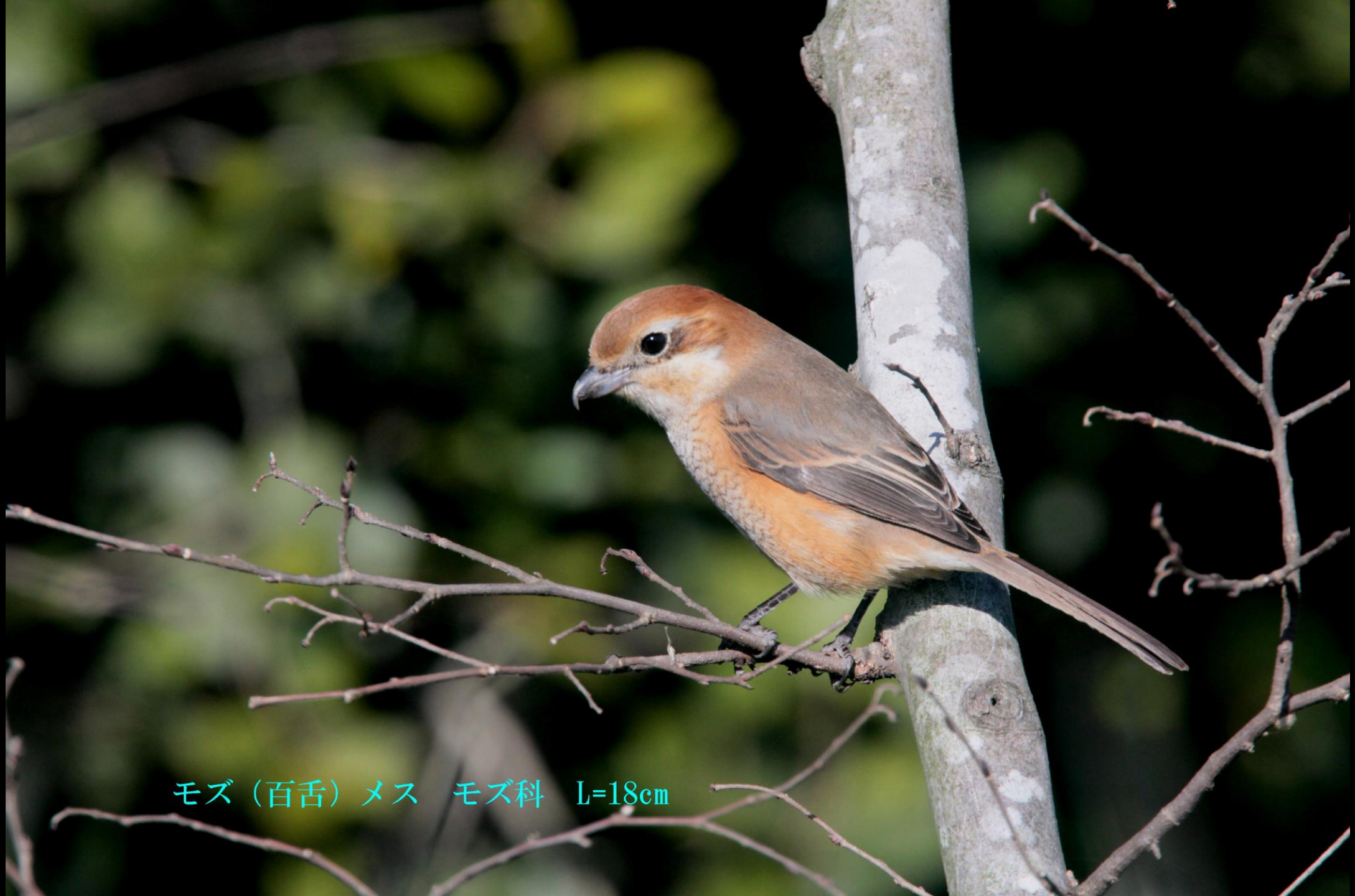
モズ (百舌) メス モズ科 L=18cm