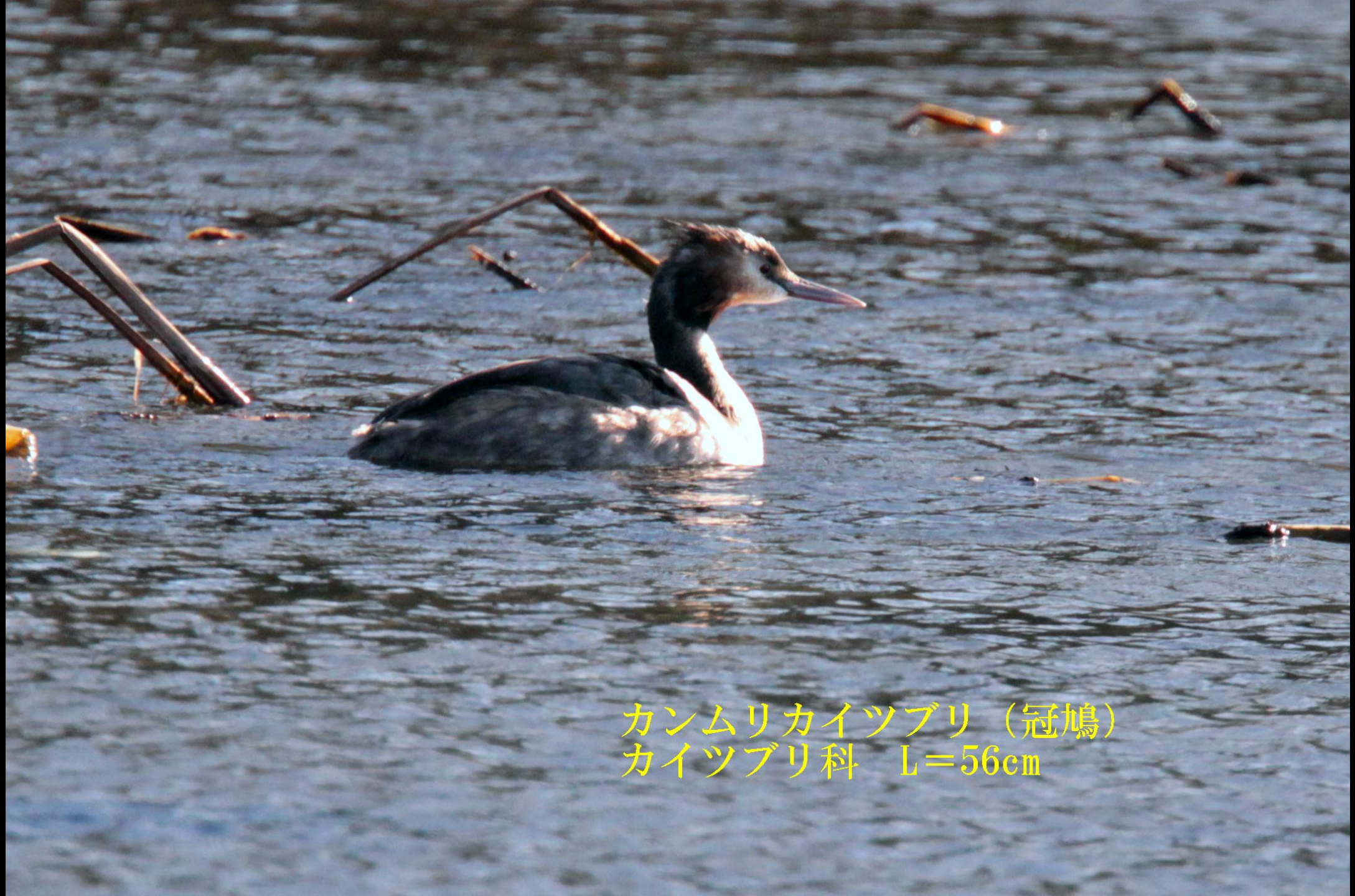
カンムリカイツブリ (冠鳩) カイツブリ科 L=56cm