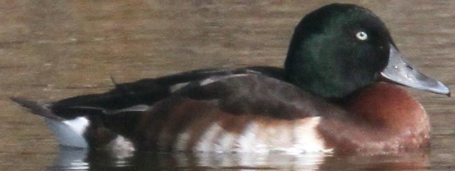
アカハジロ (赤羽白) オス ガンカモ科 L=45cm