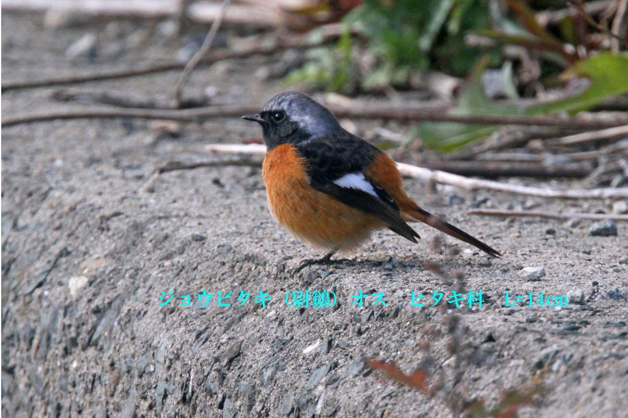
ジョウビタキ (尉鶺) オス ヒタキ科 L=14cm