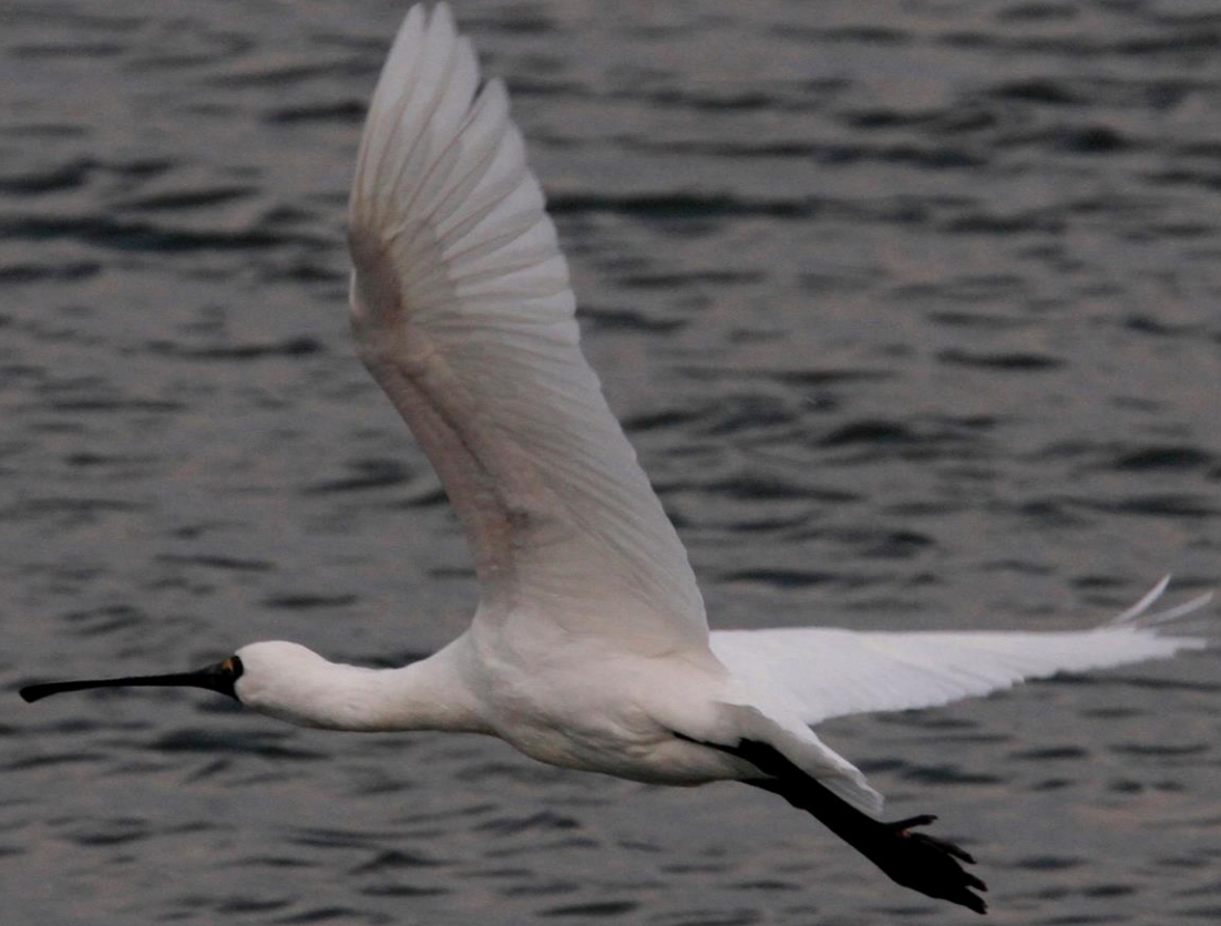
クロツラヘラサギ (黒面篋鷺) トキ科 L=77cm