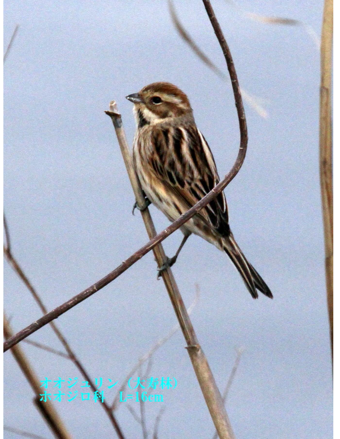
オオジュリン (大寿林) ホオジロ科 L=16cm