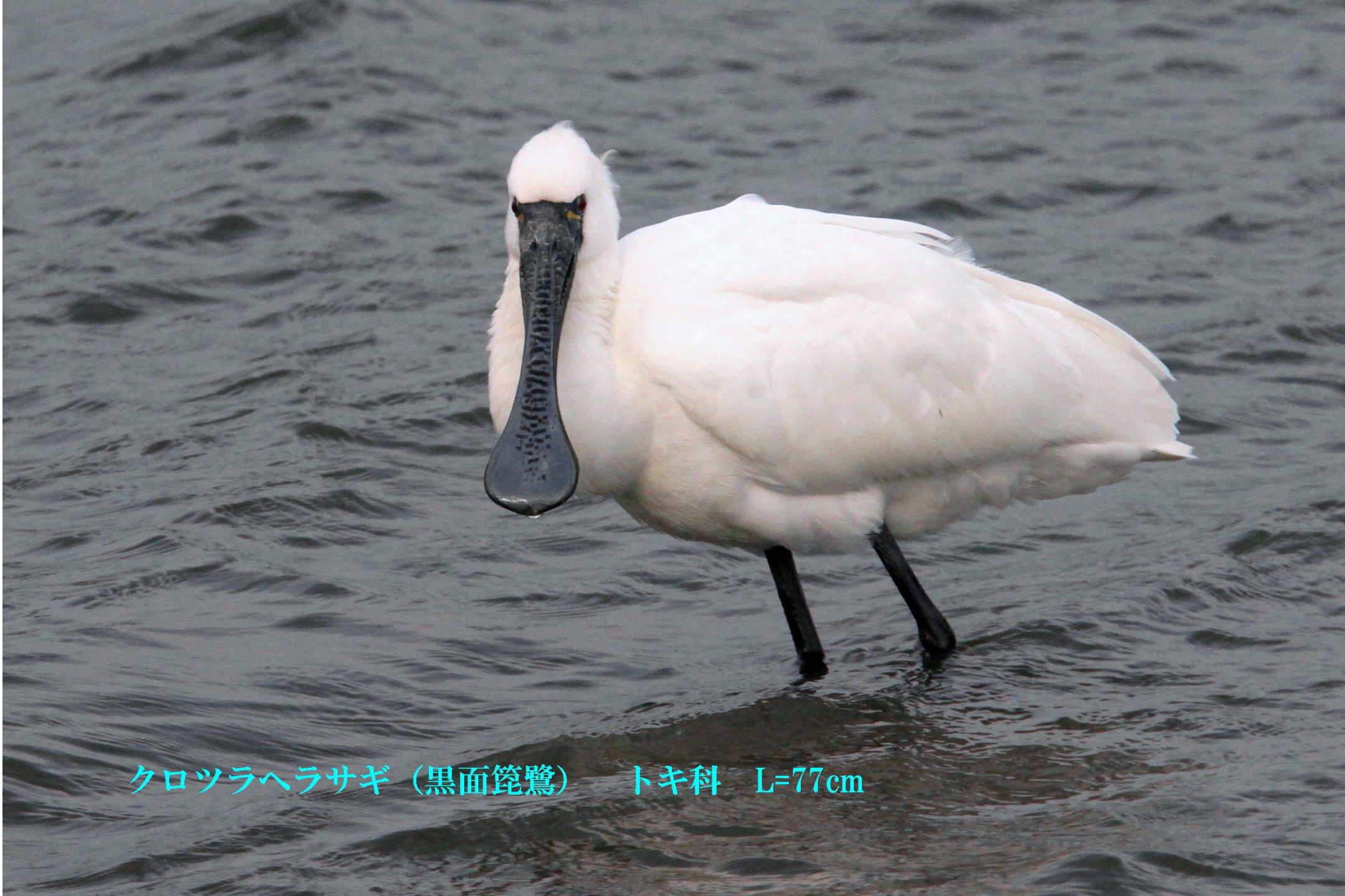
クロツラヘラサギ (黒面篋鷺) トキ科 L=77cm