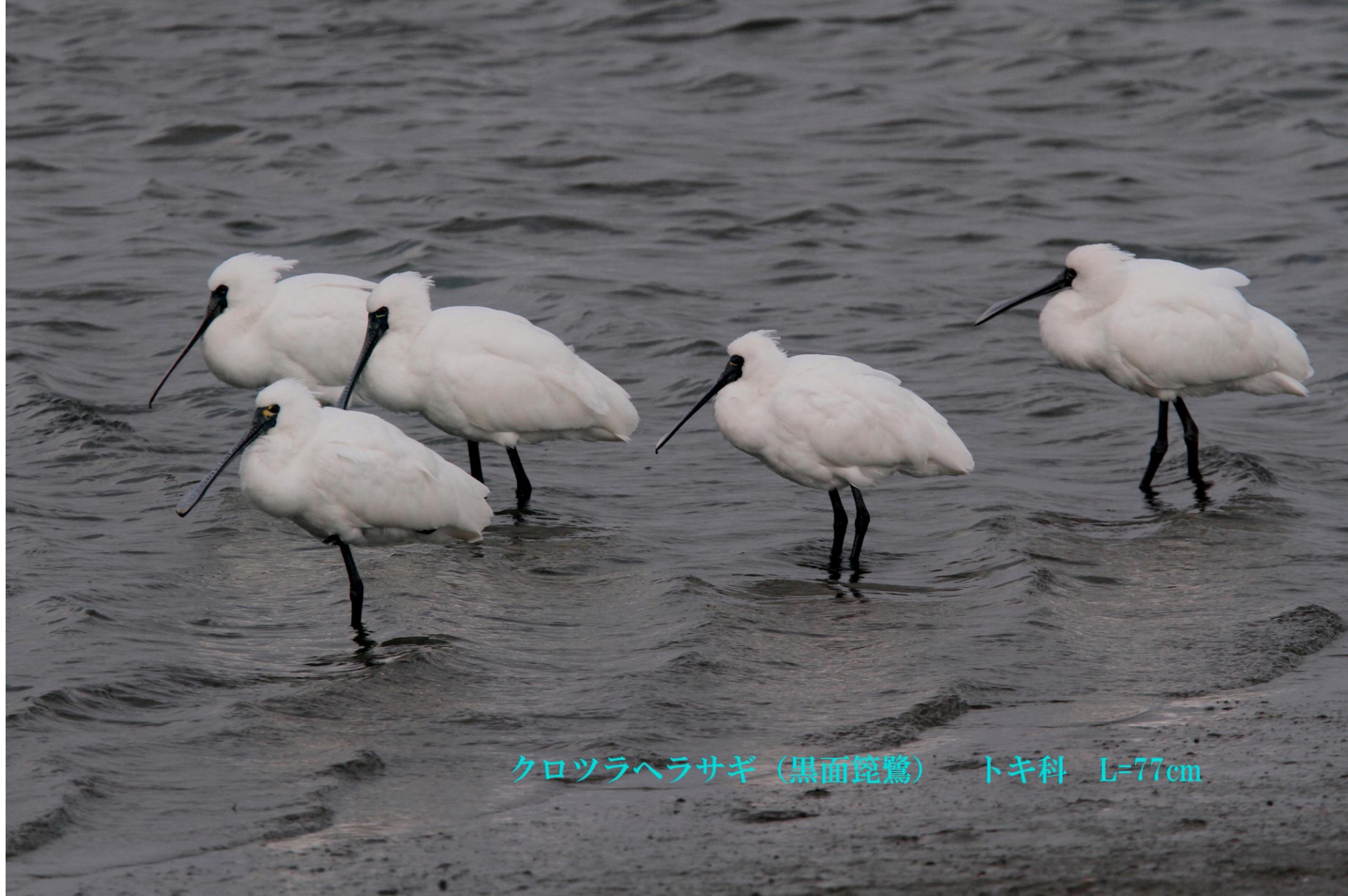
クロツラヘラサギ (黒面篋鷺) トキ科 L=77cm