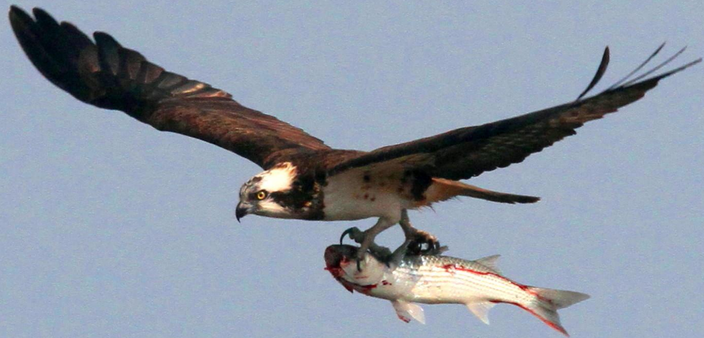
ミサゴ (鵜) ワシタカ科 L=メス64cm