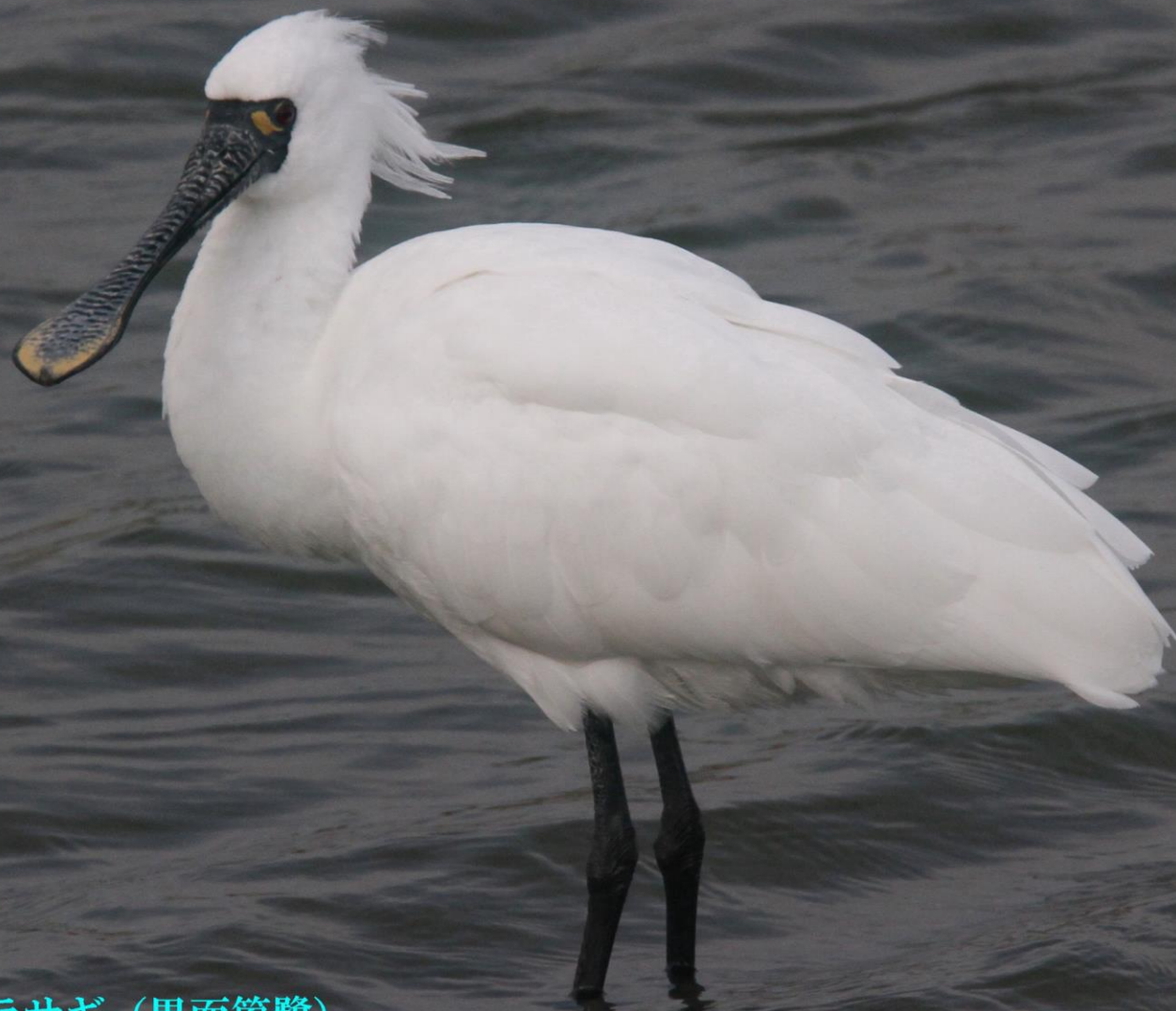
クロツラヘラサギ (黒面篋鷺) トキ科 L=77cm