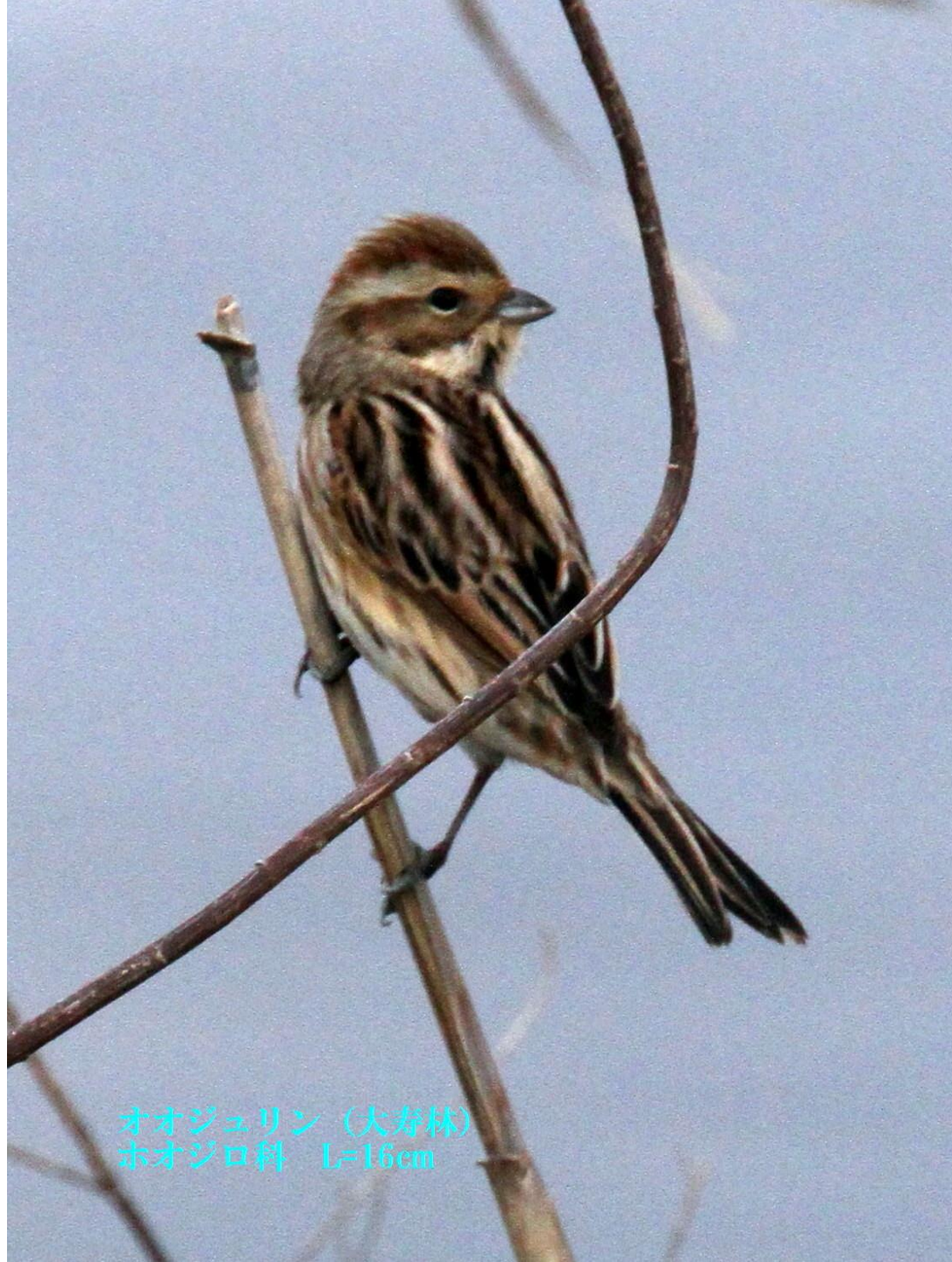
オオジュリン (大寿林) ホオジロ科 L=16cm