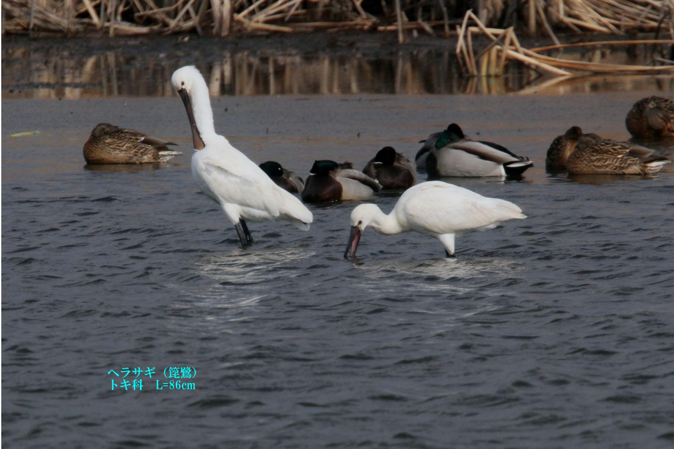
ヘラサギ (鏡鷺) トキ科 L=86cm