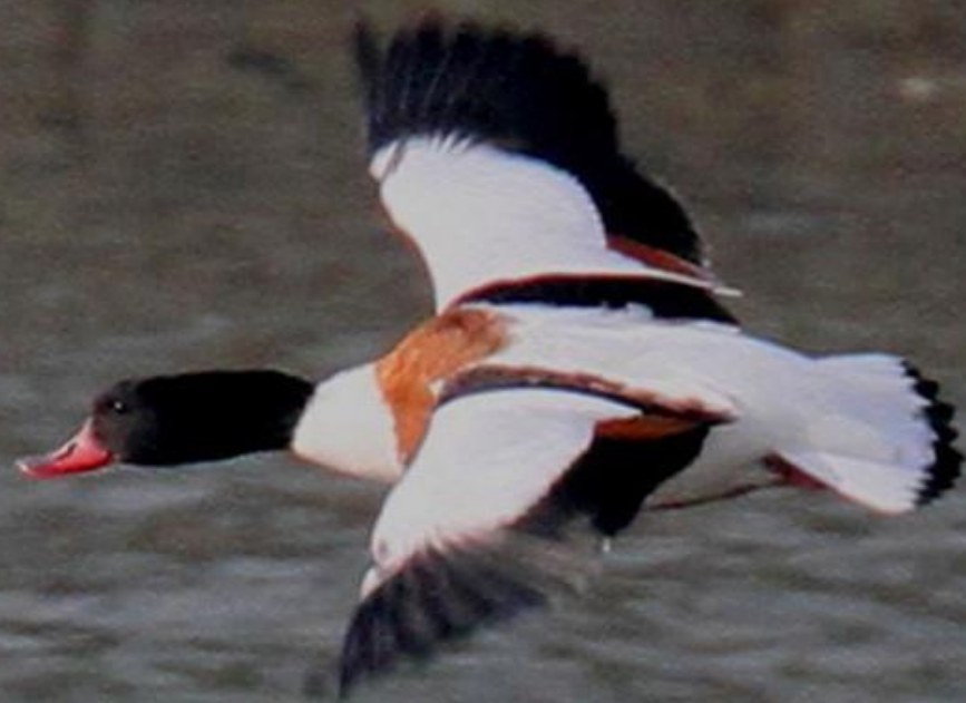
ツクシガモ (筑紫鴨) ガンカモ科 L=63cm