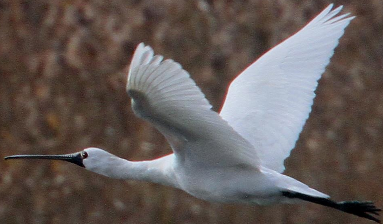
クロツラヘラサギ (黒面篋鷺) トキ科 L=77cm