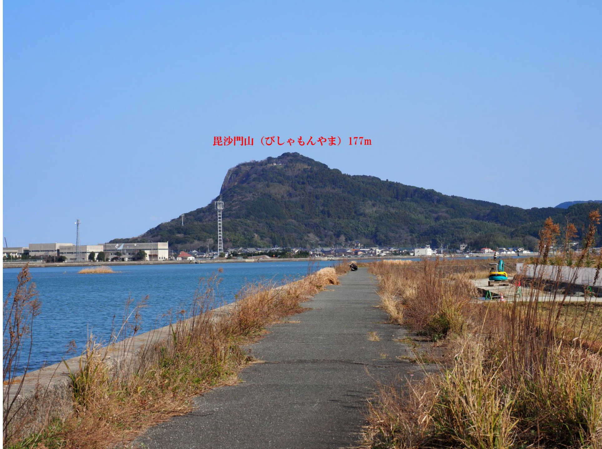
昆沙門山 (びしゃもんやま) 177m