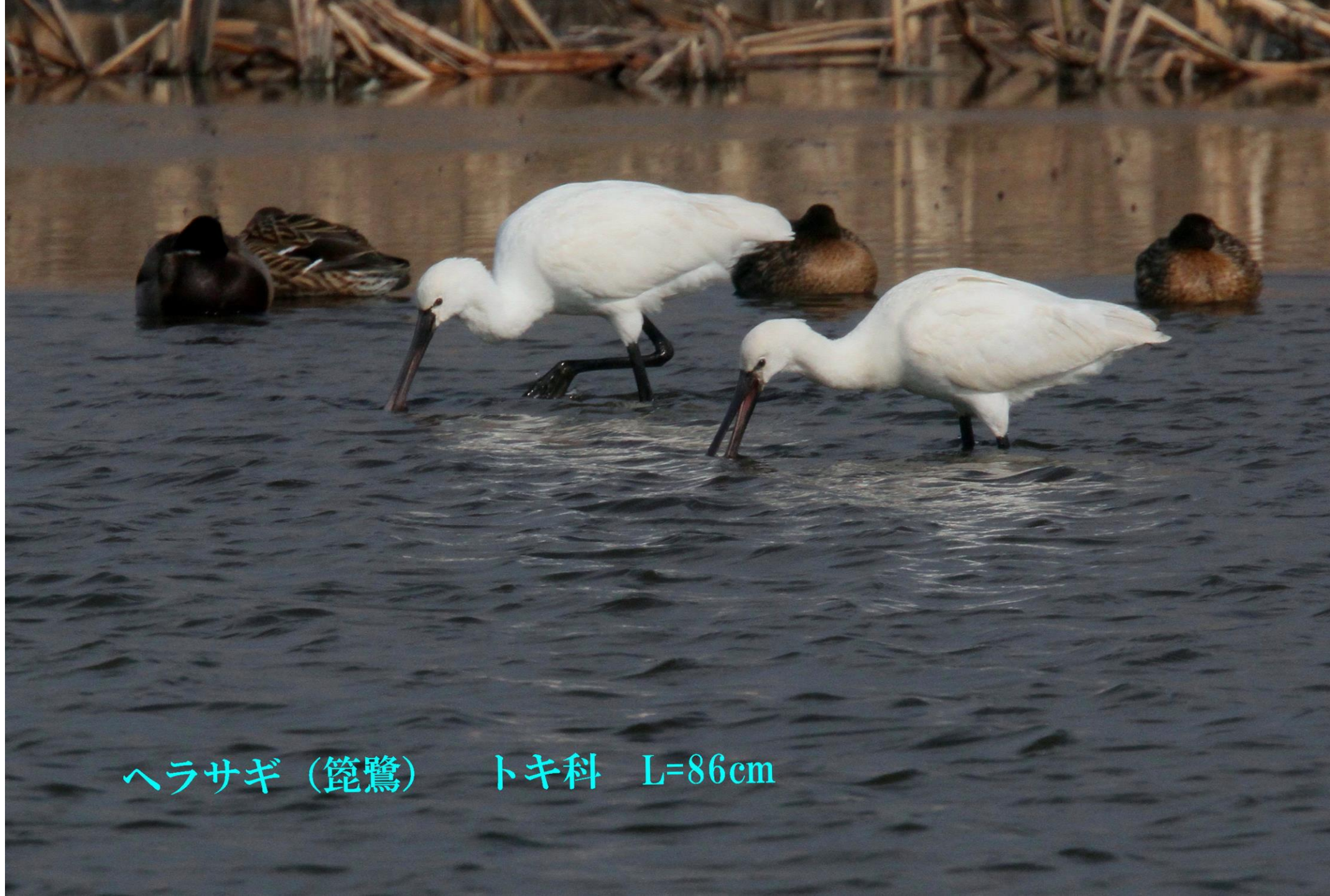
ヘラサギ (篋鷺) トキ科 L=86cm