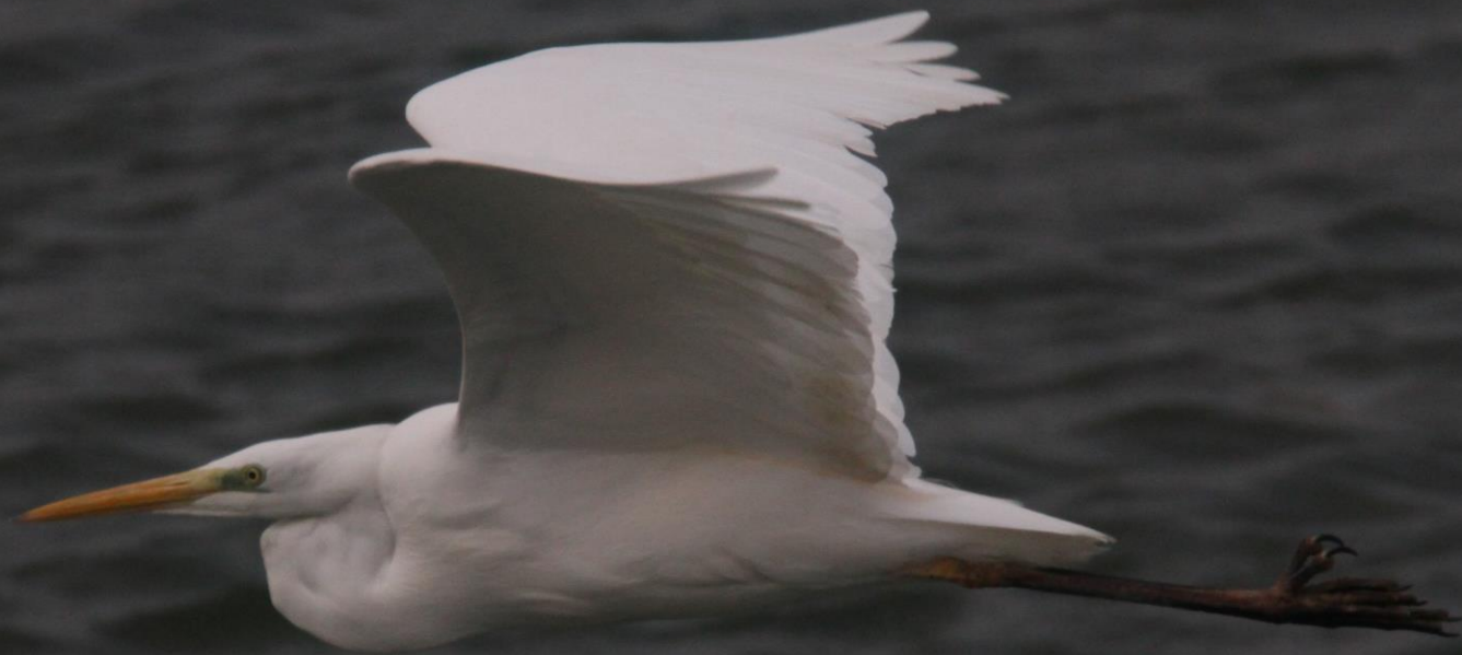
ダイサギ (大鷺) サギ科 L=90cm