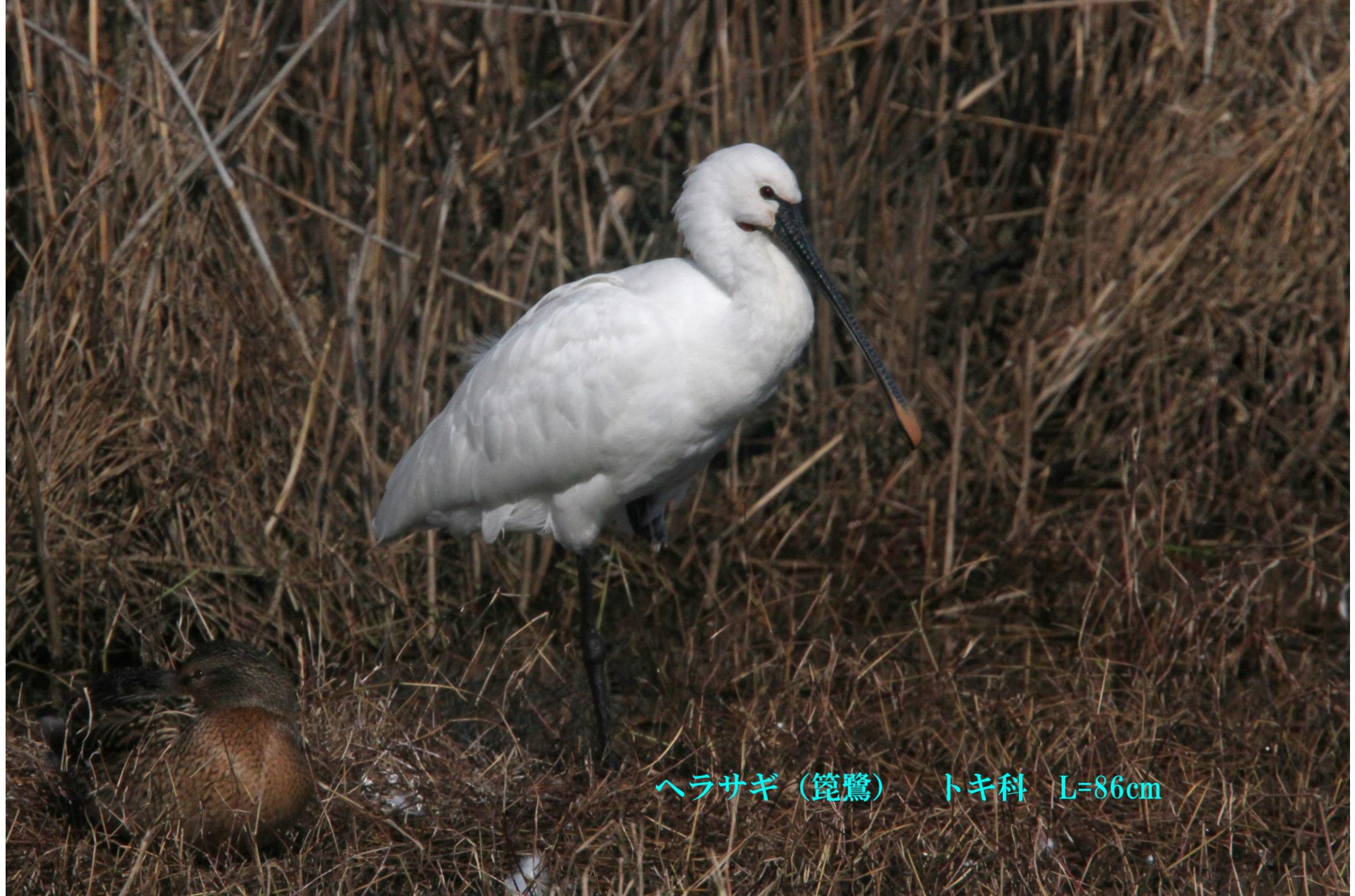
ヘラサギ (篋鷺) トキ科 L=86cm