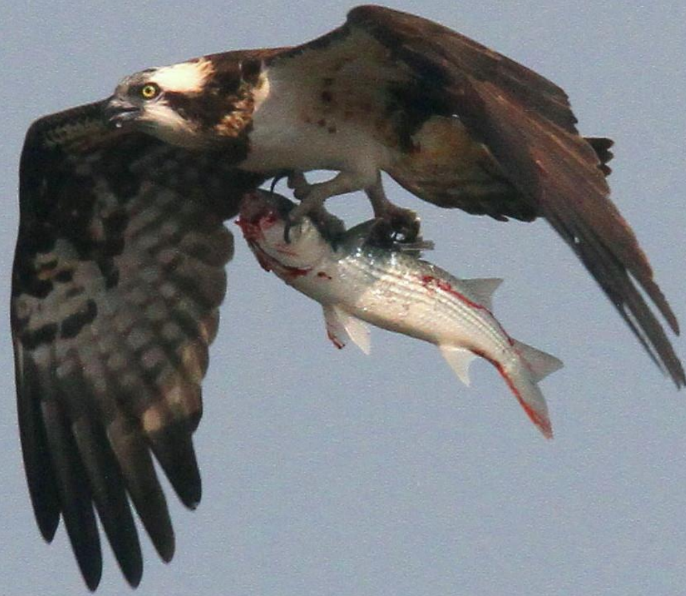
ミサゴ (鵟) ワシタカ科 L=メス64cm