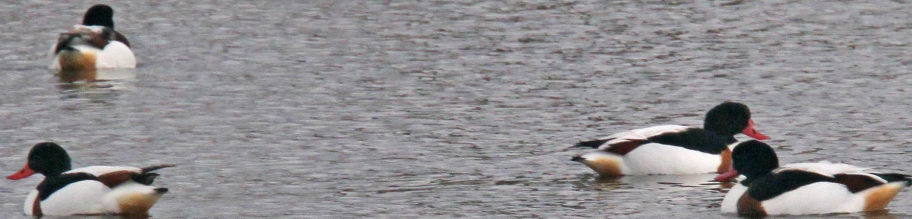
ツクシガモ（筑紫鴨） ガンカモ科 L=63cm