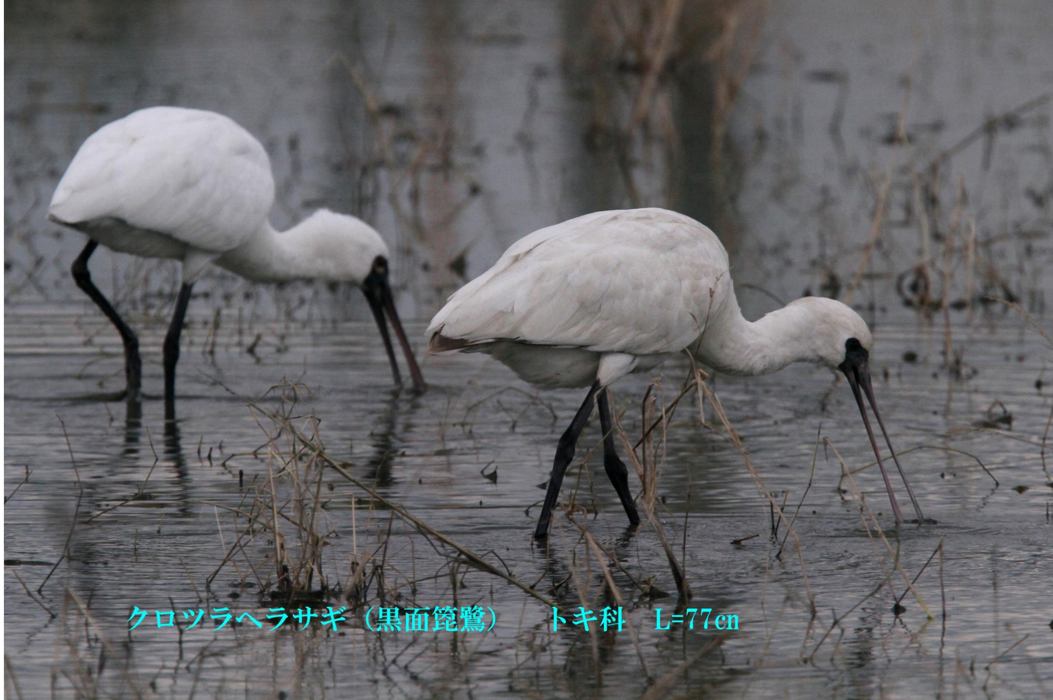
クロツラヘラサギ (黒面篋鷺) トキ科 L=77cm