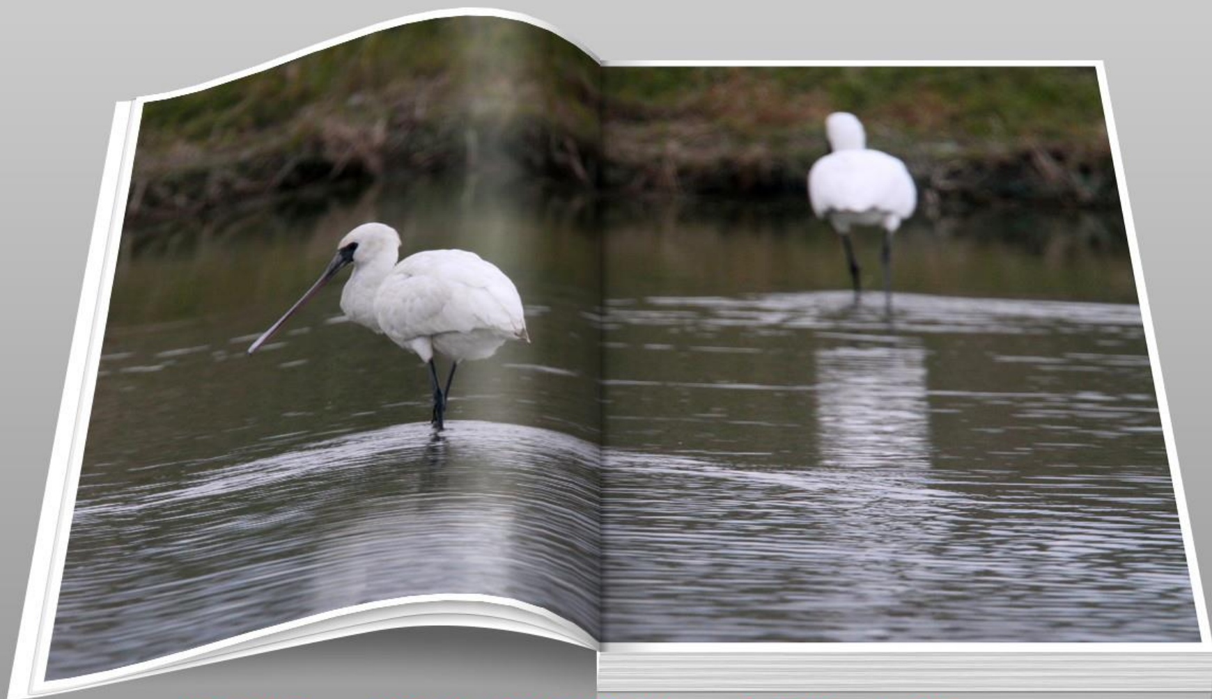
クロツラヘラサギ (黒面篋鷺) トキ科 L=77cm