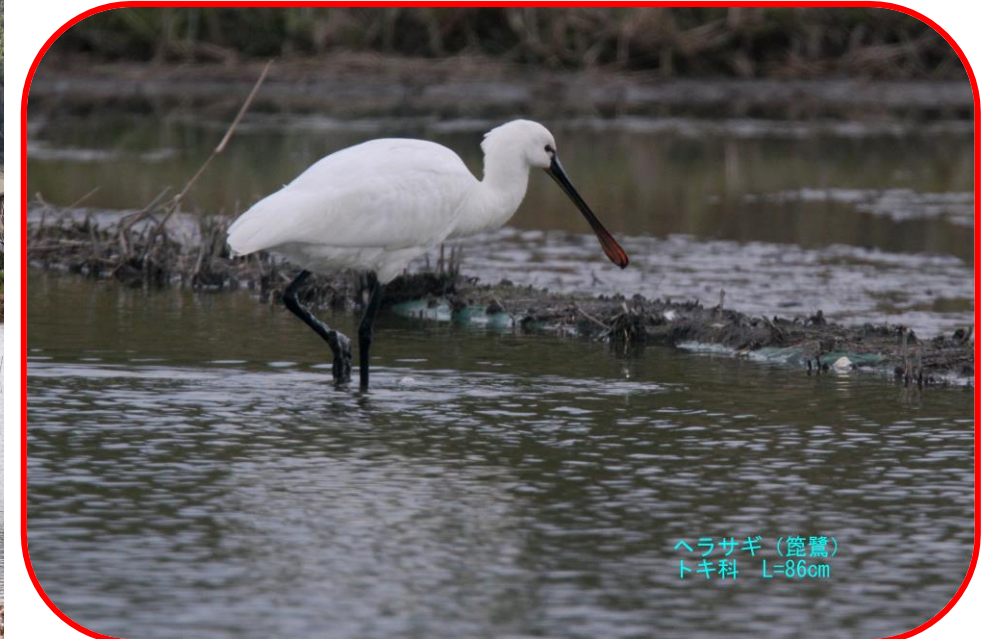
ヘラサギ（篋鷺） トキ科 L=86cm