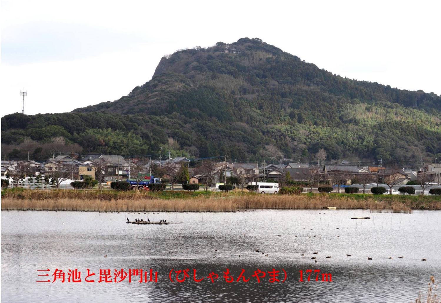
三角池と毘沙門山（びしゃもんやま）177m