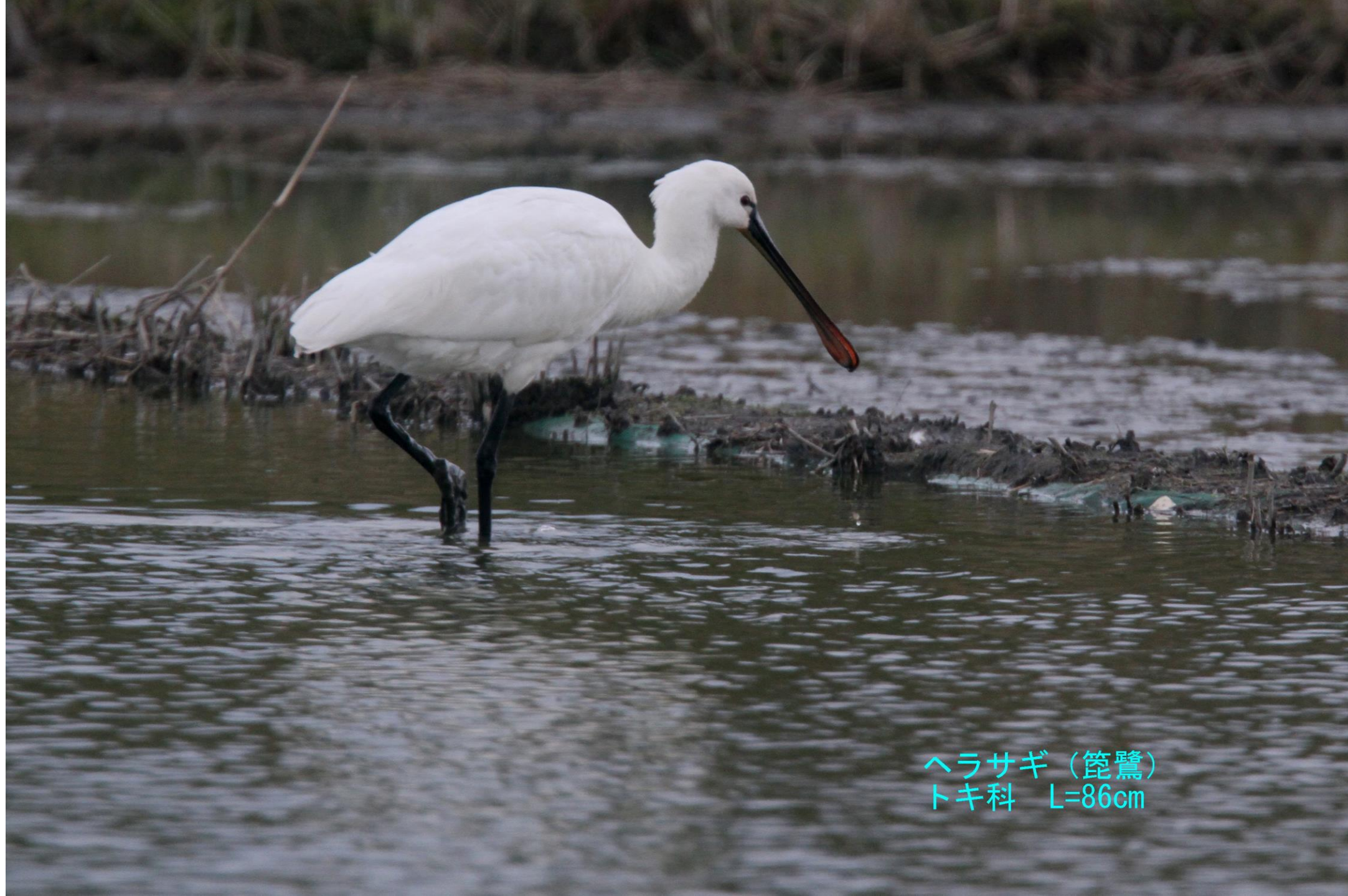
ヘラサギ (篋鷺) トキ科 L=86cm