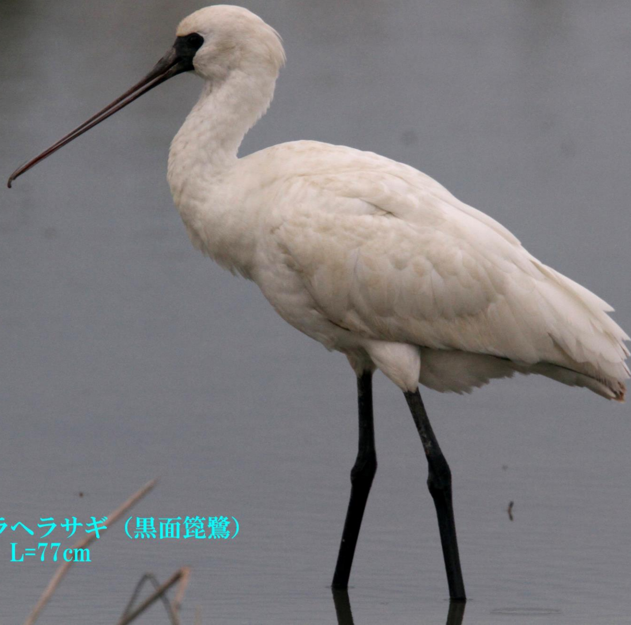
クロツラヘラサギ (黒面篋鷺) トキ科 L=77cm