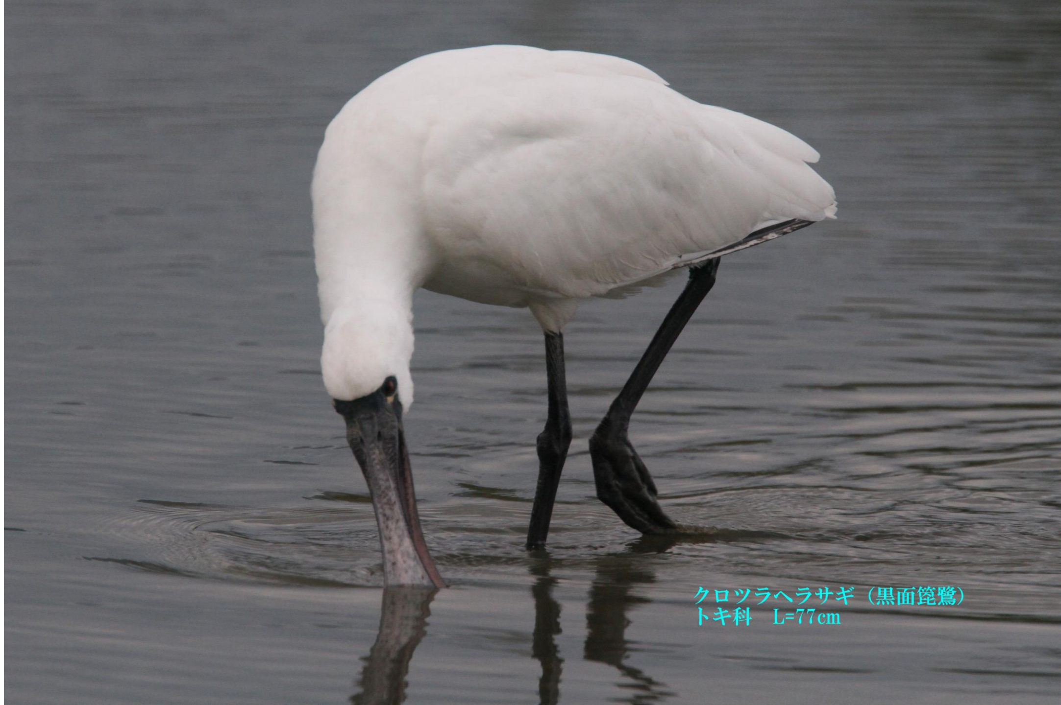
クロツラヘラサギ（黒面鏡鷺） トキ科 L=77cm