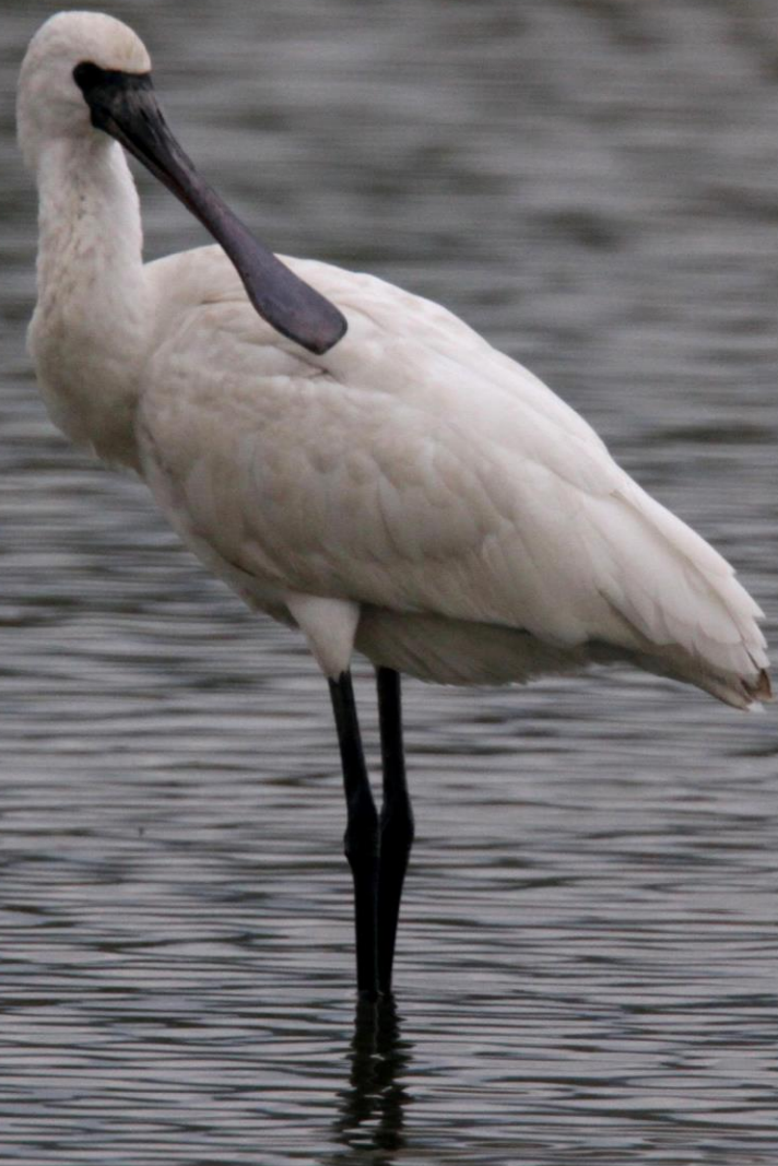
クロツラヘラサギ（黒面篋鷺） トキ科 L=77cm