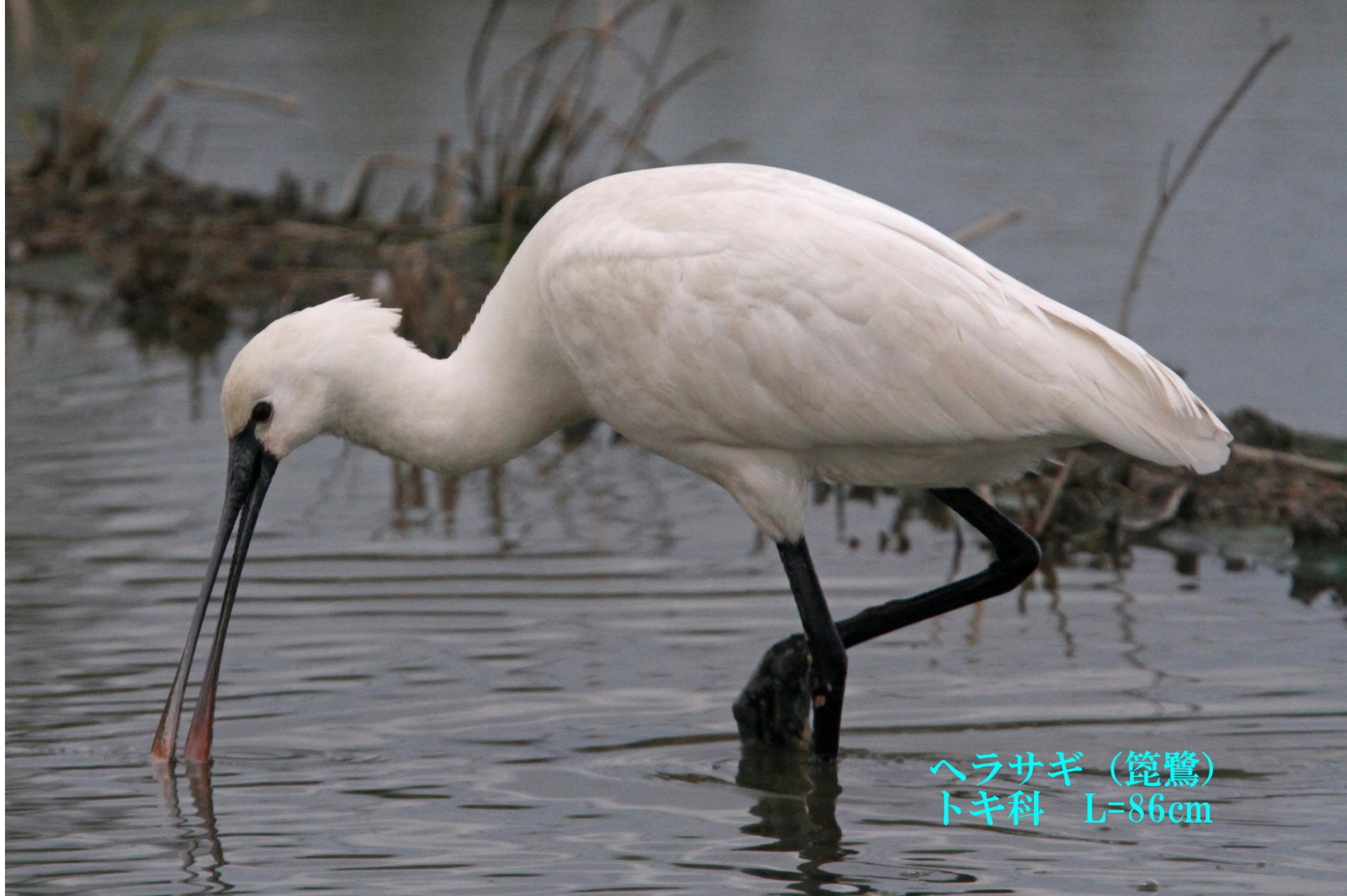
ヘラサギ (篋鷺) トキ科 L=86cm