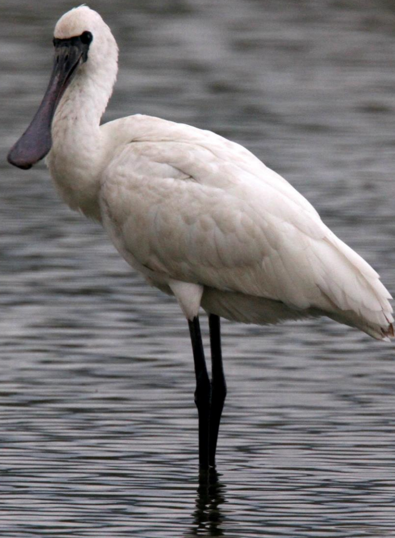
クロツラヘラサギ（黒面篋鷺） トキ科 L=77cm