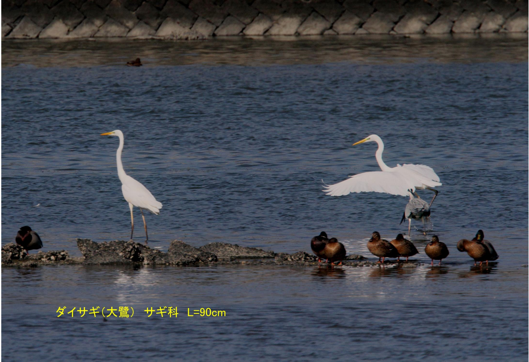
ダイサギ(大鷺) サギ科 L=90cm