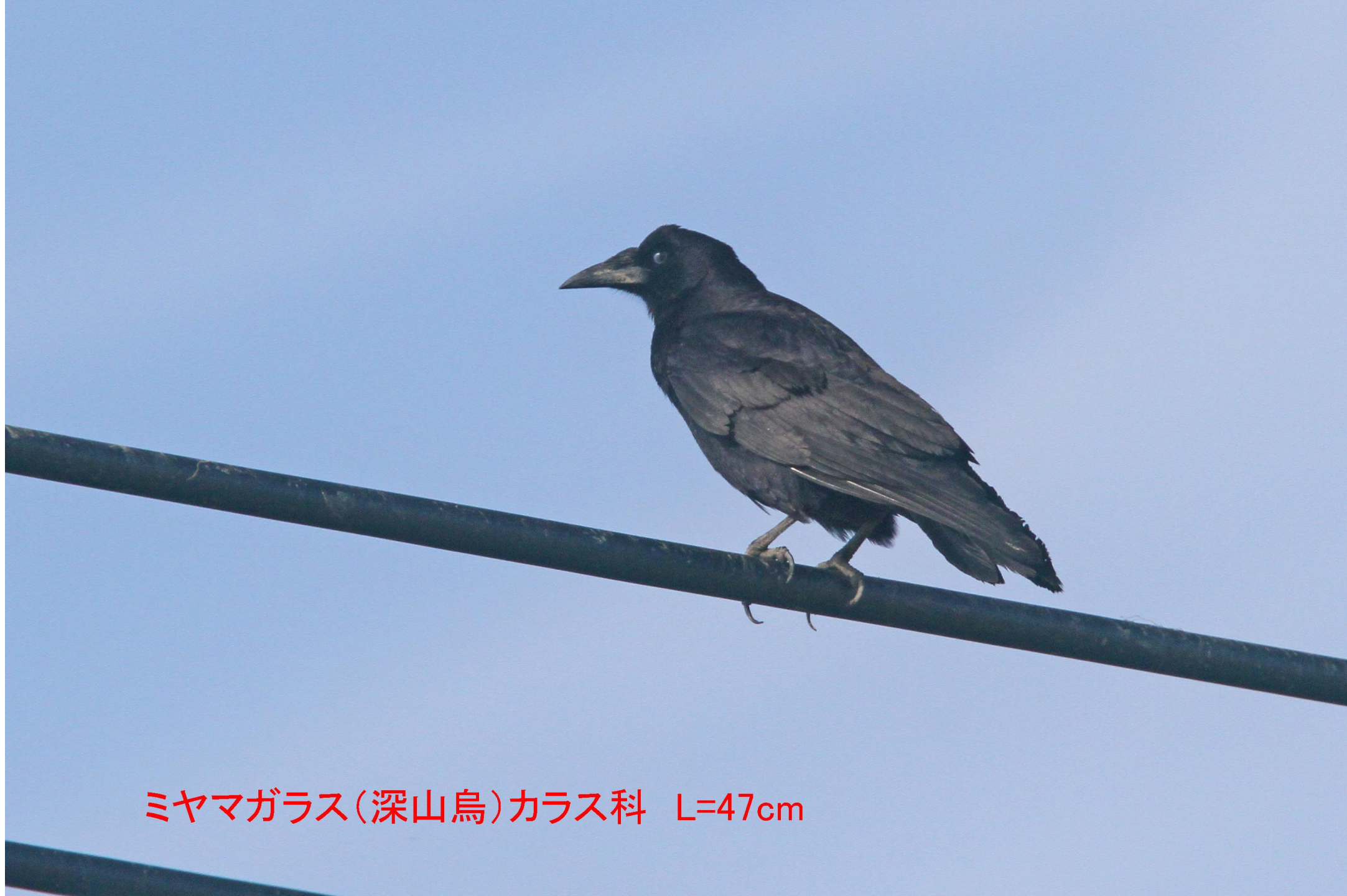
ミヤマガラス(深山鳥)カラス科 L=47cm