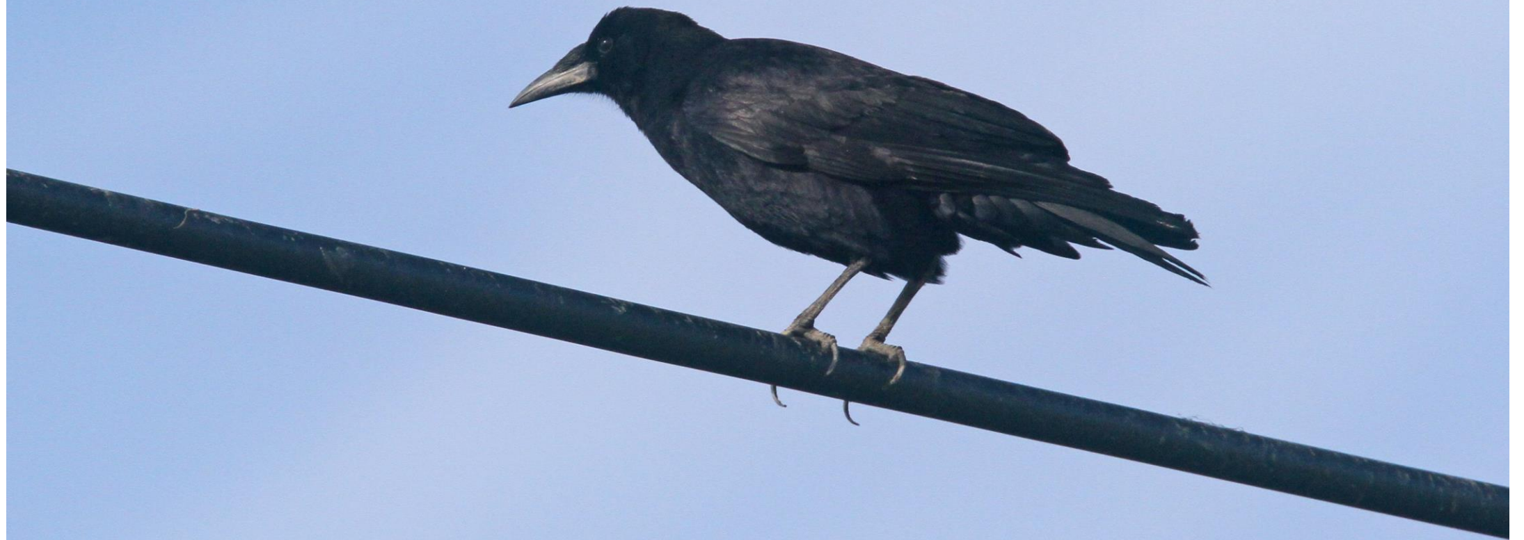
ミヤマガラス(深山鳥)カラス科 L=47cm