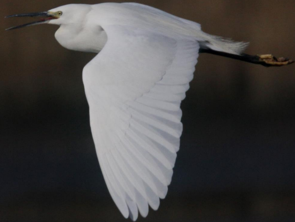
コサギ(小鷺) サギ科 L=61cm