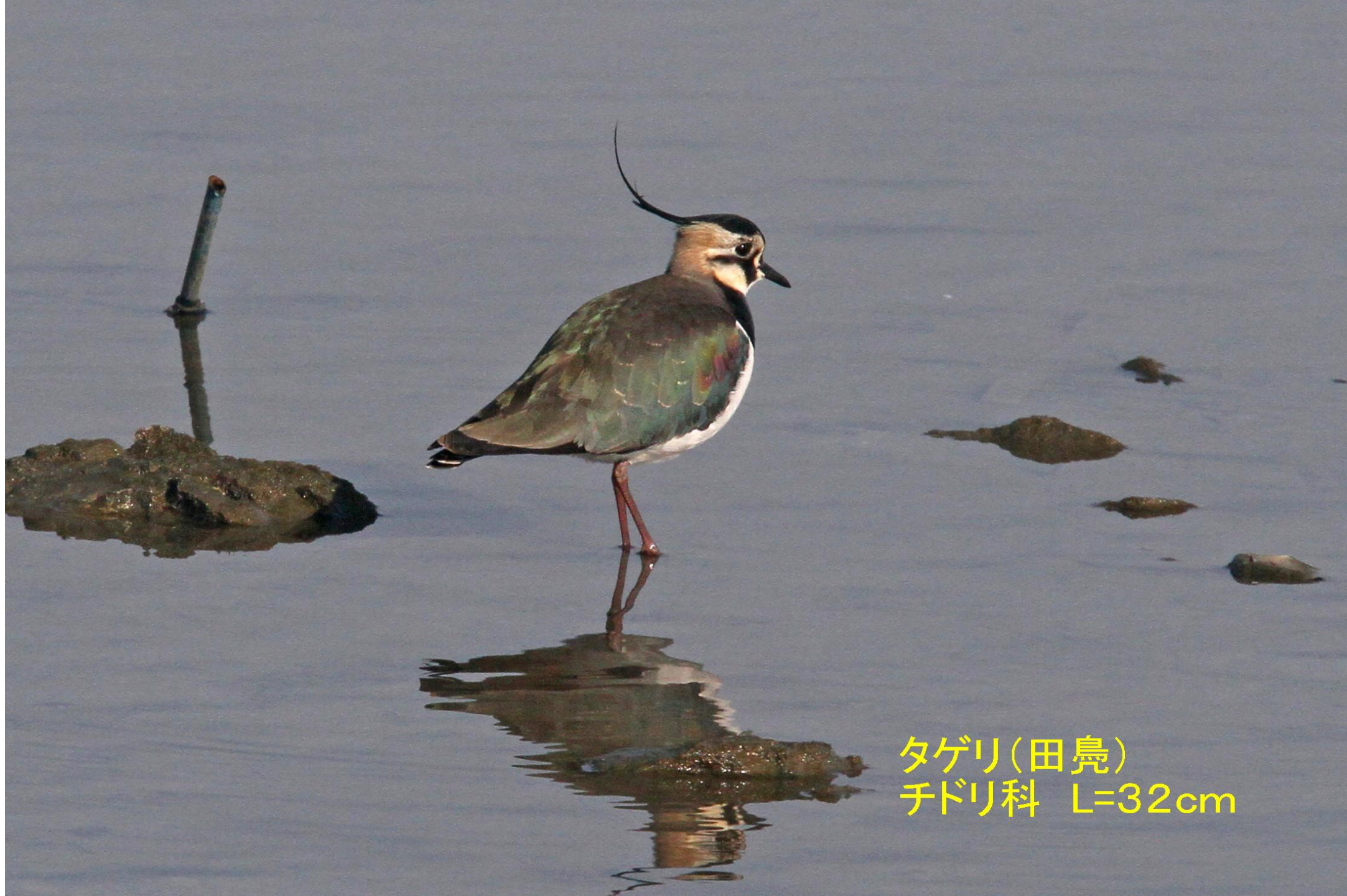
タゲリ(田鳧) チドリ科 L=32cm