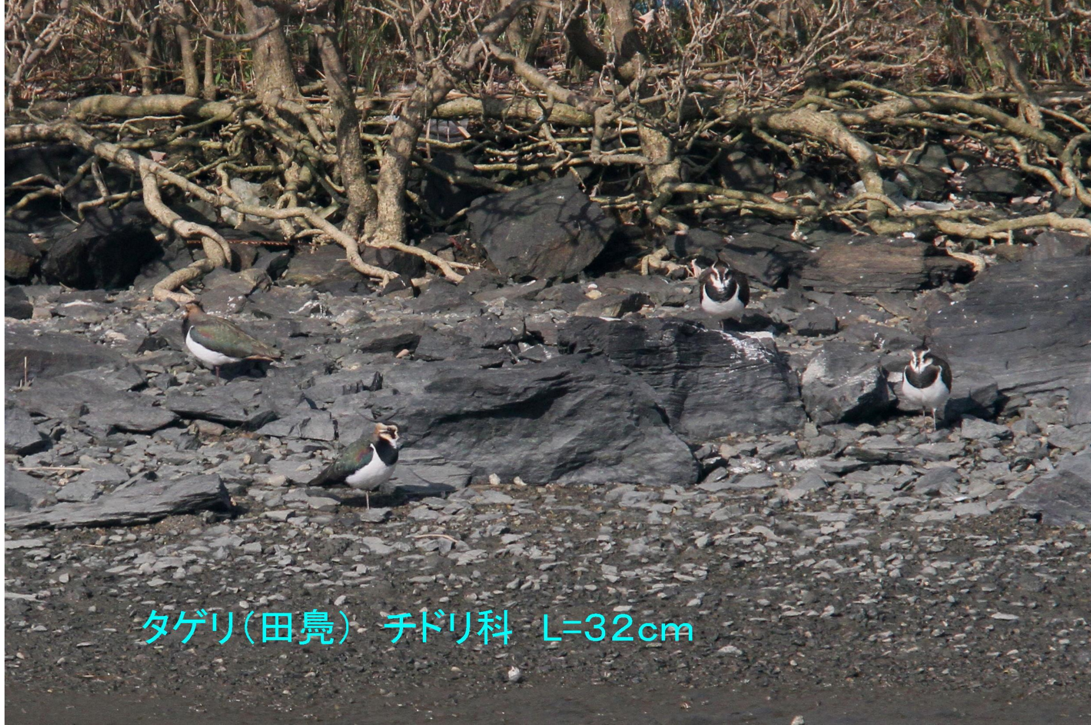
タゲリ(田鳧) チドリ科 L=32cm