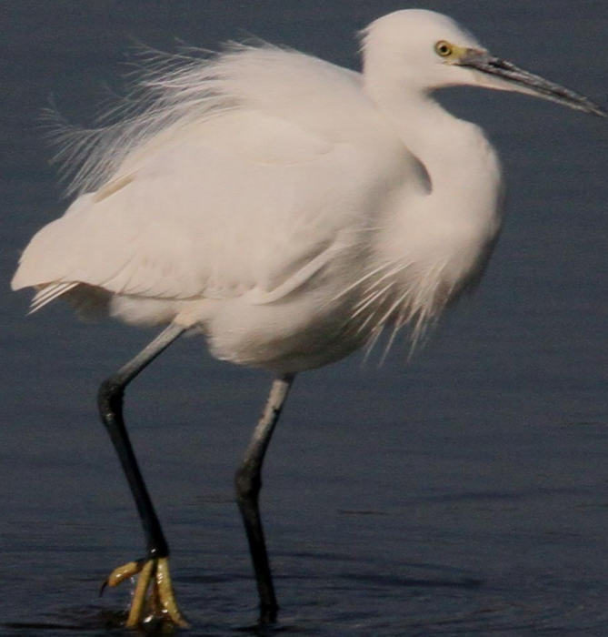
コサギ(小鷺) サギ科 L=61cm