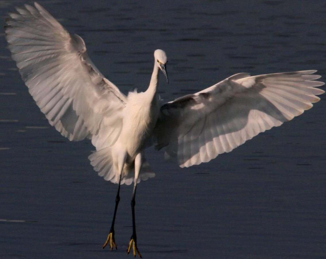
コサギ(小鷺) サギ科 L=61cm