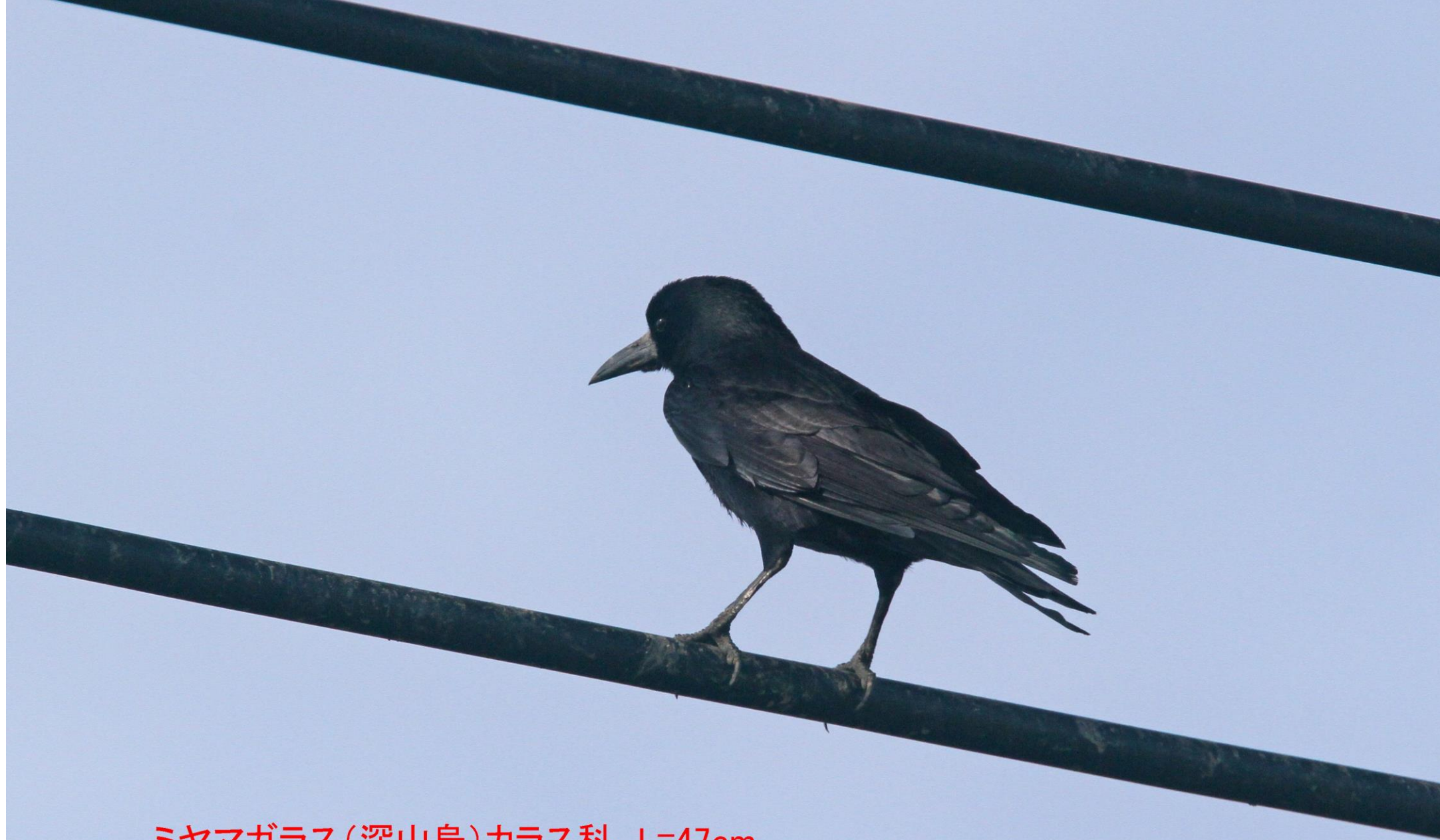
ミヤマガラス(深山鳥)カラス科 L=47cm