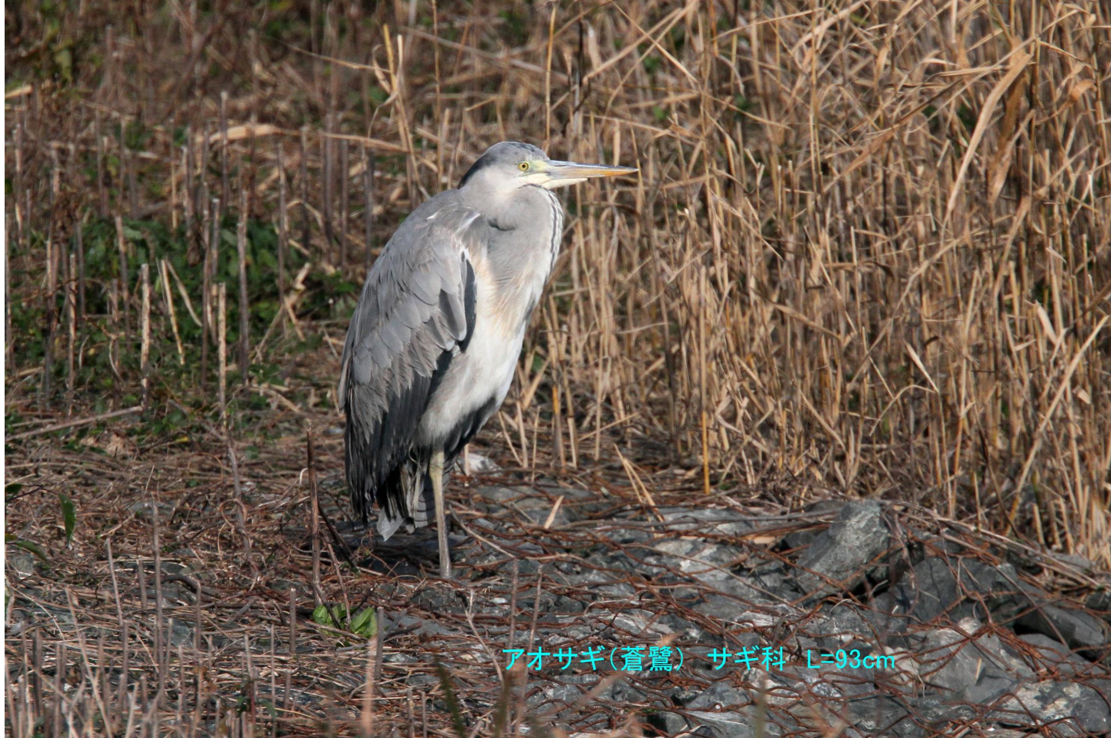
アオサギ(蒼鷺) サギ科 L=93cm