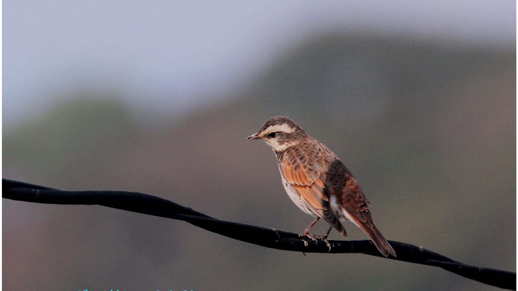
ツグミ(鶇) ヒタキ科 L=24cm