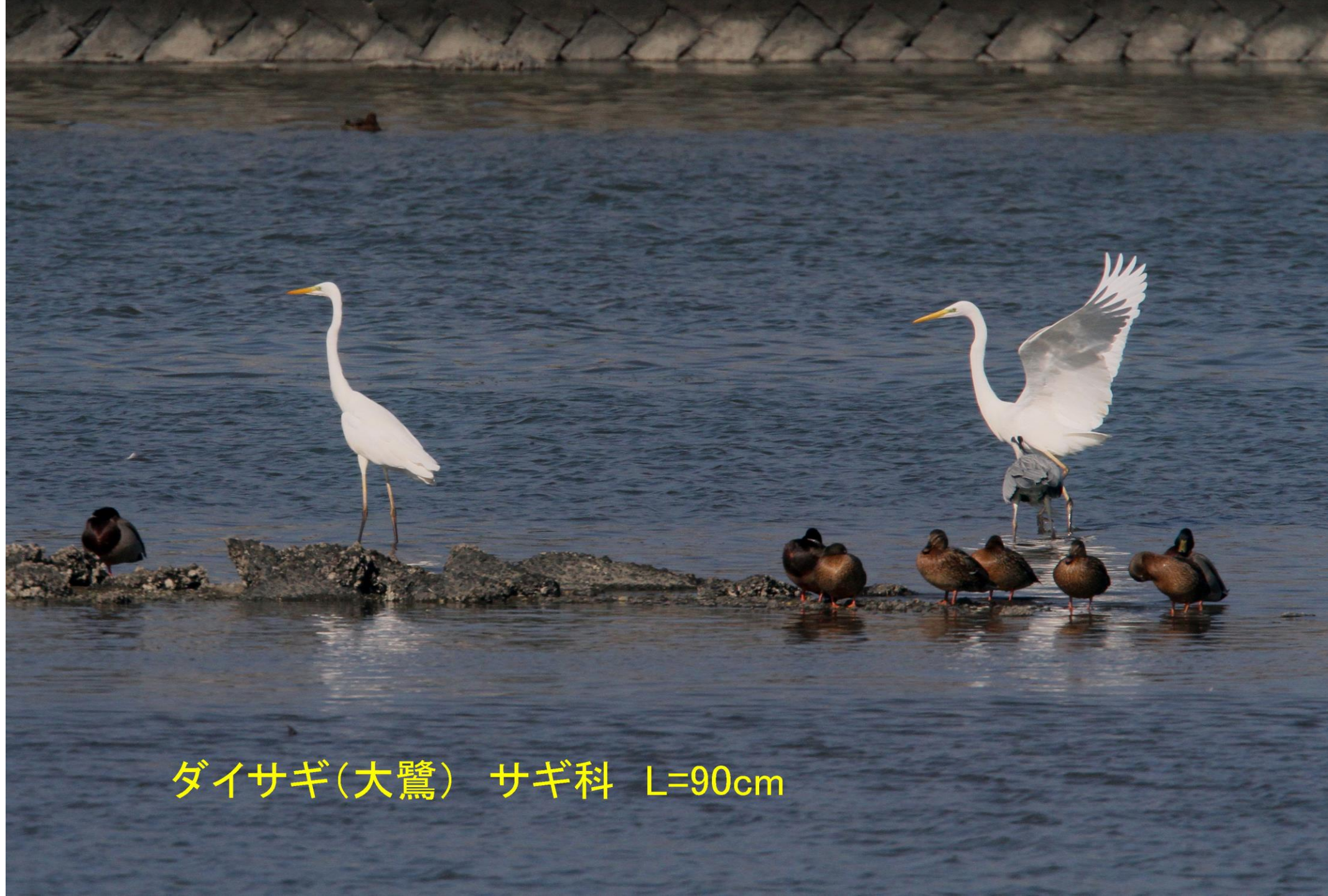
ダイサギ(大鷺) サギ科 L=90cm