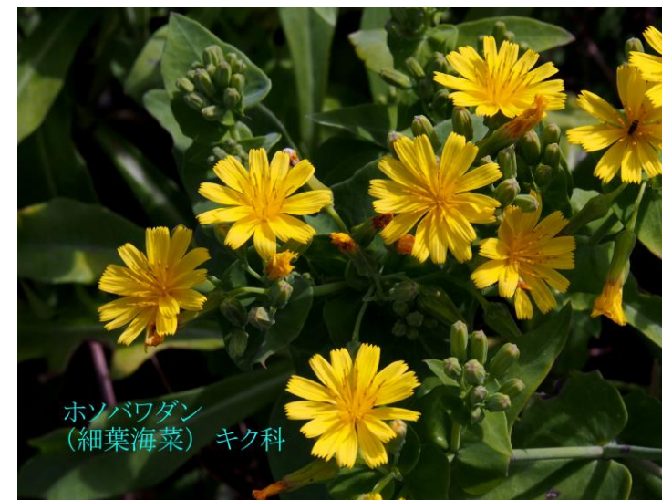
ホソバワダン (細葉海菜) キク科