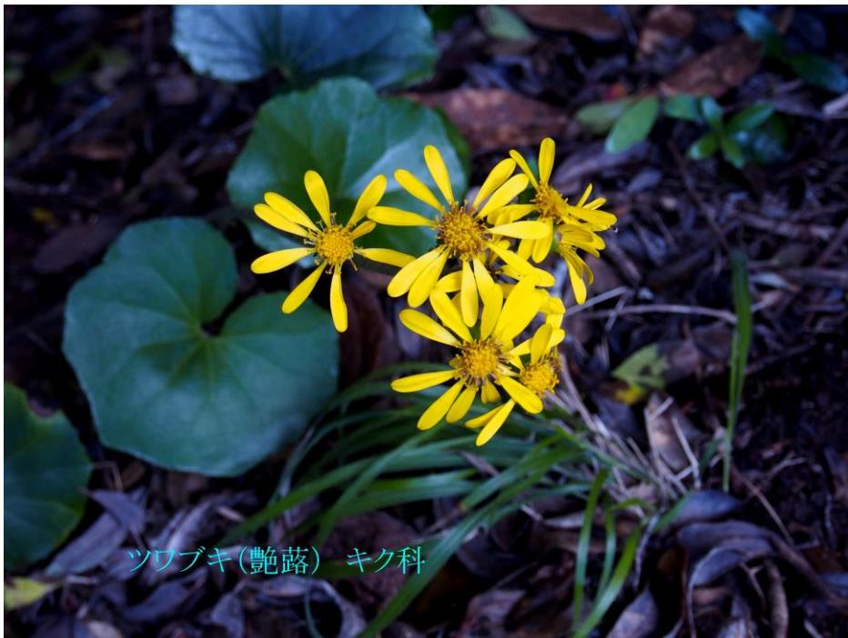
ツワブキ(艶蔀) キク科