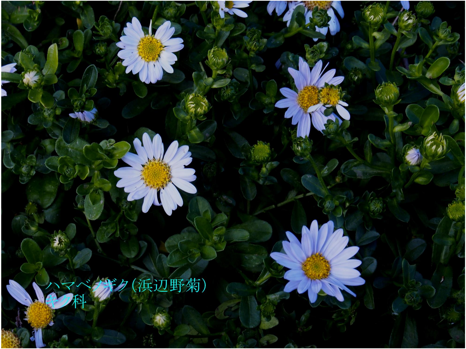
ハマベノギク(浜辺野菊) キク科