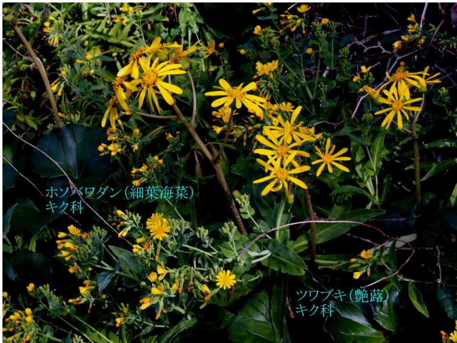
ホソバワダン(細葉海菜) キク科