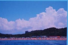
芥屋海水浴場 Kaya Bathing Beach