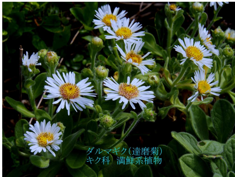
ダルマギク(達磨菊) キク科 満鮮系植物