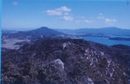
立石山からの展望 View from Mt. Tateishiyama