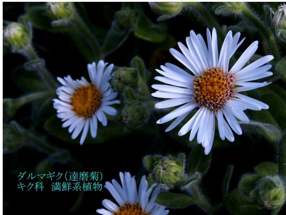
ダルマギク(達磨菊) キク科 満鮮系植物