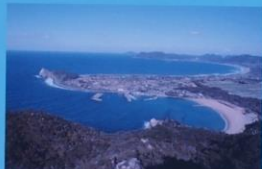
立石山からの展望 View from Mt. Tateishiyama