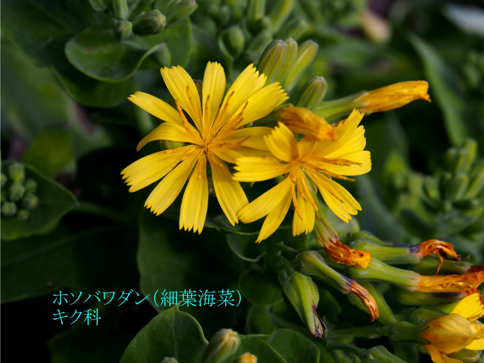
ホソバワダン(細葉海菜) キク科