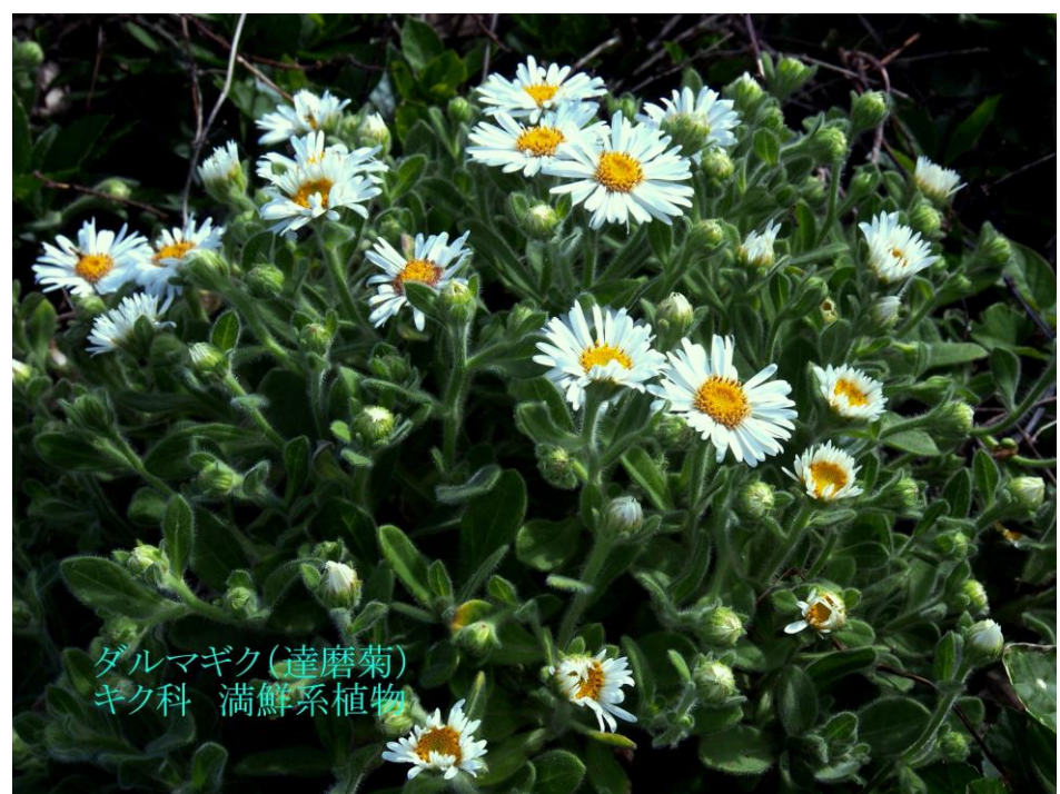
ダルマギク(達磨菊) キク科 満鮮系植物