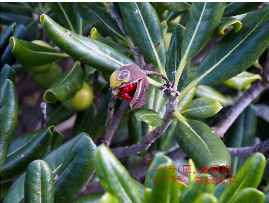
トベラ(扉、海桐花) トベラ科 常緑低木