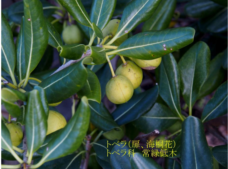
トベラ(扉、海桐花) トベラ科 常緑低木