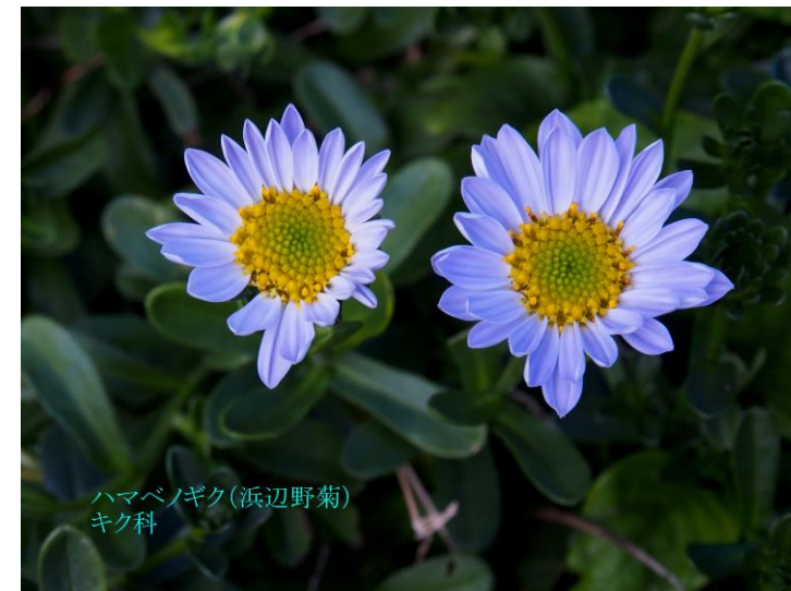
ハマベノギク(浜辺野菊) キク科