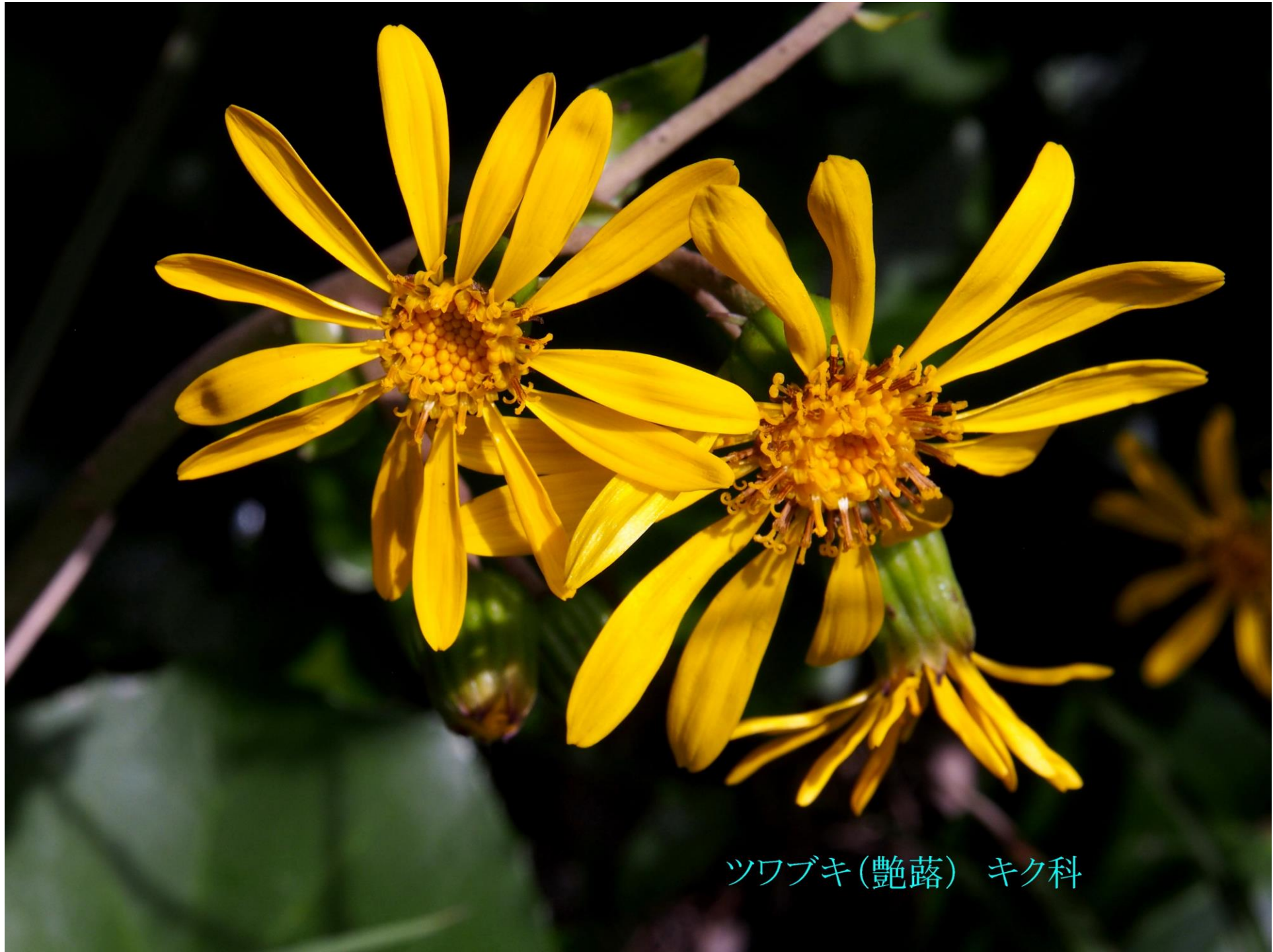
ツワブキ(艶蔞) キク科