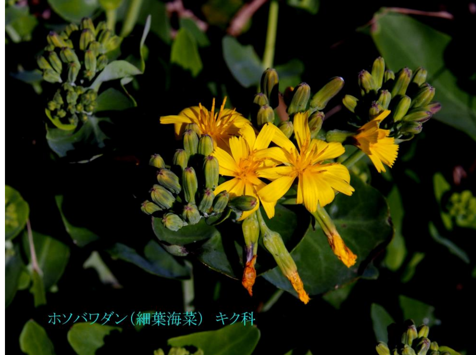
ホソバワダン(細葉海菜) キク科