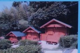
芥屋キャンプ場 Kaya Campsite