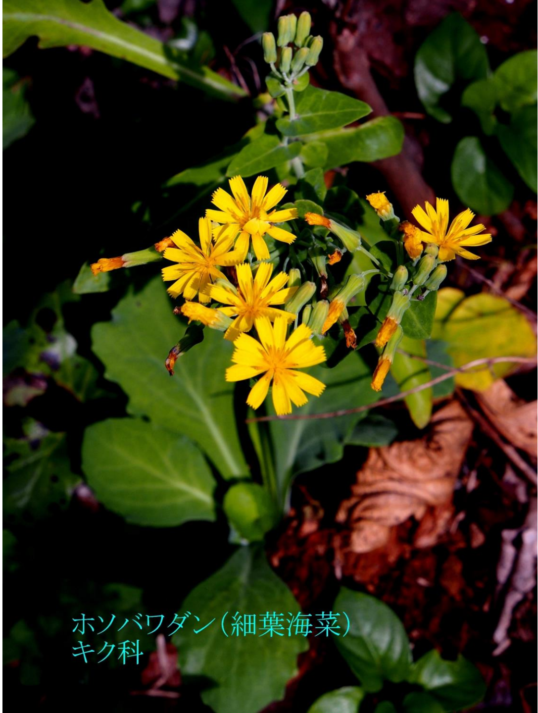
ホソバワダン(細葉海菜) キク科