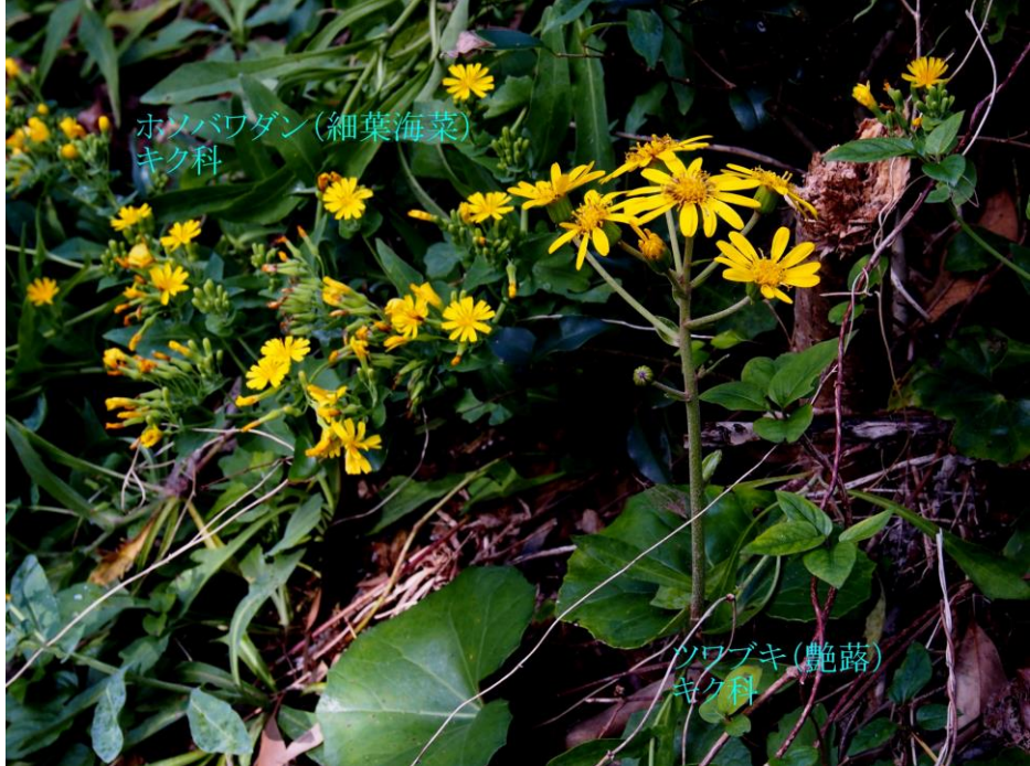
ホソバワダン(細葉海菜) キク科