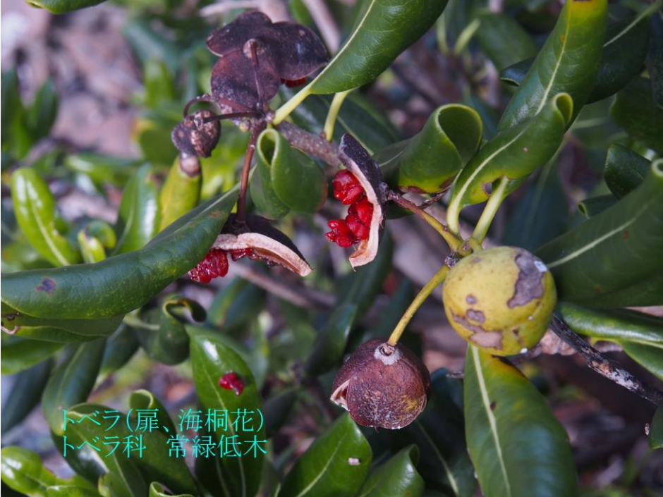
トベラ(扉、海桐花) トベラ科 常緑低木