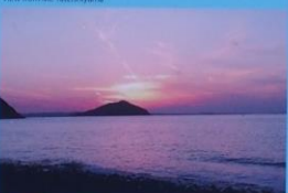
黒磯海岸からの夕日 Kuroshima Beach Sunset