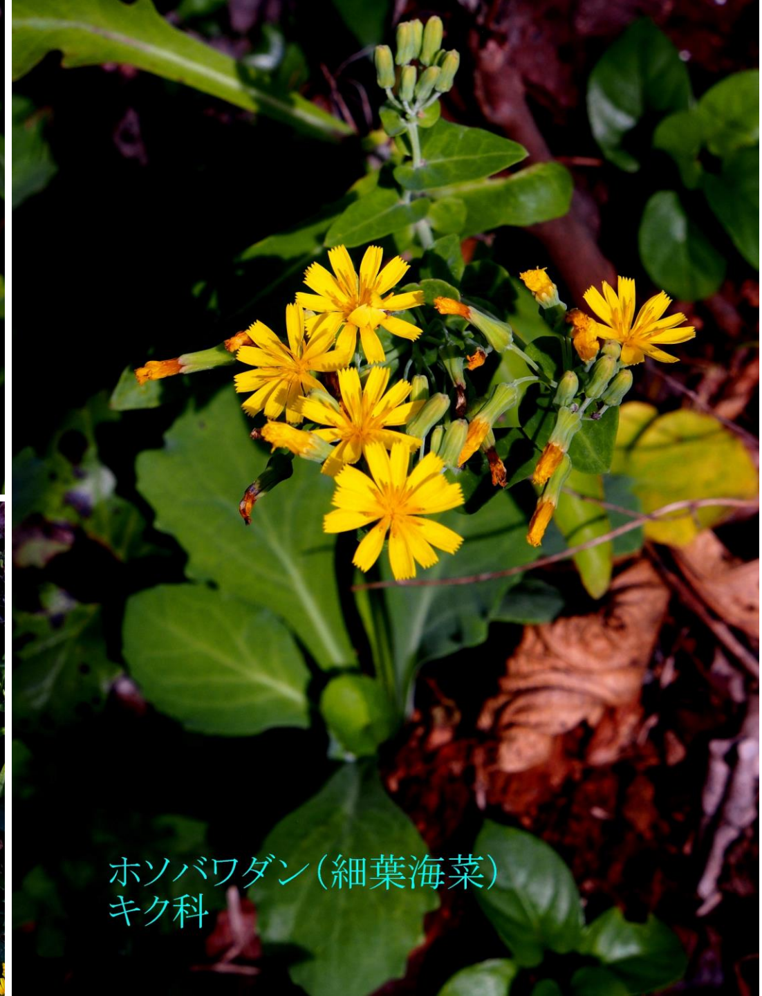
ホソバワダン(細葉海菜) キク科