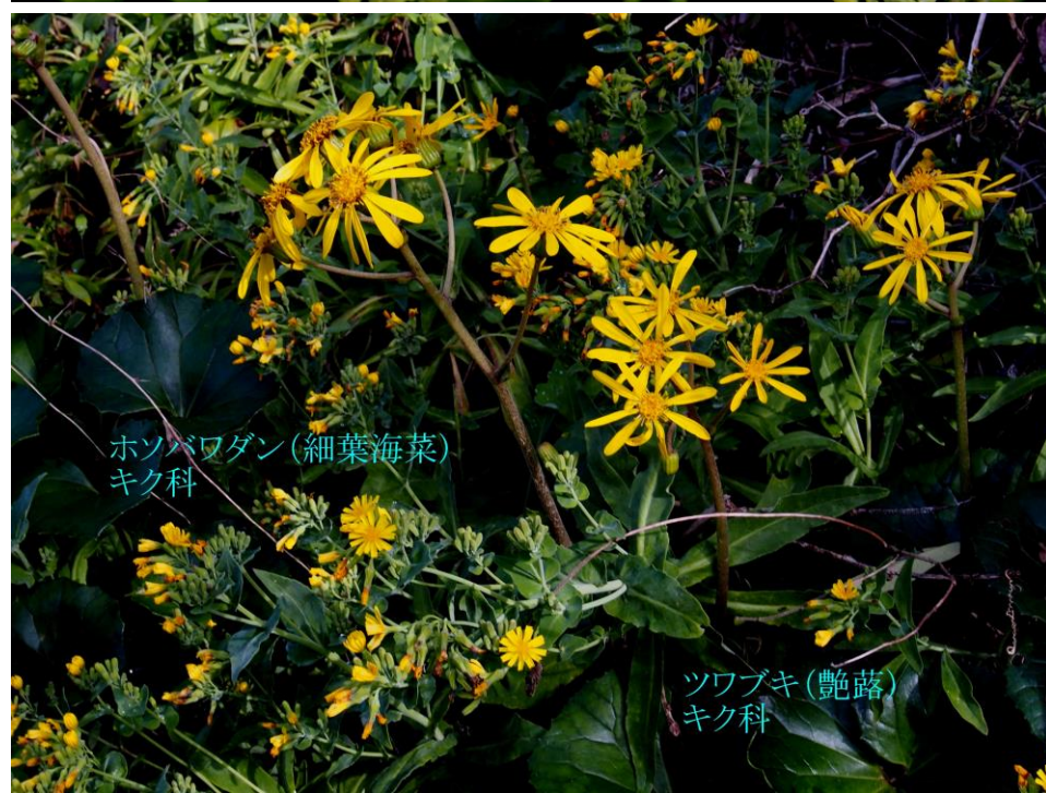
ホソバワダン(細葉海菜) キク科