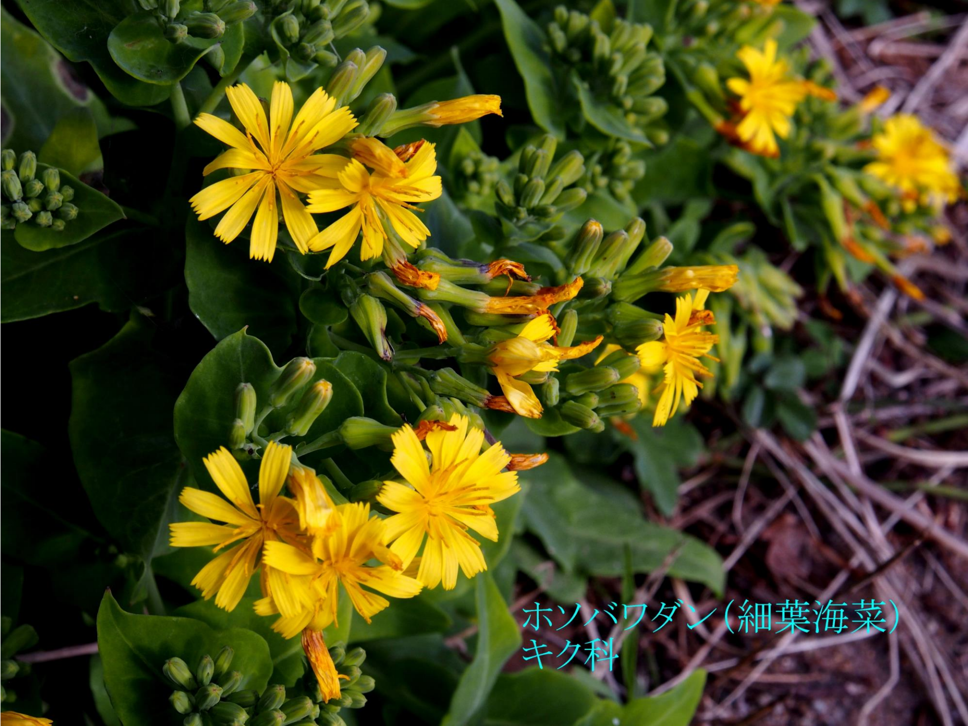
ホソバワダン(細葉海菜) キク科