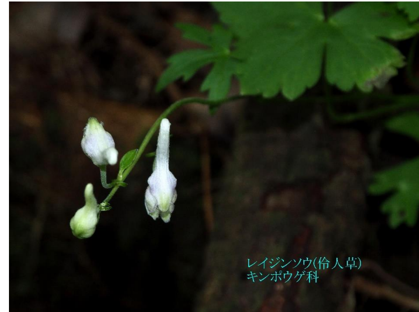
レイジンソウ(伶人草) キンポウゲ科