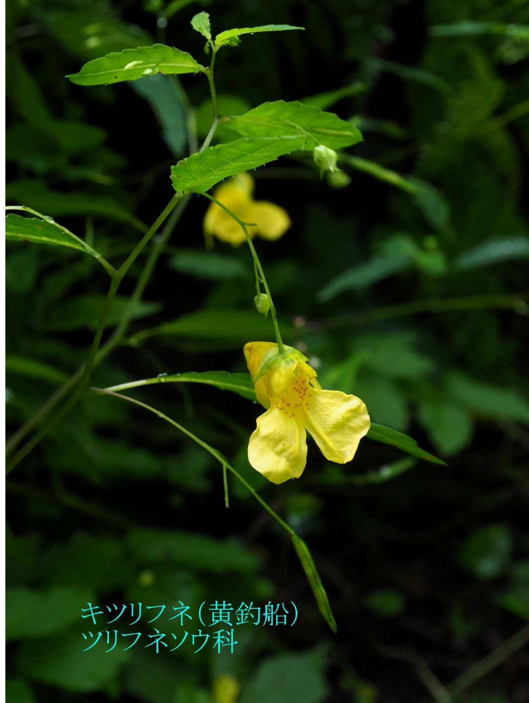
キツリフネ(黄釣船) ツリフネソウ科