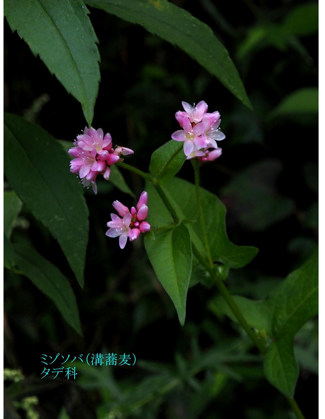
ミゾソバ(溝蕎麦) タデ科