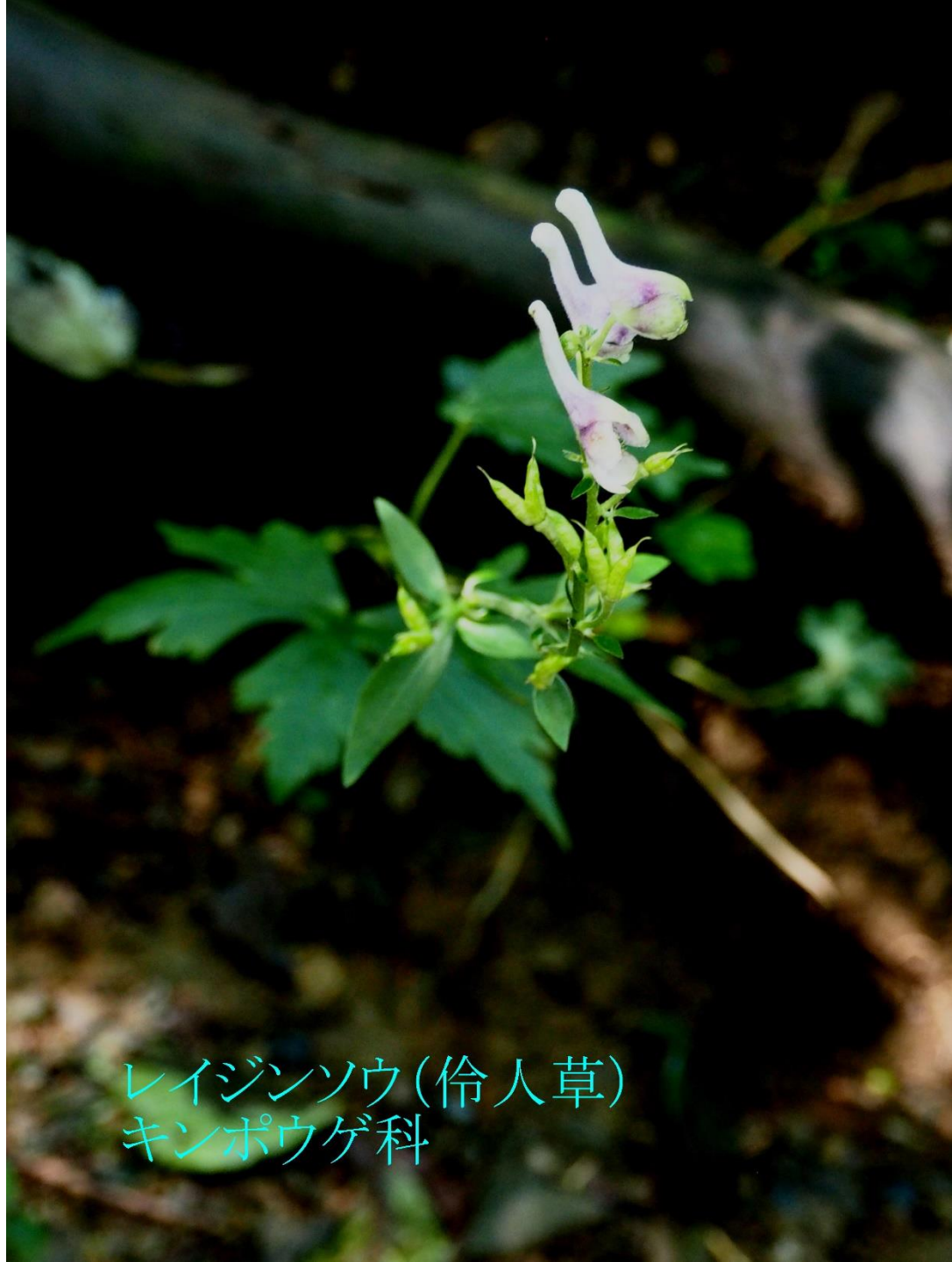
レイジンソウ(伶人草) キンポウゲ科