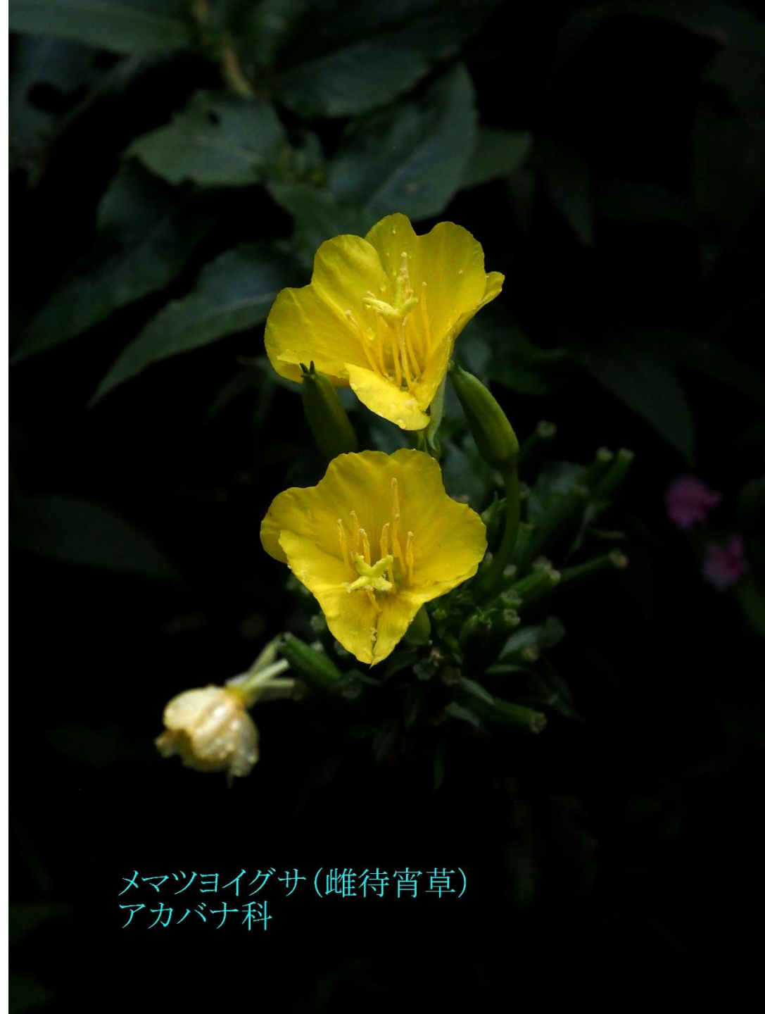
メマツヨイグサ(雌待宵草) アカバナ科