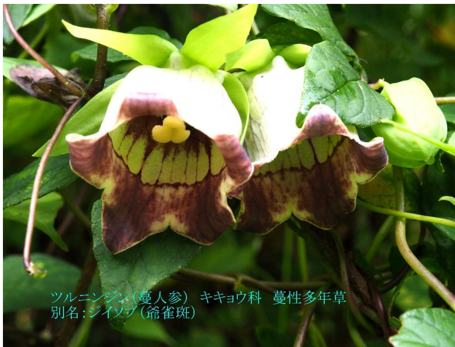
ツルニンジン(葛人參) キキョウ科 蔓性多年草 別名:ジイソブ(爺雀斑)