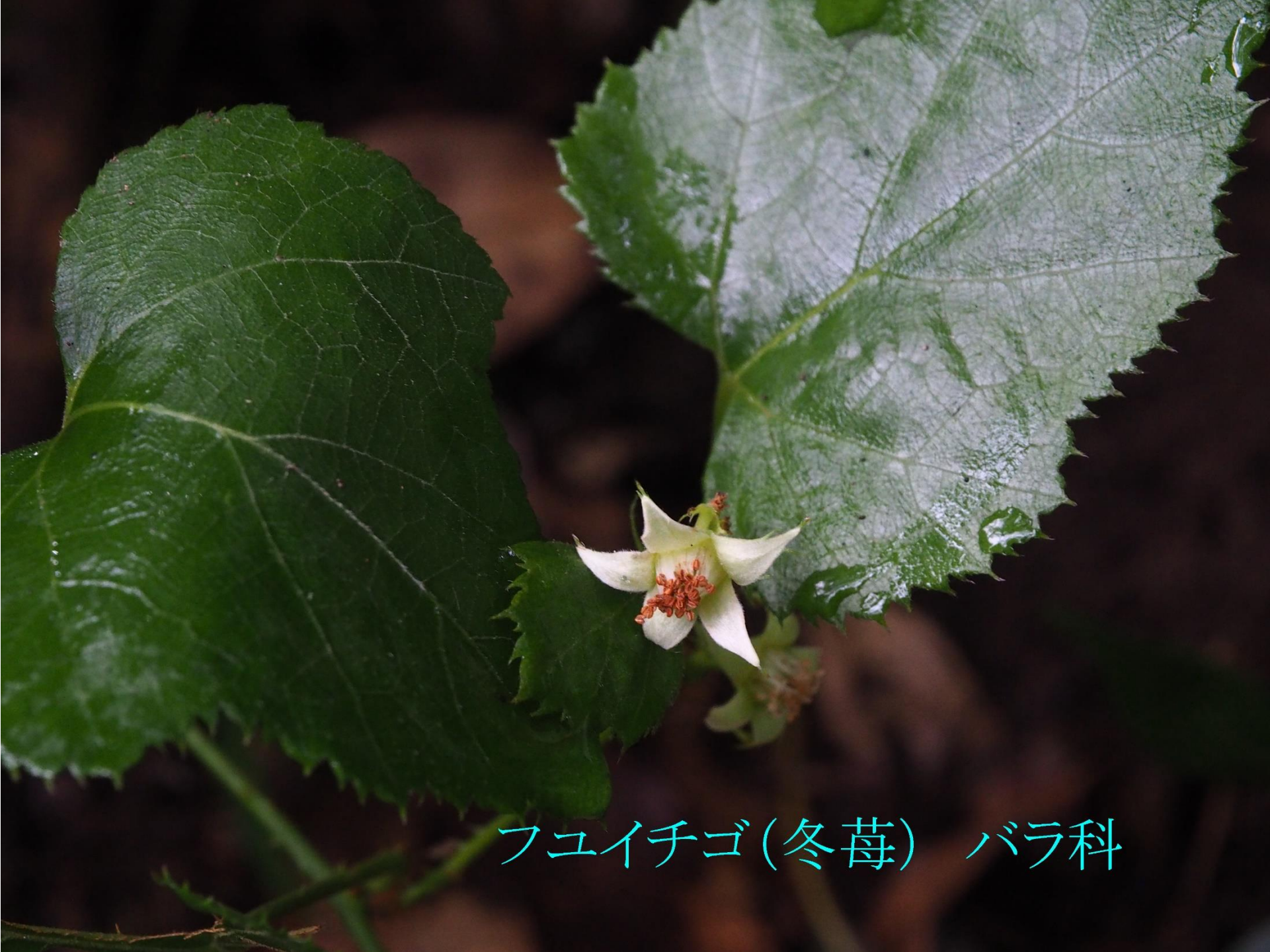
フユイチゴ(冬苺) バラ科