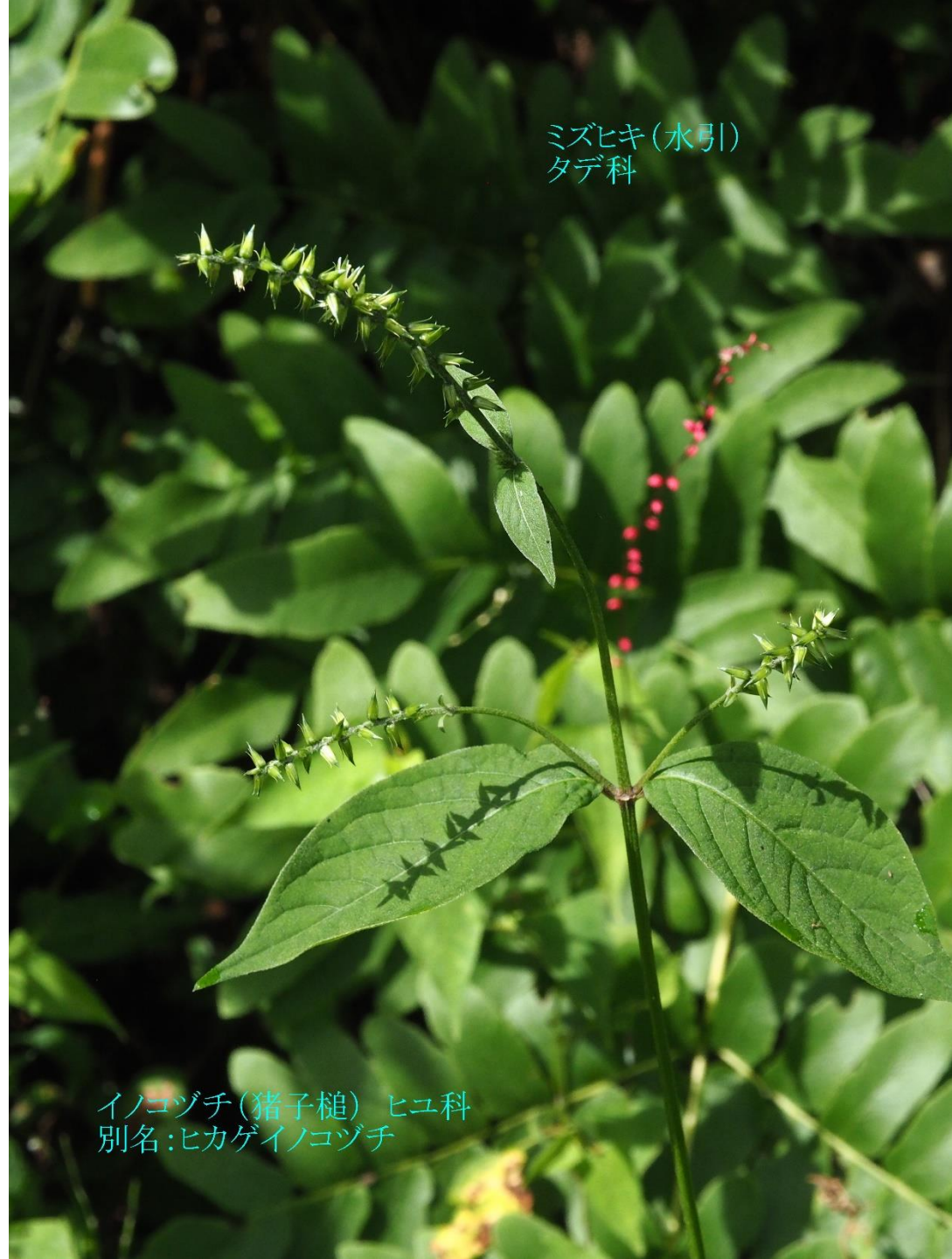
ミズヒキ(水引) タデ科