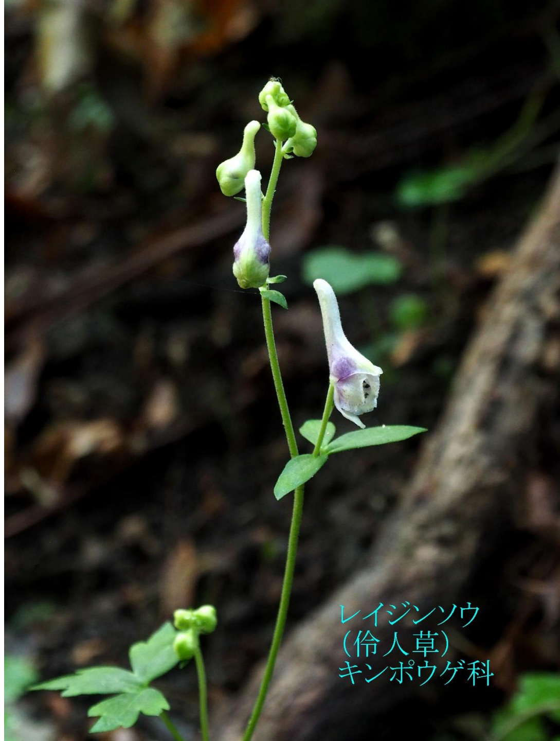
レイジンソウ (伶人草) キンポウゲ科