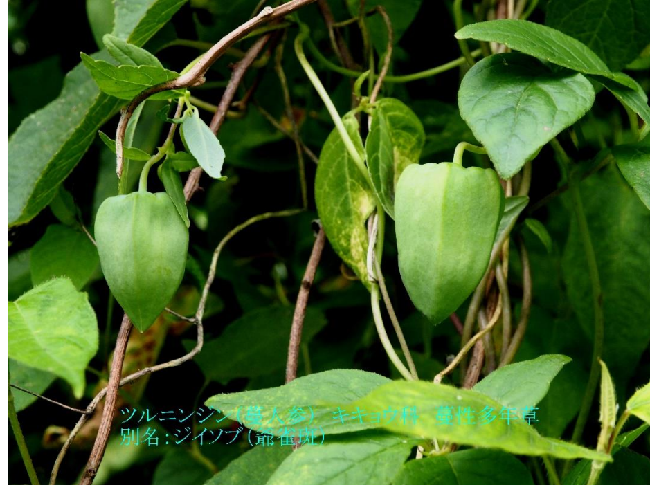
ツルニンジン(葛人參) キキョウ科 蔓性多年草 別名:ジイソブ(爺雀斑)