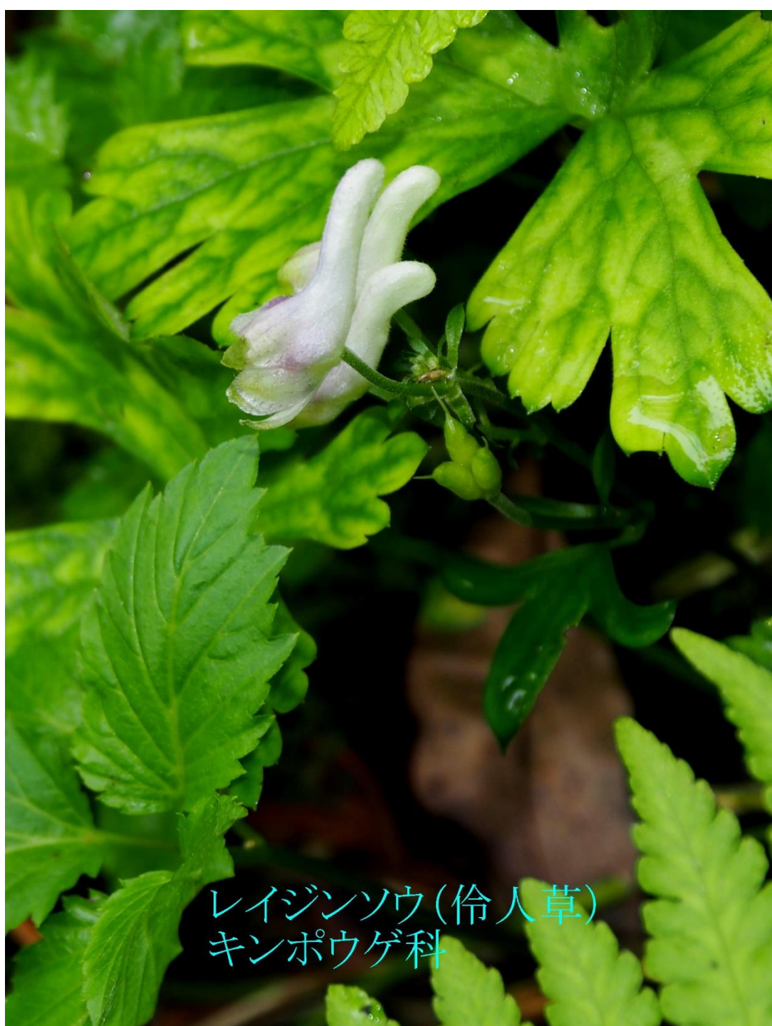
レイジンソウ(伶人草) キンポウゲ科