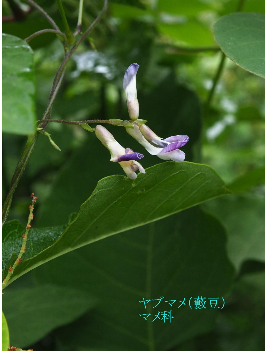
ヤブマメ(藪豆) マメ科