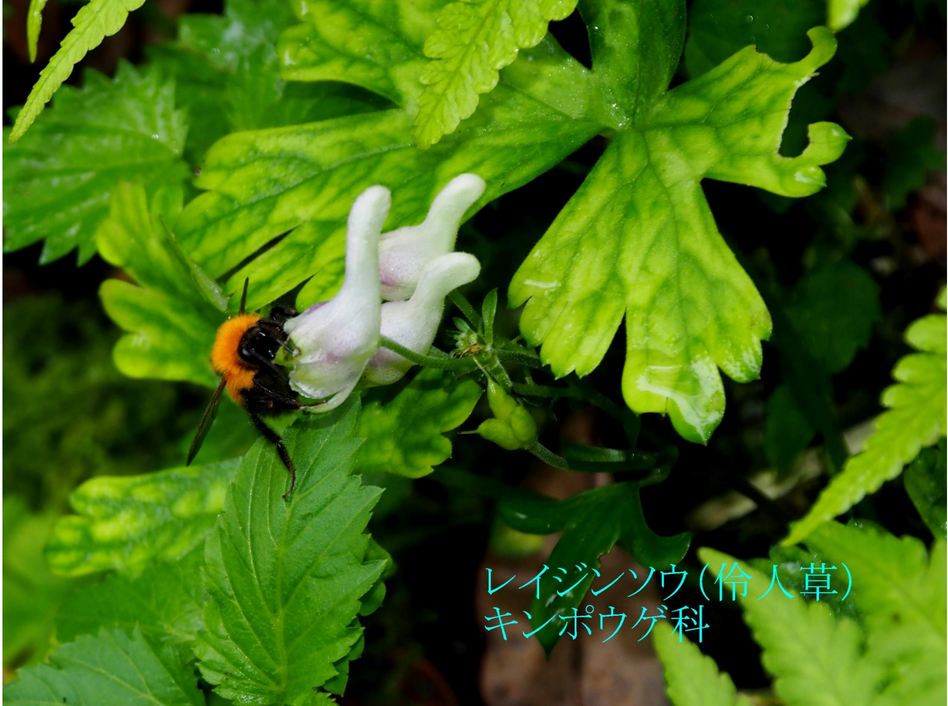
レイジンソウ(伶人草) キンポウゲ科