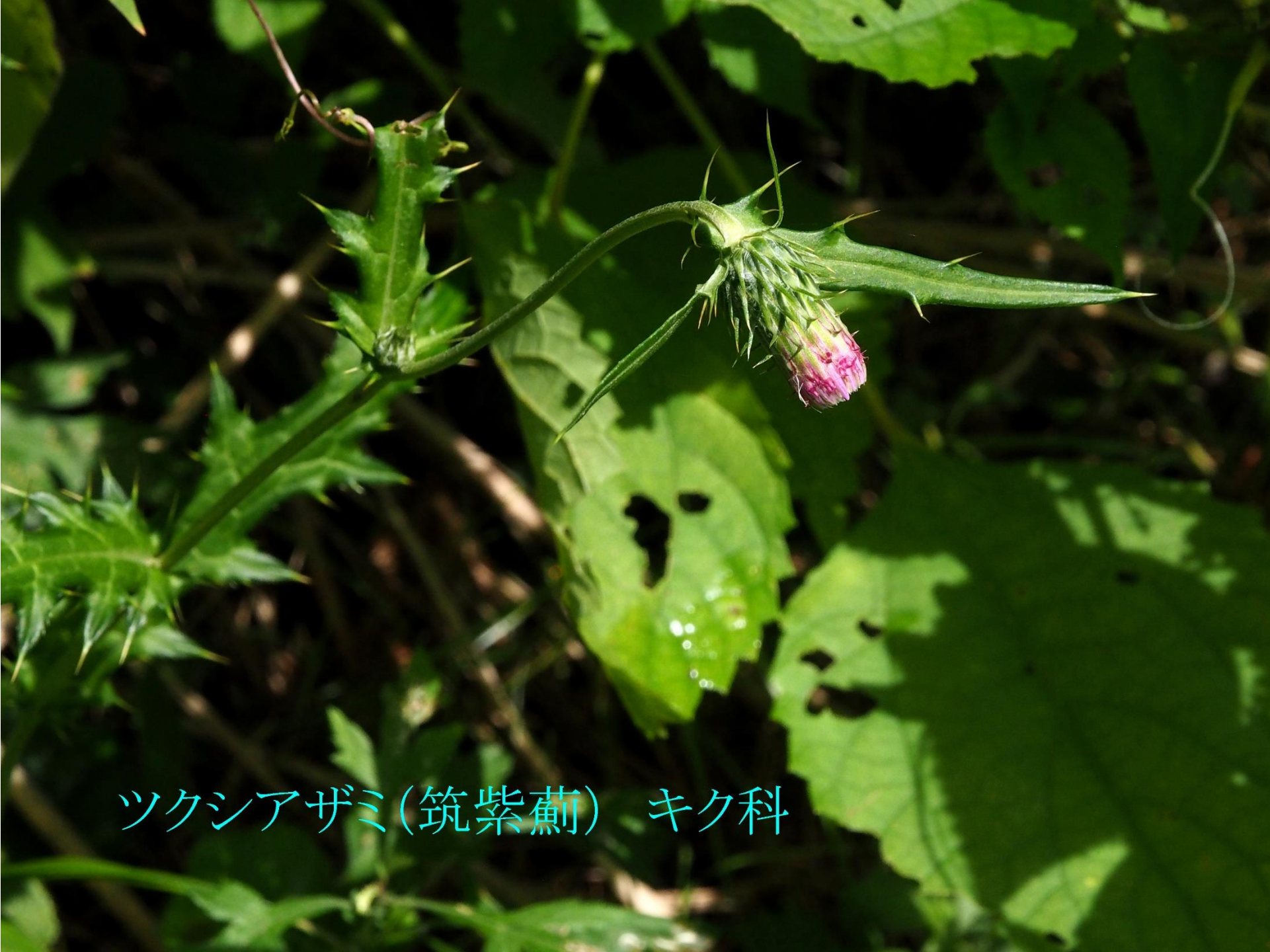
ツクシアザミ(筑紫薊) キク科