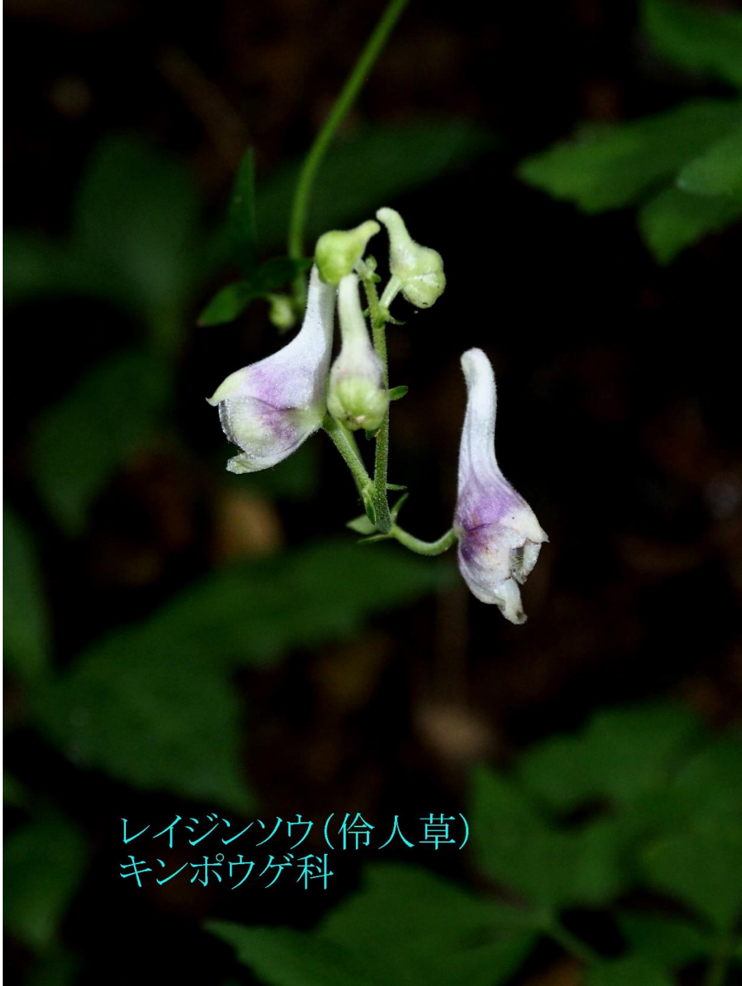
レイジンソウ(伶人草) キンポウゲ科