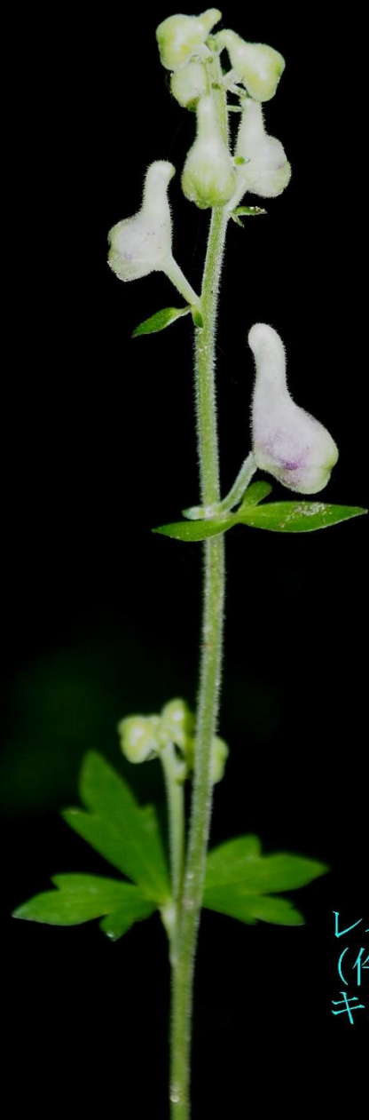
レイジンソウ (伶人草) キンポウゲ科