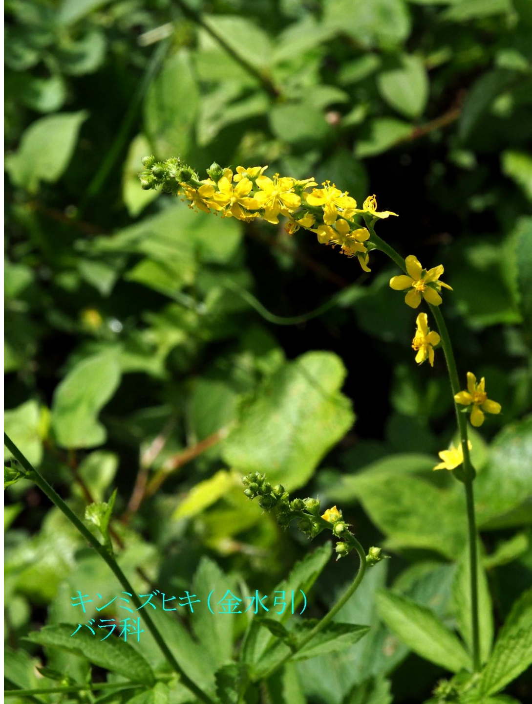
キンミズヒキ(金水引) バラ科