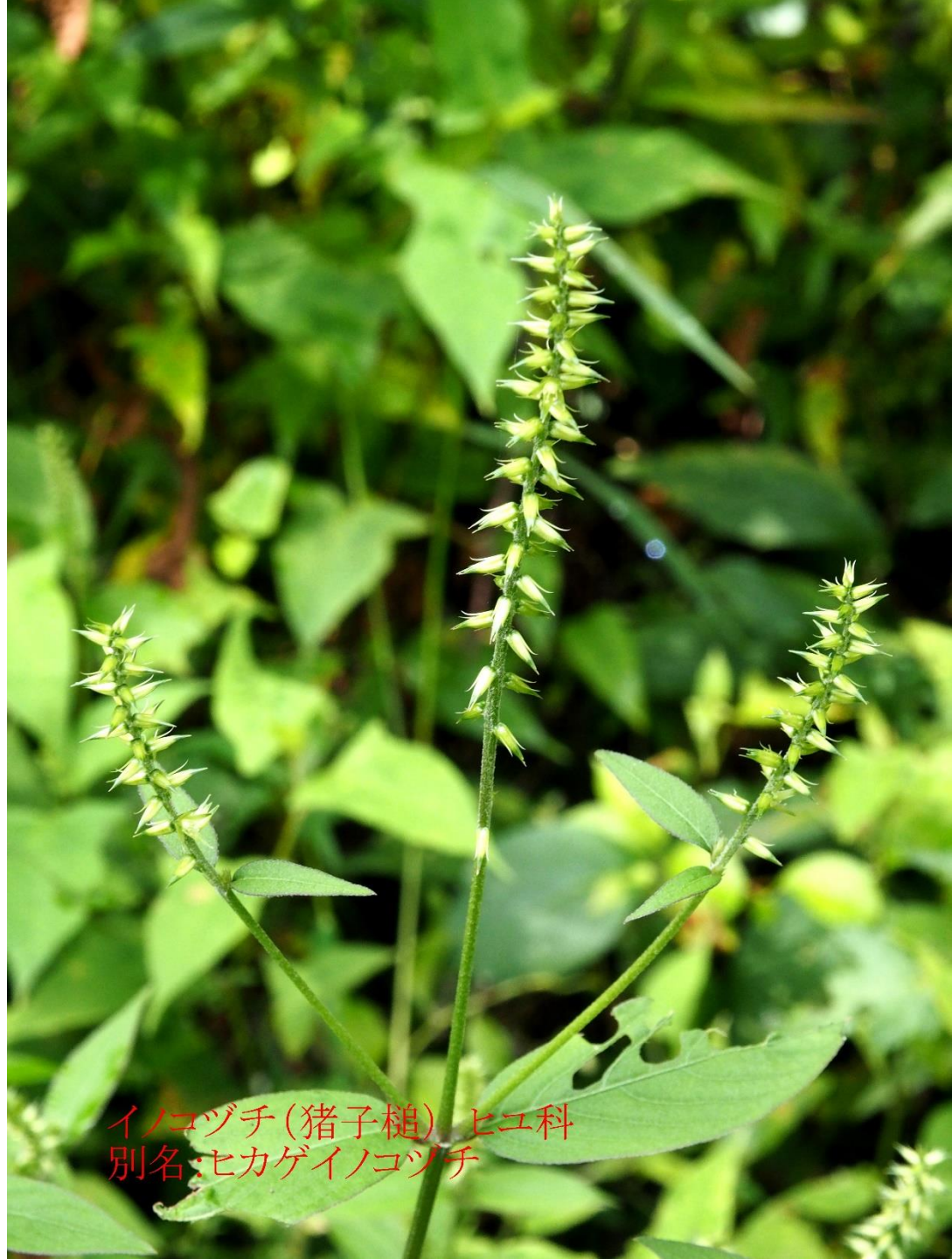
イノコヅチ(猪子槌) ヒユ科 別名:ヒカゲイノコヅチ