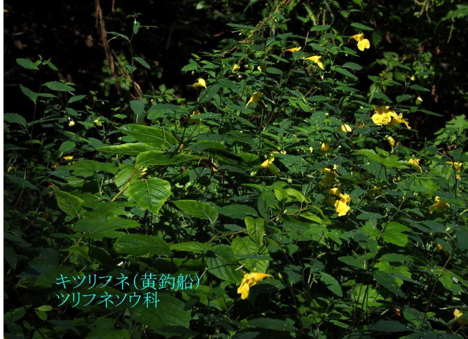
キツリフネ(黄釣船) ツリフネソウ科