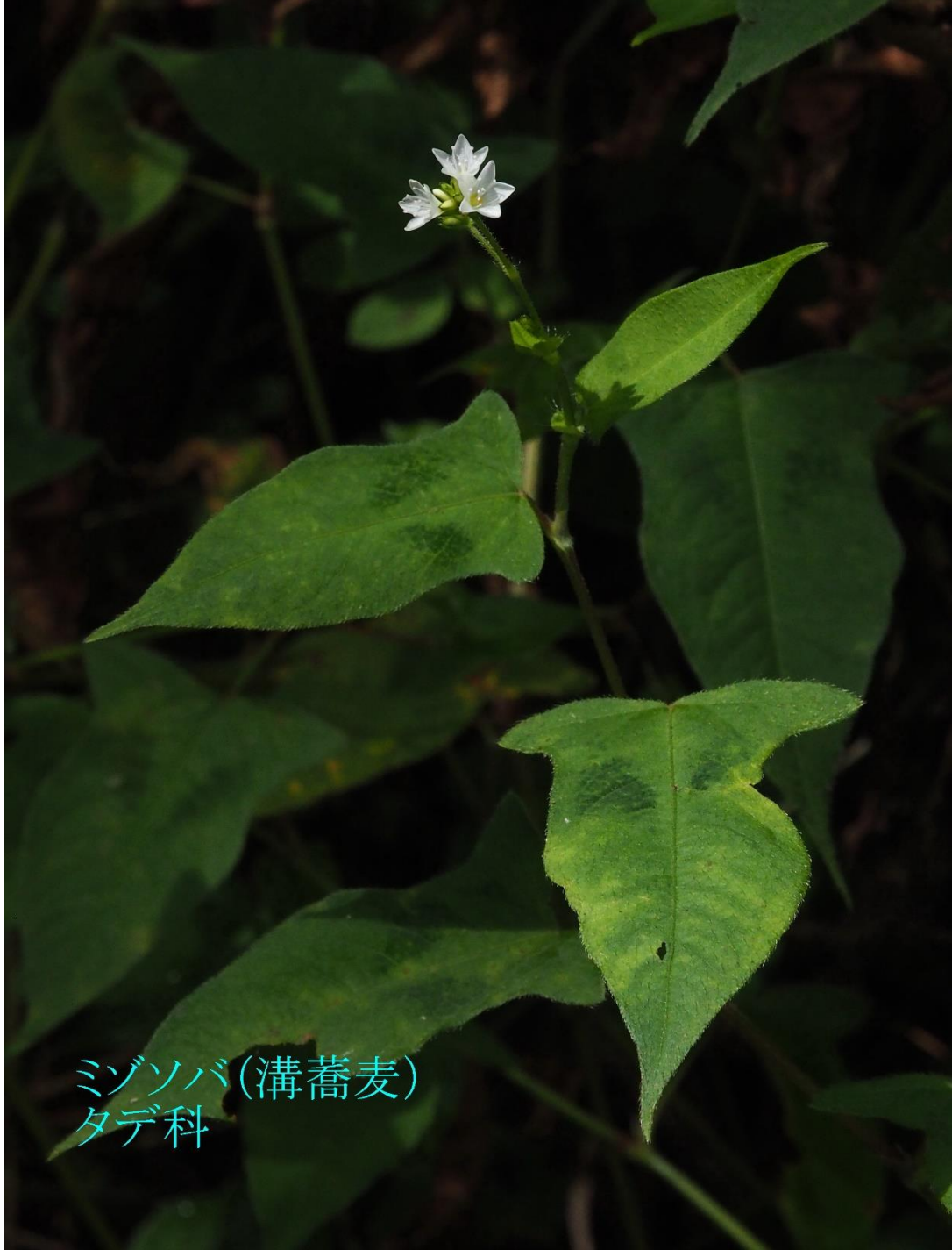
ミゾソバ (溝蕎麦) タデ科