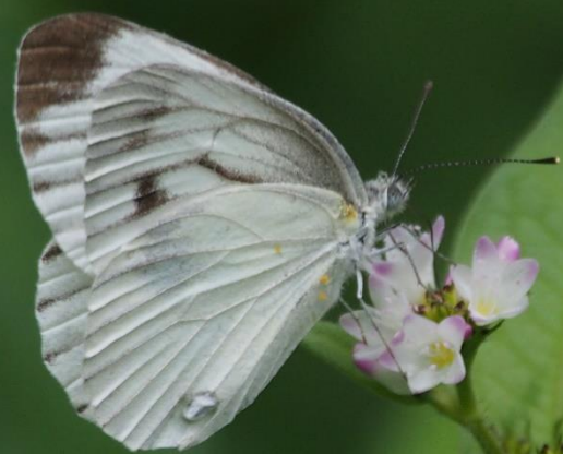
スジグロシロチョウ(筋黒白蝶) シロチョウ科