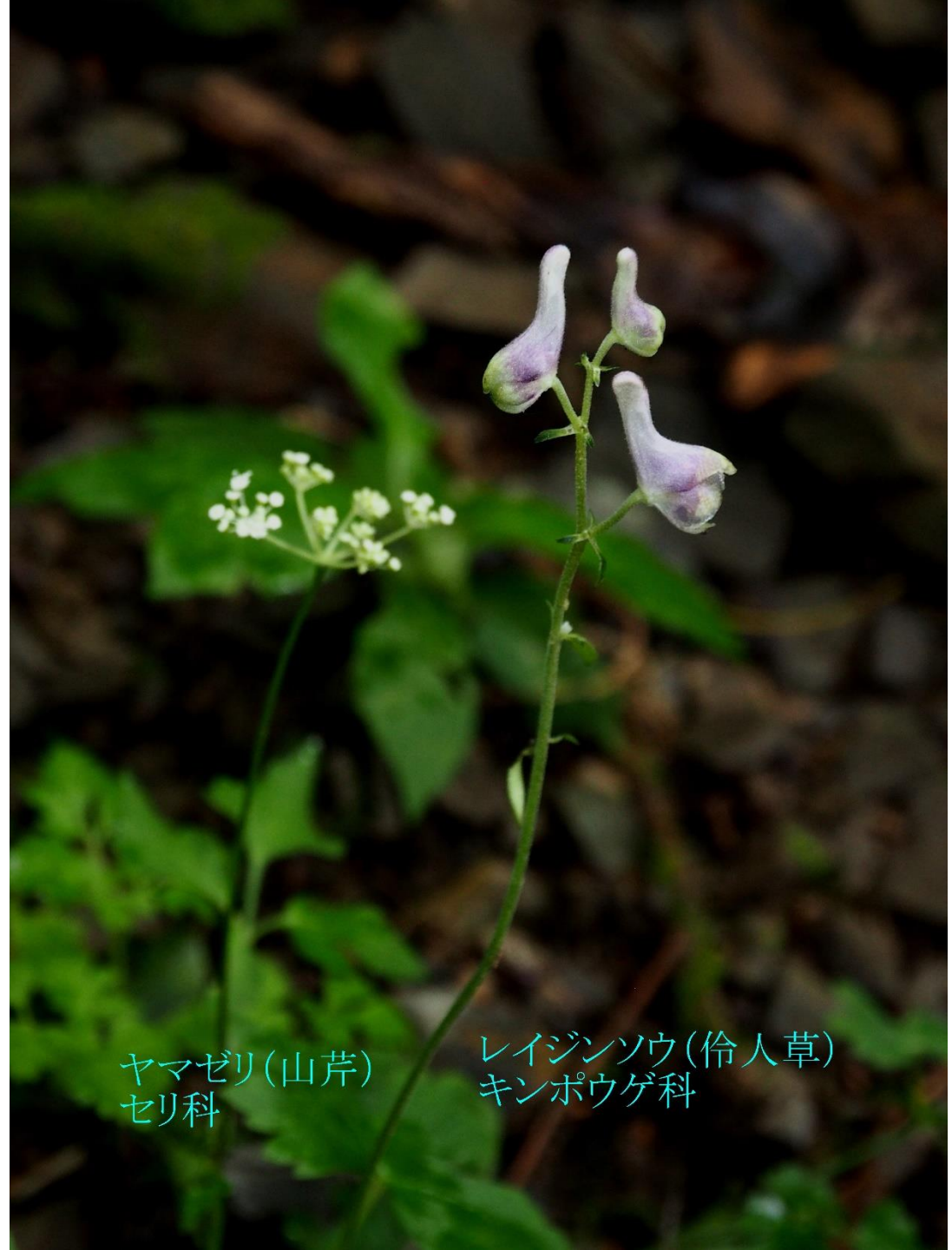
ヤマゼリ(山芹) セリ科