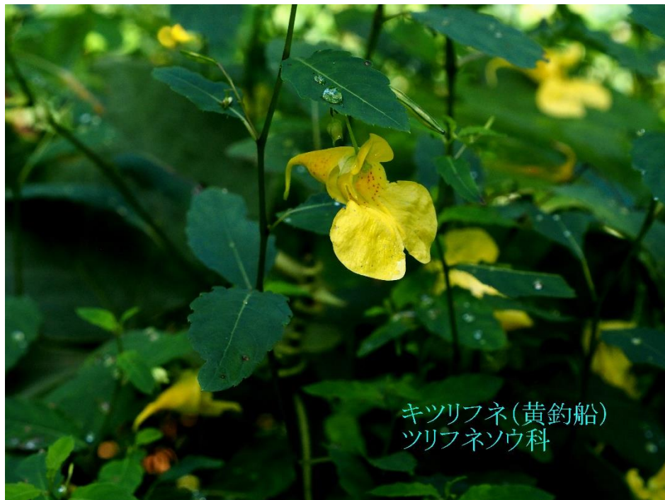
キツリフネ(黄釣船) ツリフネソウ科