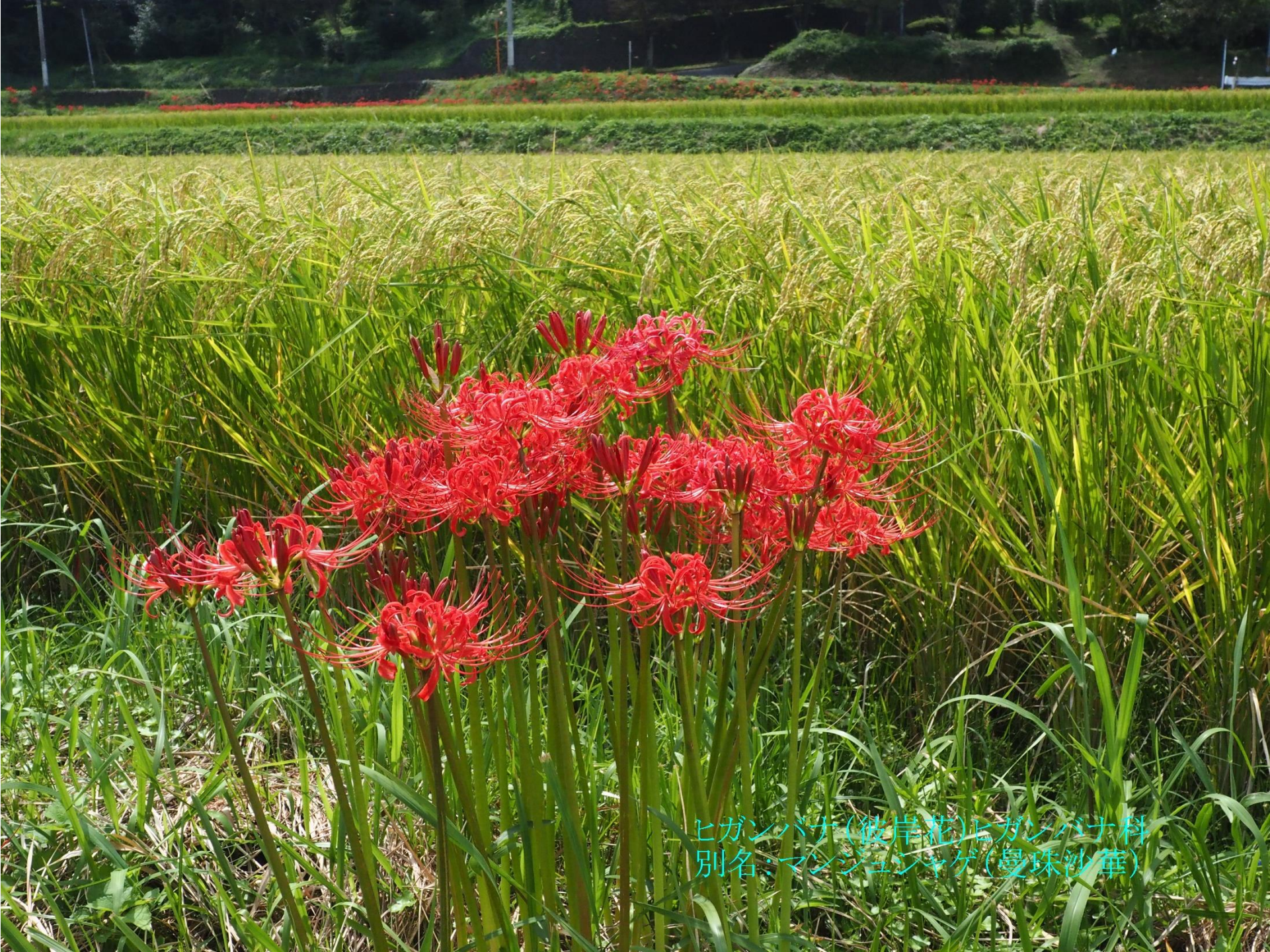
ヒガンバナ(彼岸花)ヒガンバナ科 別名:マンジュウキゲ(曼珠沙華)