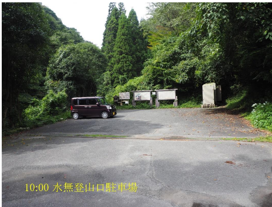
10:00 水無登山口駐車場