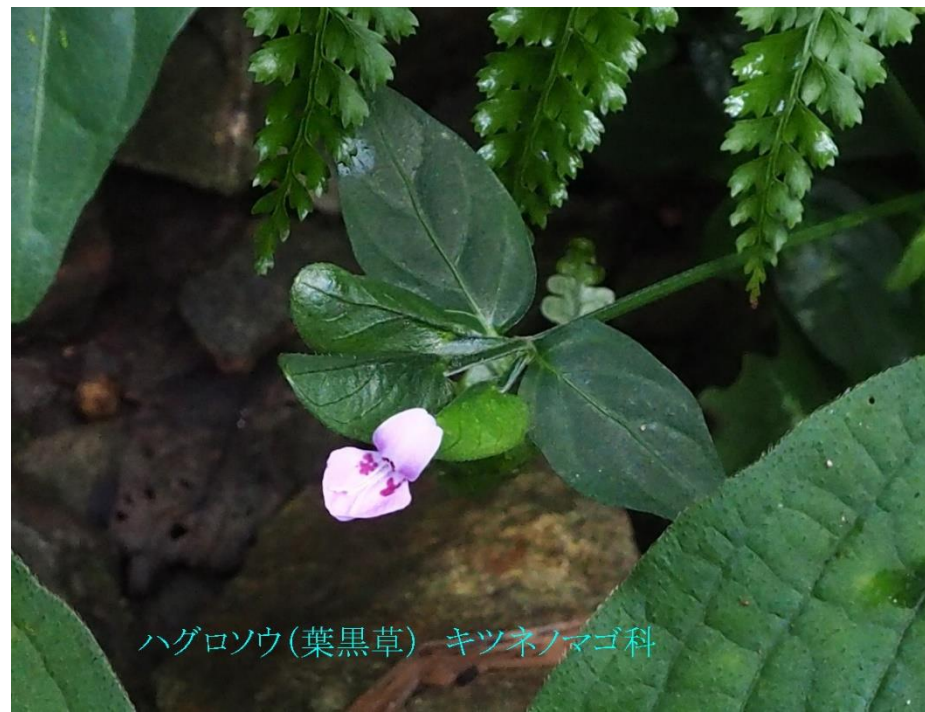
ハグロソウ(葉黒草) キツネノマゴ科