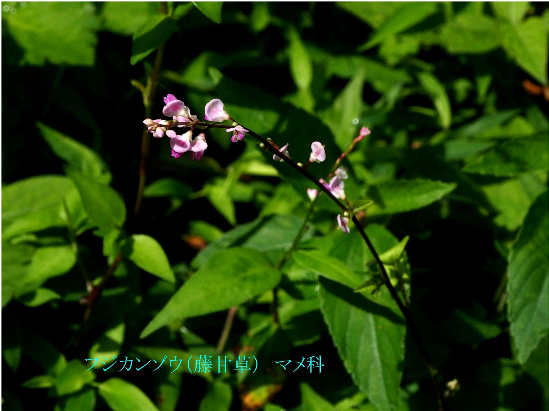
フジカンゾウ(藤甘草) マメ科