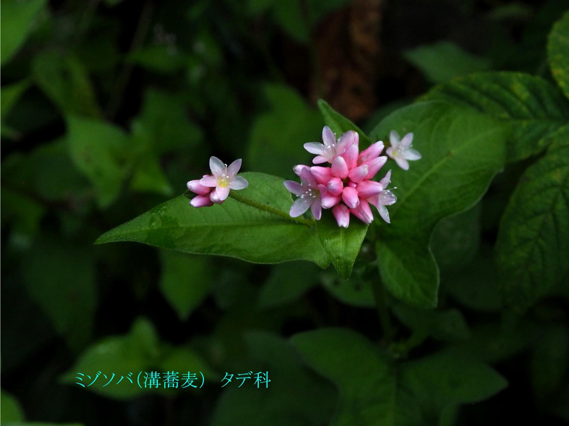
ミゾソバ(溝蕎麦) タデ科