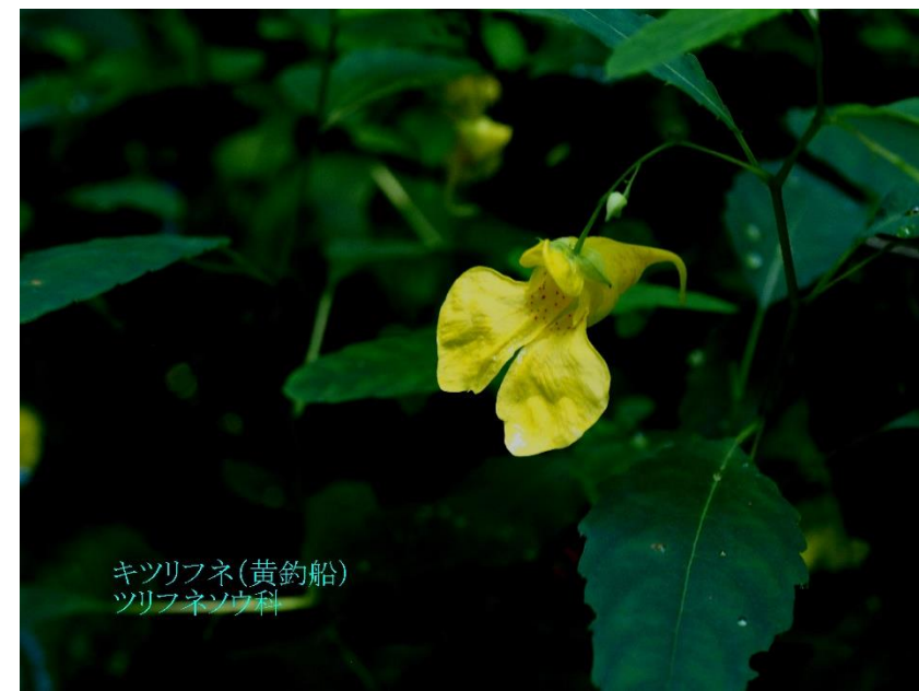
キツリフネ(黄釣船) ツリフネソウ科