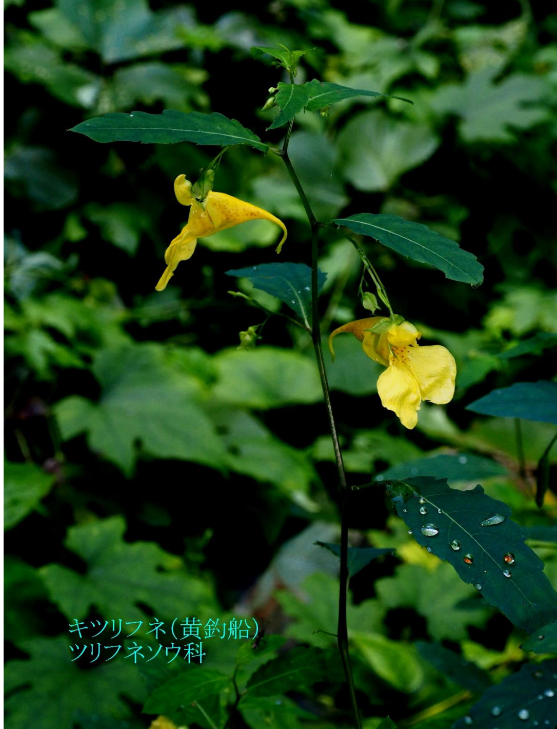
キツリフネ(黄釣船) ツリフネソウ科