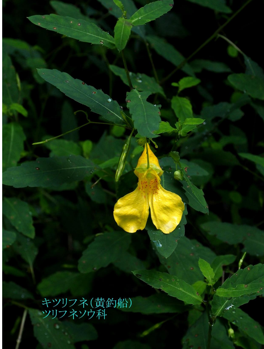
キツリフネ(黄釣船) ツリフネソウ科