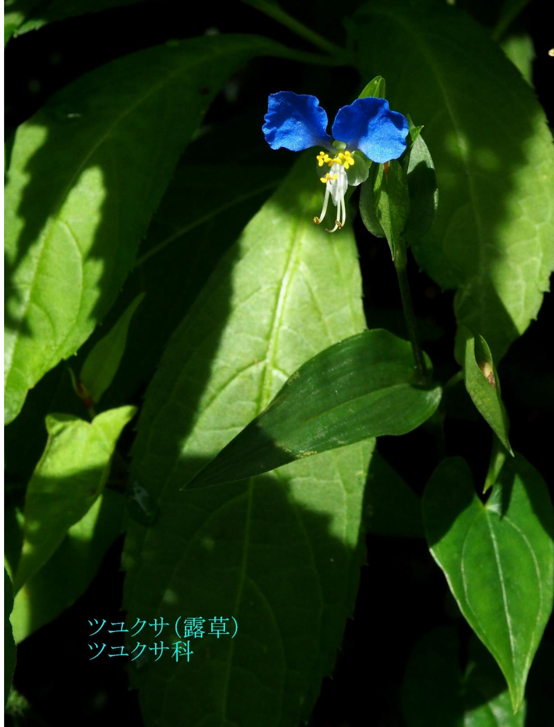
ツユクサ (露草) ツユクサ科