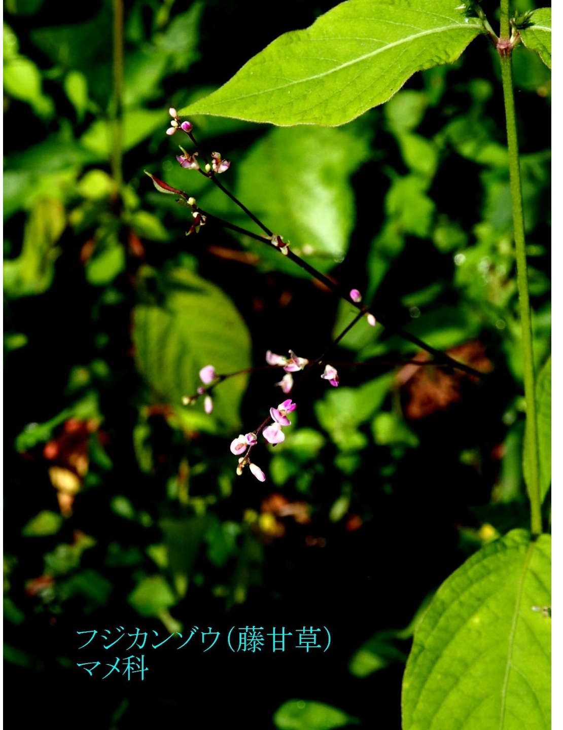
フジカンゾウ(藤甘草) マメ科