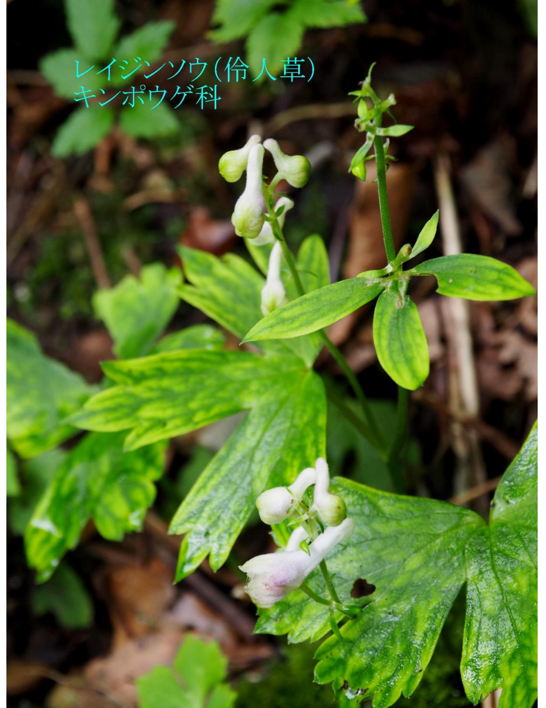
レイジンソウ(伶人草) キンポウゲ科