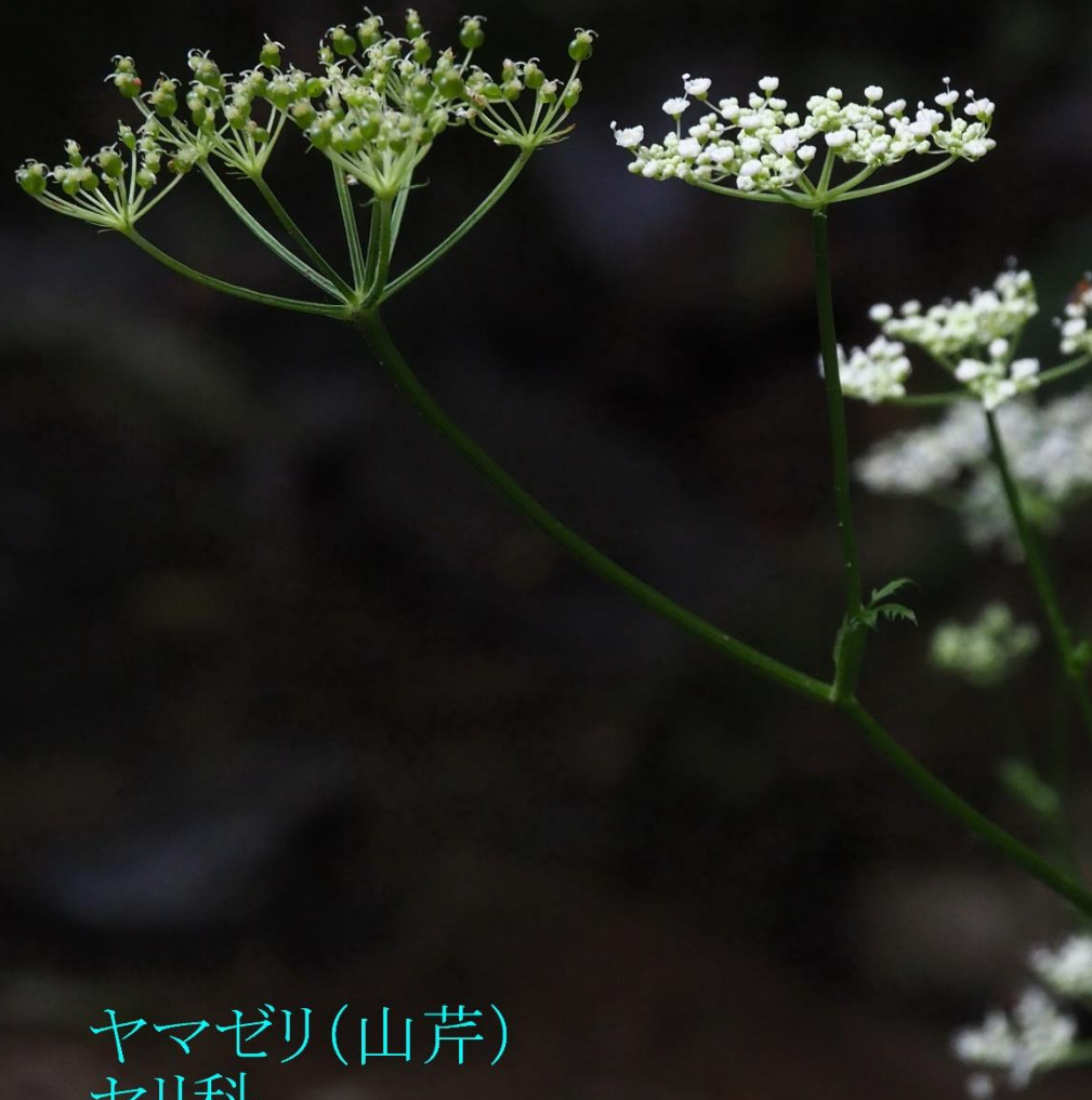
ヤマゼリ(山芹) セリ科