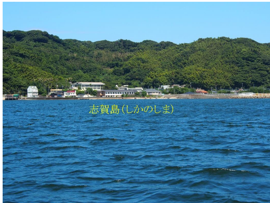
志賀島(しかのしま)