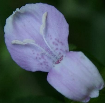
ハグロソウ(葉黒草) キツネノマゴ科