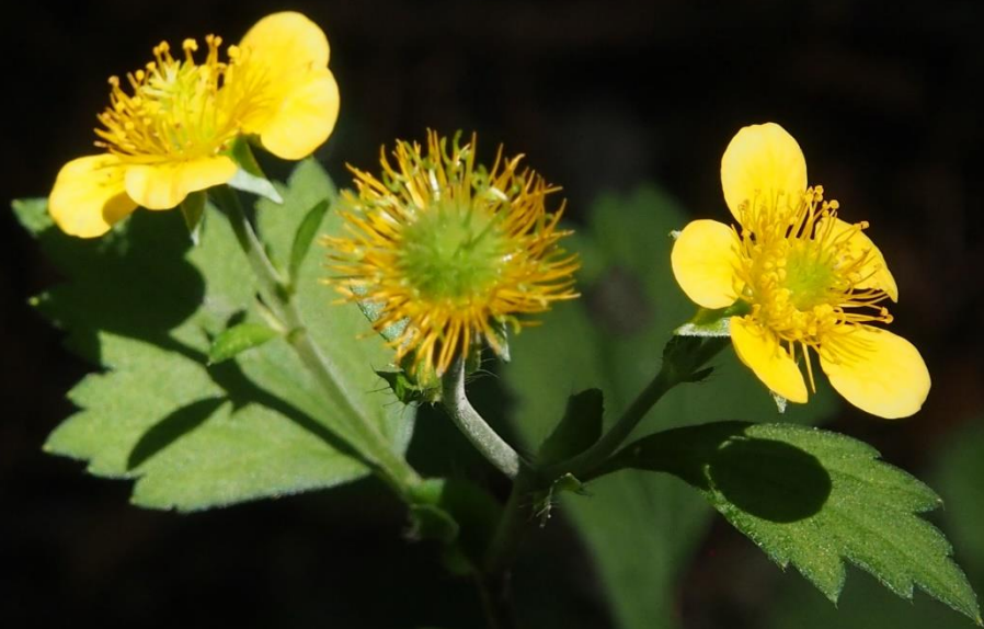
ダイコンソウ(大根草) バラ科