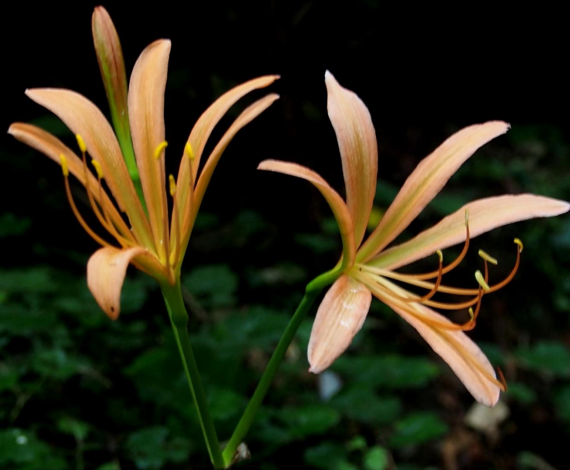
オオキツネノカミソリ(大狐の剃刀) ヒガンバナ科