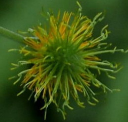
ダイコンソウ(大根草) バラ科