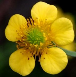
ダイコンソウ(大根草) バラ科