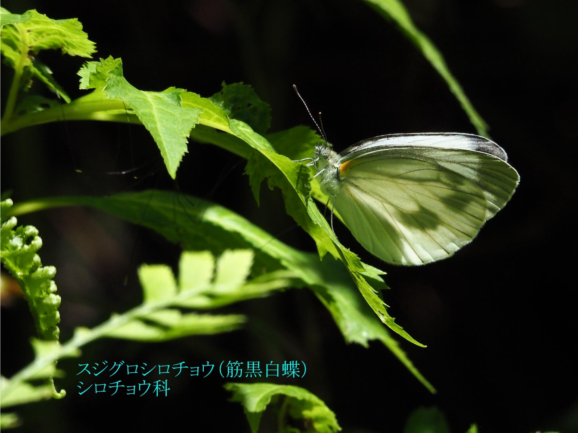
スジグロシロチョウ(筋黑白蝶) シロチョウ科