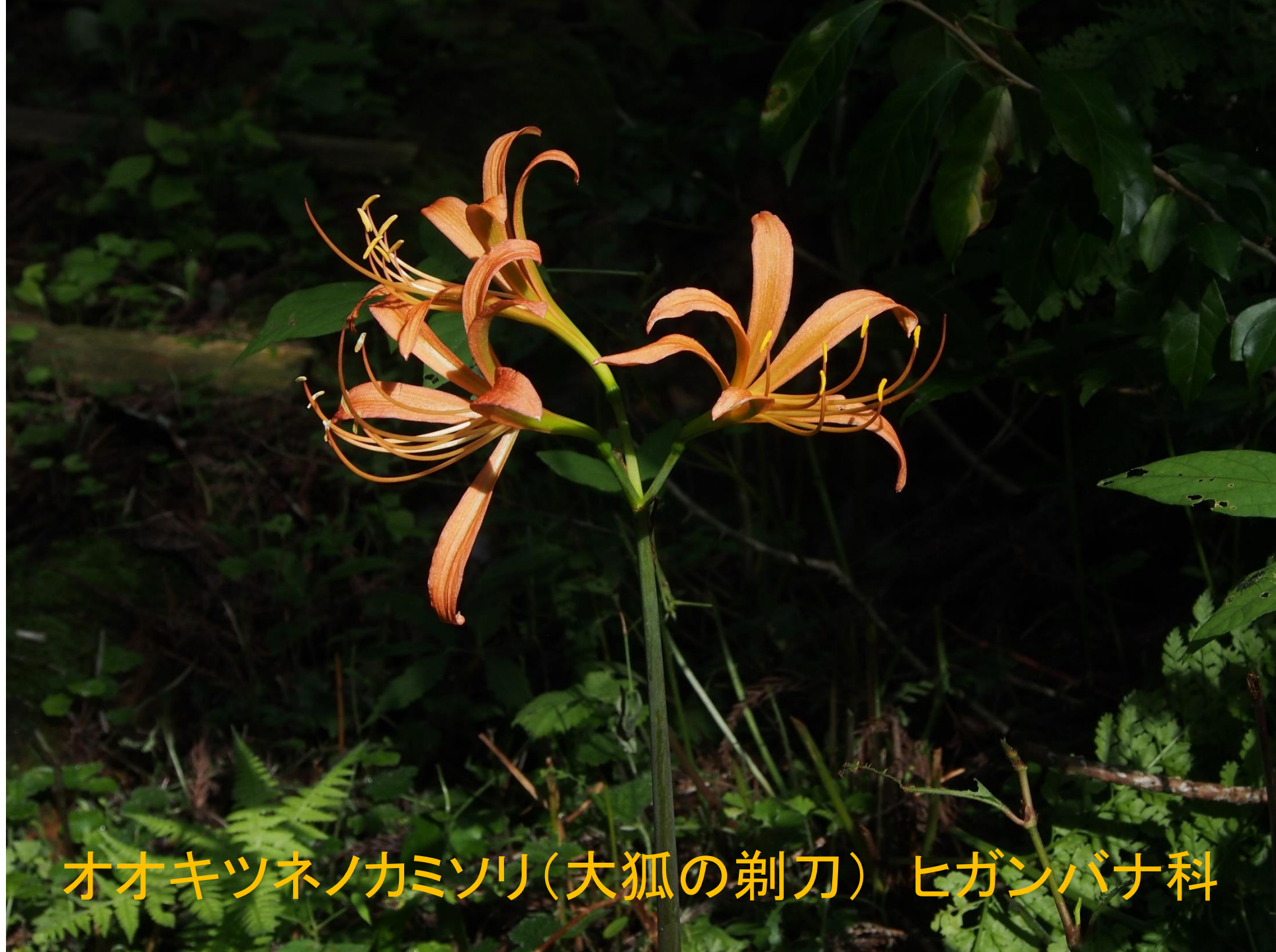
オオキツネノカミソリ(大狐の剃刀) ヒガンバナ科