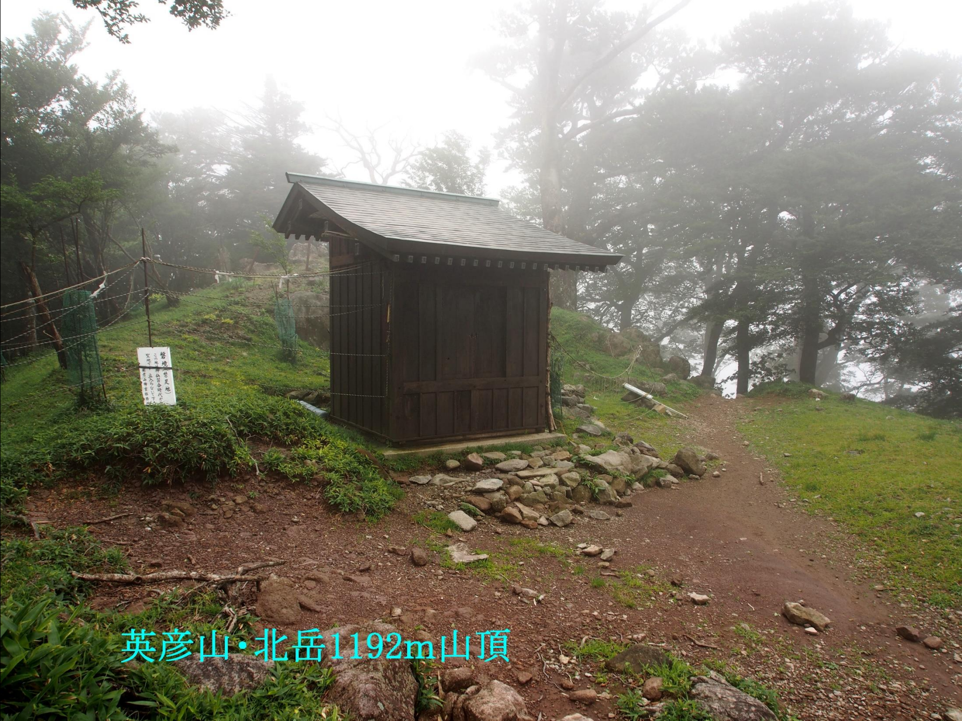
英彦山・北岳1192m山頂