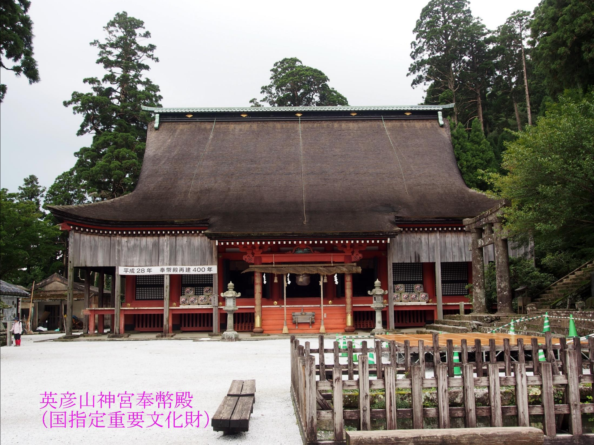
英彦山神宮奉幣殿 (国指定重要文化財)