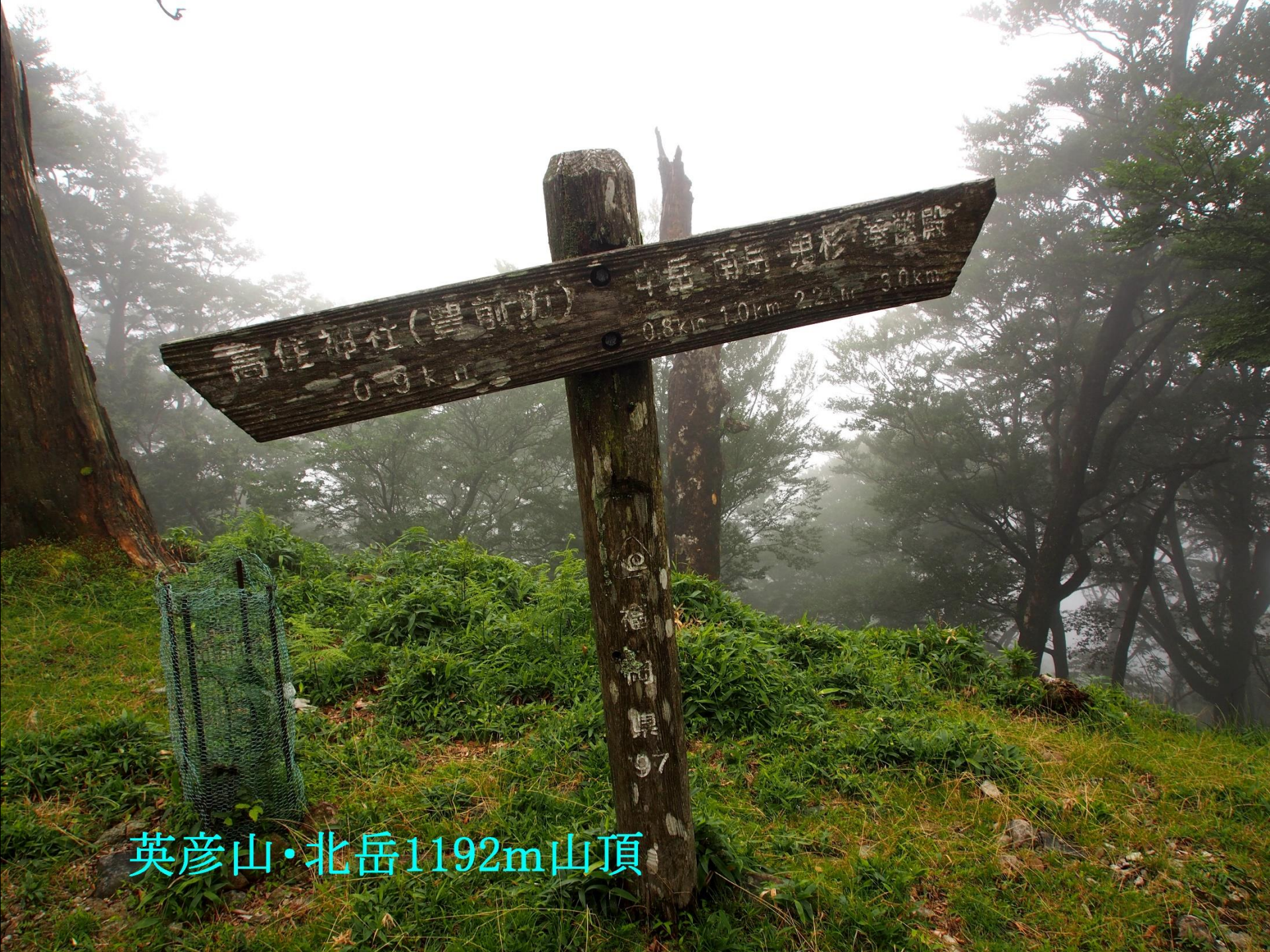
英彦山・北岳1192m山頂