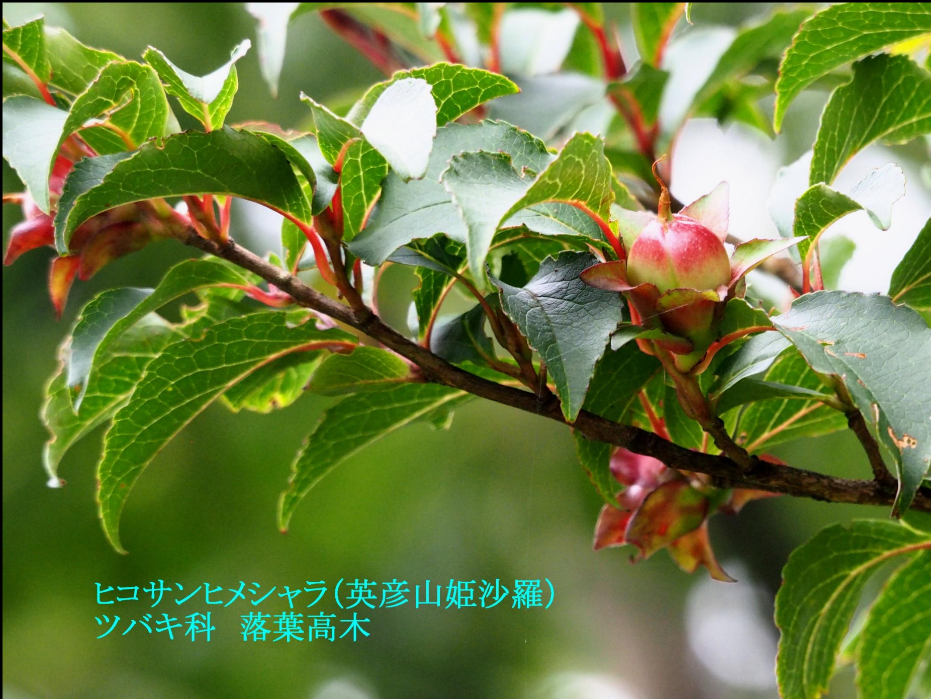
ヒコサンヒメシャラ(英彦山姫沙羅) ツバキ科 落葉高木