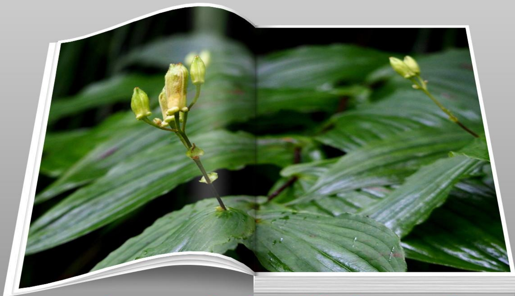
タマガワホトトギス(玉川杜鵑) ユリ科