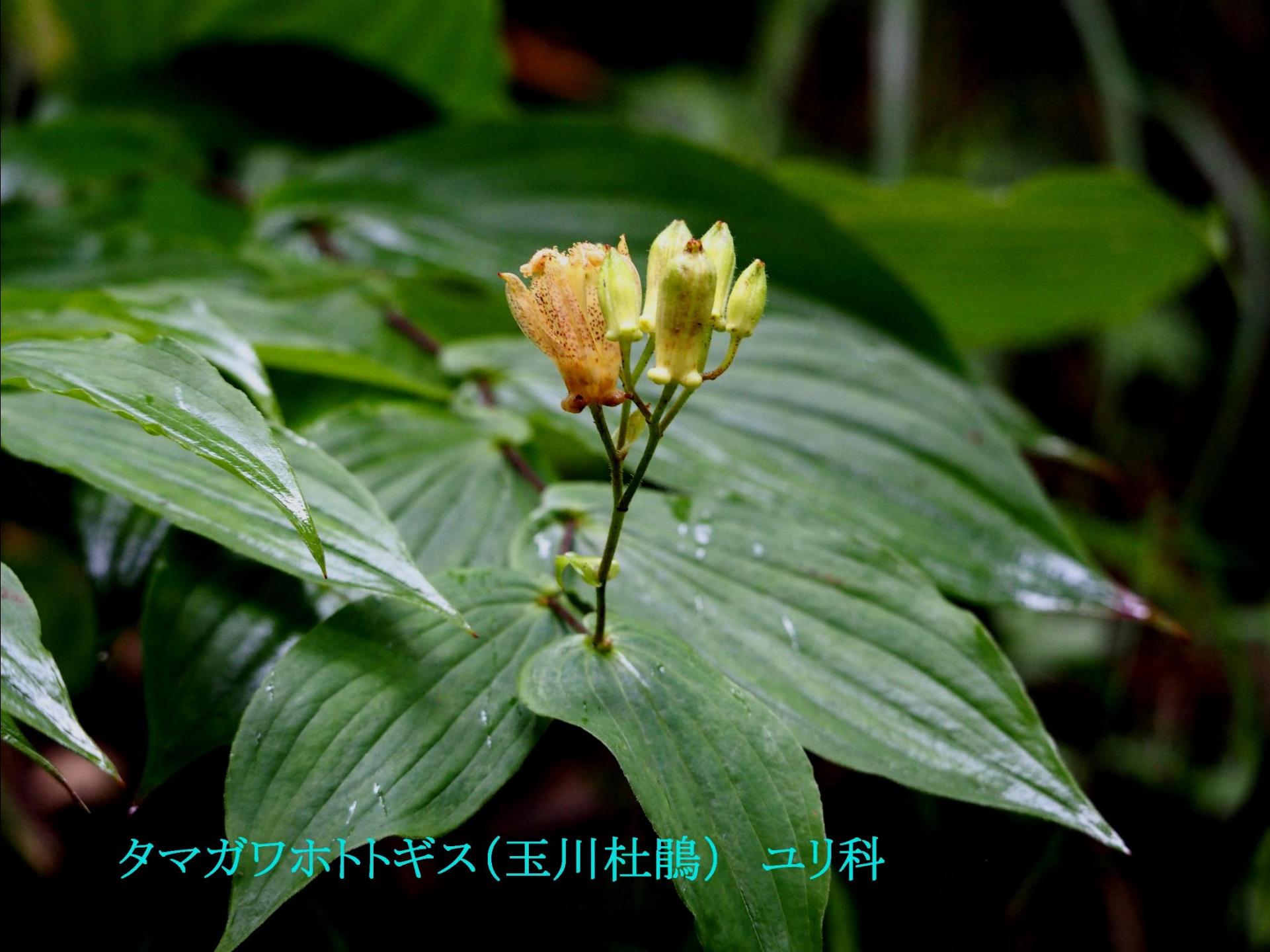
タマガワホトトギス(玉川杜鵑) ユリ科