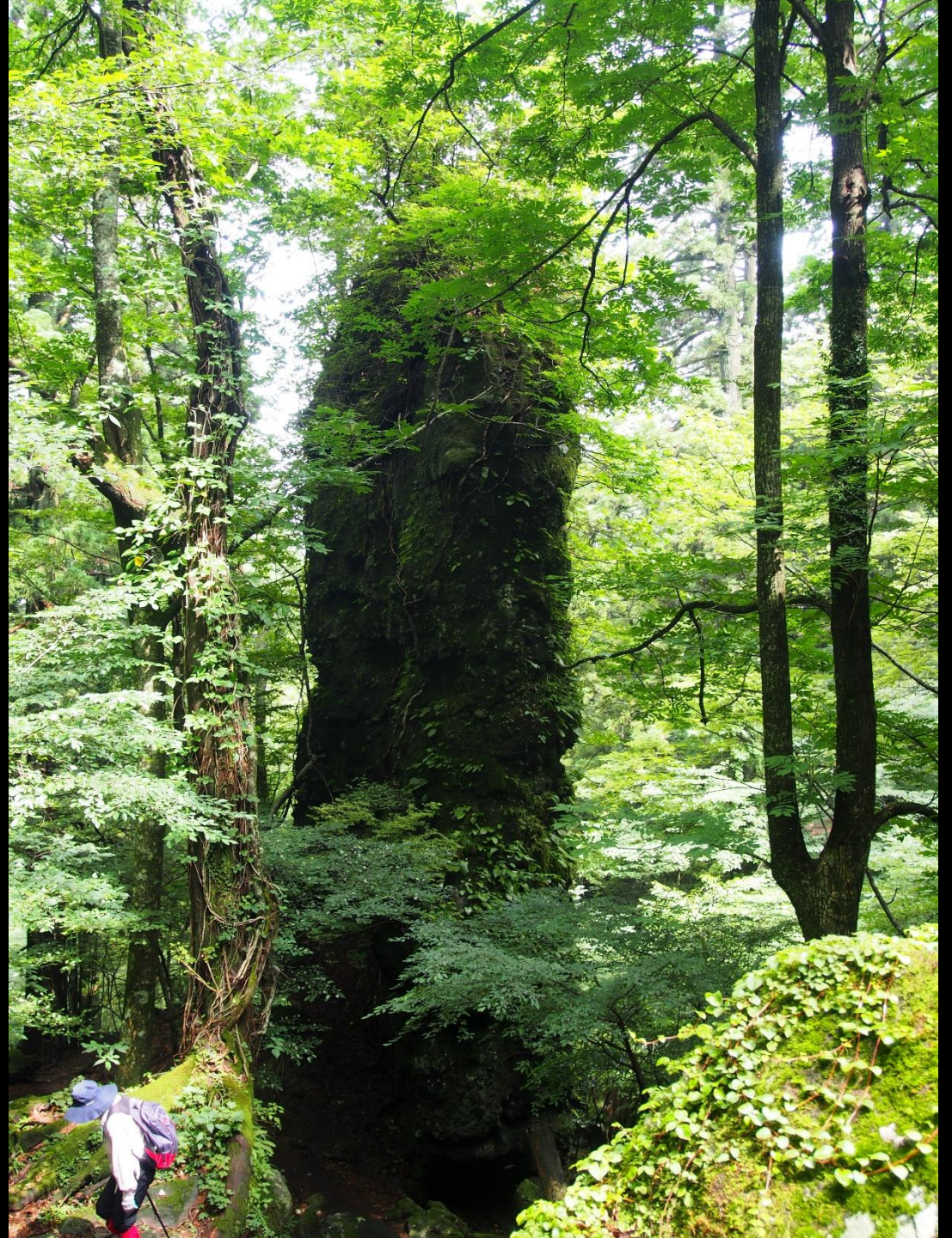
ミズタビラコ (水田平子) ムラサキ科