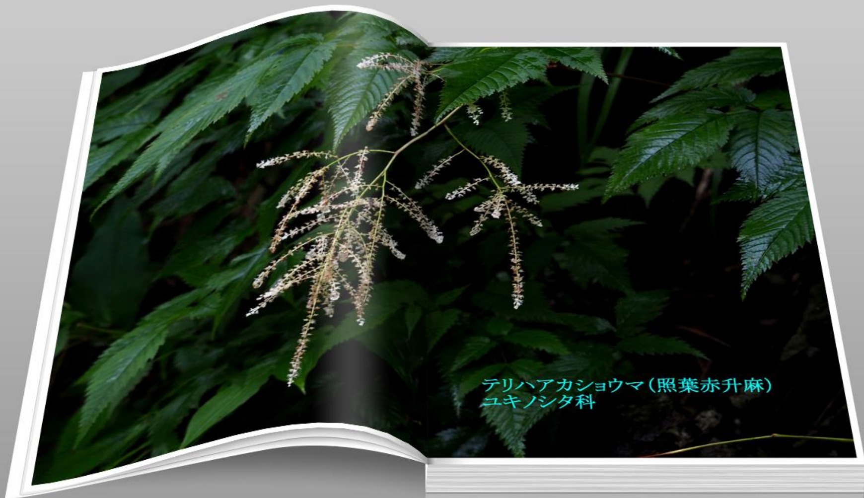
テリハアカショウマ(照葉赤升麻) ユキノシタ科