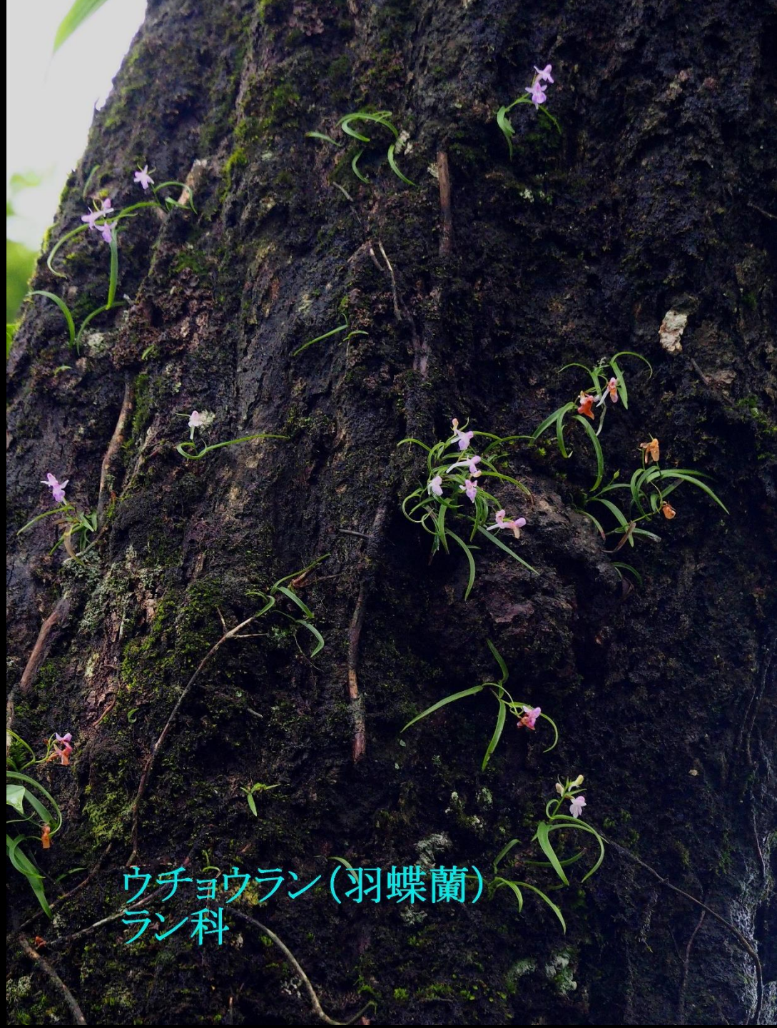
ウチョウラン(羽蝶蘭) ラン科