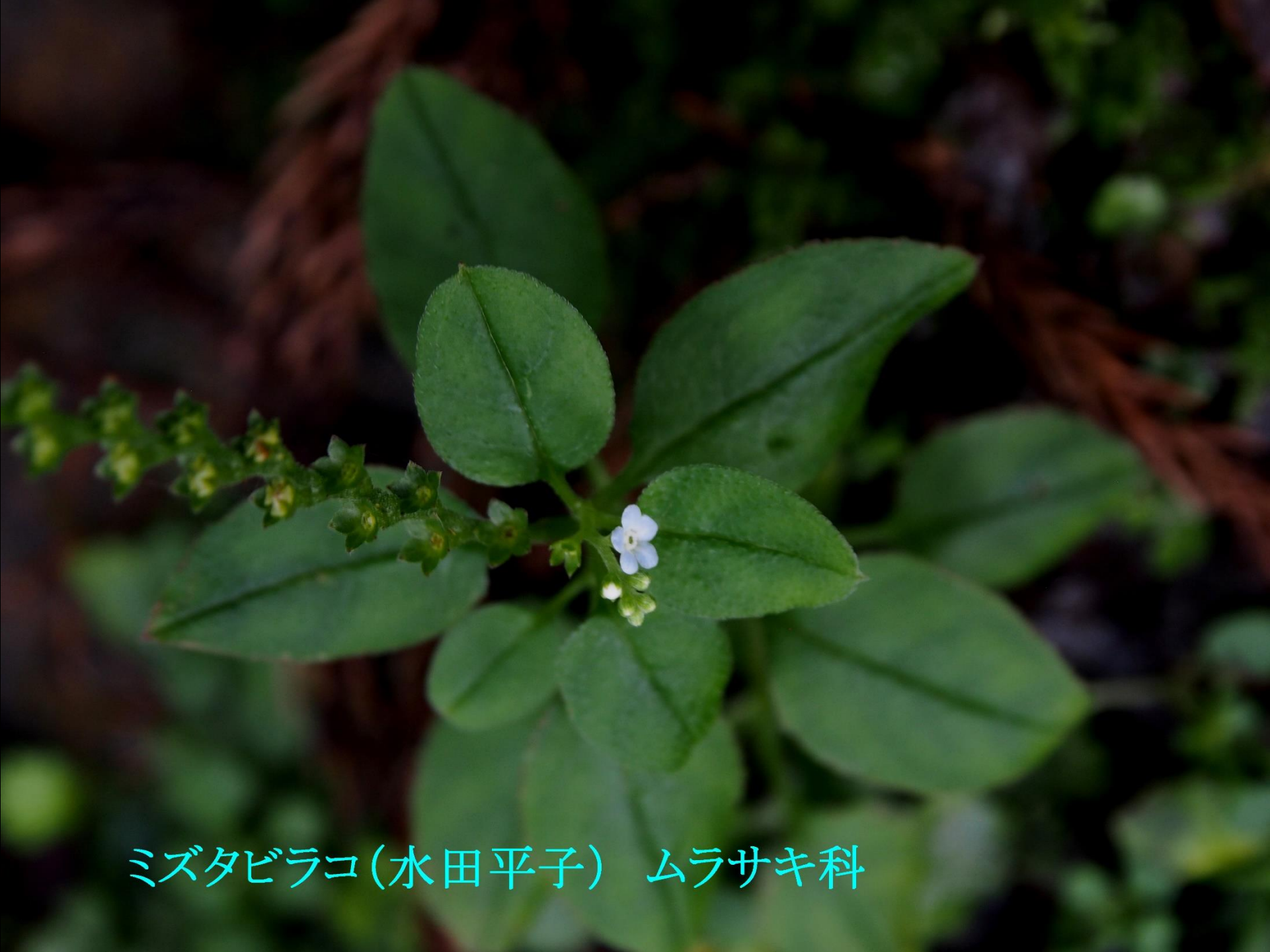
ミズタバコ(水田平子) ムラサキ科