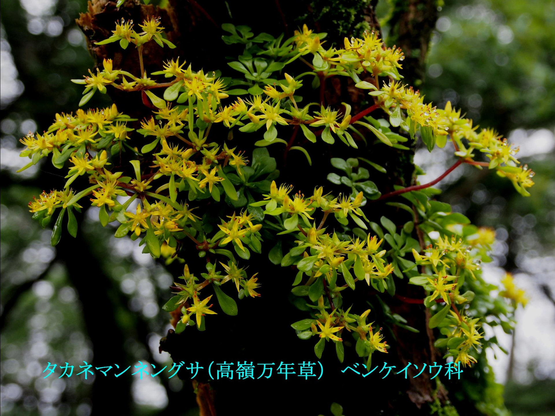
タカネマンネグサ(高嶺万年草) ベンケイソウ科