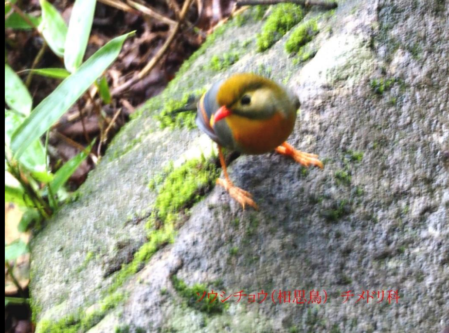
ソウシチョウ(相思鳥) チメドリ科