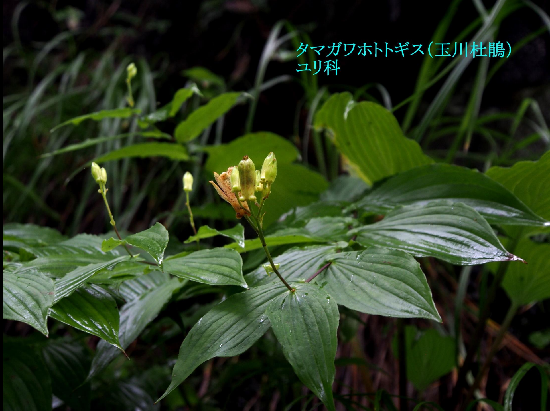
タマガワホトギス(玉川杜鵑) ユリ科