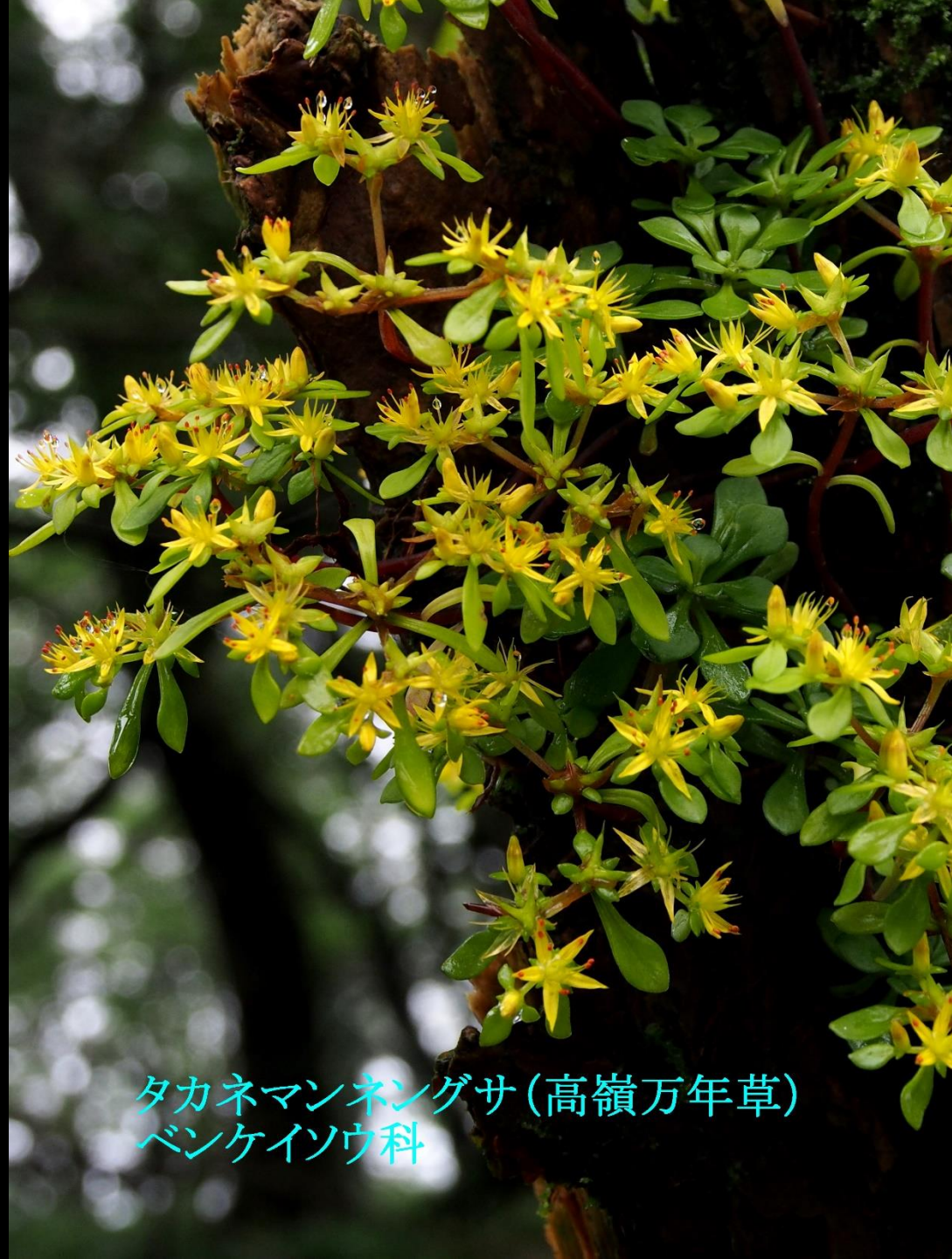
タカネマンネグサ (高嶺万年草) ベンケイソウ科