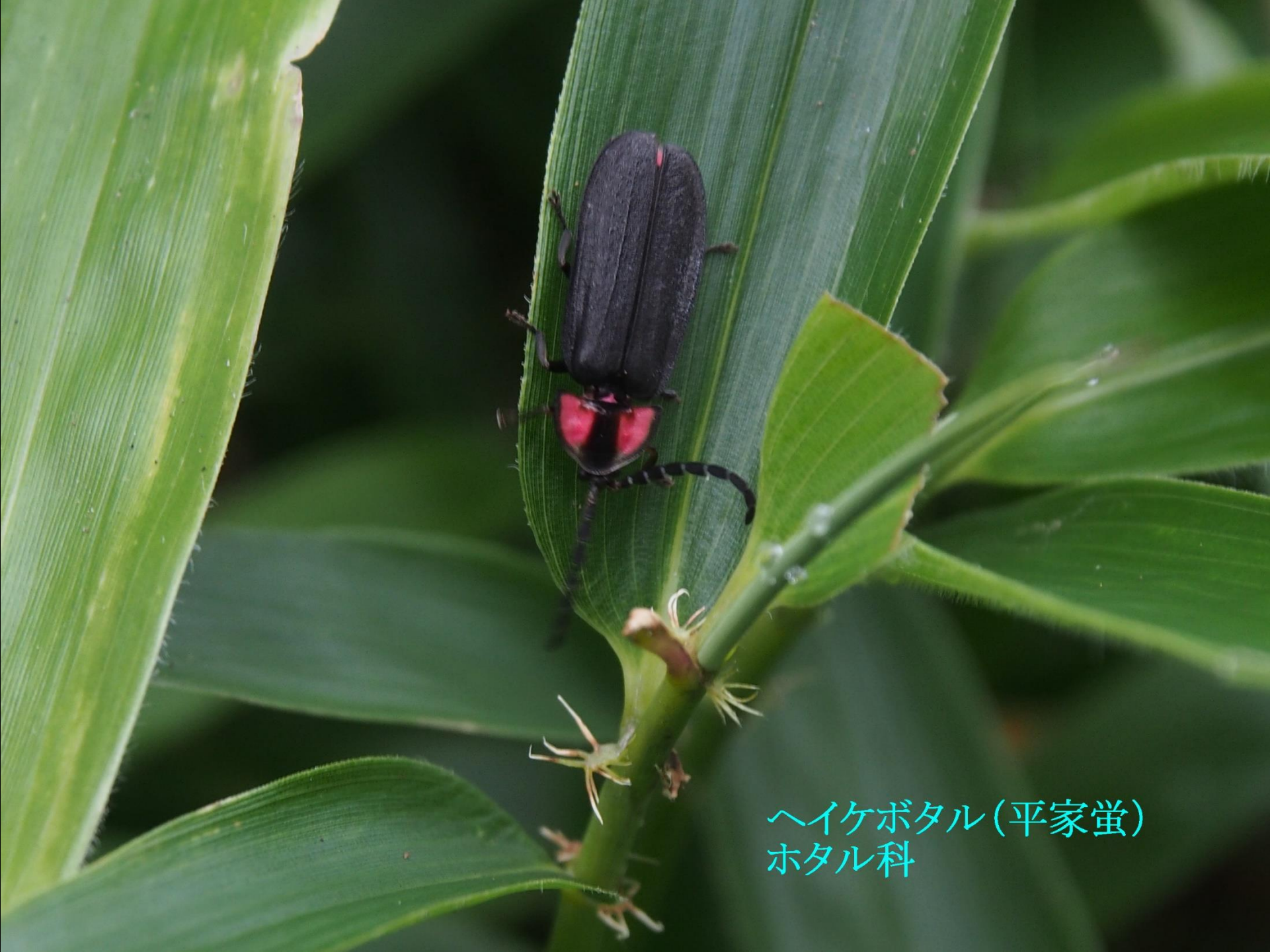
ヘイケボタル(平家蛍) ホタル科