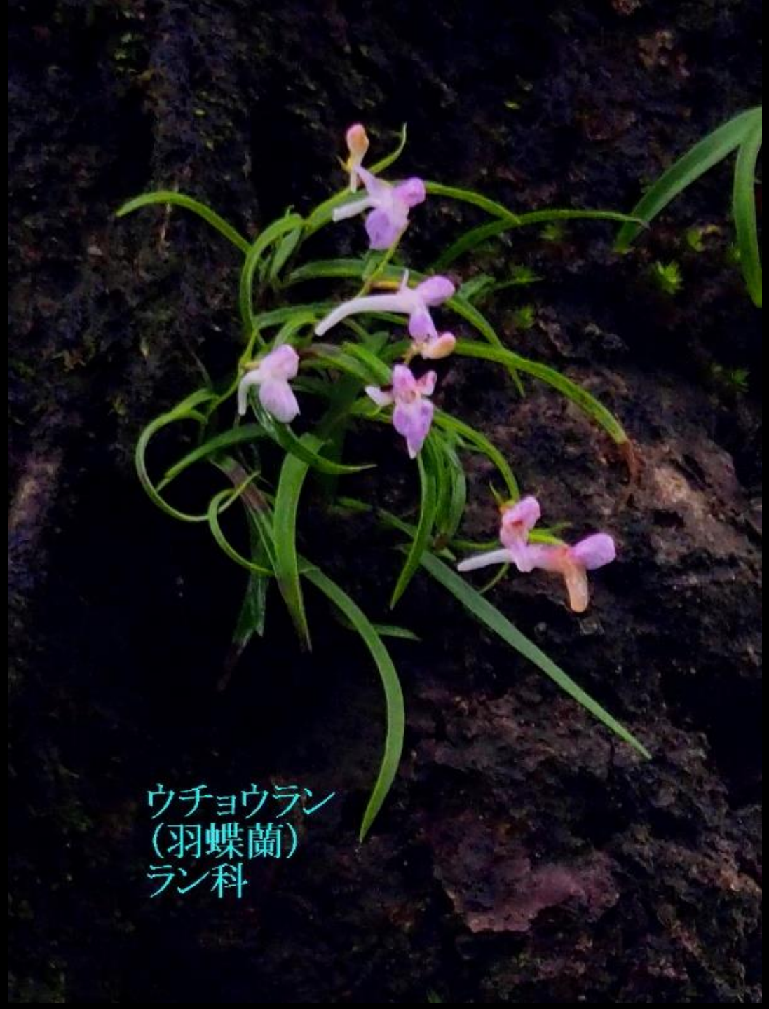
ウチョウラン (羽蝶蘭) ラン科