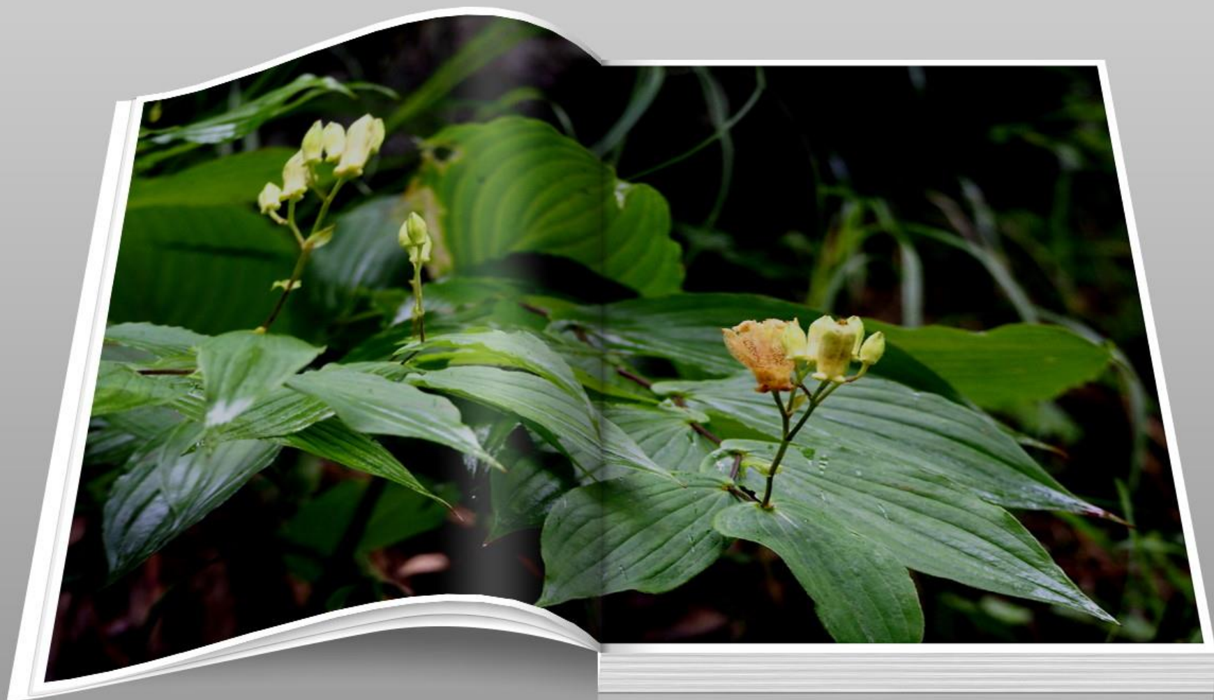
タマガワホトトギス(玉川杜鵑) ユリ科