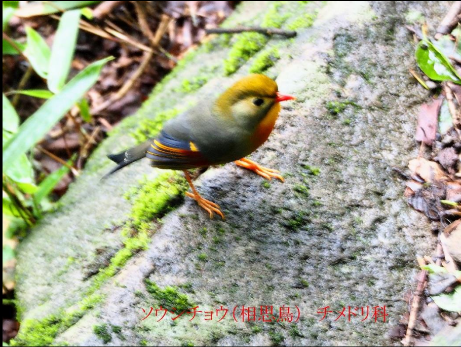
ソウシチョウ(相思鳥) チメドリ科