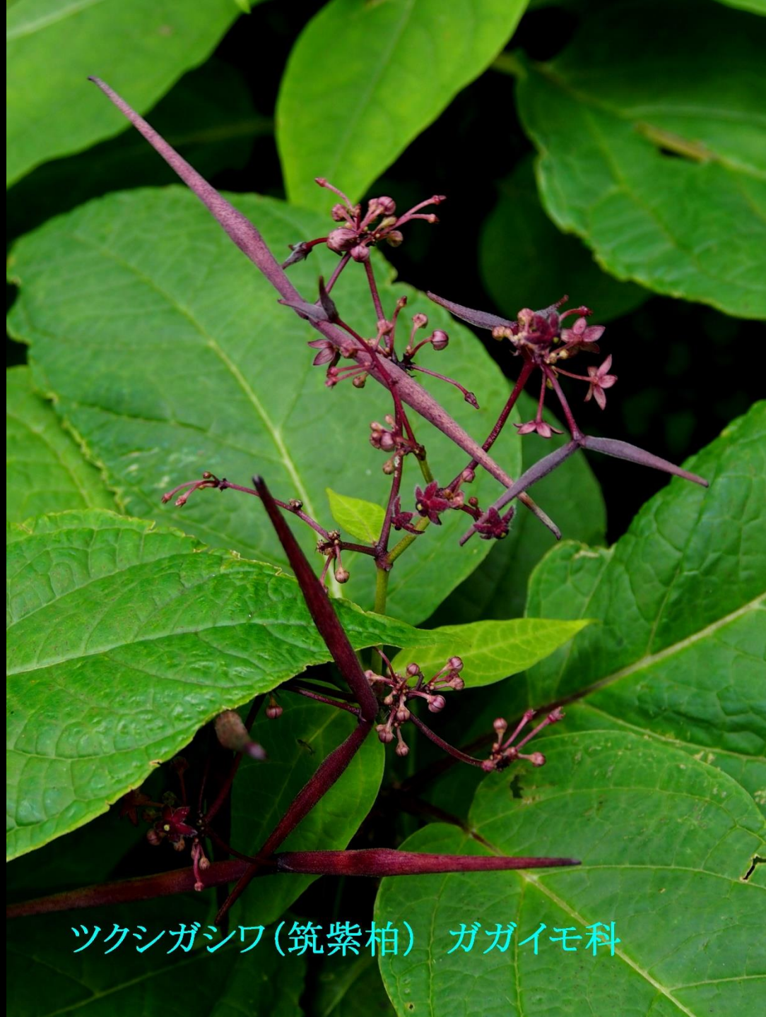
ツクシガシワ(筑紫柏) ガガイモ科