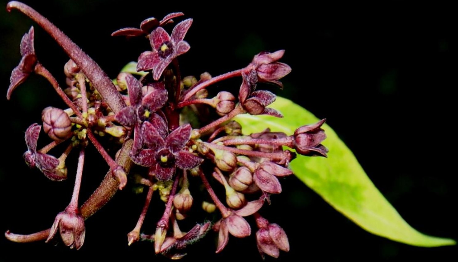
ツクシガシワ(筑紫柏) ガガイモ科