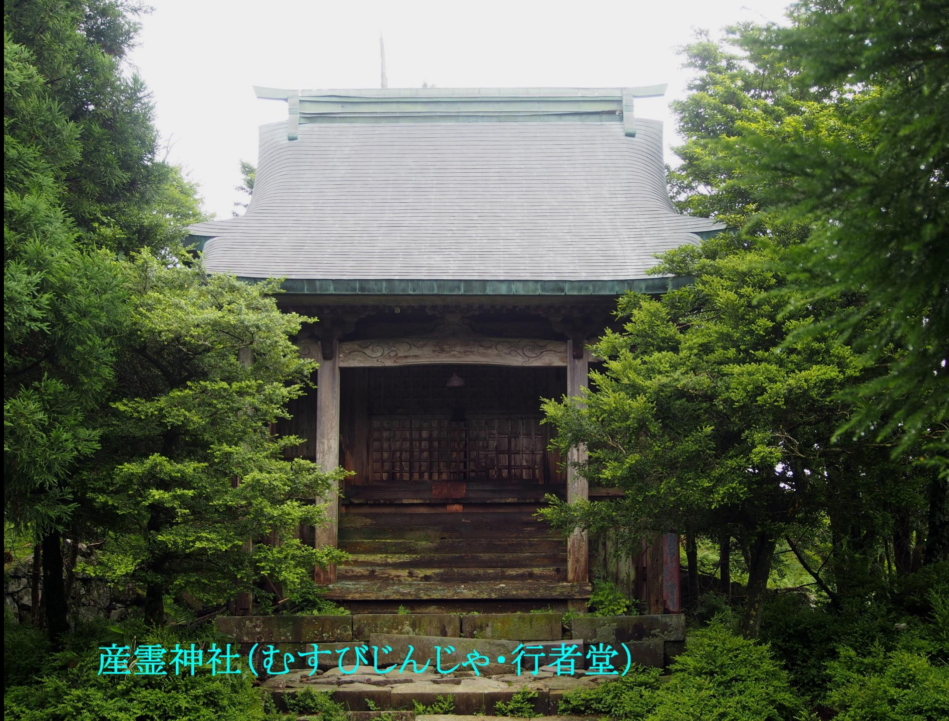
産霊神社(むすびじんじゃ・行者堂)