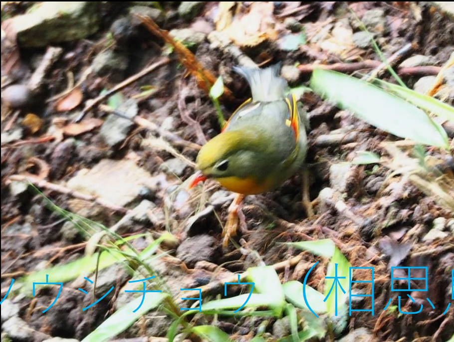
ソウシチョウ(相思鳥)