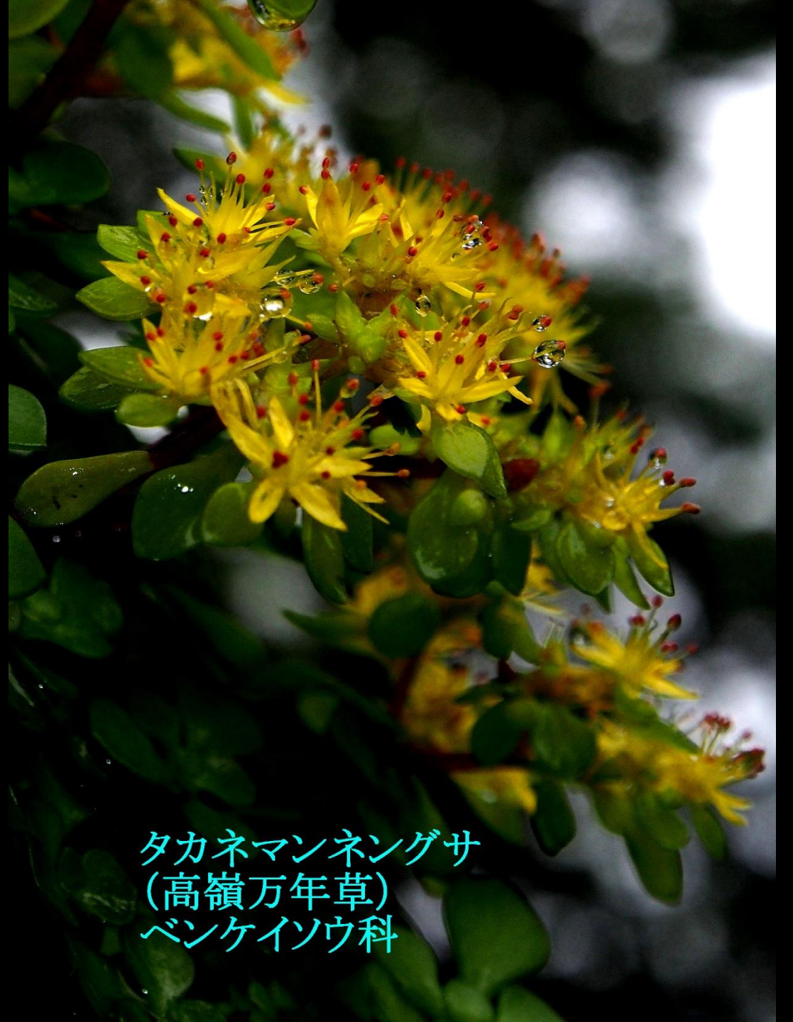
タカネマンネグサ (高嶺万年草) ベンケイソウ科