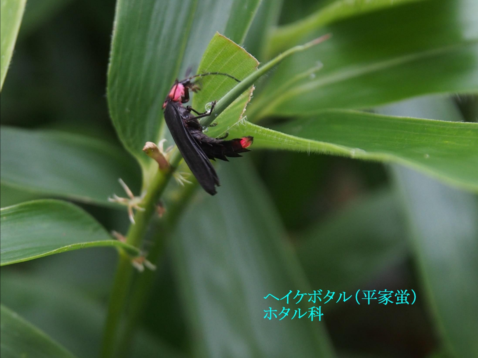
ヘイケボタル(平家蛍) ホタル科