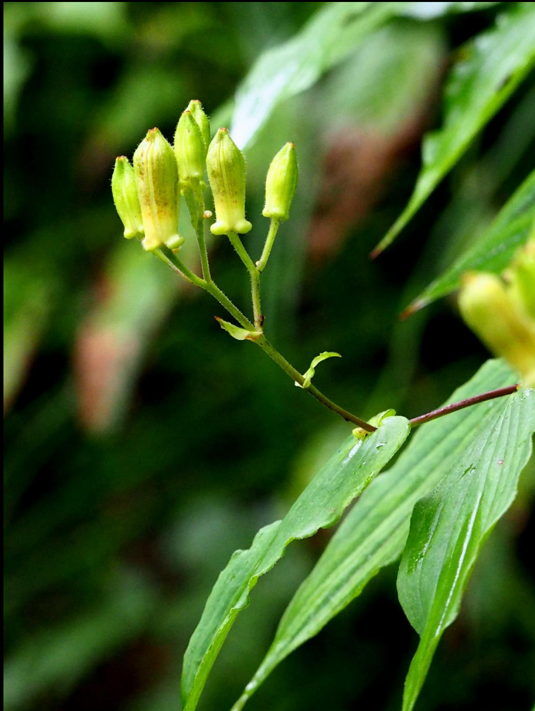
タマガワホトトギス (玉川杜鵑) ユリ科