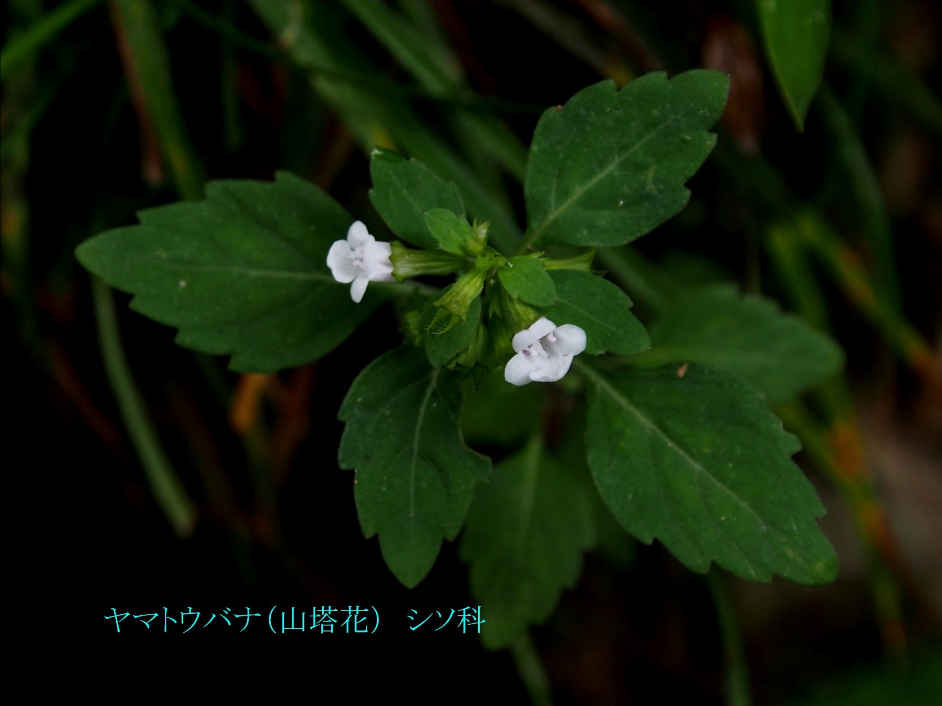
ヤマトウバナ(山塔花) シソ科