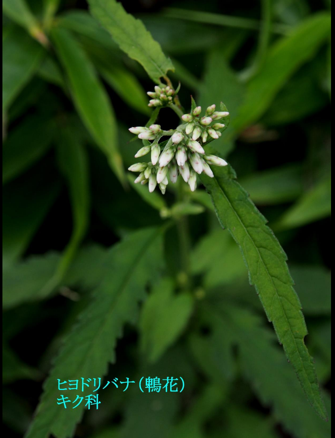
ヒヨドリバナ (鶉花) キク科