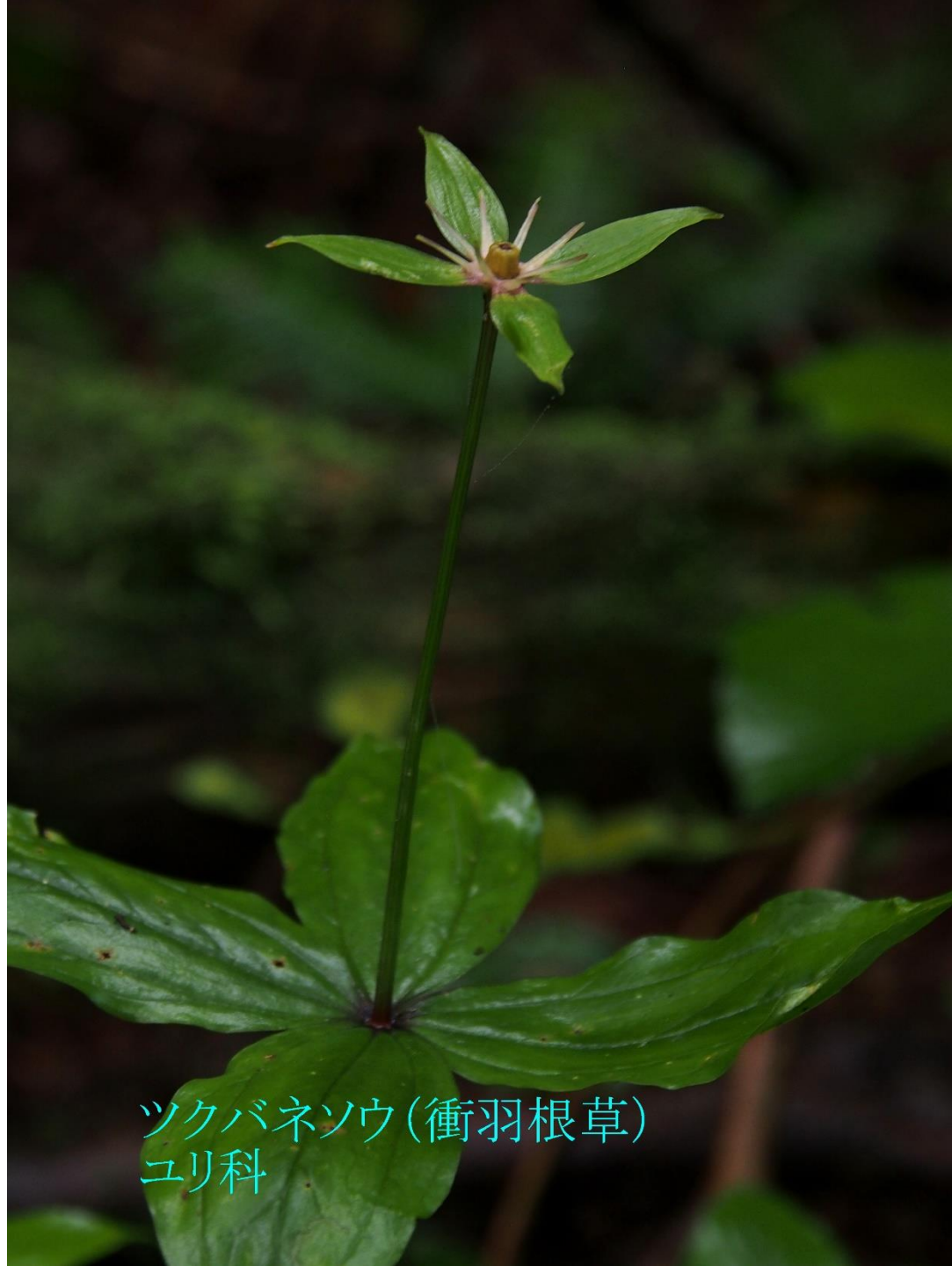
ツクバネソウ(衝羽根草) ユリ科