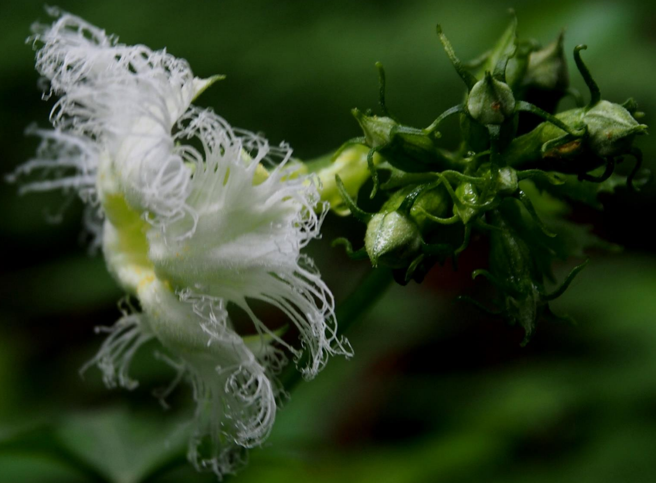
モミジカラスウリ(紅葉烏瓜) ウリ科