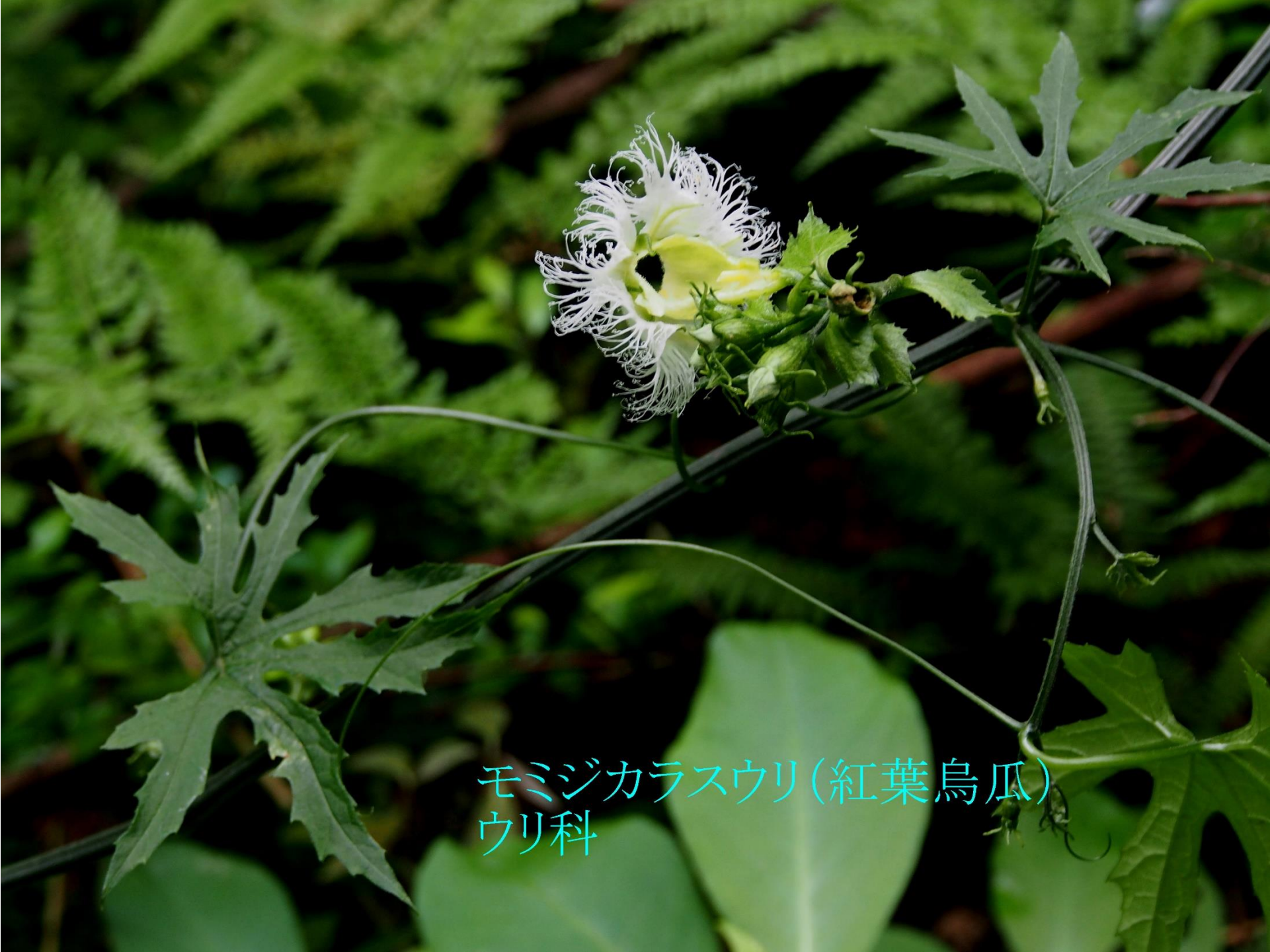
モミジカラスウリ(紅葉烏瓜) ウリ科