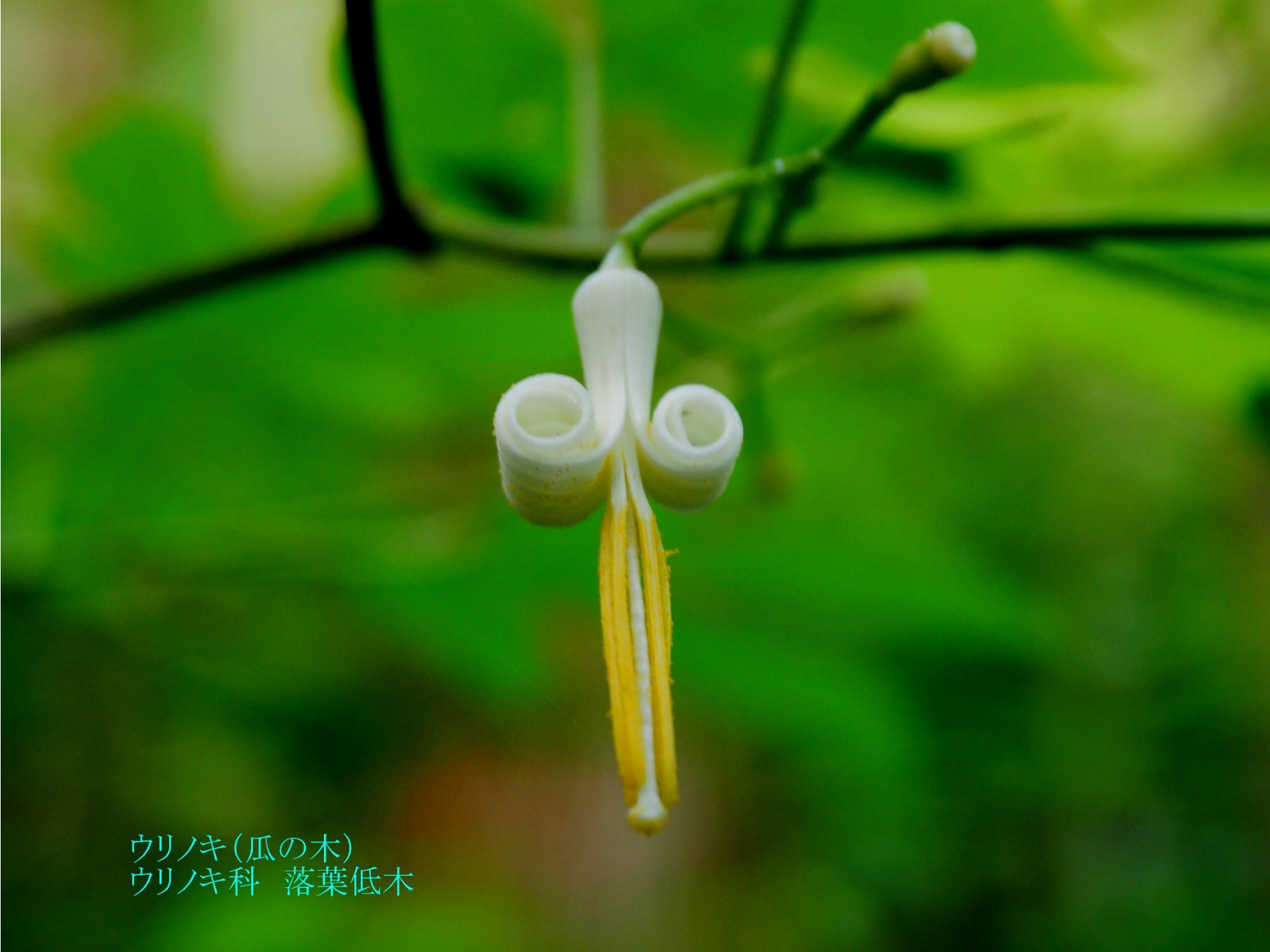
ウリノキ(瓜の木) ウリノキ科 落葉低木