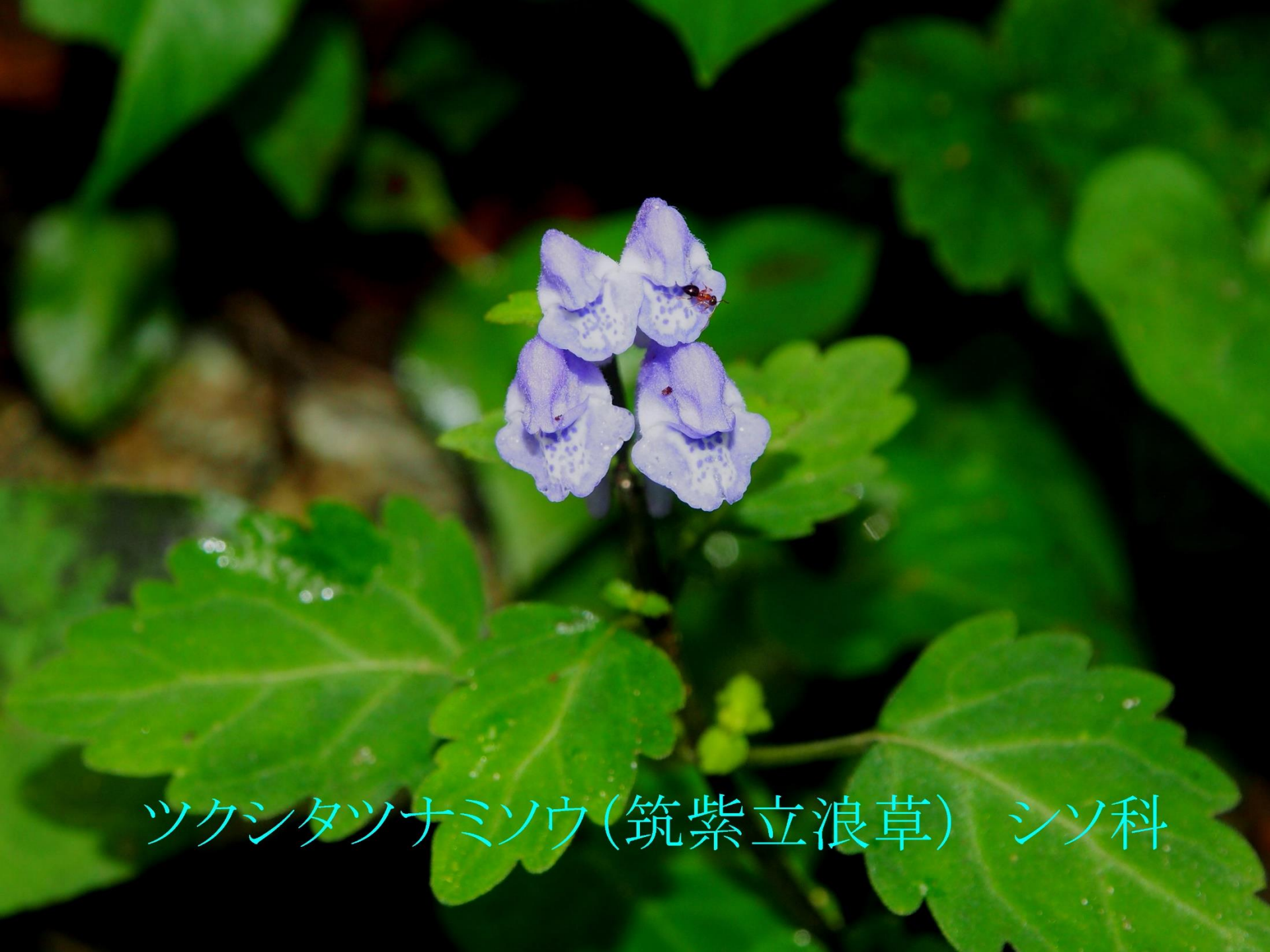
ツクシタツナミソウ(筑紫立浪草) シソ科