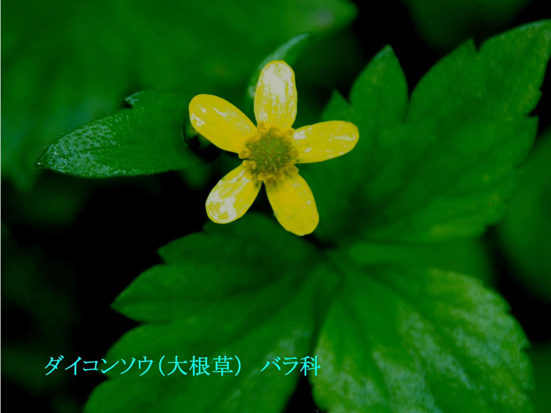
ダイコンソウ(大根草) バラ科