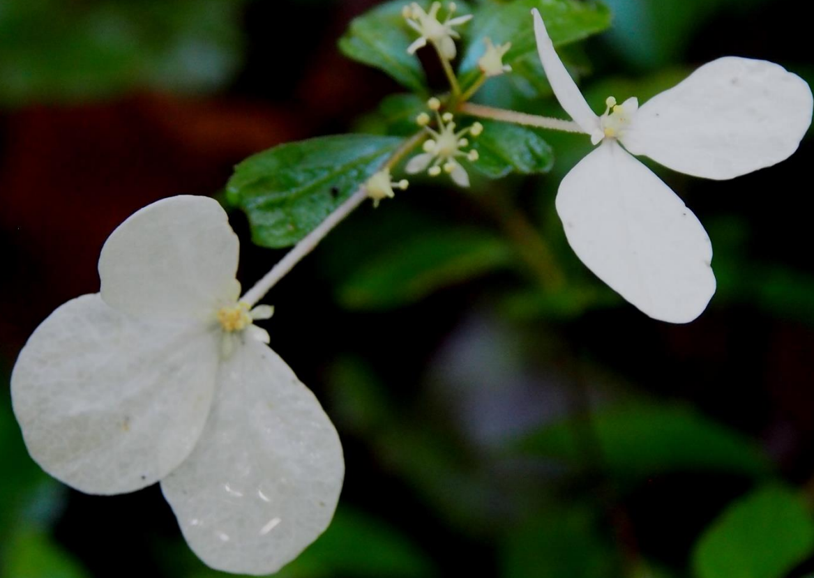
コガクウツギ(小額空木) ユキノシタ科