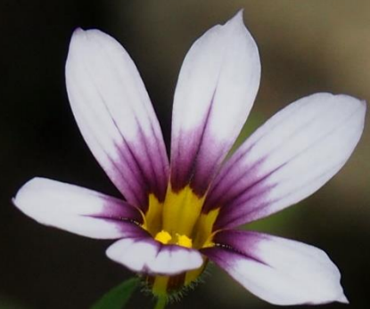
ニワゼキショウ(庭石菖) アヤメ科 帰化植物