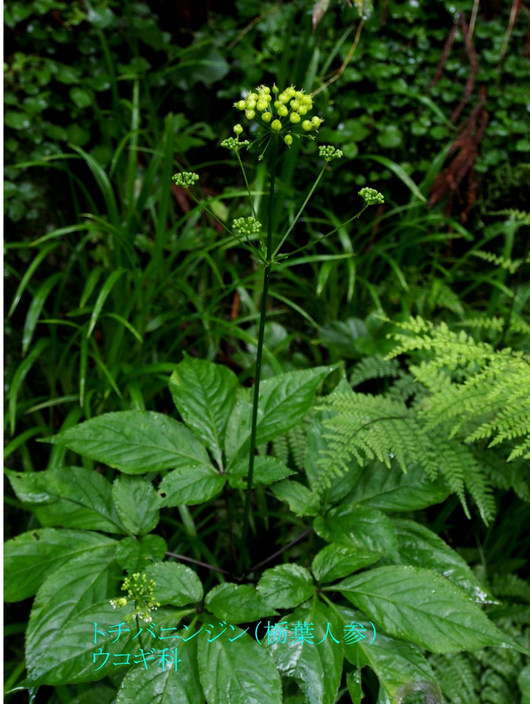
トチバニンジン(栃葉人参) ウコギ科