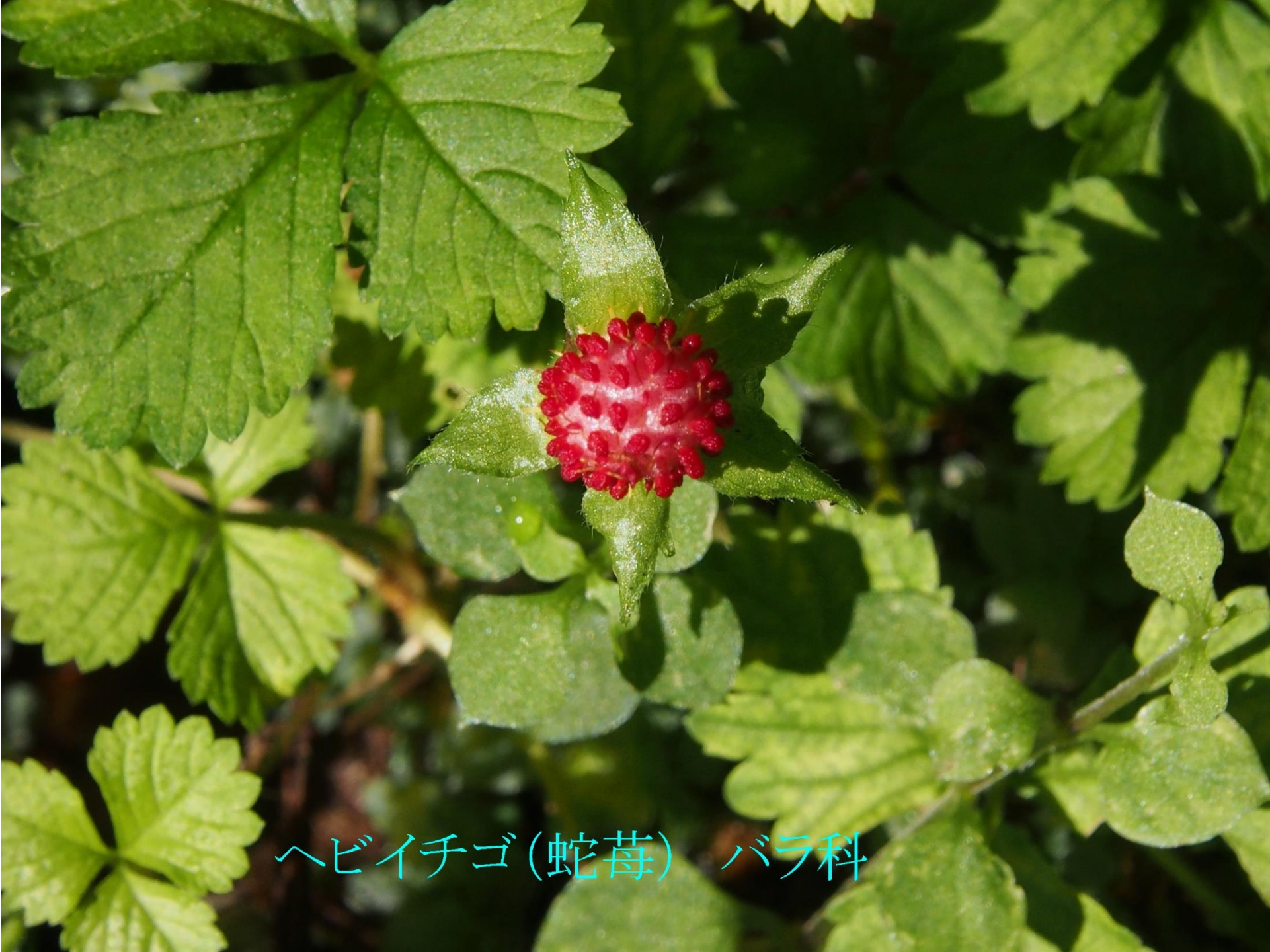
ヘビイチゴ(蛇莓) バラ科