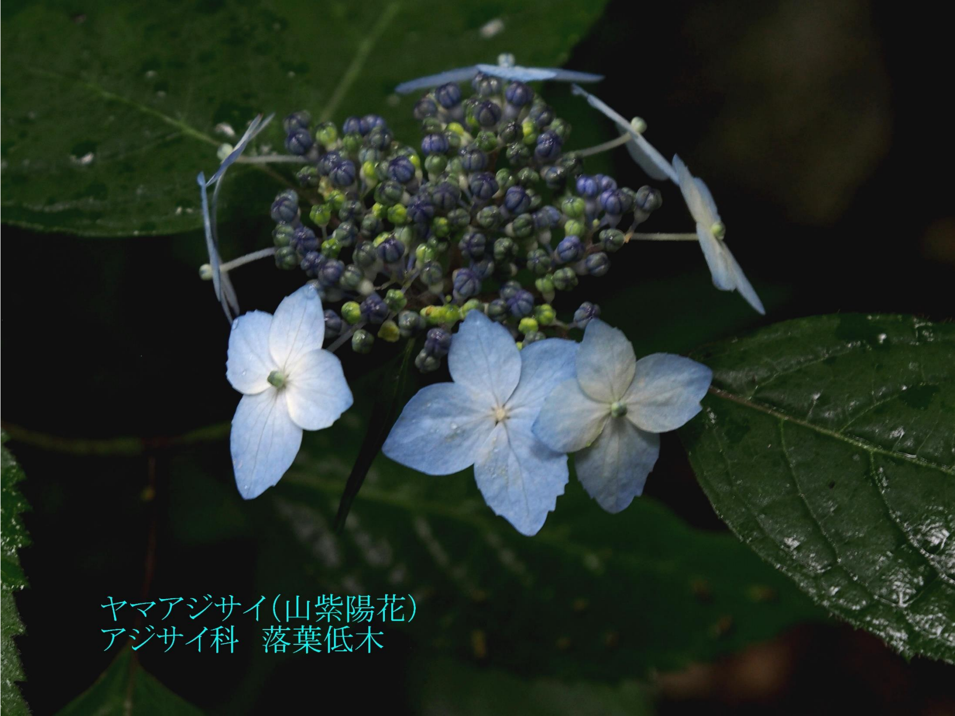
ヤマアジサイ(山紫陽花) アジサイ科 落葉低木