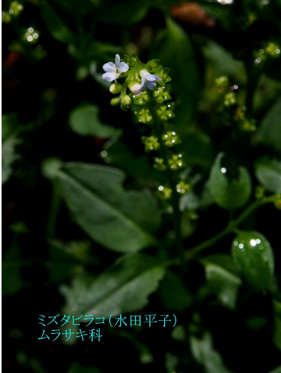
ミズタビラコ(水田平子) ムラサキ科