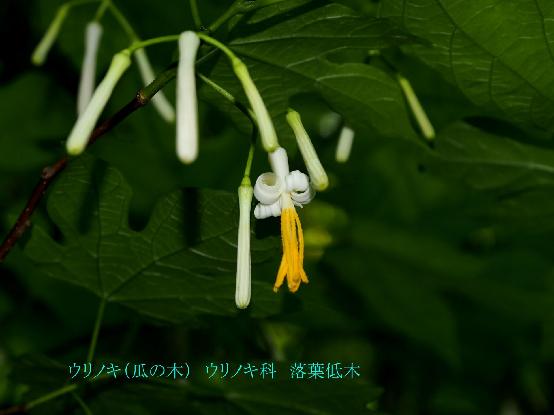
ウリノキ(瓜の木) ウリノキ科 落葉低木