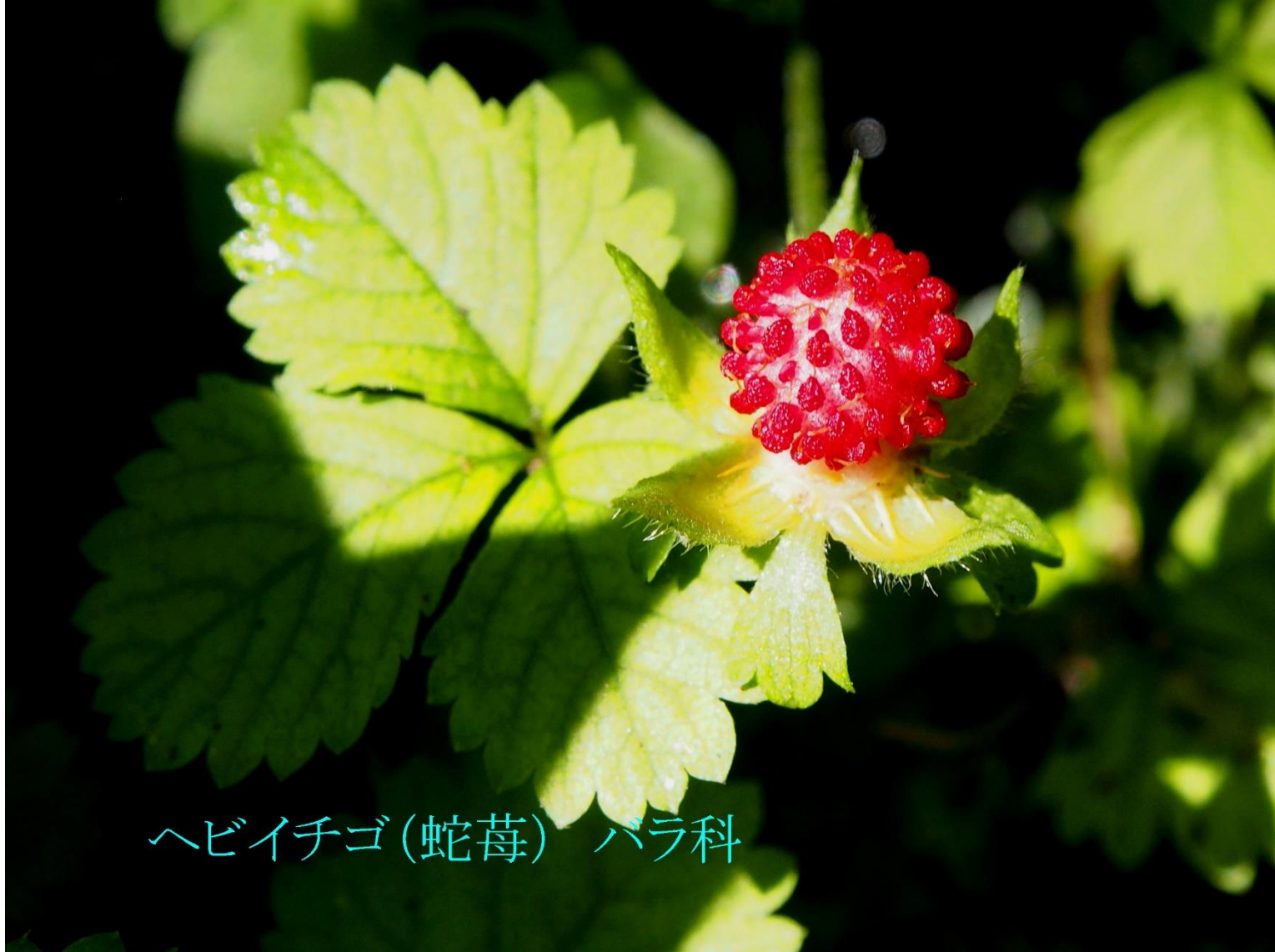
ヘビイチゴ(蛇莓) ハラ科