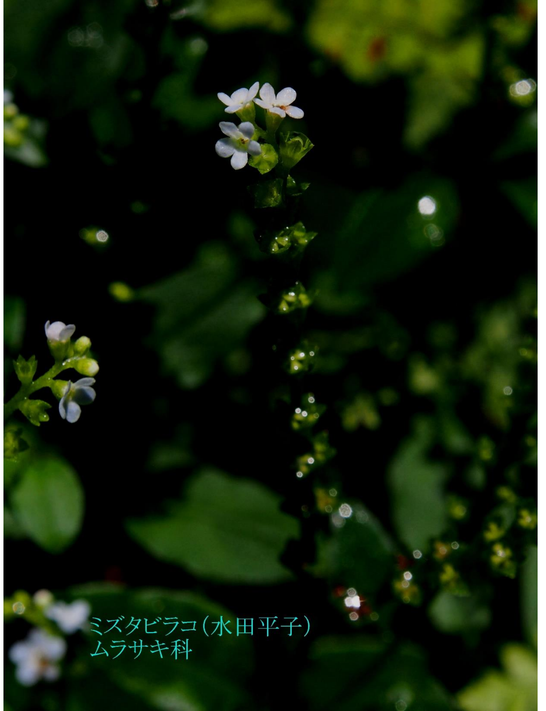
ミズタビラコ(水田平子) ムラサキ科