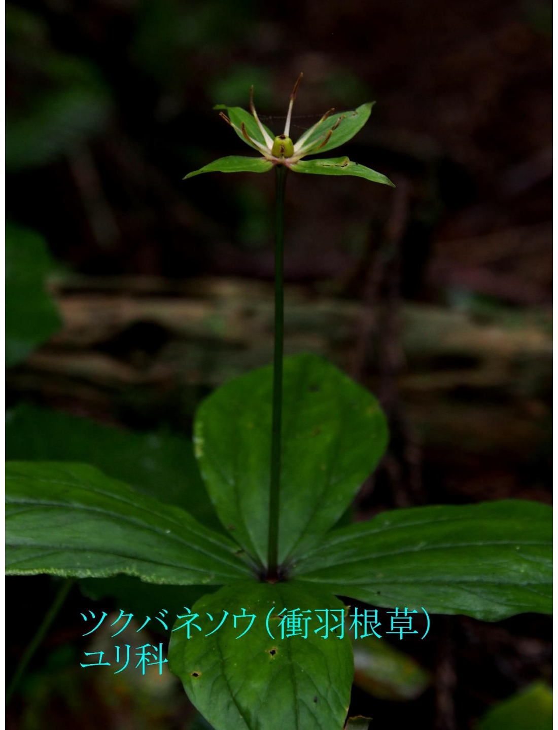
ツクバネソウ(衝羽根草) ユリ科