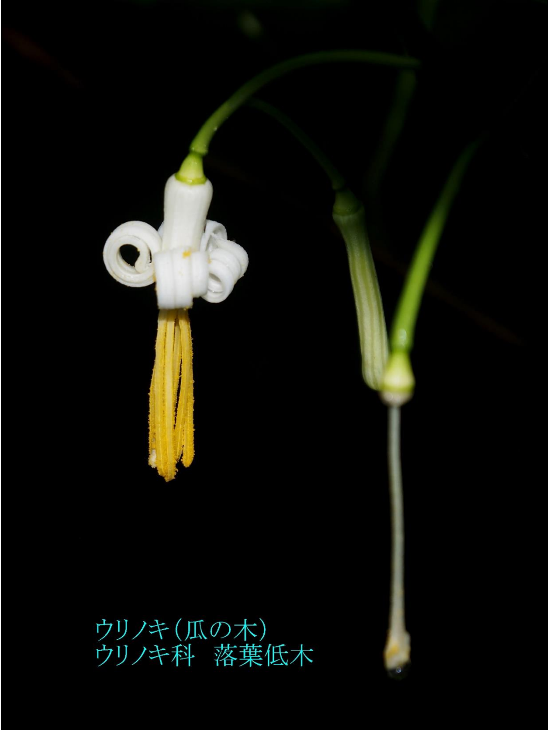
ウリノキ(瓜の木) ウリノキ科 落葉低木