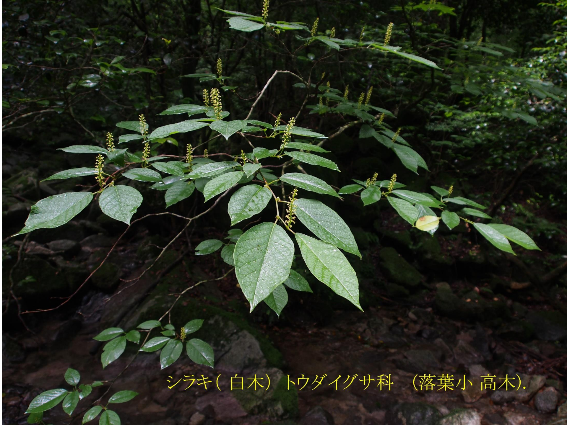
シラキ(白木) トウダイグサ科 (落葉小 高木).