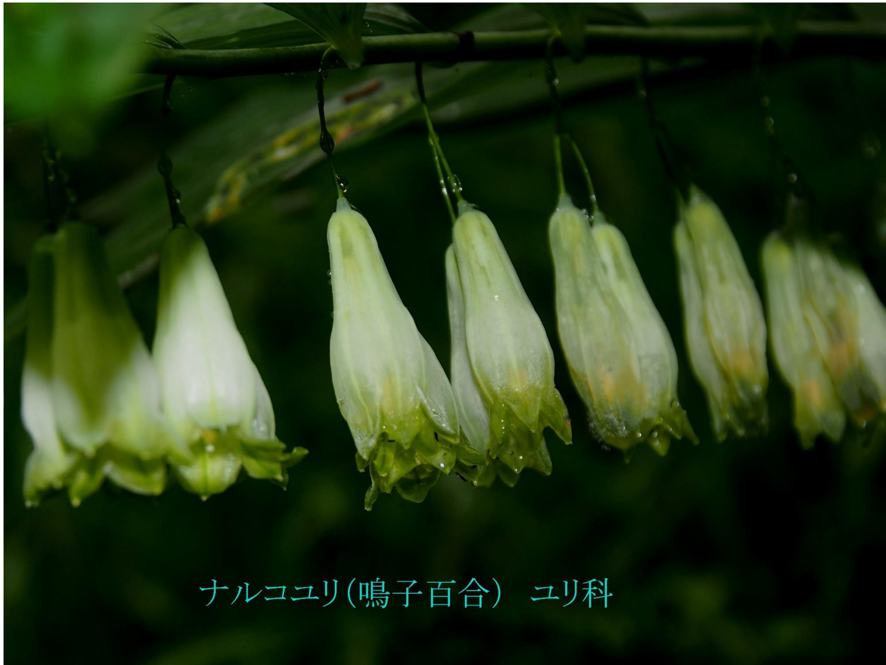
ナルコユリ(鳴子百合) ユリ科