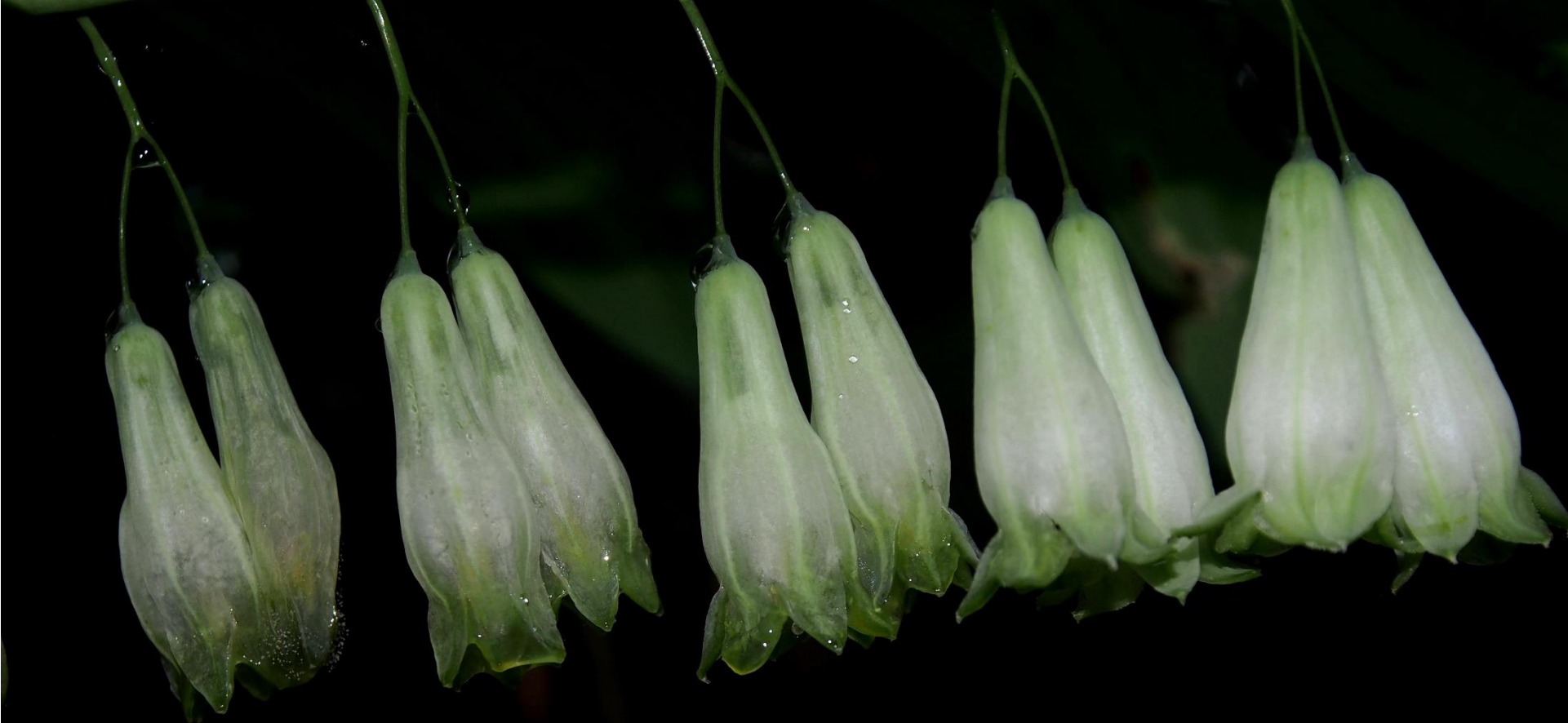
ナルコユリ(鳴子百合) ユリ科