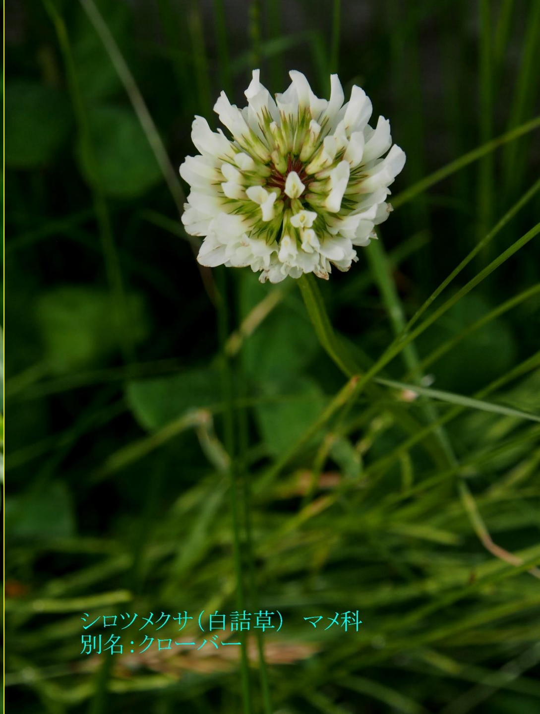
シロツメクサ (白詰草) マメ科 別名: クローバー