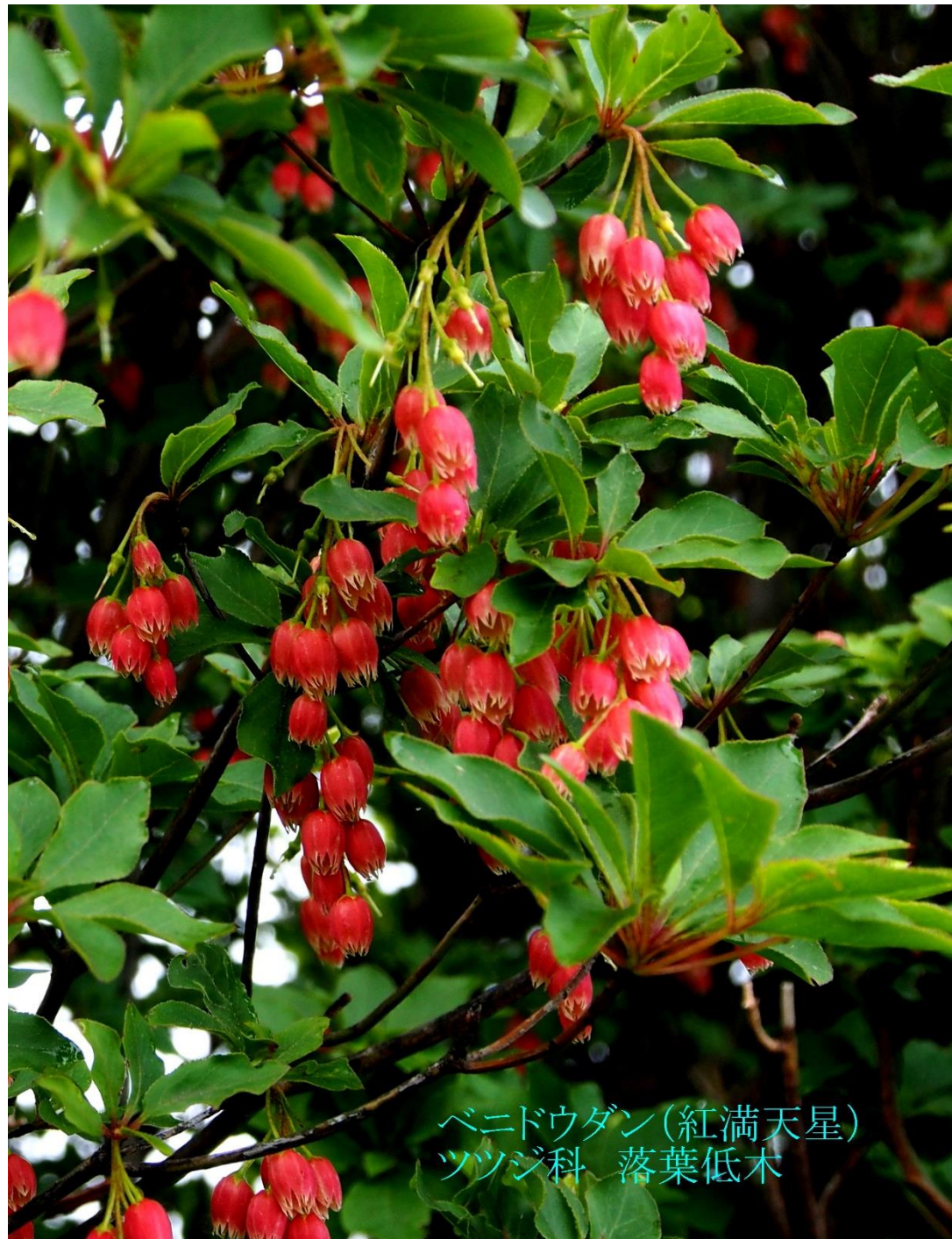
ベニドウダン(紅満天星) ツツジ科 落葉低木