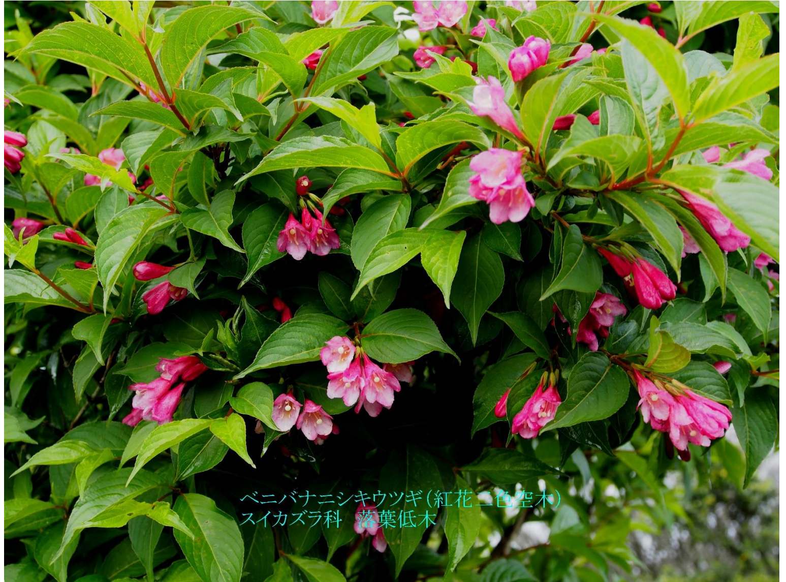
ベニバナニシキウツギ(紅花二色空木) スイカズラ科 落葉低木