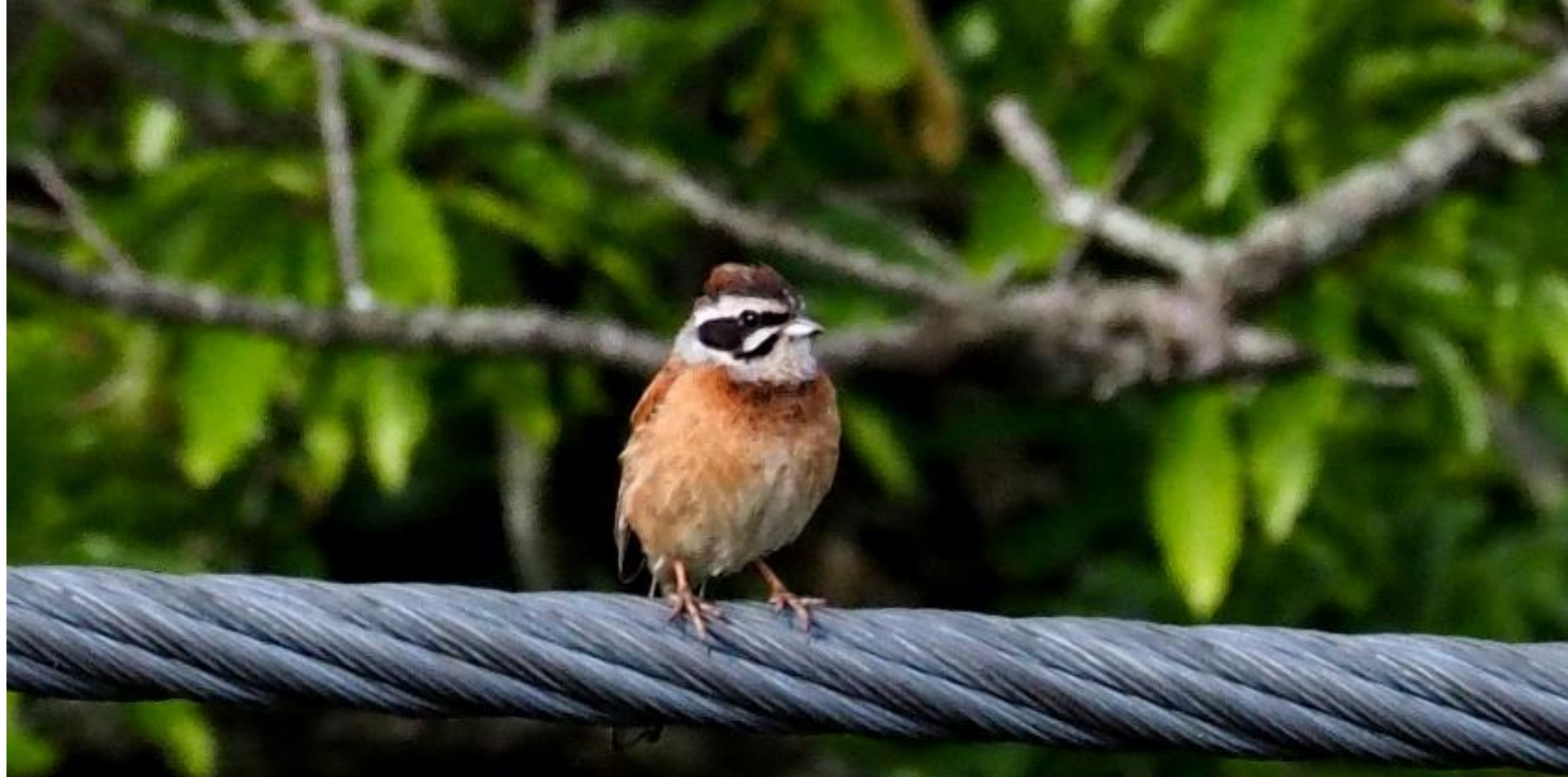
ホオジロ(頬白) ホオジロ科 L=16cm