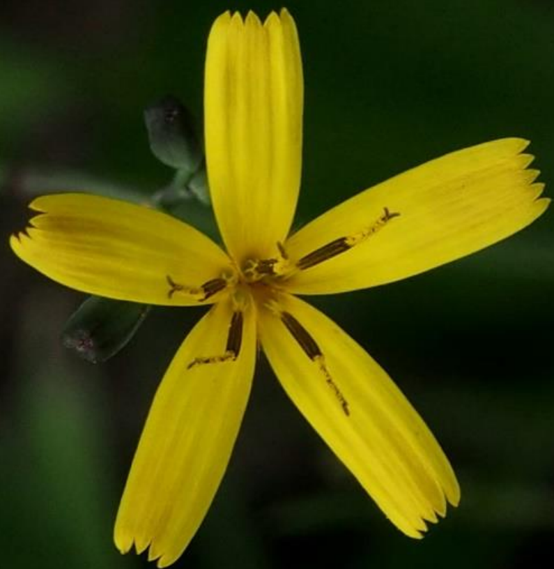
ニガナ(苦菜) キク科