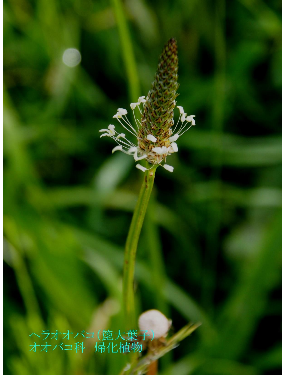
ヘラオオバコ(笹大葉子) オオバコ科 帰化植物