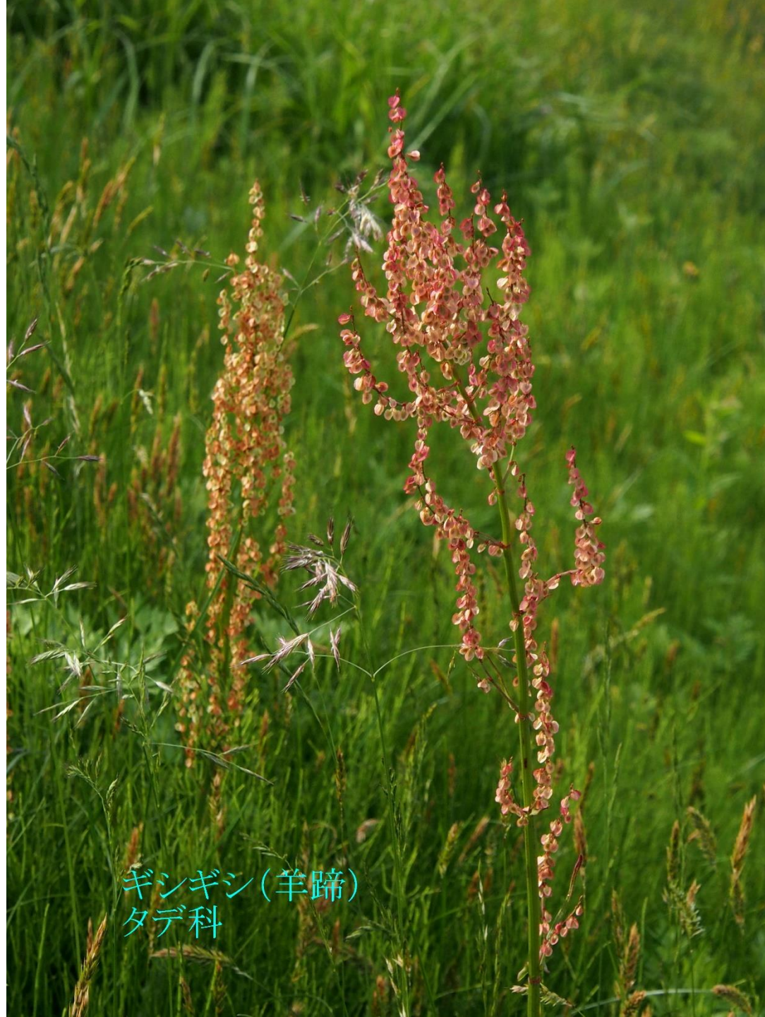
ギンギン(羊蹄) タデ科