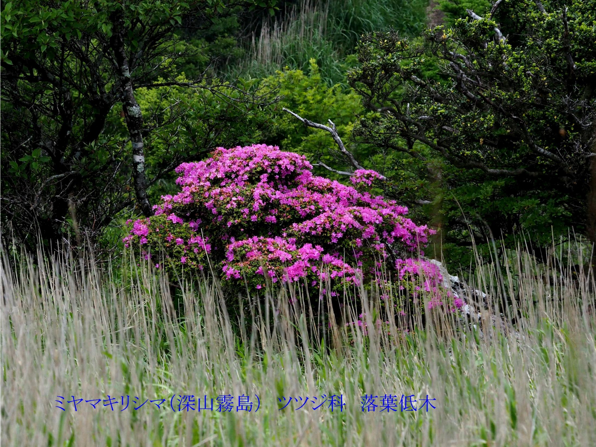
ミヤマキリシマ(深山霧島) ツツジ科 落葉低木