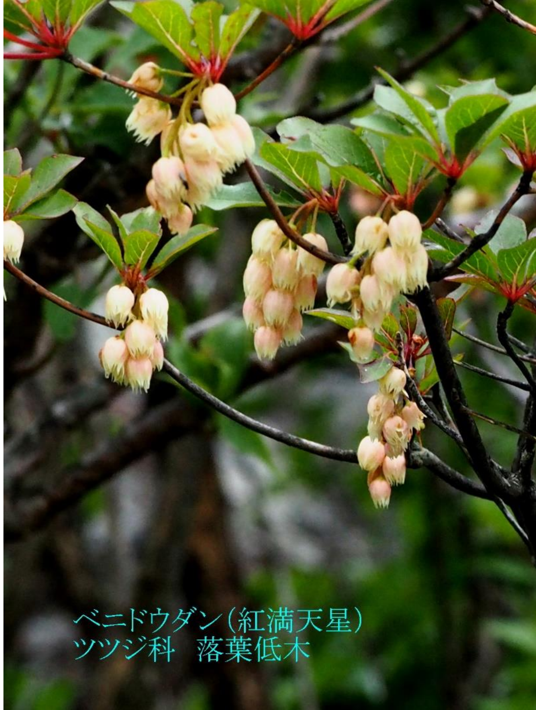
ベニドウダン(紅満天星) ツツジ科 落葉低木