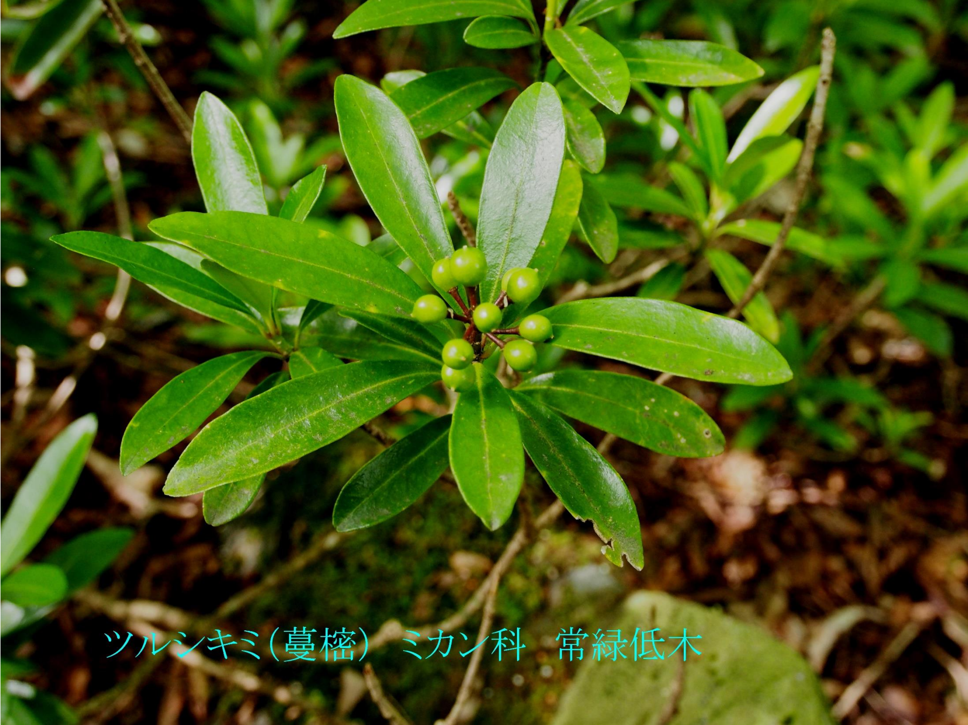
ツルシキミ(蔓櫛) ミカン科 常緑低木