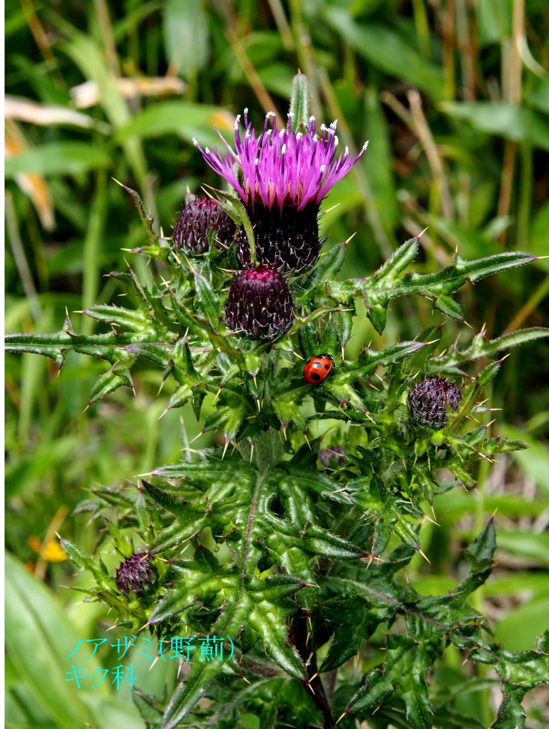
ノアザミ(野薊) キク科