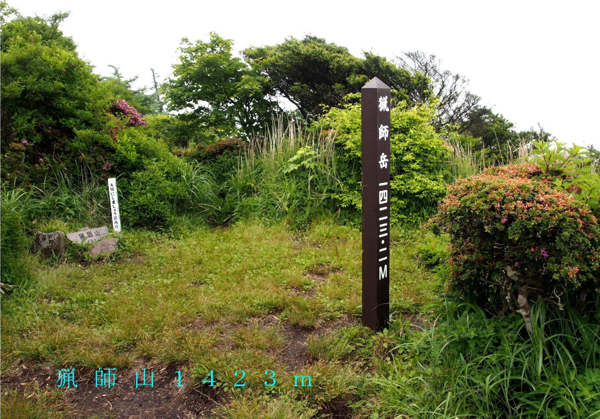
獵師山 1423 m