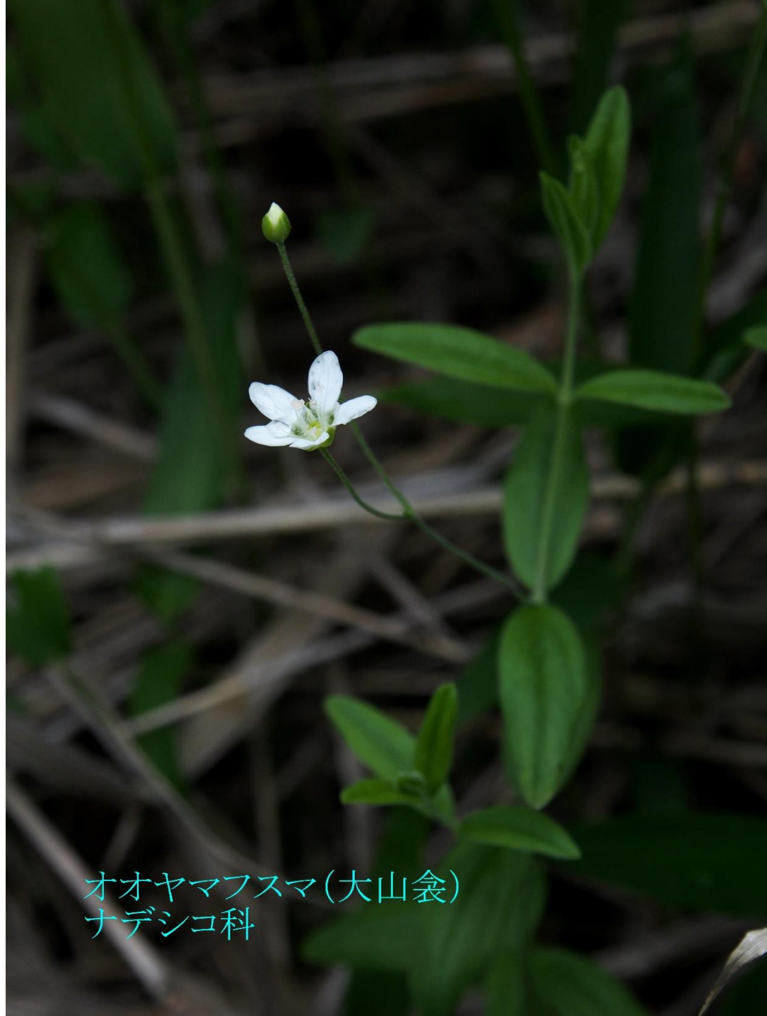
オオヤマフスマ(大山衾) ナデシコ科