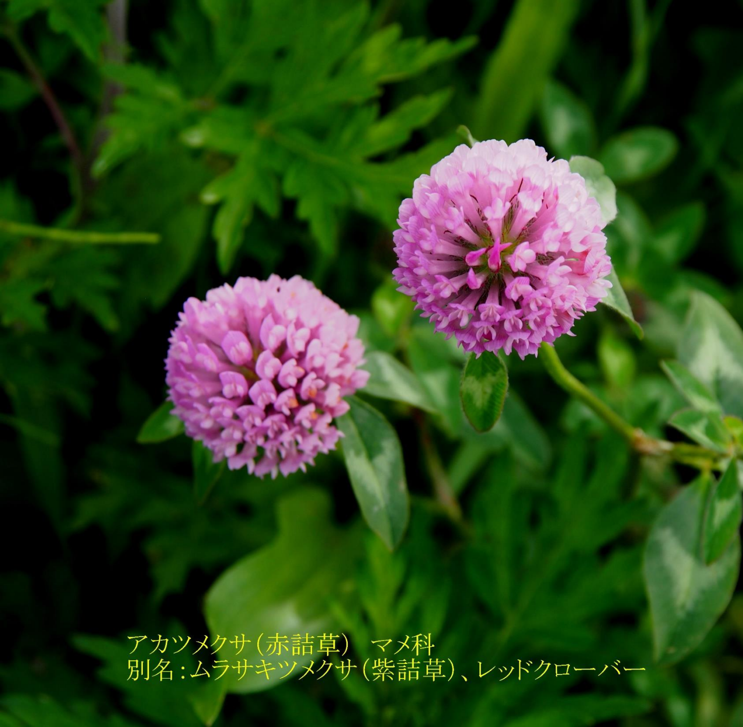
アカツメクサ (赤詰草) マメ科 別名: ムラサキツメクサ (紫詰草)、レッドクローバー