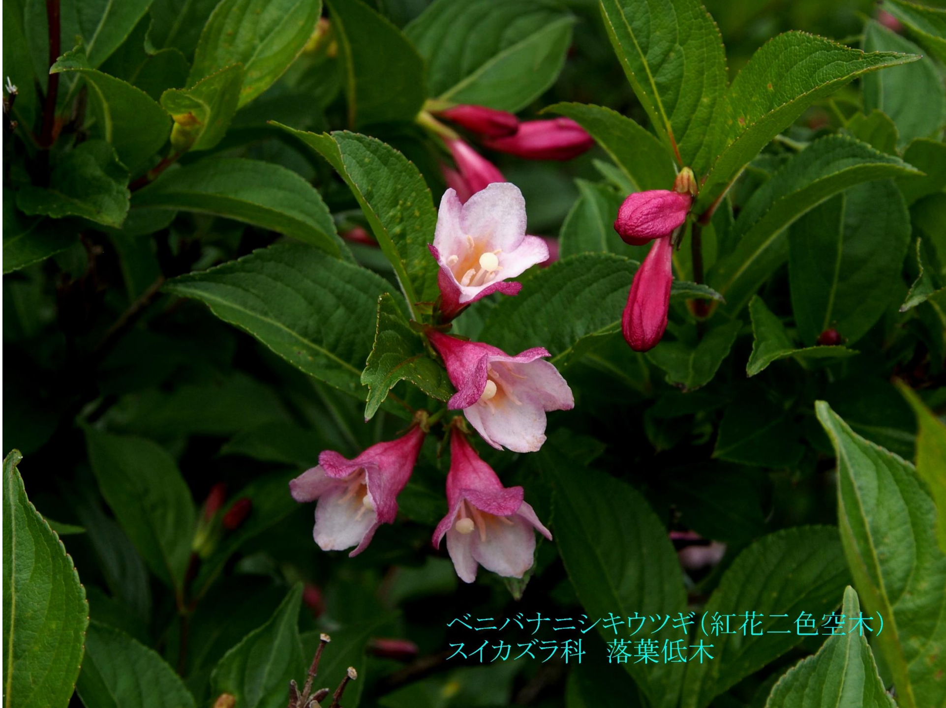
ベニバナニシキウツギ(紅花二色空木) スイカズラ科 落葉低木