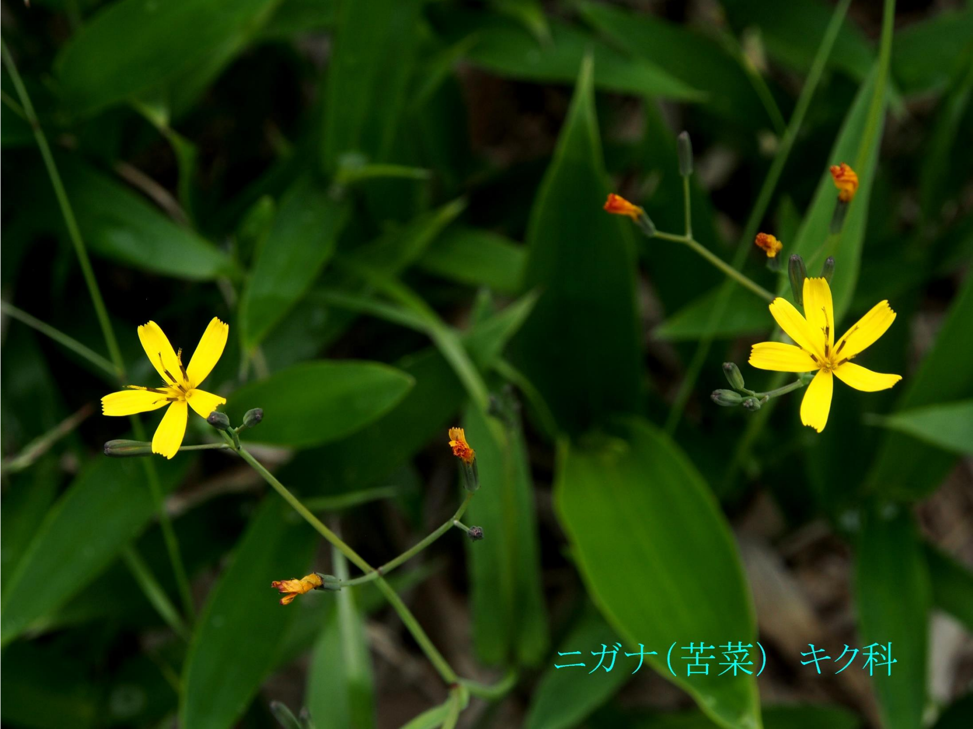
ニガナ(苦菜) キク科