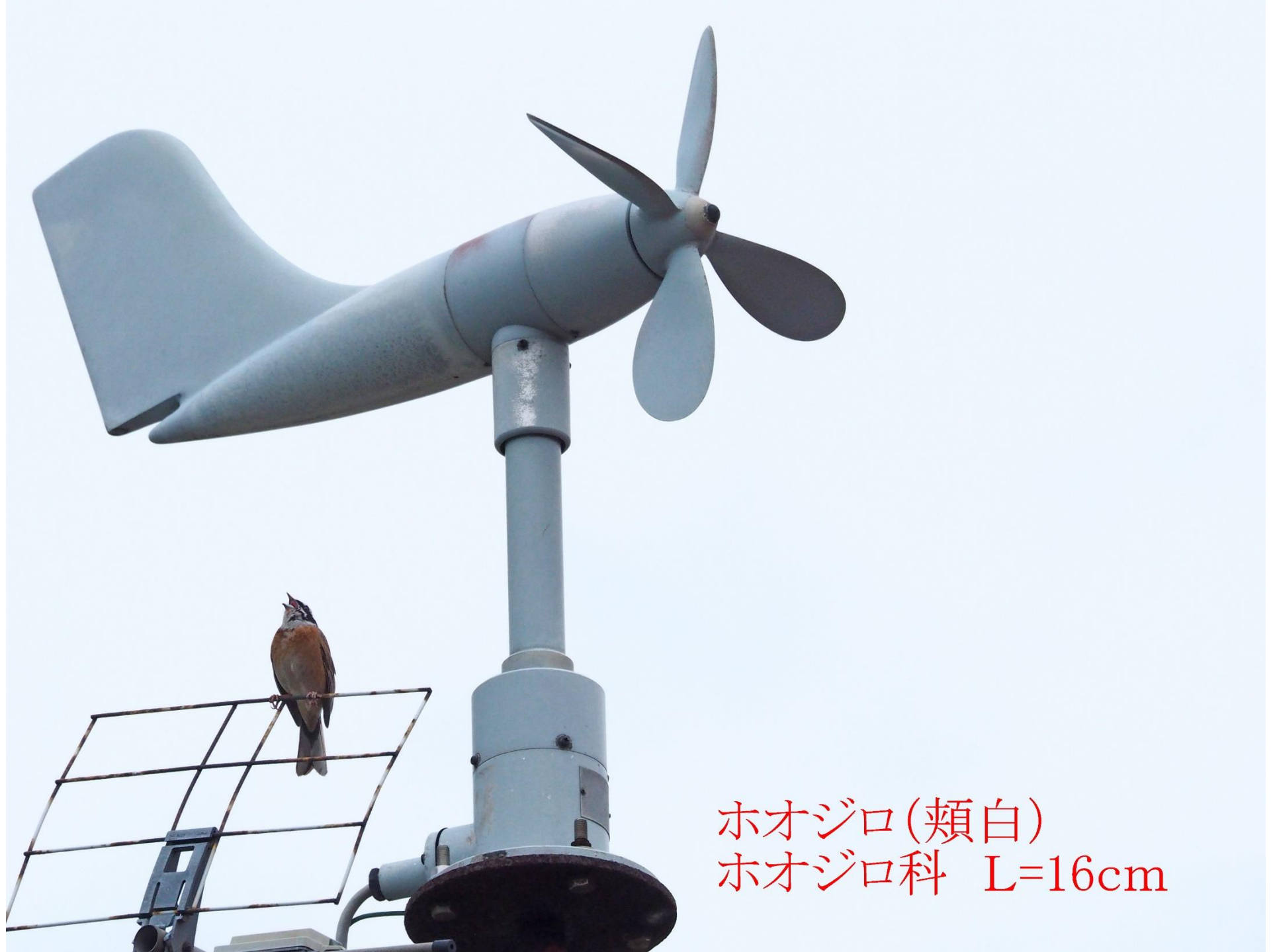
ホオジロ(頬白) ホオジロ科 L=16cm