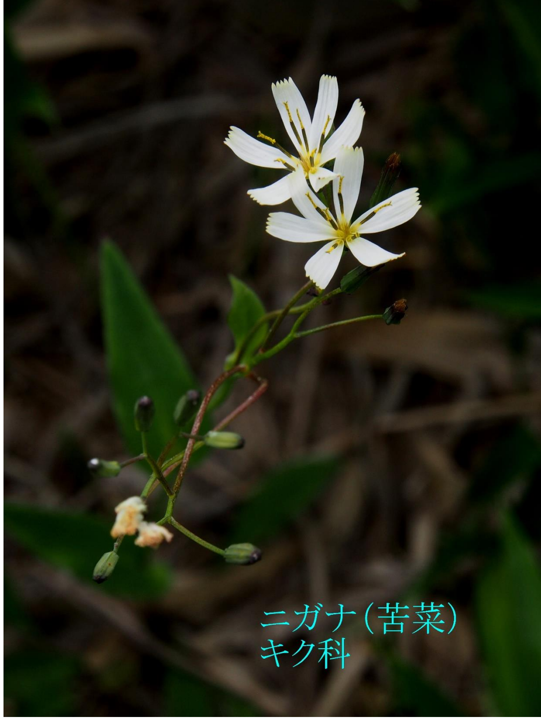
ニガナ(苦菜) キク科