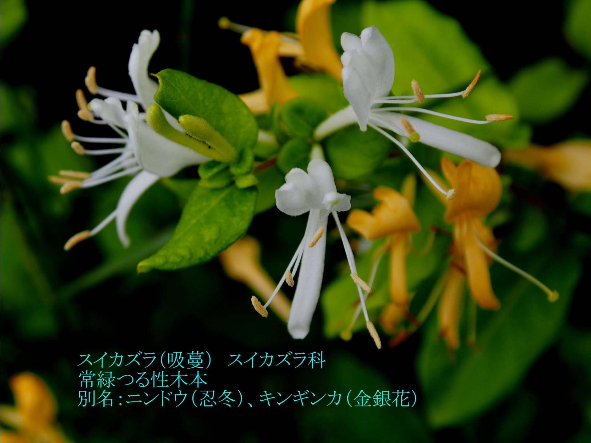
スイカズラ(吸蔓) スイカズラ科 常緑つる性木本 別名:ニンドウ(忍冬)、キンギンカ(金銀花)