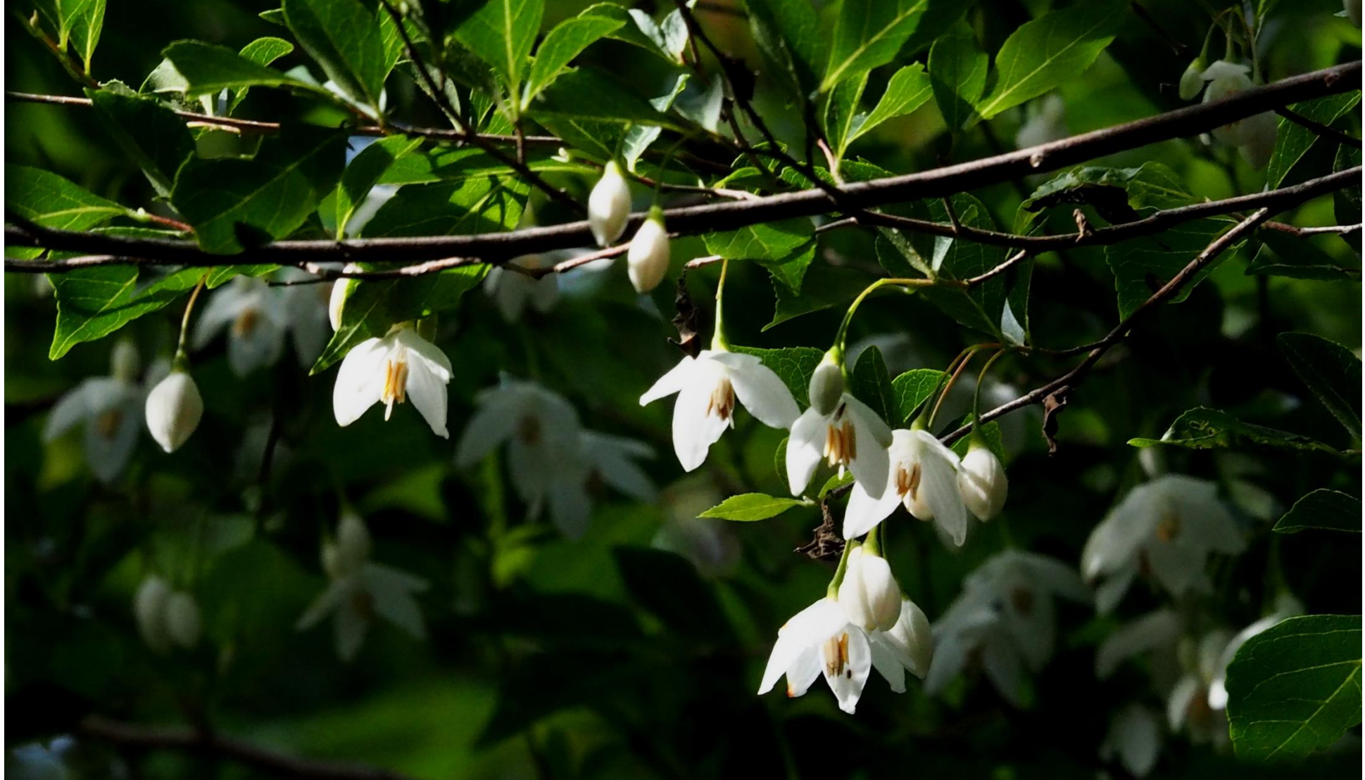
エゴノキ(エゴノキ) エゴノキ科落葉高木 別名: 蒿苳の木(ちしゃのき)、轆轤木(ろくろぎ) 有毒植物