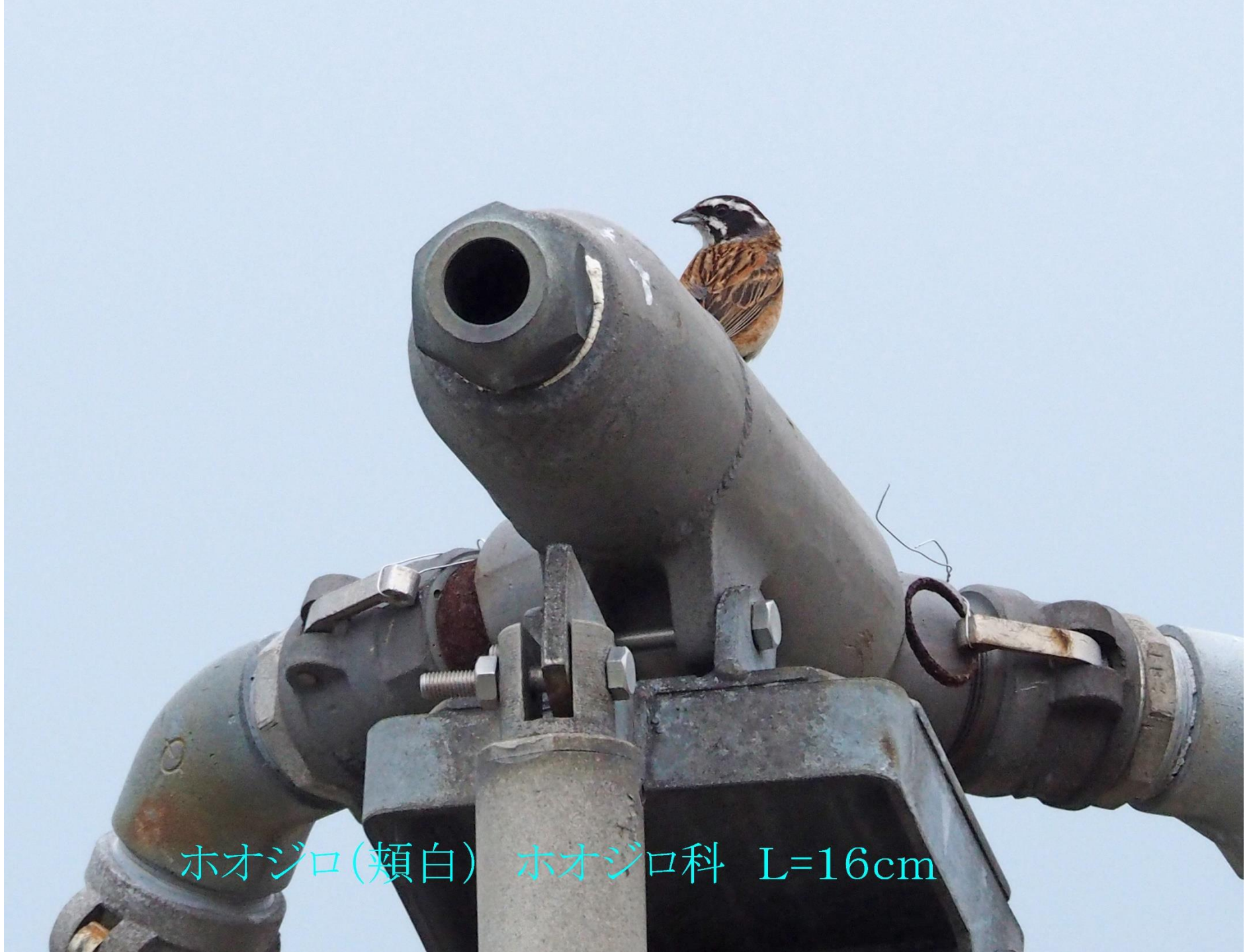
ホオジロ(頬白) ホオジロ科 L=16cm