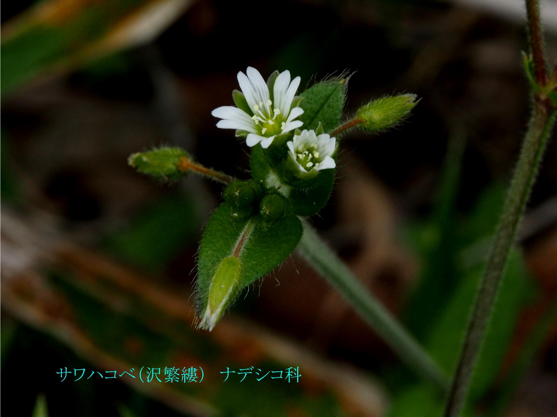
サワハコベ(沢繁縷) ナデシコ科