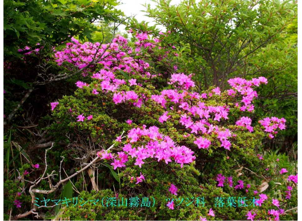
ミヤマキリシマ(深山霧島) ツツジ科 落葉低木