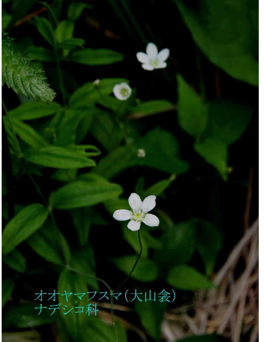
オオヤマフスマ(大山衾) ナデシコ科