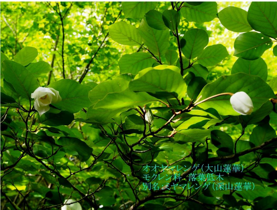
オオヤマレンゲ(大山蓮華) モクレン科 落葉低木 別名:ミヤマレンゲ(深山蓮華)