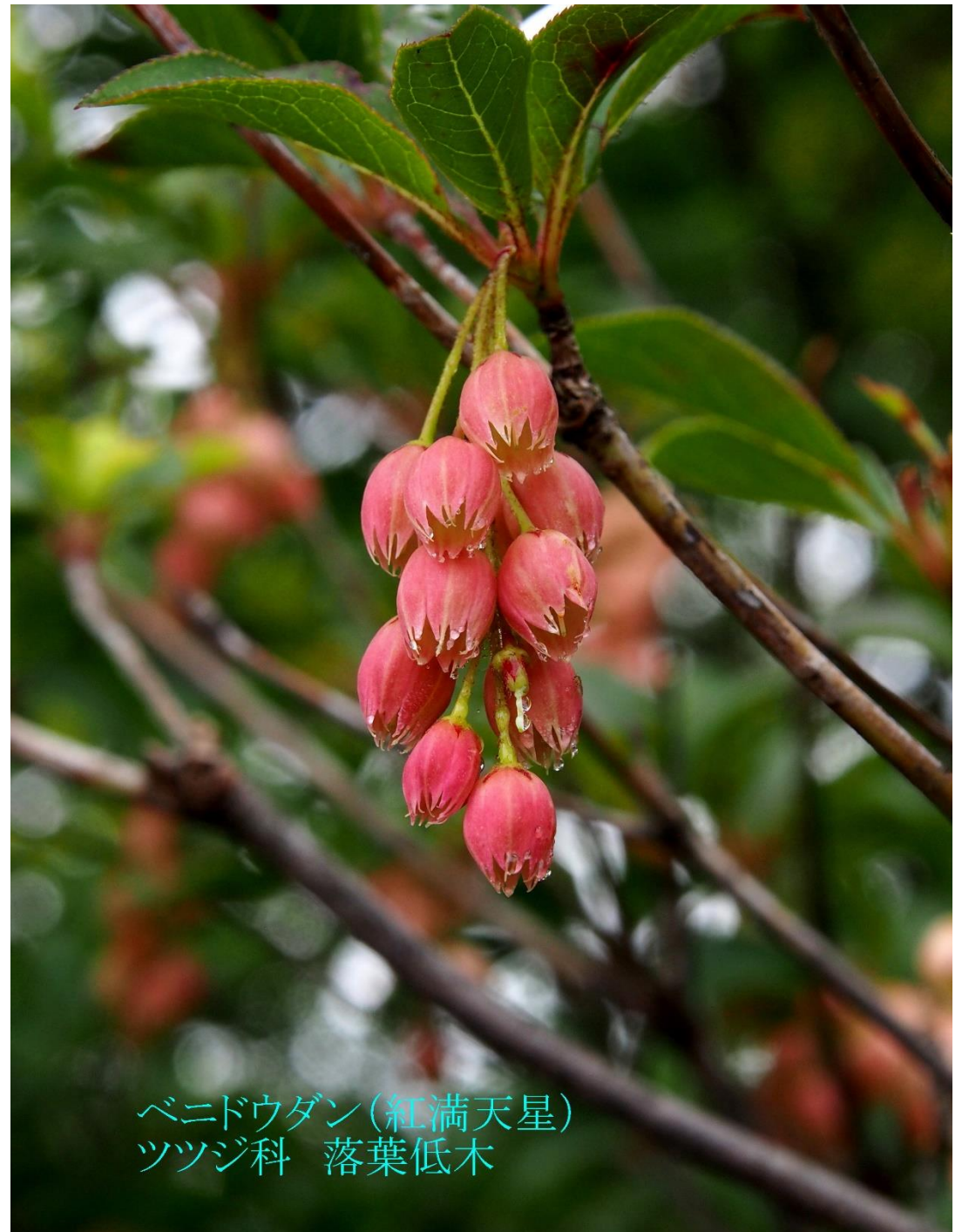
ベニドウダン(紅満天星) ツツジ科 落葉低木