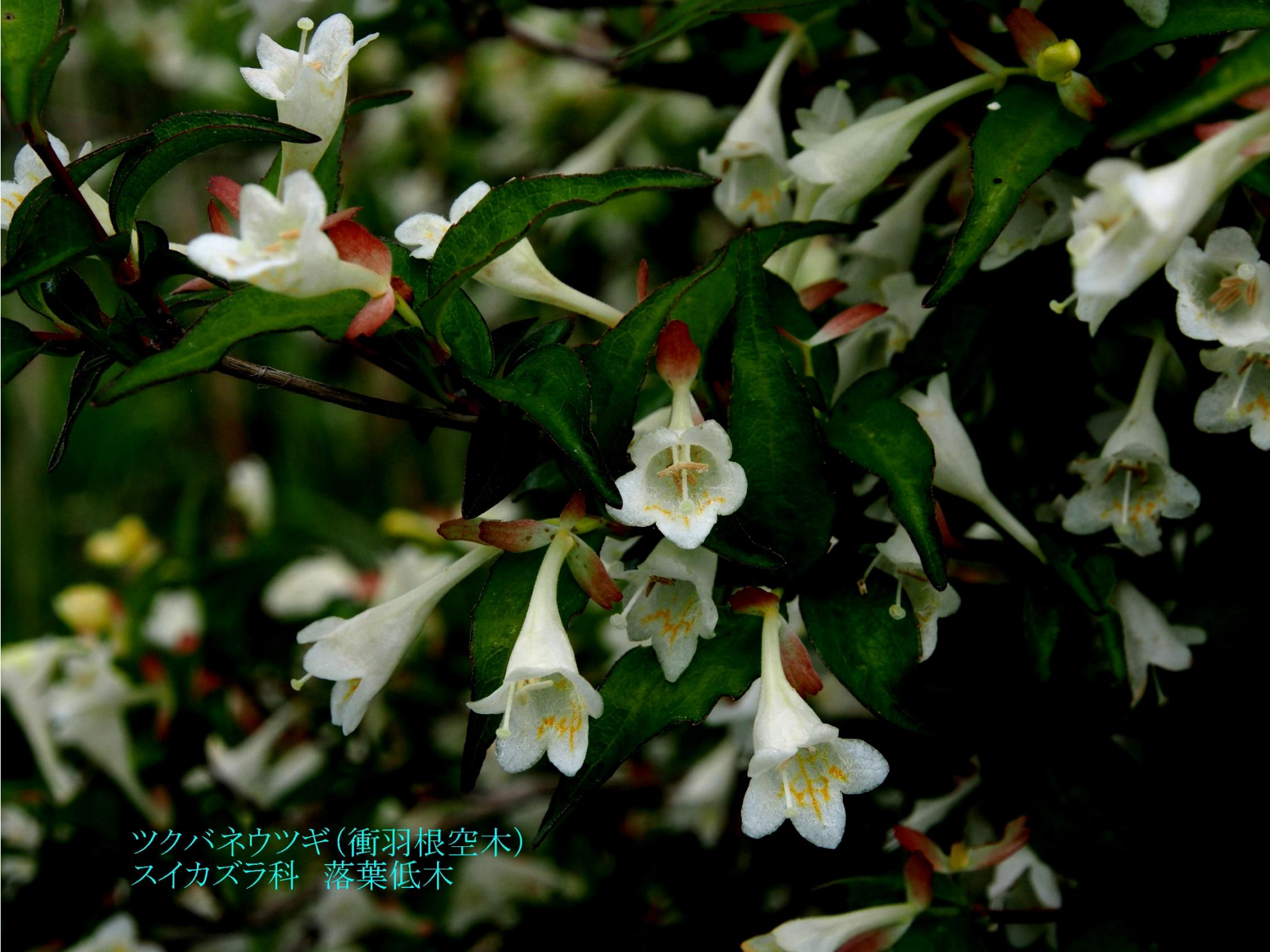
ツクバネウツギ(衝羽根空木) スイカズラ科 落葉低木