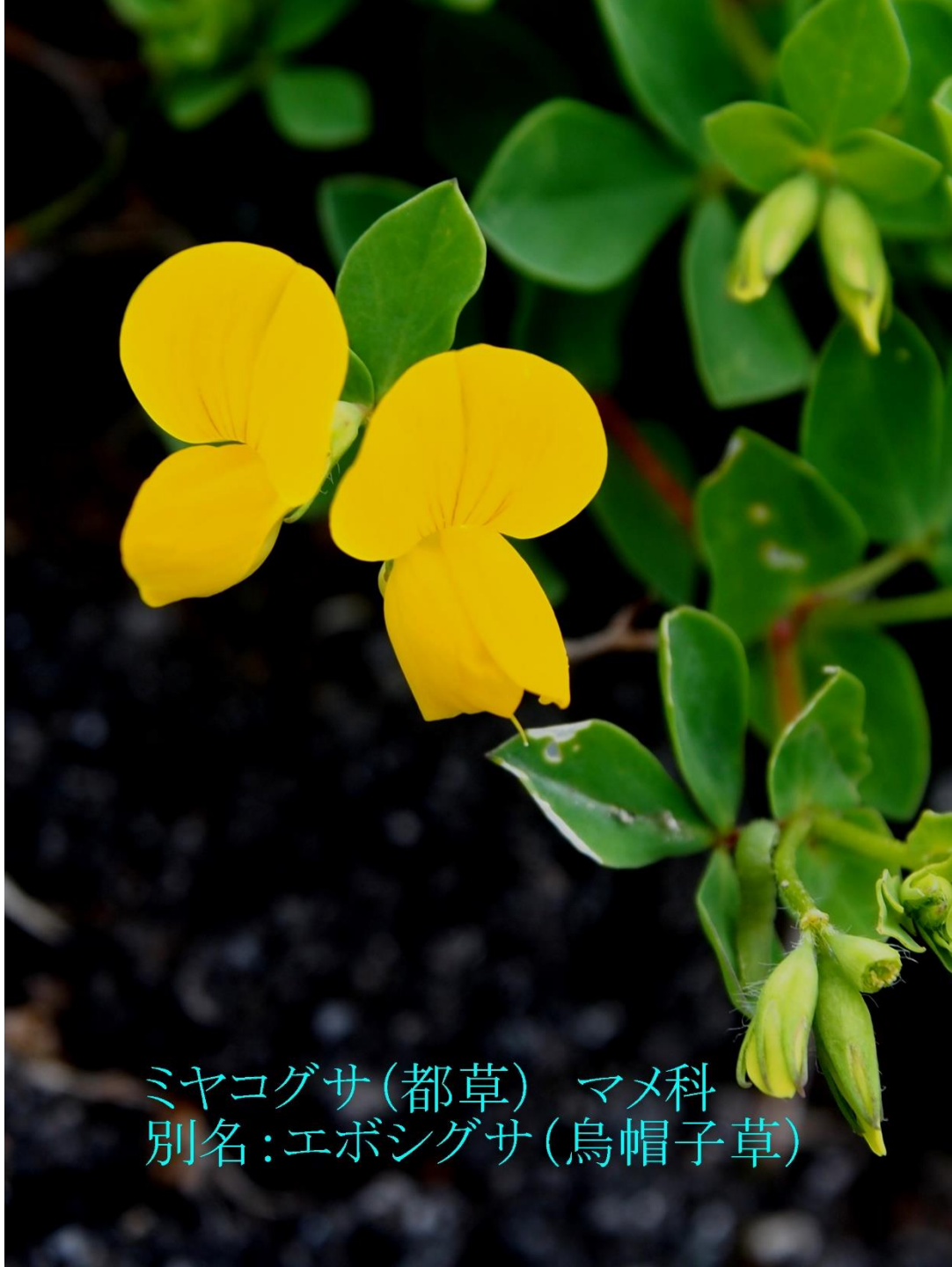
ミヤコグサ(都草) マメ科 別名:エボシグサ(烏帽子草)