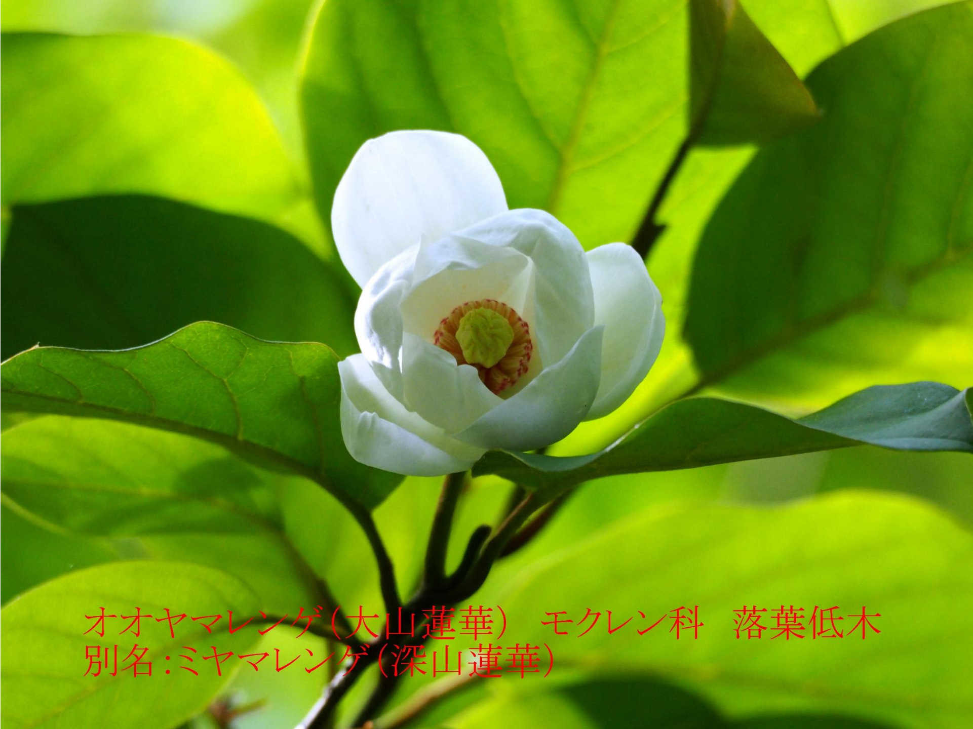
オオヤマレンゲ(大山蓮華) モクレン科 落葉低木 別名:ミヤマレンゲ(深山蓮華)