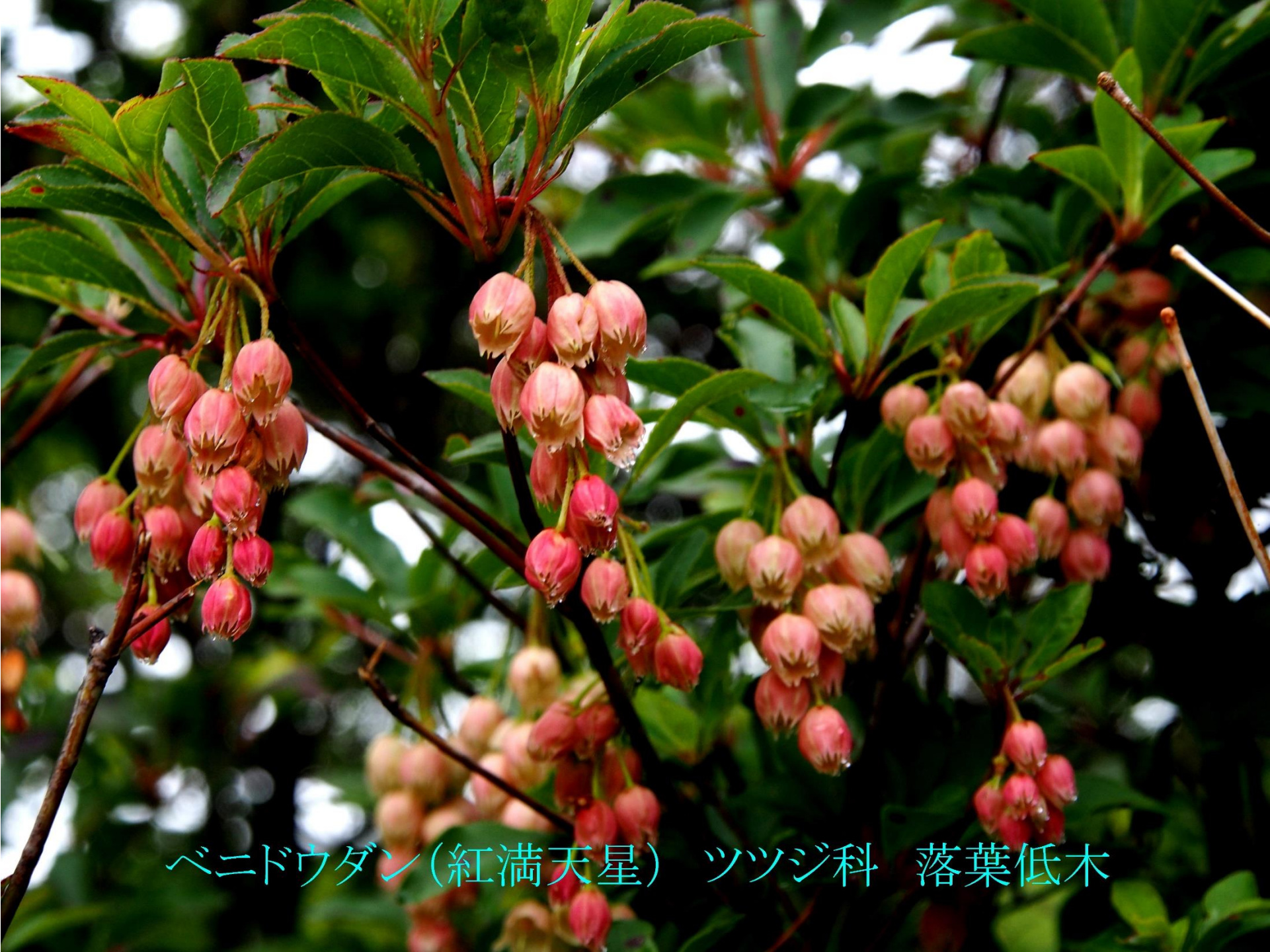
ベニドウダン(紅満天星) ツツジ科 落葉低木