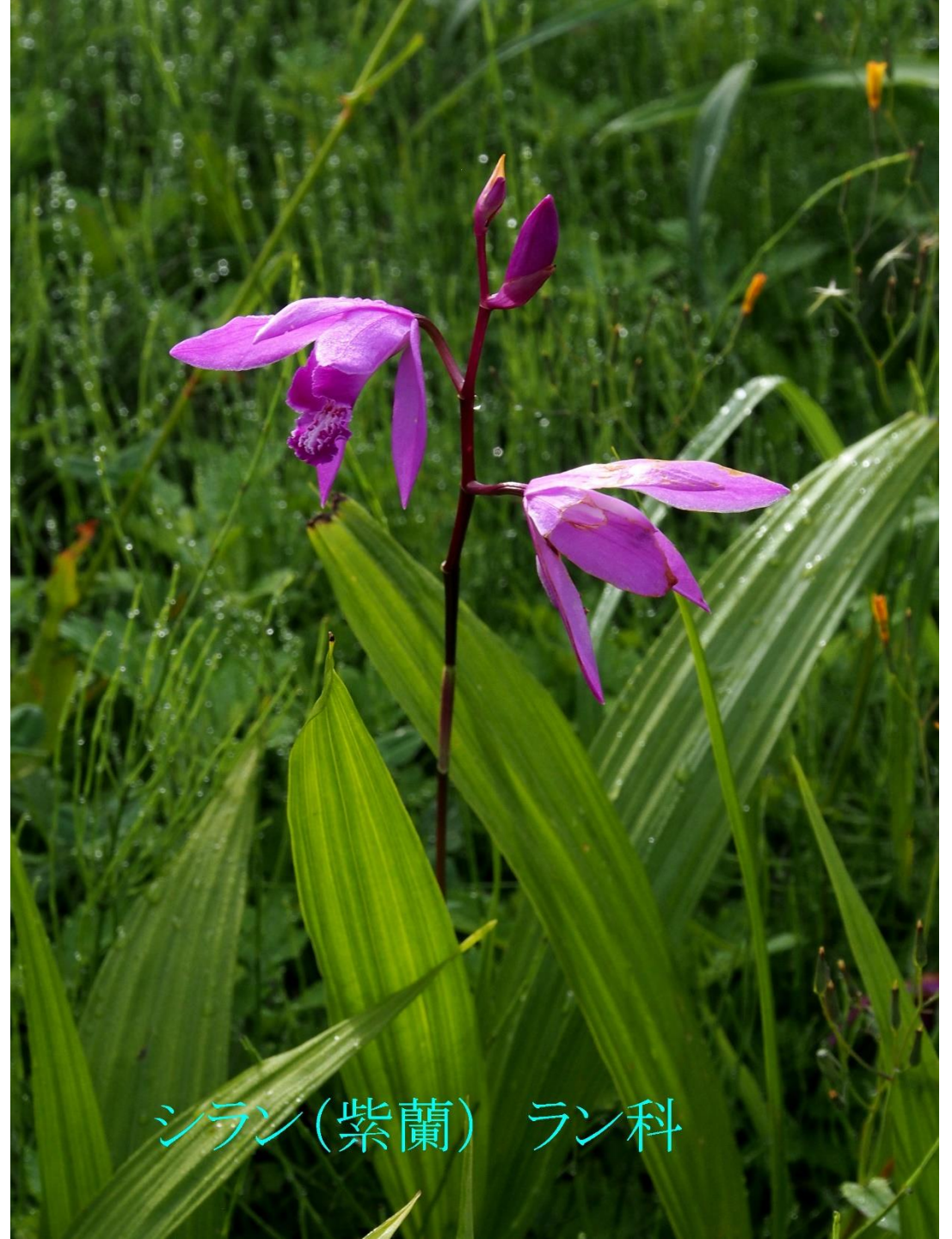
シラン(紫蘭) ラン科