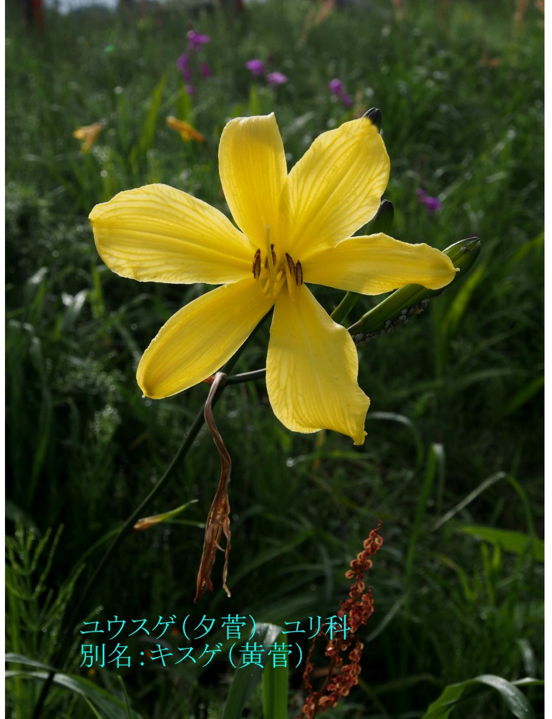
ユウスゲ(夕菅) ユリ科 別名:キスゲ(黄菅)