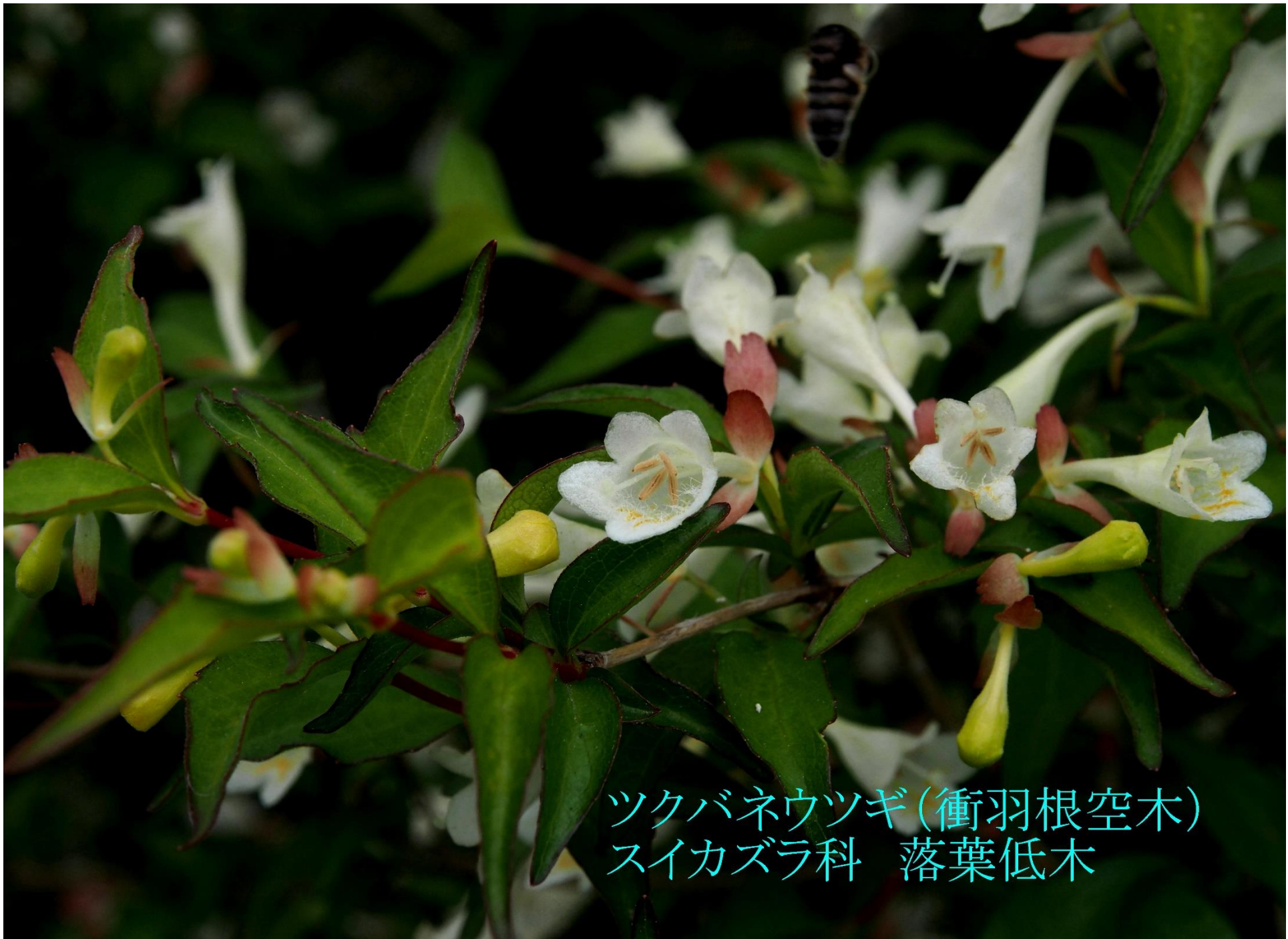
ツクバネウツギ(衝羽根空木) スイカズラ科 落葉低木