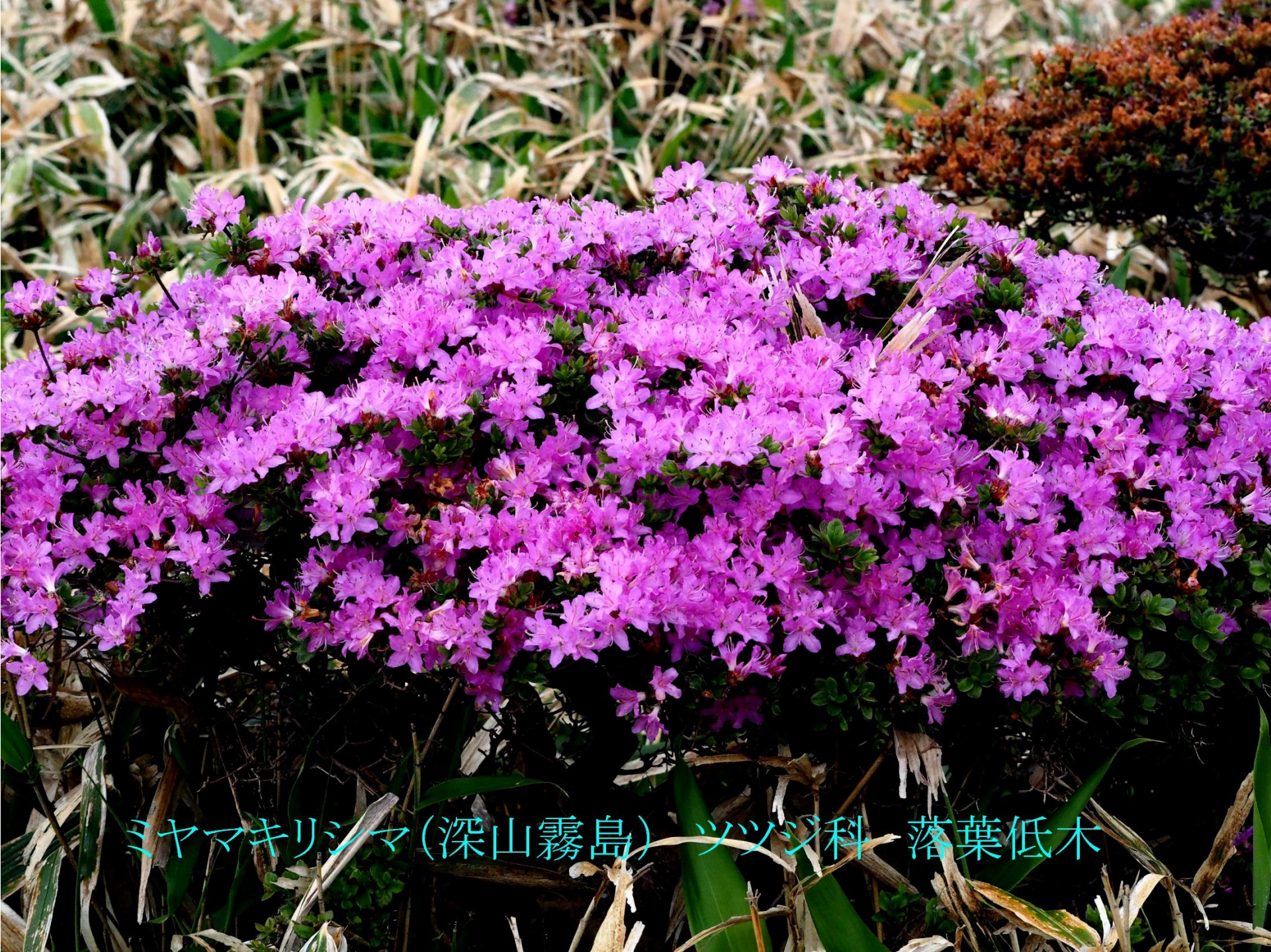
ミヤマキリシマ (深山霧島) ツツジ科 落葉低木