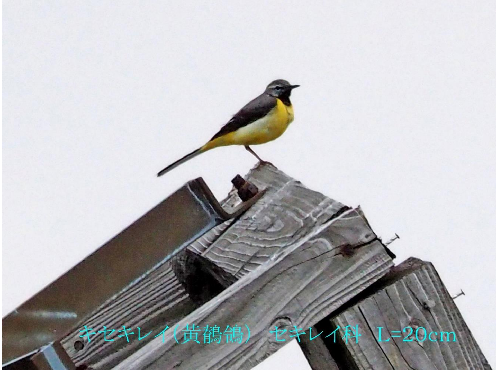
キセキレイ(黄鵲鴝) セキレイ科 L=20cm