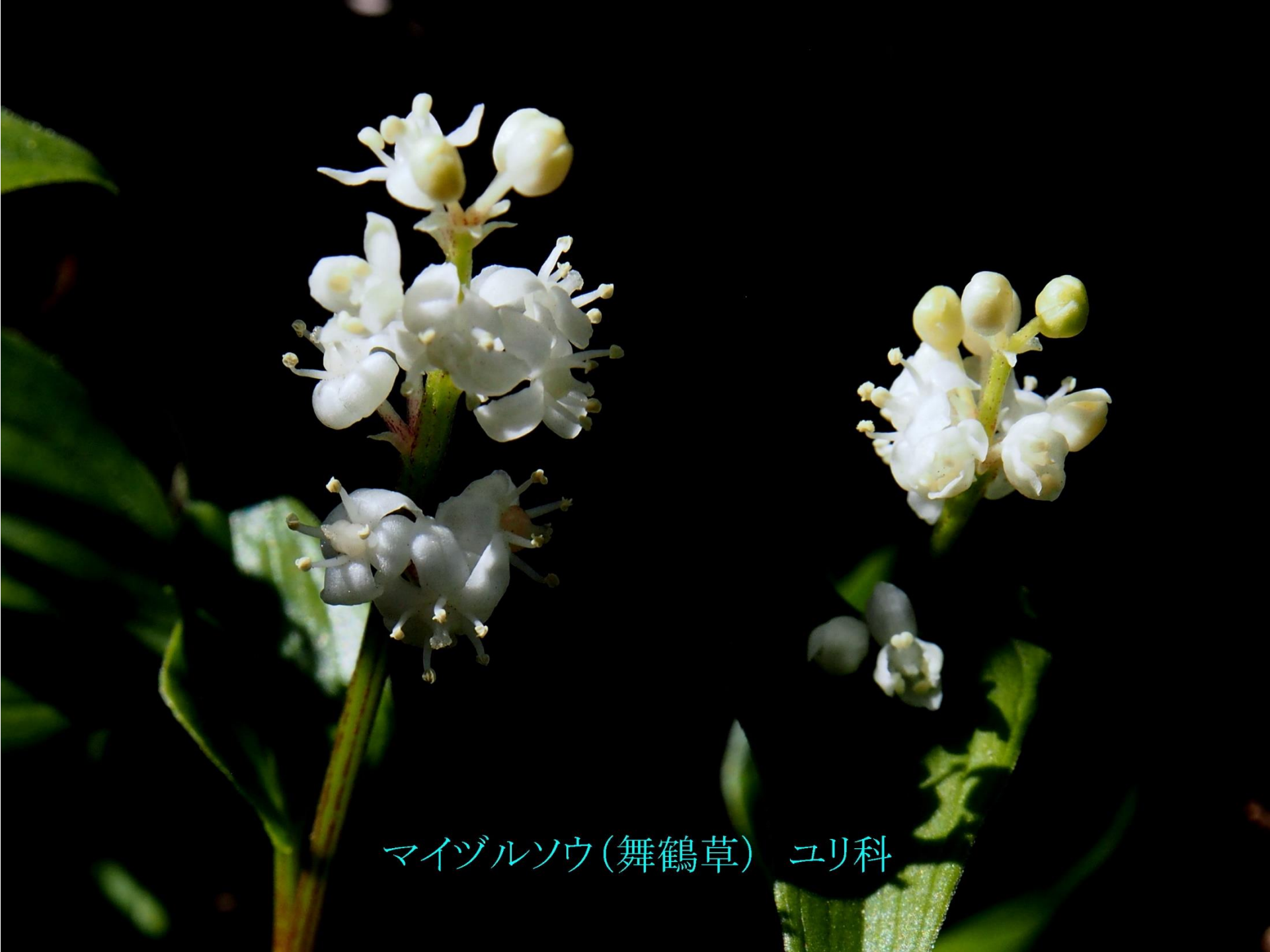
マイヅルソウ(舞鶴草) ユリ科