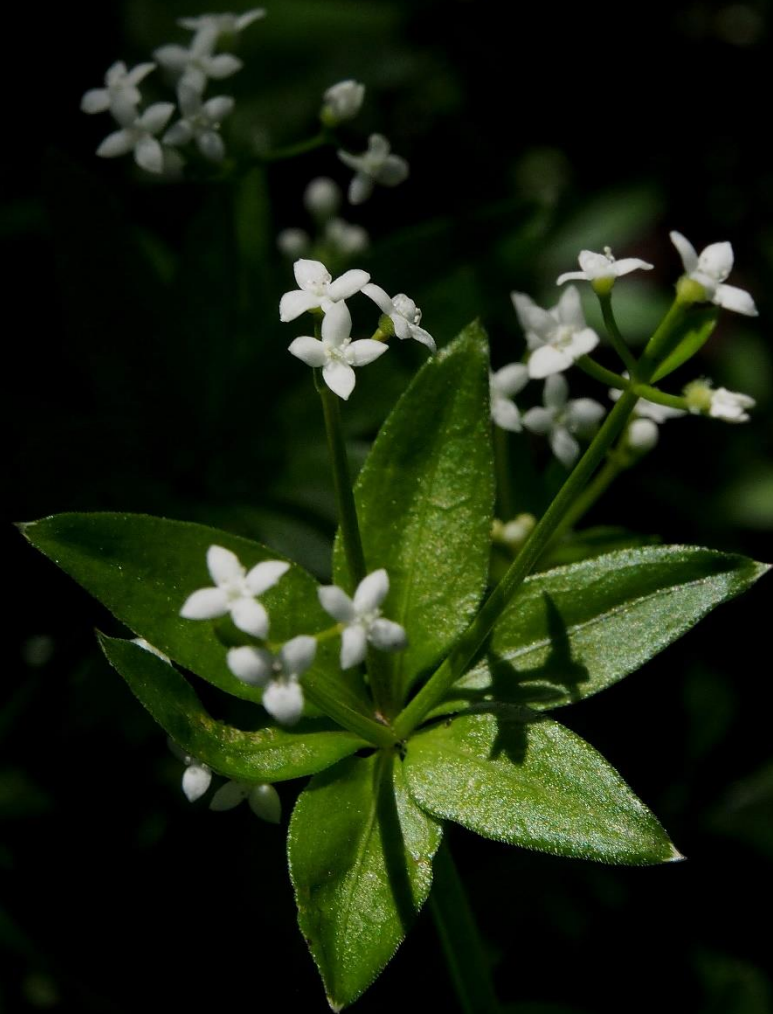
オククルマムグラ (奥車葎) アカネ科