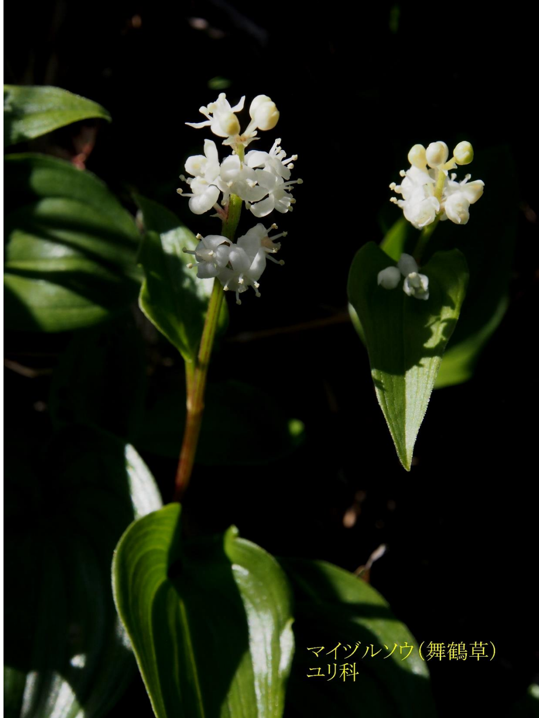
マイヅルソウ (舞鶴草) ユリ科