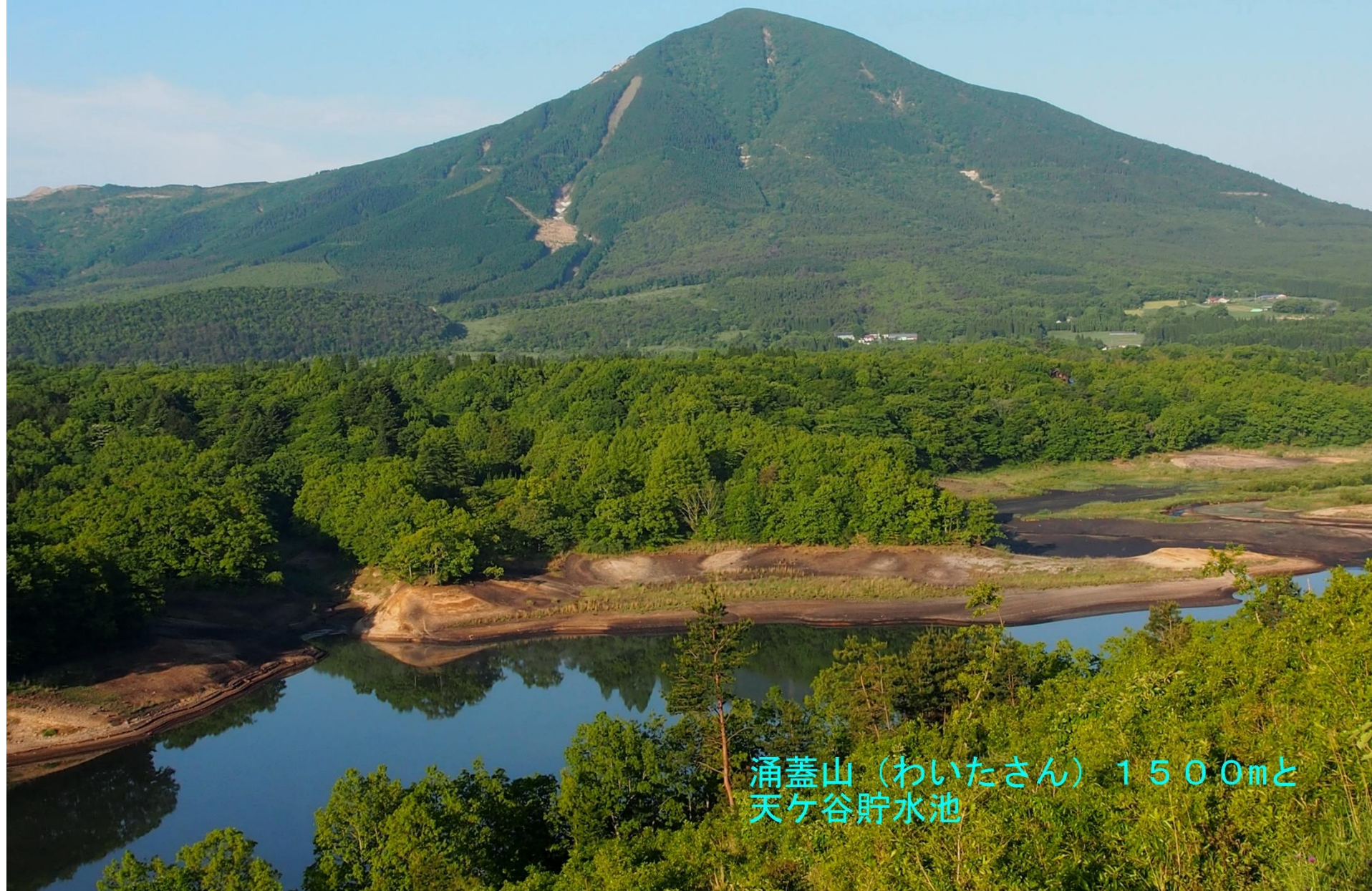
涌蓋山(わいたさん)1500mと 天ヶ谷貯水池