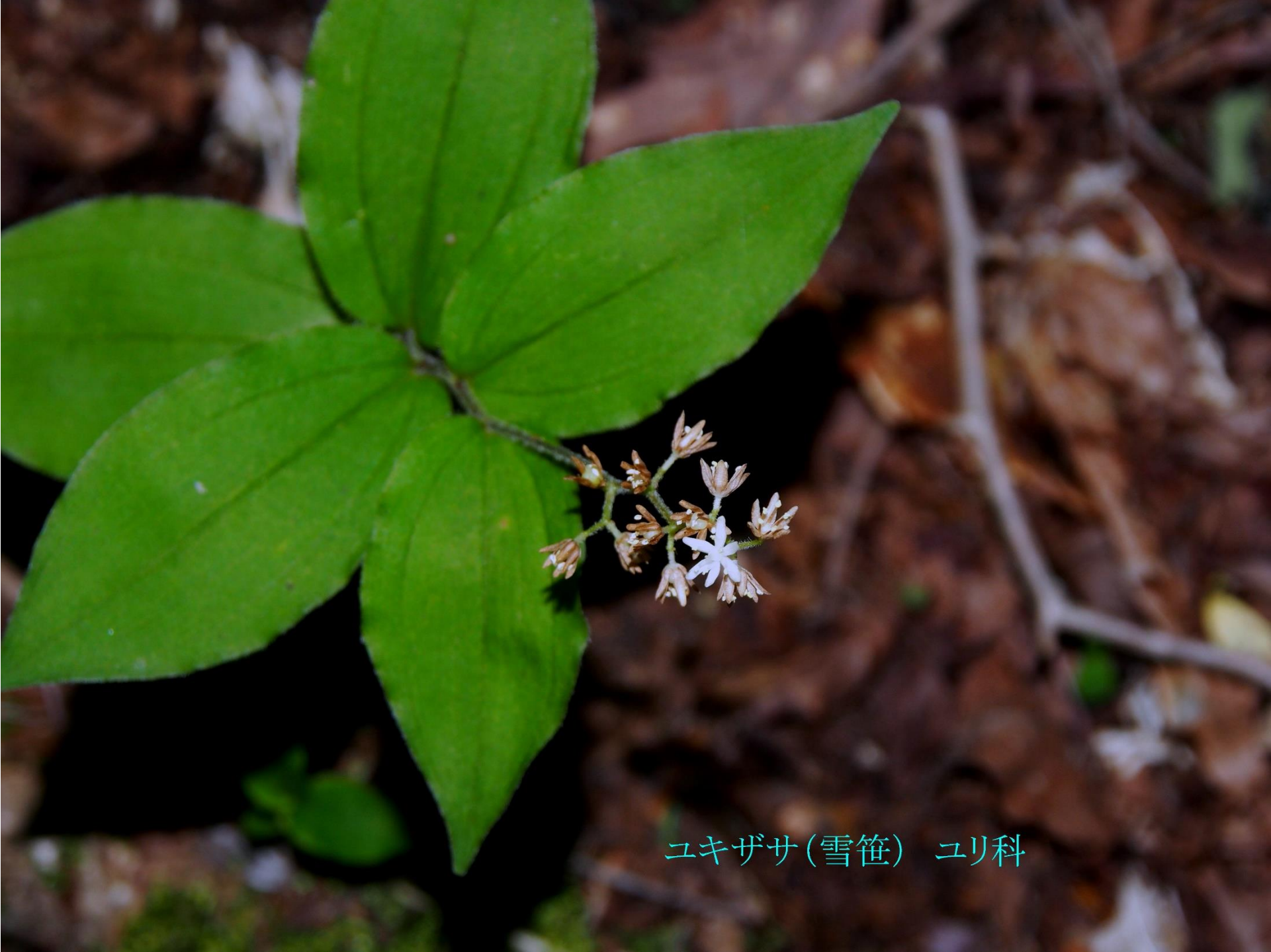
ユキザサ(雪笹) ユリ科