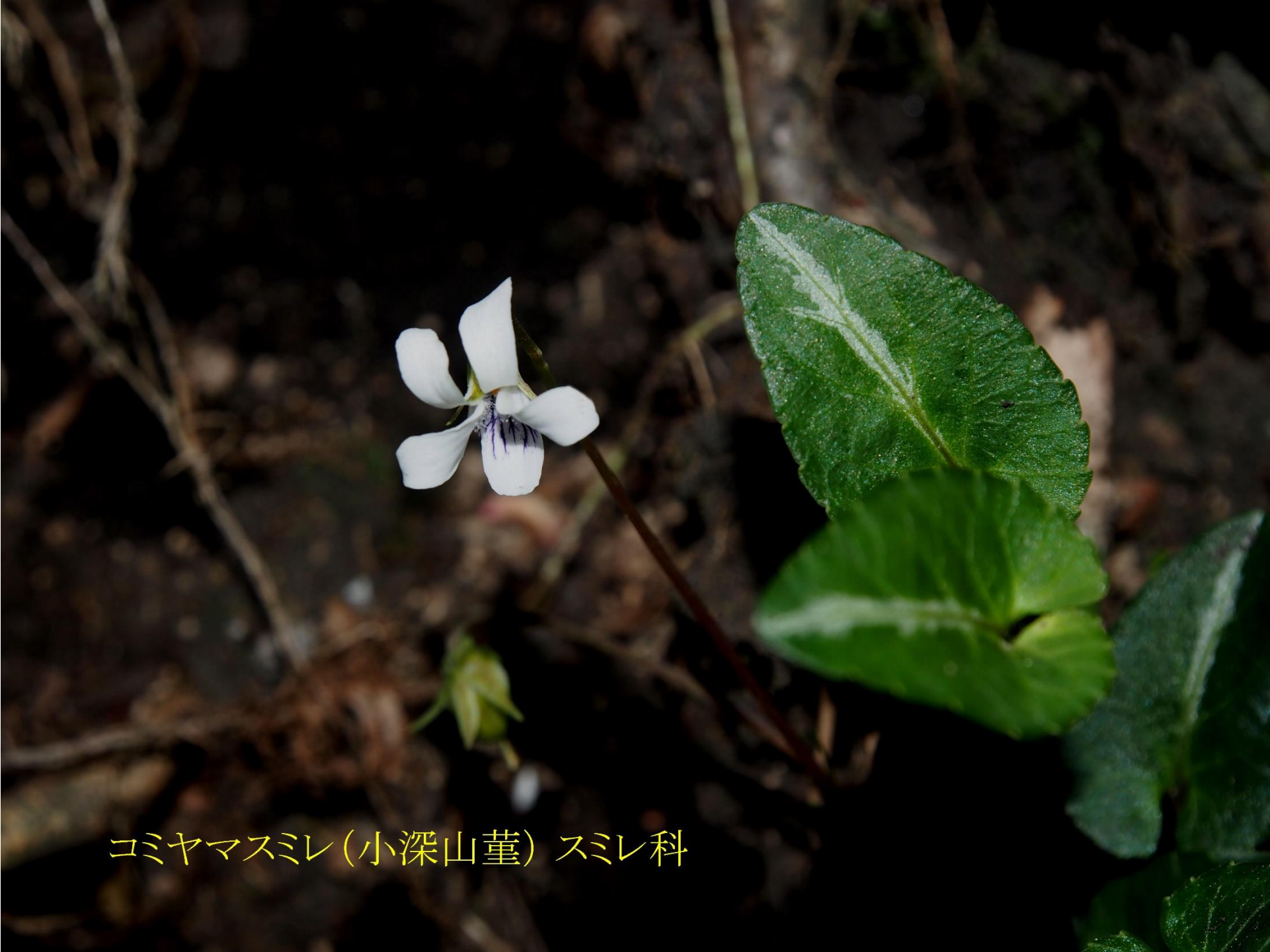
コヤマスマレ(小深山堇) スミレ科