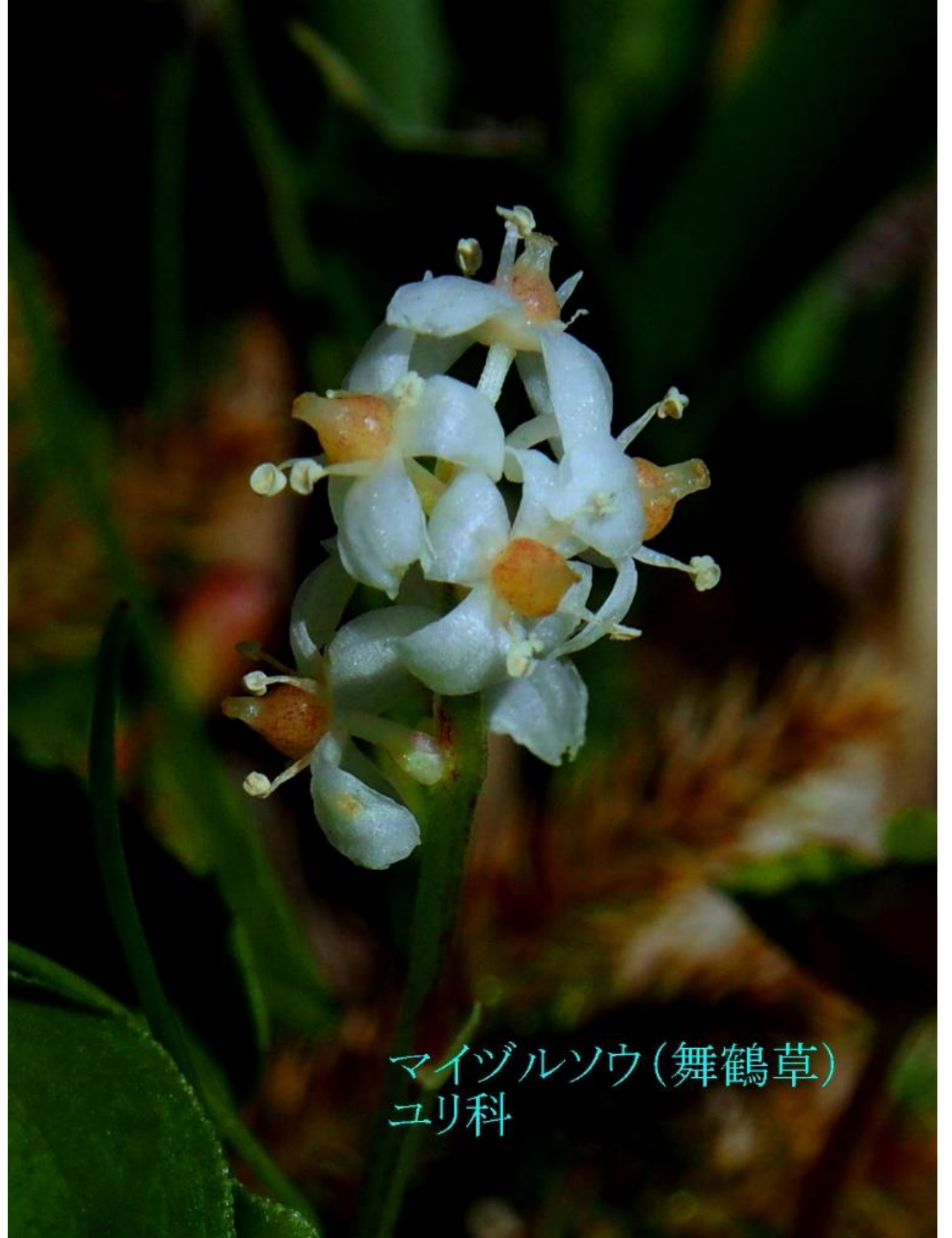
マイヅルソウ (舞鶴草) ユリ科