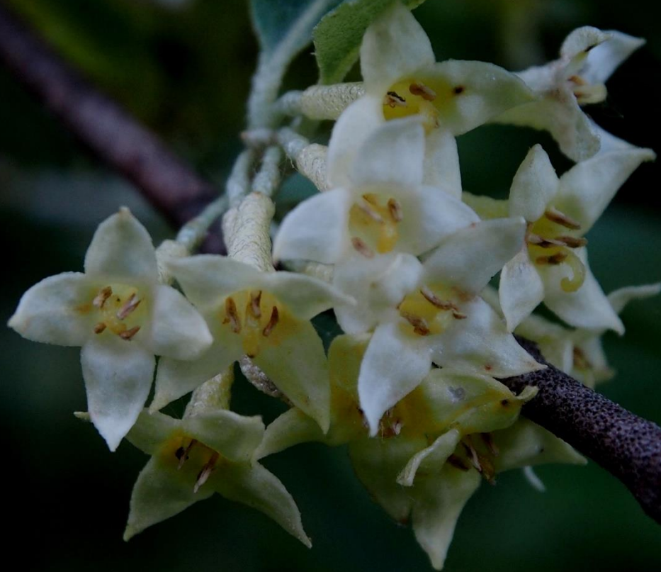
アキグミ (秋茱萸) グミ科 落葉低木