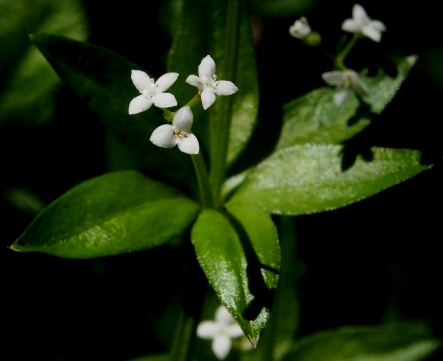
オククルマムグラ (奥車葎) アカネ科