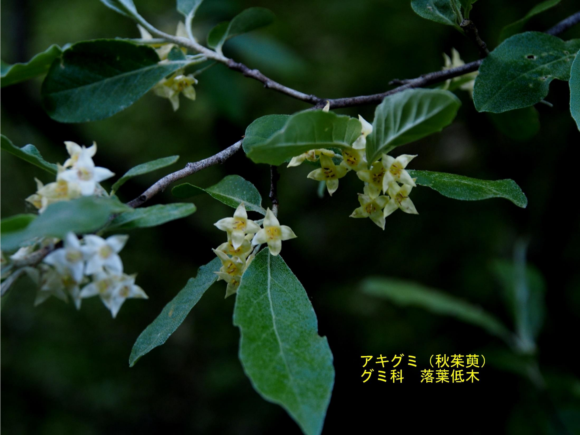
アキグミ (秋葉萸) グミ科 落葉低木