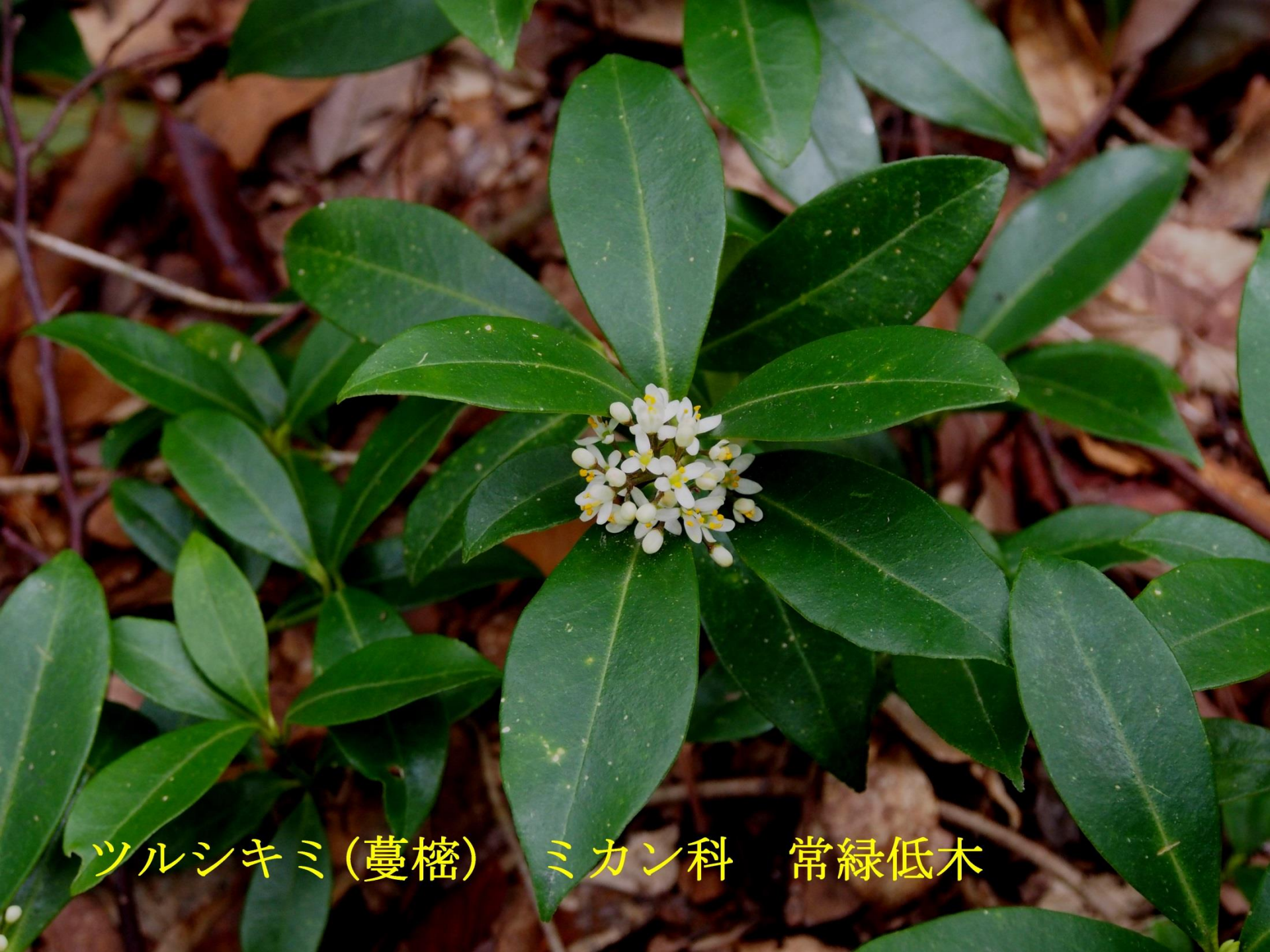
ツルシキミ (蔓柘) ミカン科 常緑低木