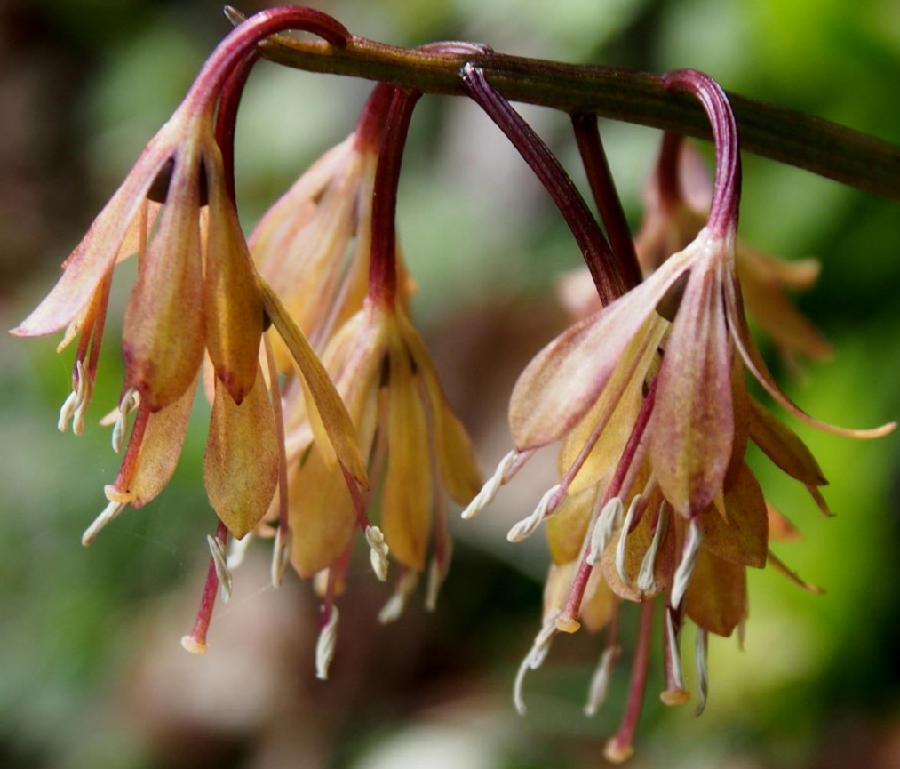
ツクシシヨウジョウバカマ (筑紫猩々袴) ユリ科