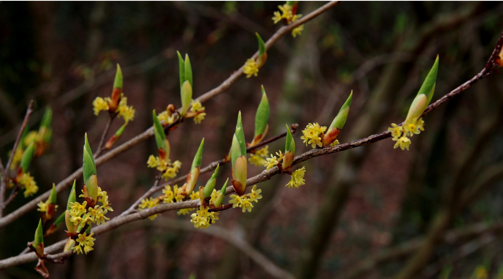
ケクロモジ(毛黒文字) クスノキ科 落葉低木