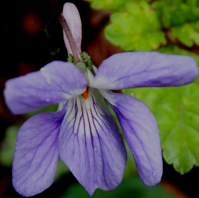
タチツボスミレ(立坪堇) スミレ科