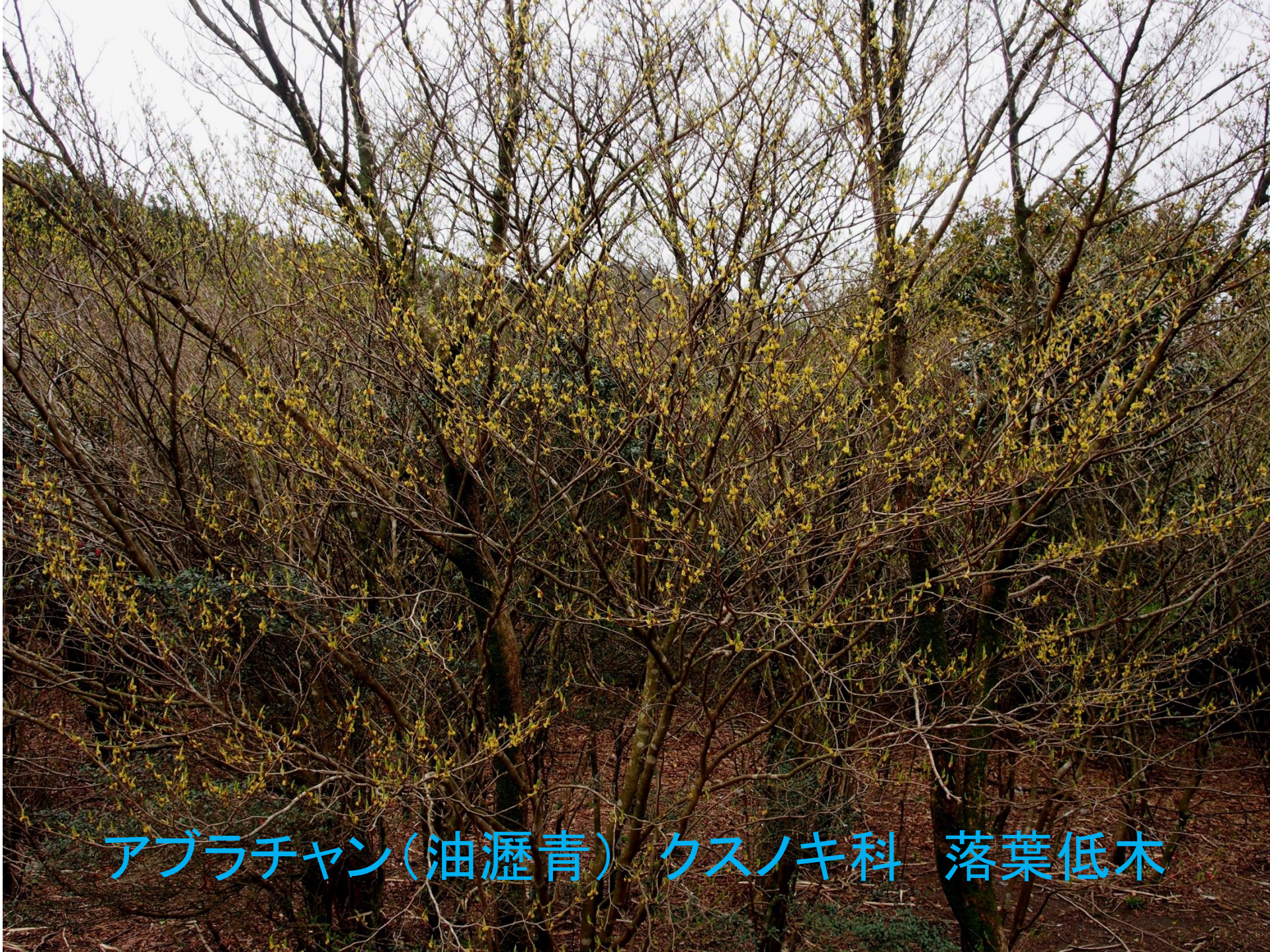
アブラチャン(油瀝青) クスノキ科 落葉低木