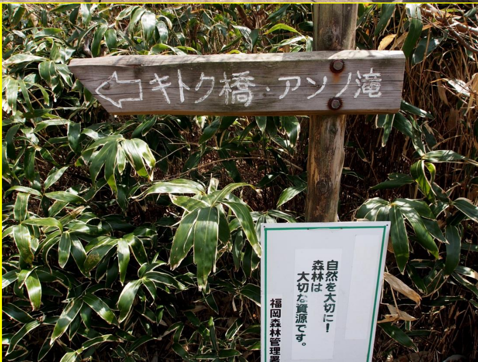
12:08 キトク橋・アソノ滝方面に向かう。