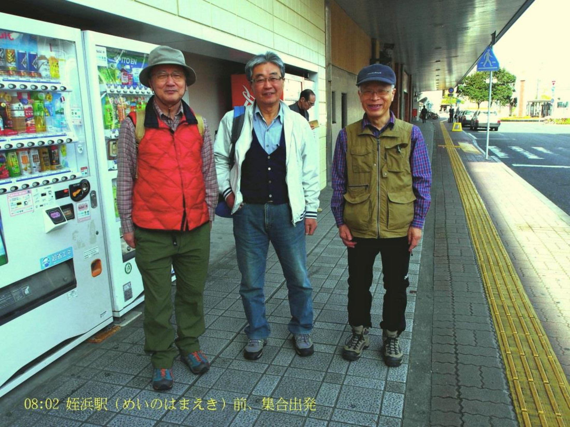
08:02 姪浜駅（めいのはまえき）前、集合出発