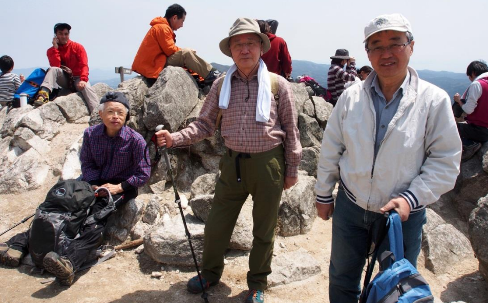
12:01 軽食を山頂でとった。