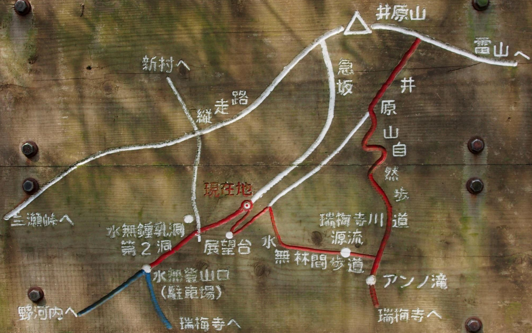
09:49 現在地はアンノ滝分岐