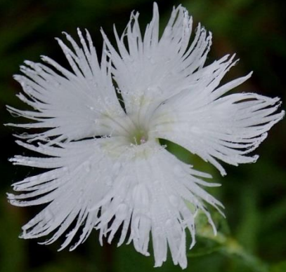
カワラナデシコ（河原撫子） ナデシコ科