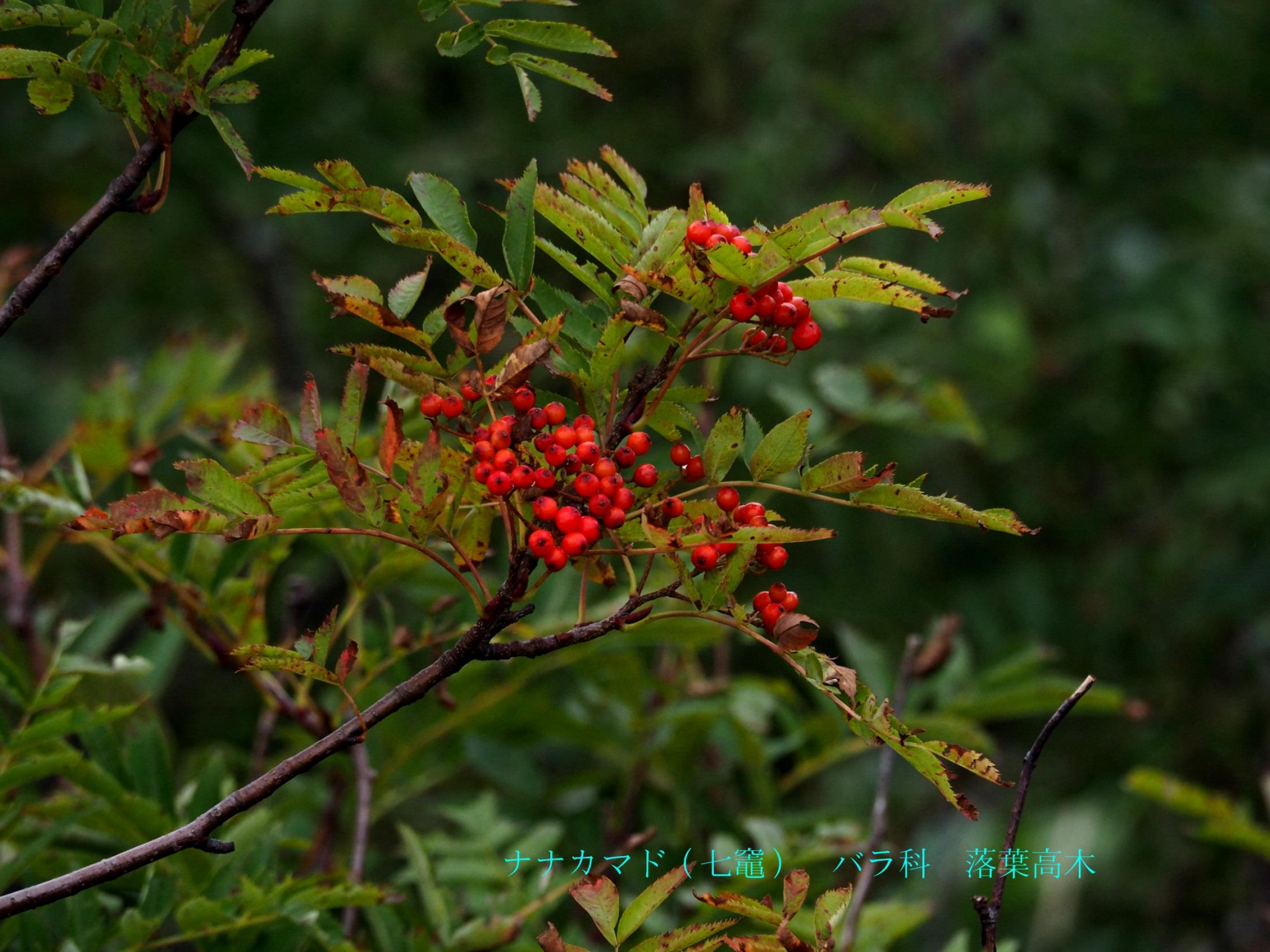
ナナカマド（七竈） バラ科 落葉高木