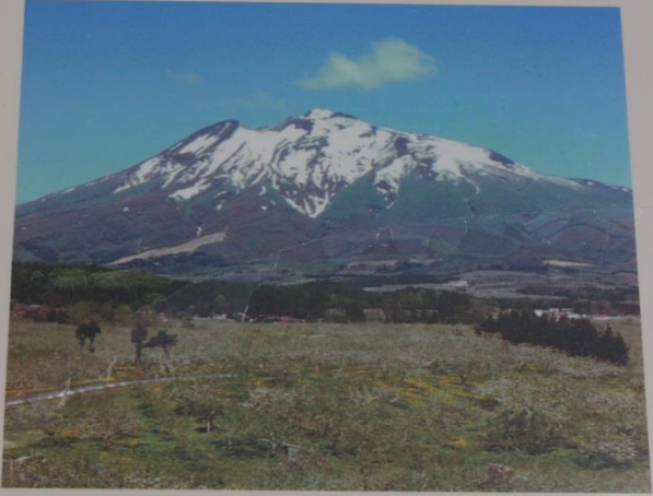
津軽平野にそびえる麗峰、1,625m。津軽富士と称され、山岳スキーのメッカ。