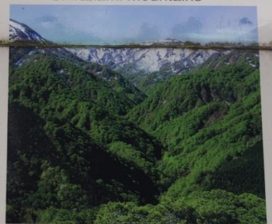
日本初の世界遺産登録。ブナ原生林のもえぎ色は春もみじ(紅葉)の名所。