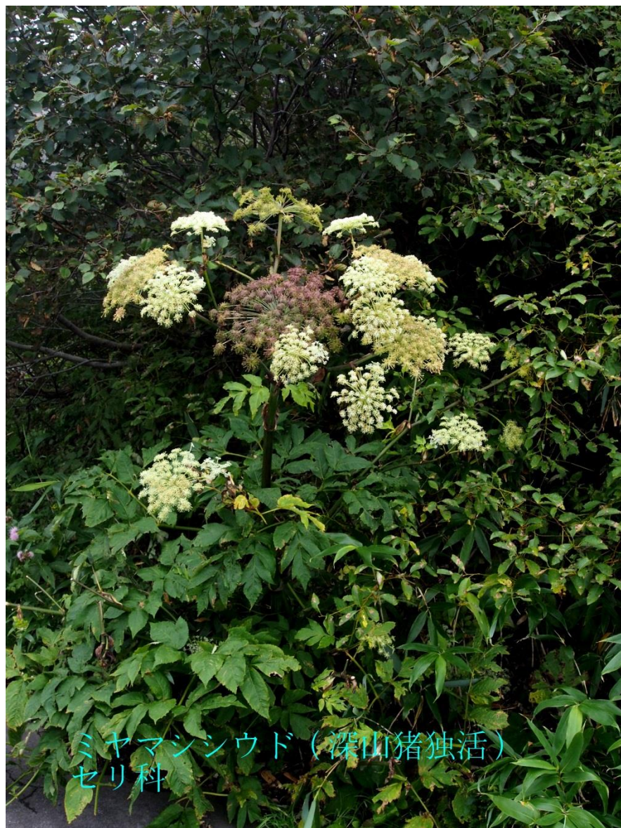
ミヤマシシウド（深山猪独活） セリ科