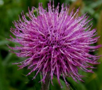
アオモリアザミ（青森薊） キク科 別名；オオノアザミ（大野薊）