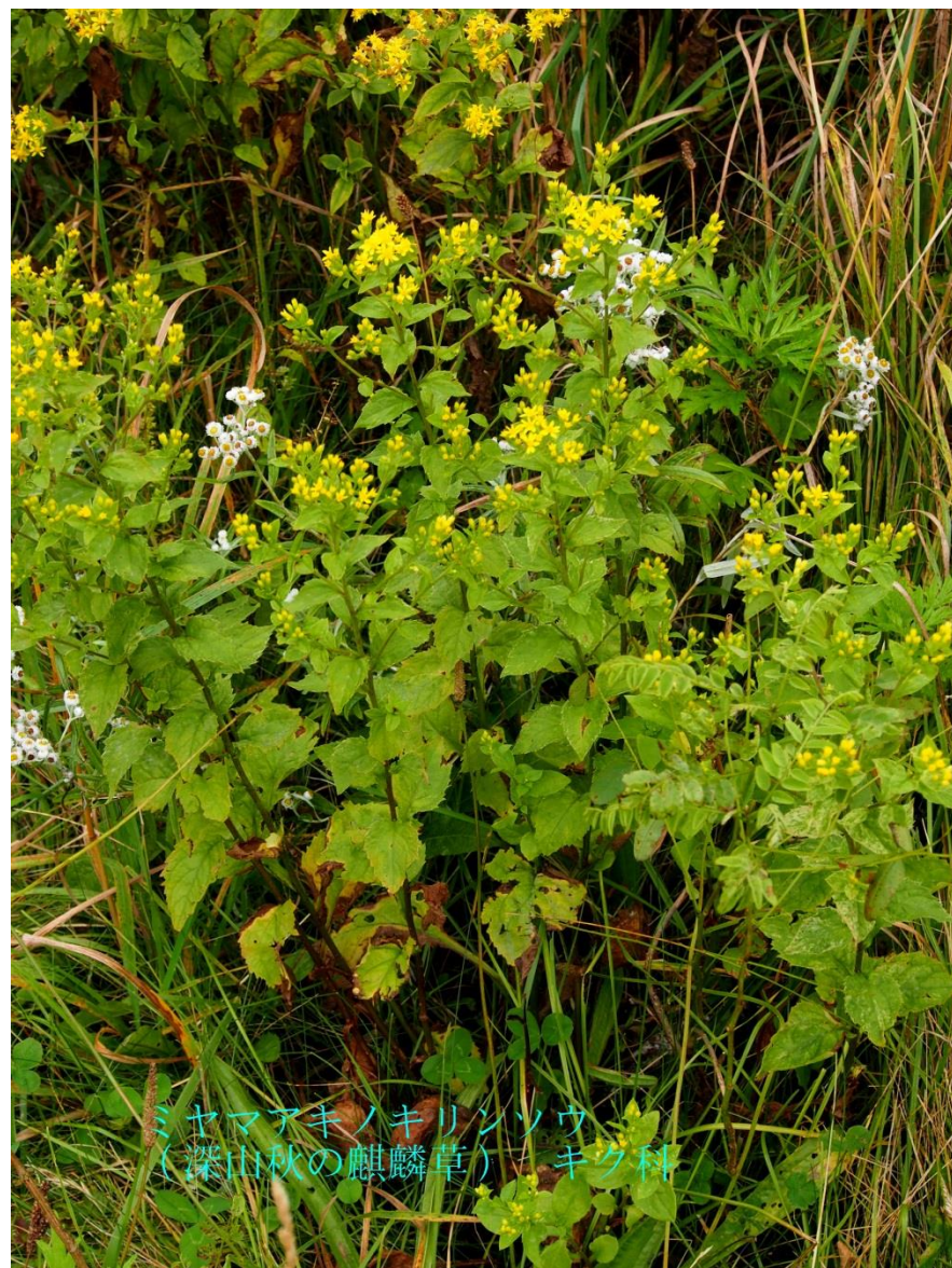
ミヤマアキノキリンソウ （深山秋の麒麟草） キク科