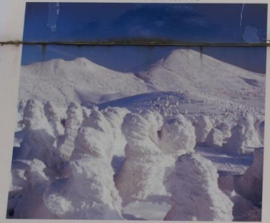
十和田八幡平国立公園の八甲田連峰は雄大な山岳スキーで有名。