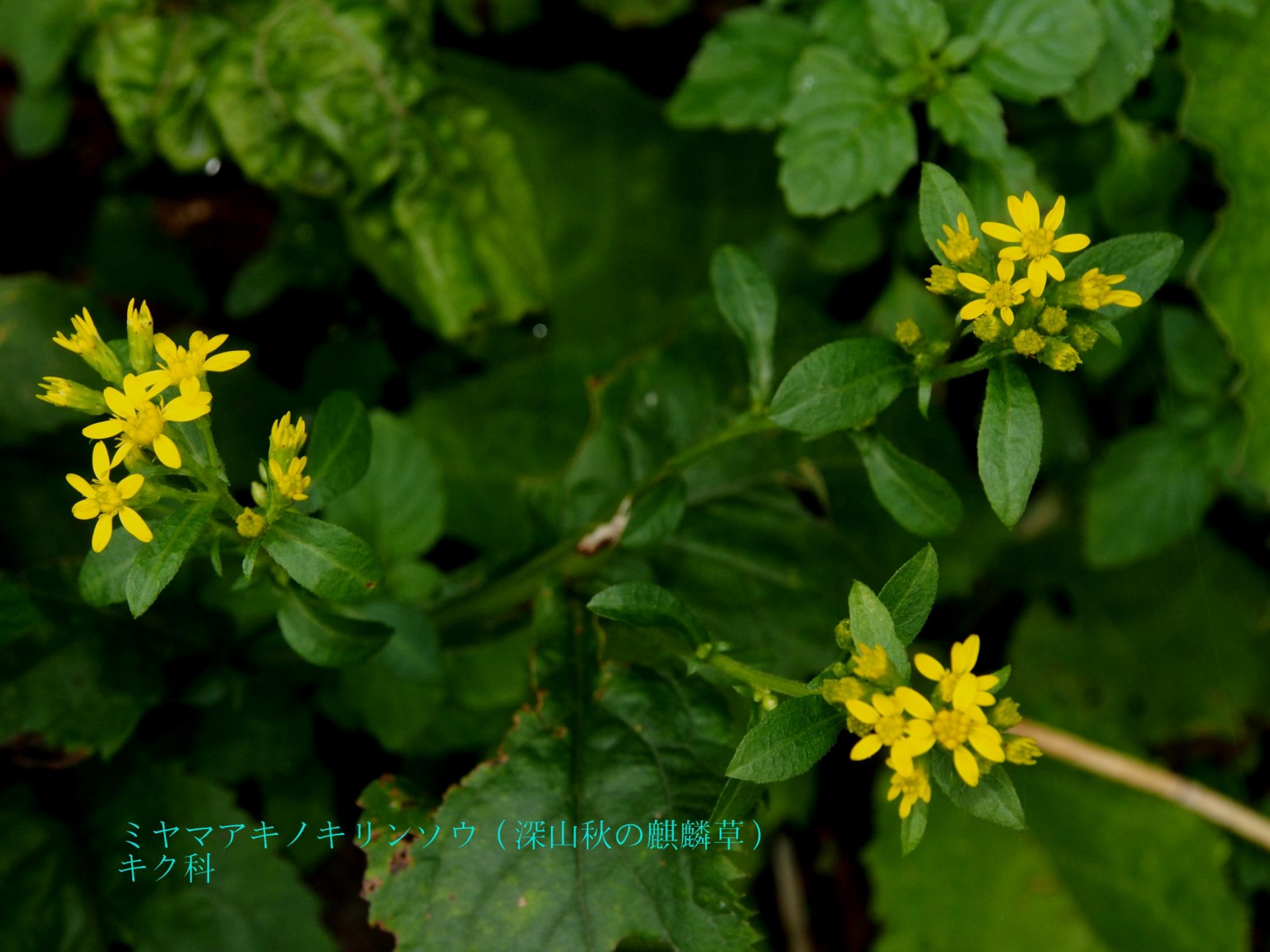
ミヤマアキノ麒麟ソウ（深山秋の麒麟草） キク科