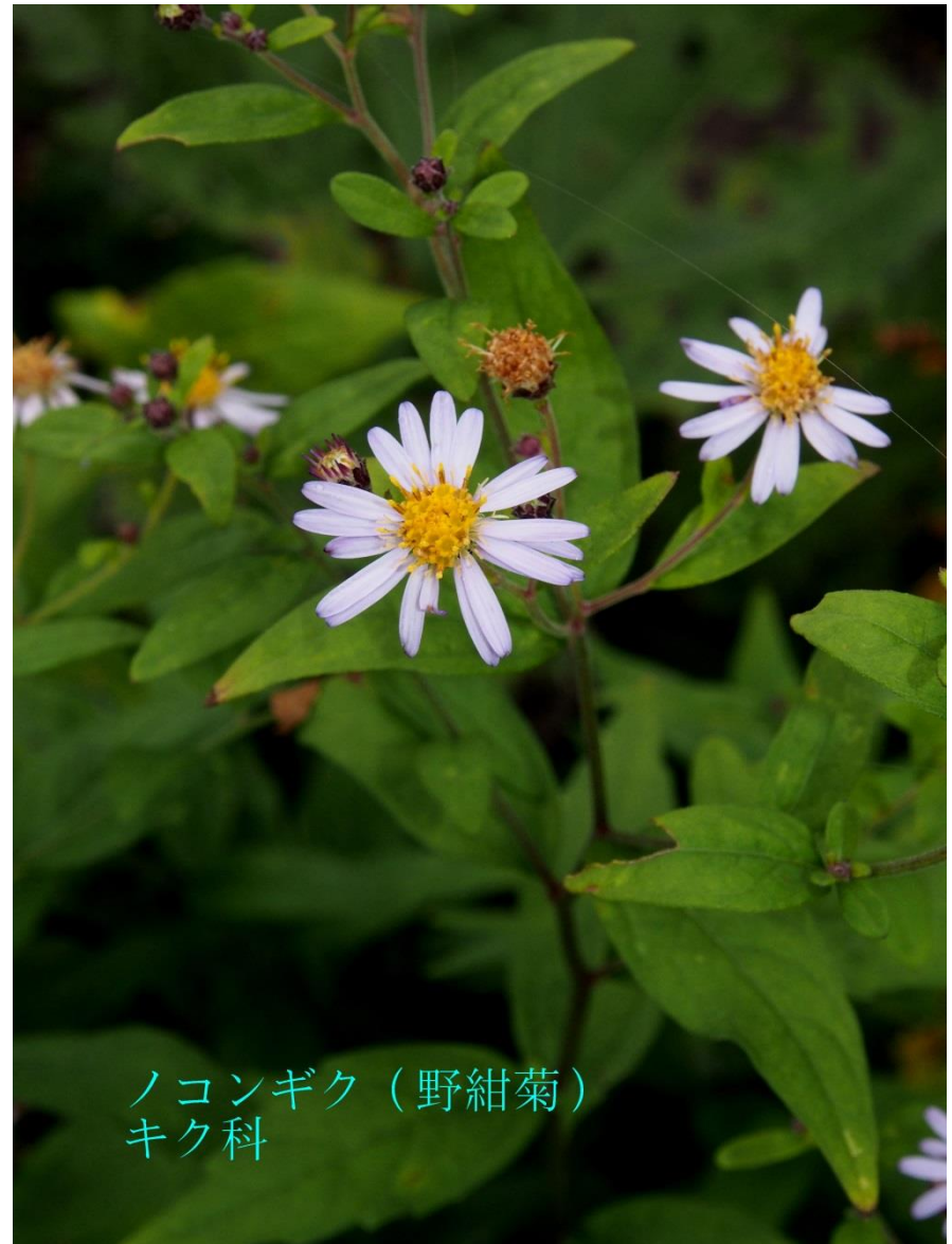
ノコンギク (野紺菊) キク科