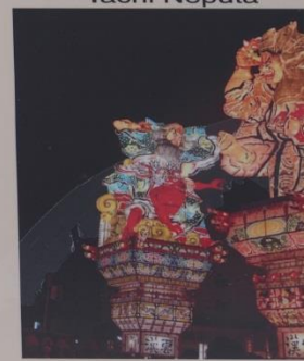
高さ最大20mにも達五所川原立佞武多。