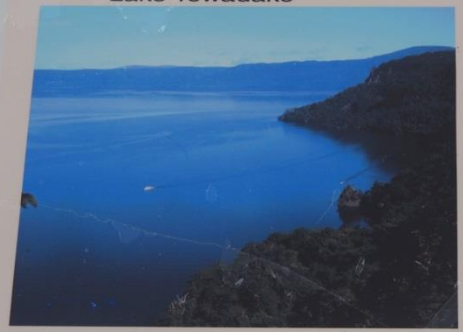
国際的景勝地で、四季を通して美しい。湖畔に立つ乙女の像は高村光太郎作。