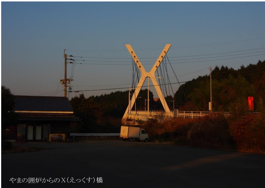
やまの囲炉からのX(えつくす)橋