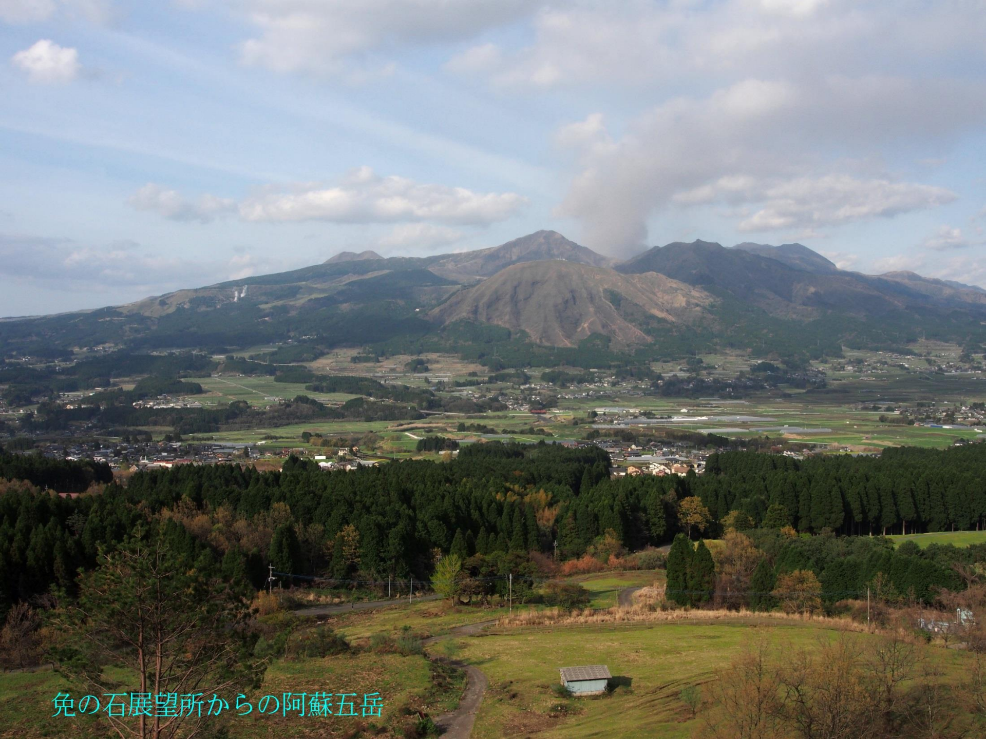
免の石展望所からの阿蘇五岳