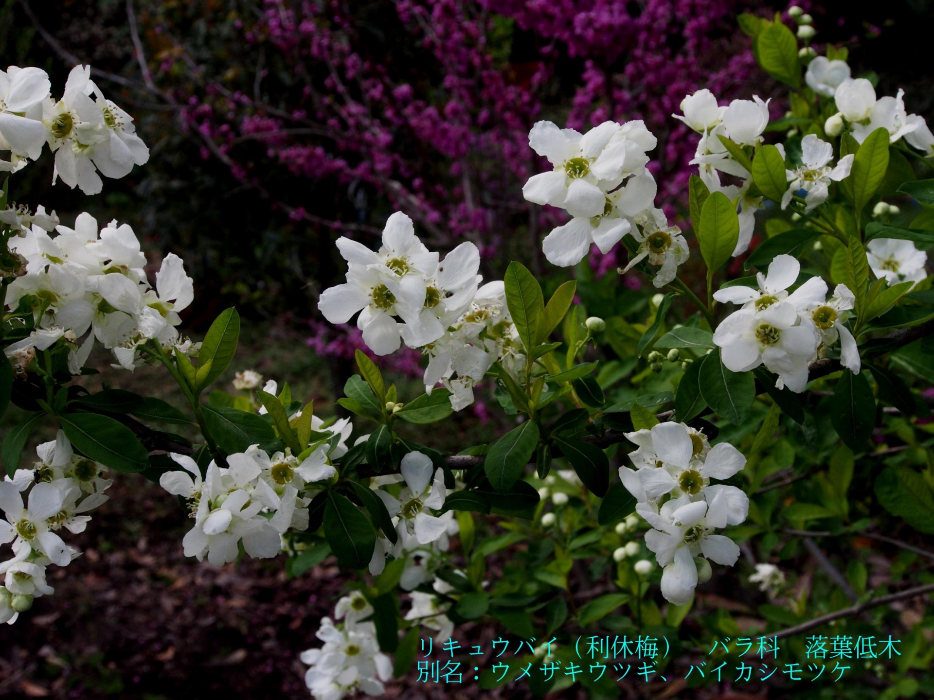
リキュウバイ (利休梅) バラ科 落葉低木 別名：ウメザキウツギ、バイカシモツケ