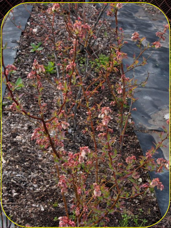
ブルーベリー（河津農園）