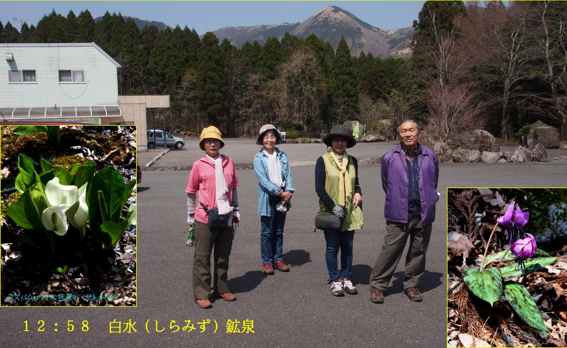
ミズバショウ(水芭蕉) サトイモ科