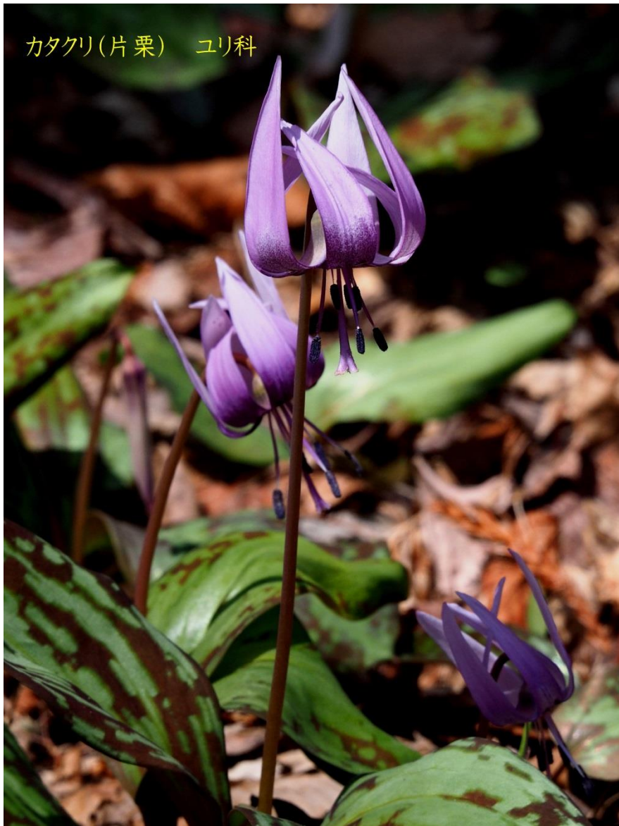
カタクリ(片栗) ユリ科

かつてはこの鱗茎から抽出した デンプン を 片栗粉 として調理に用いていた。 精製量のごくわずかであるため、近年は片栗粉には ジャガイモ や サツマイモ から抽出したデンプン粉が用いられている。