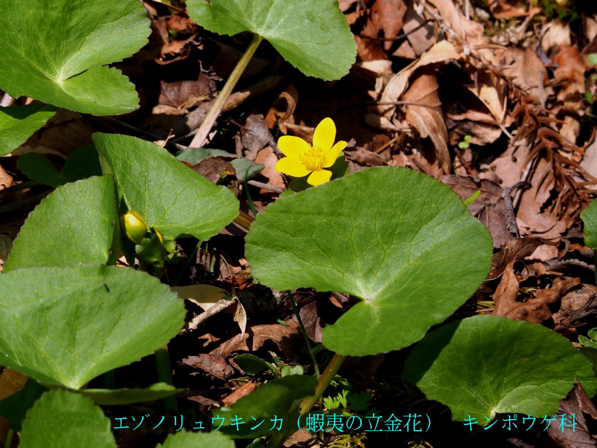
エゾノリュウキンカ（蝦夷の立金花） キンポウゲ科