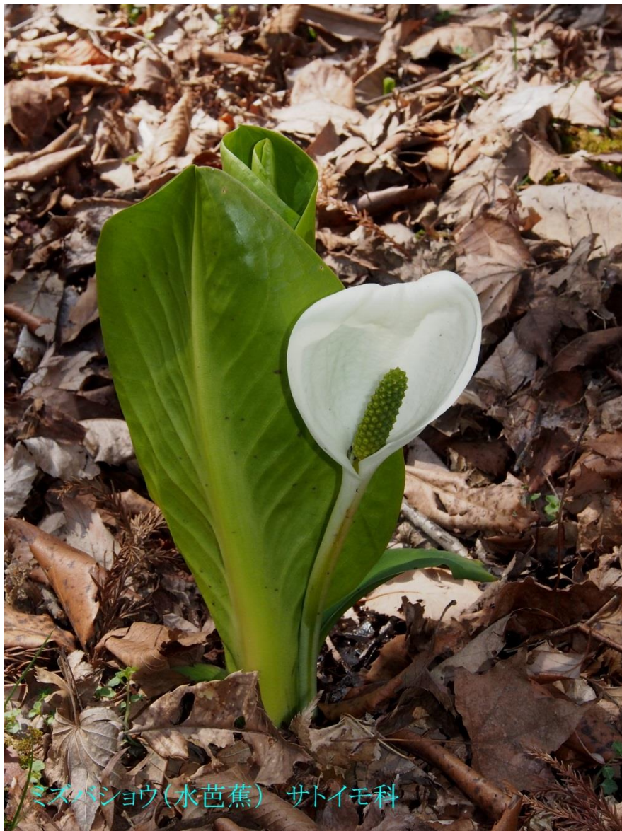
ミズバショウ(水芭蕉) サトイモ科

湿地に自生し発芽直後の葉間中央から純白の仏炎苞(ぶつえんほう)と呼ばれる苞を開く。 これが花に見えるが仏炎苞は葉の変形したものである。