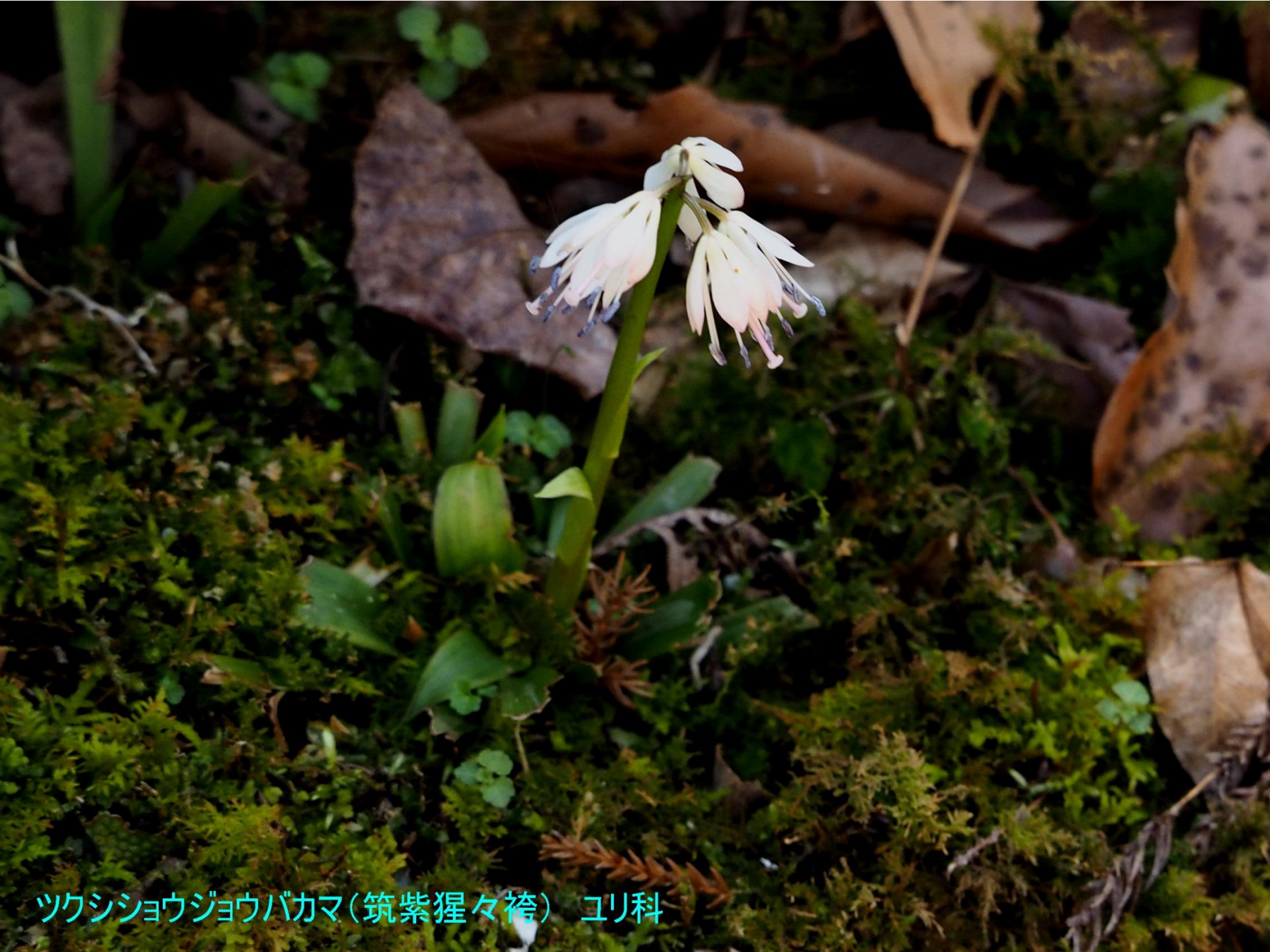
ツクシショウジョウバカマ(筑紫猩々袴) ユリ科