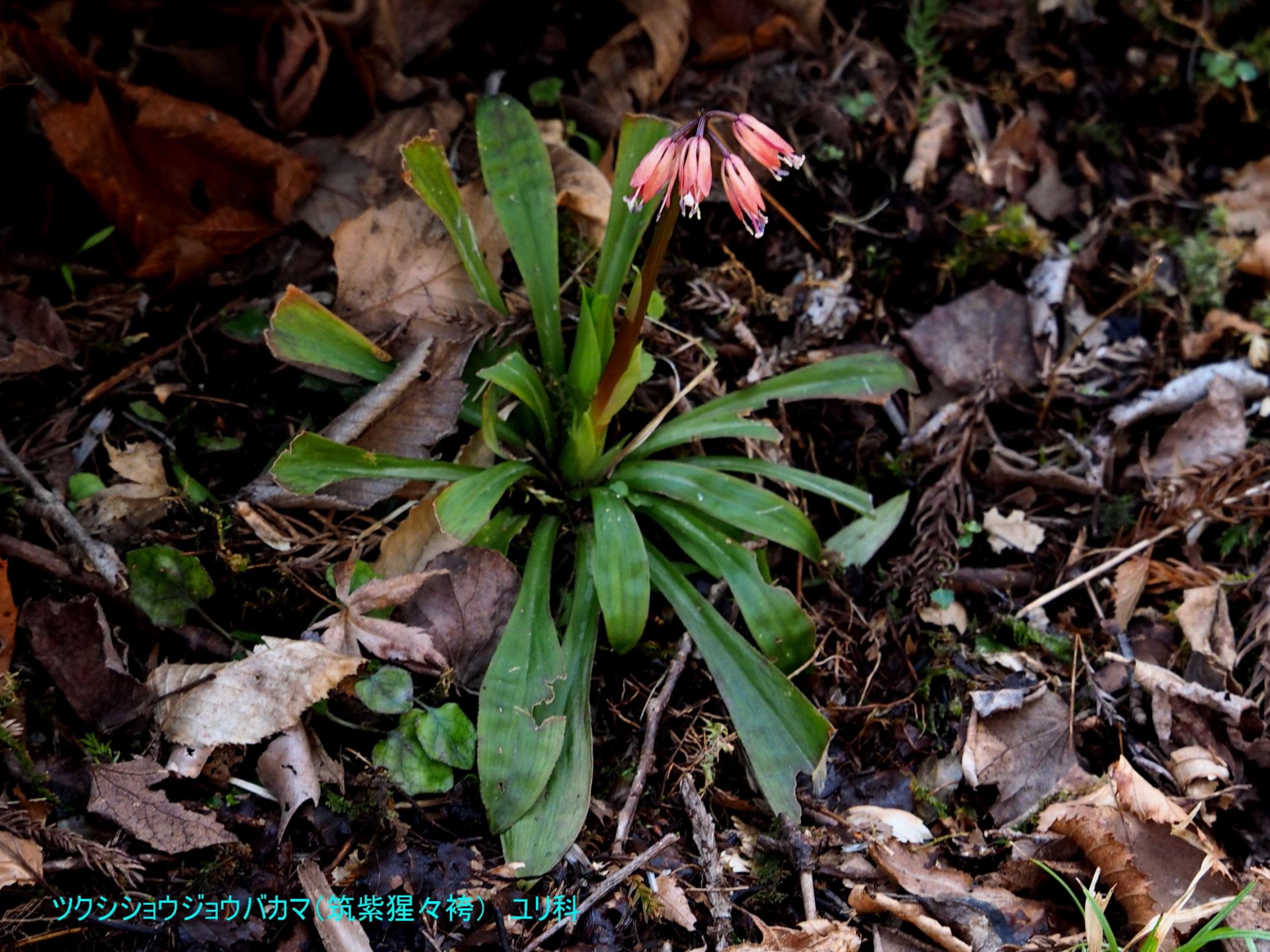
ツクシショウジョウバカマ(筑紫猩々袴) ユリ科