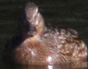
マガモ(真鴨) ガンカモ科 L=59cm