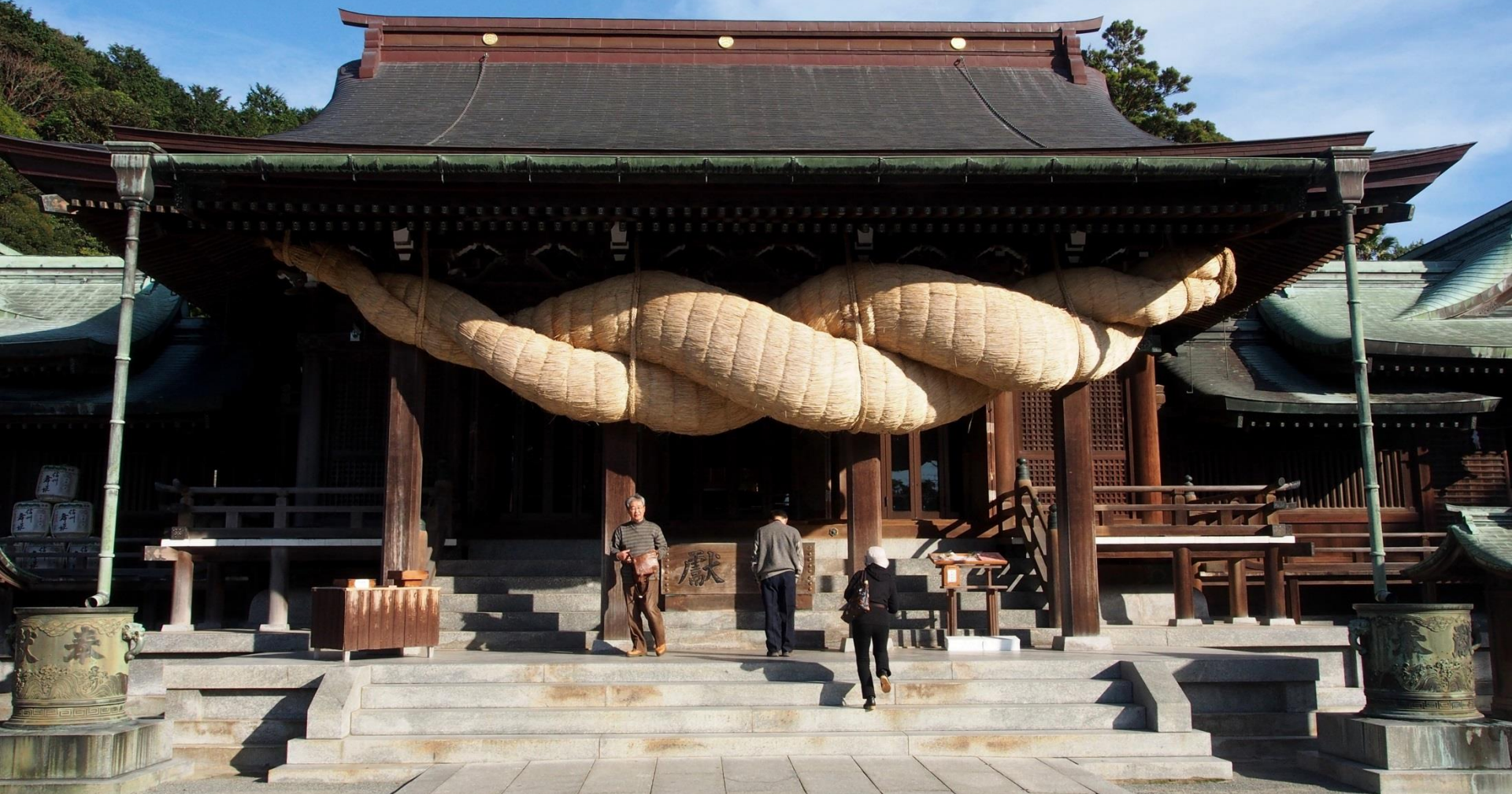
宮地嶽神社の日本一の大しめ縄