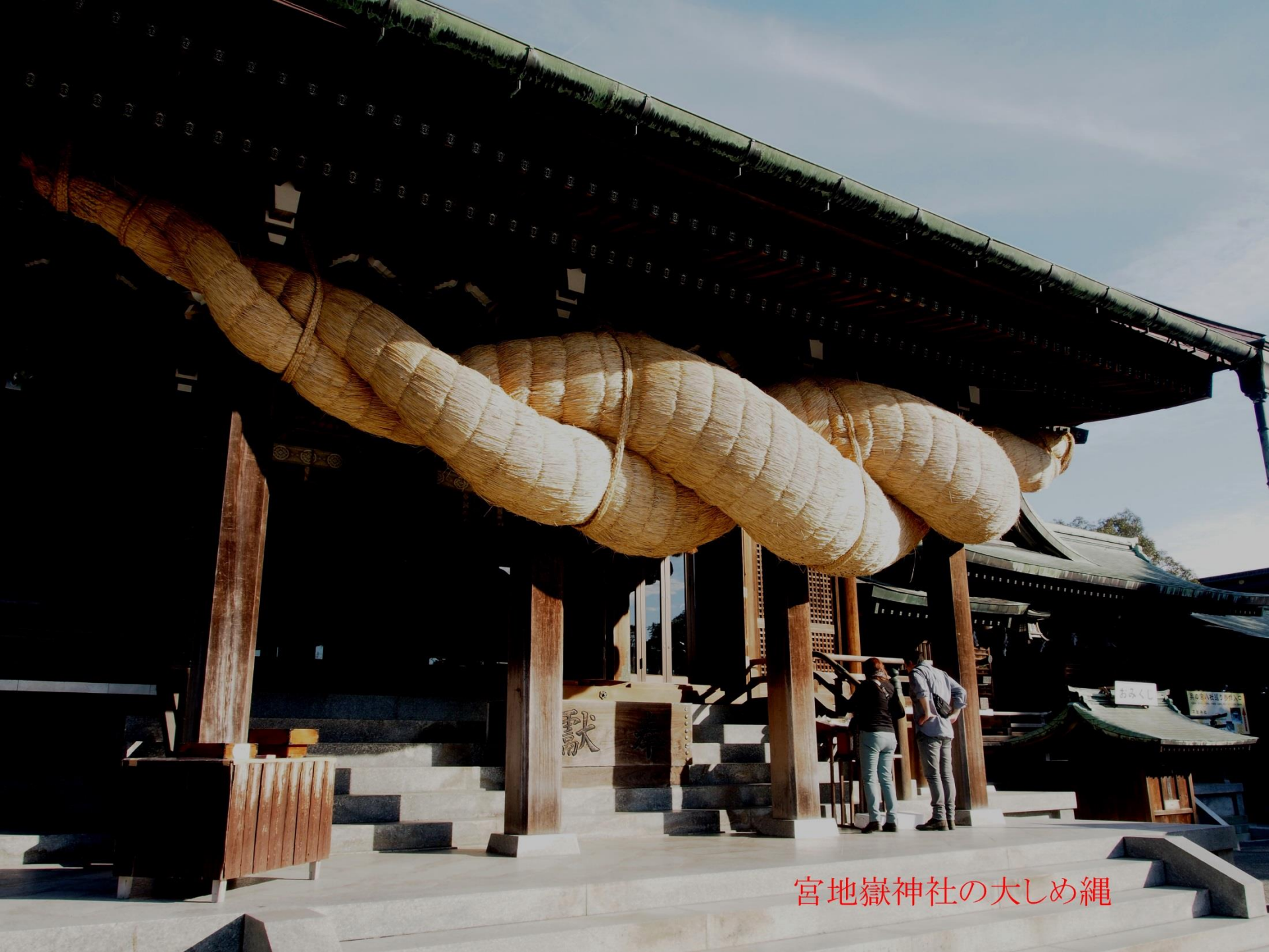
宮地嶽神社の大しめ縄