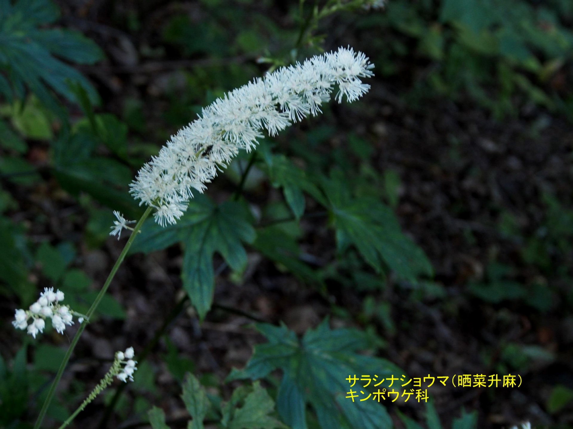
サラシナショウマ(晒菜升麻) キンポウゲ科