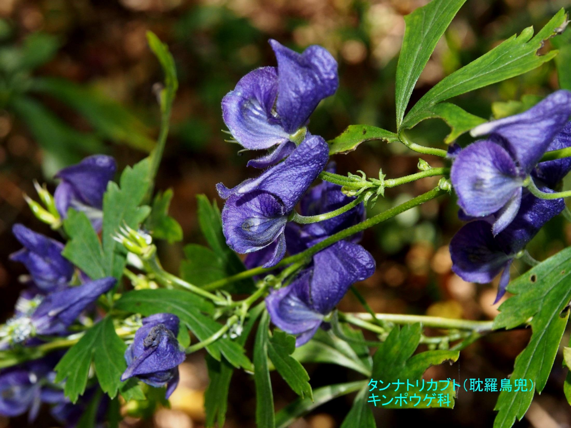
タンナトリカブト(耽羅烏兜) キンポウゲ科