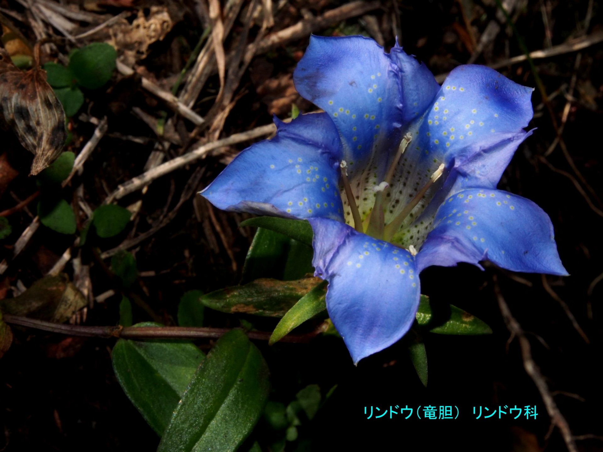
リンドウ(竜胆) リンドウ科