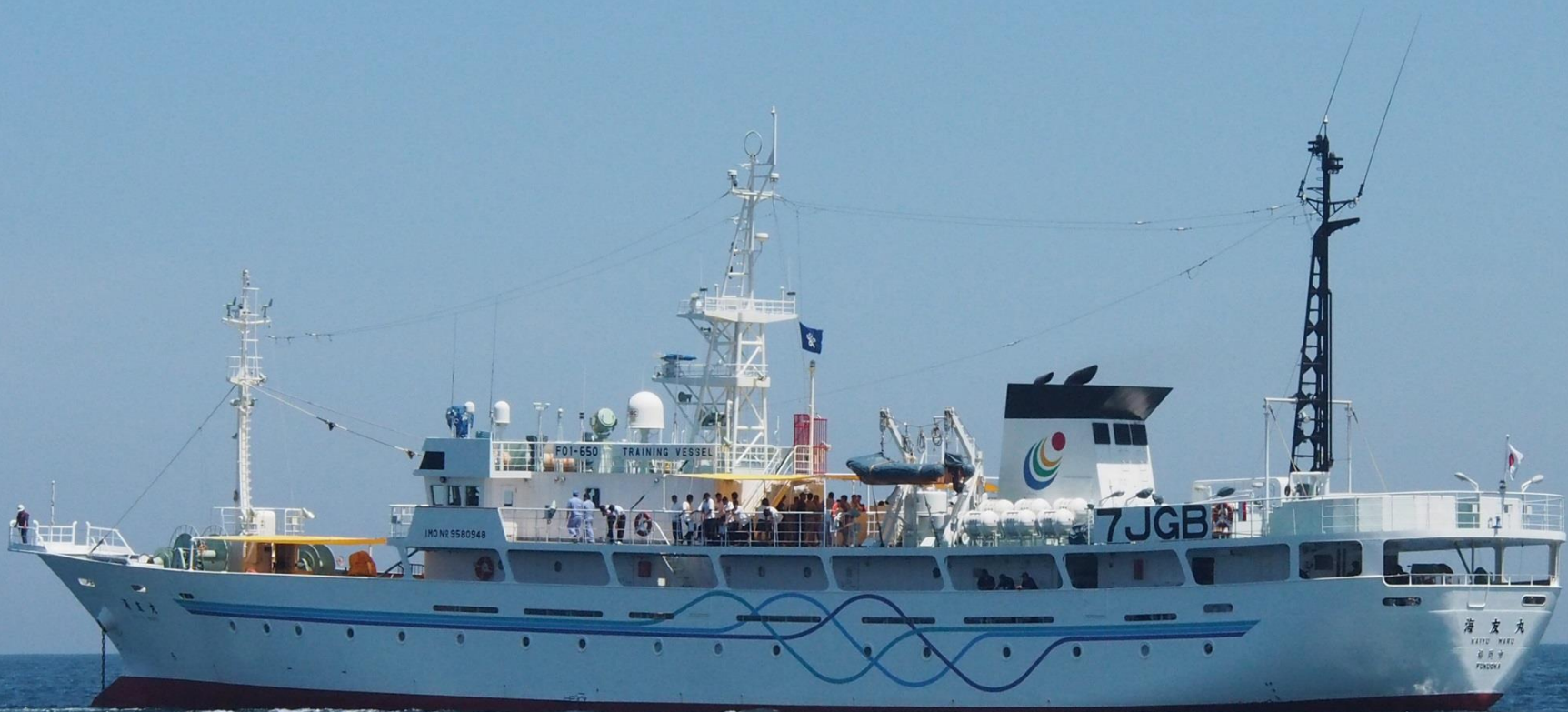
一福岡県立水産高等学校の実習船「海友丸」