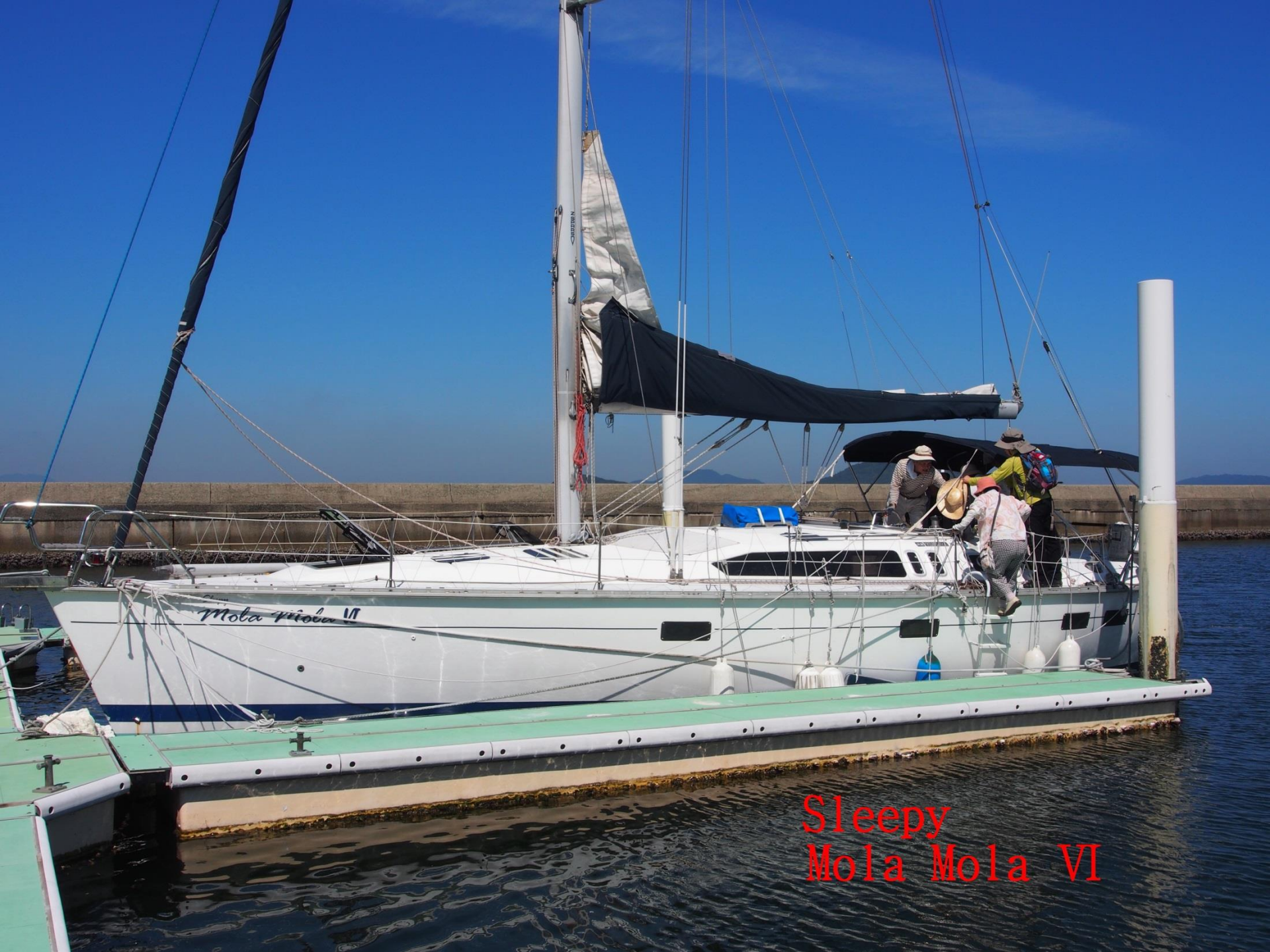
Sleepy Mola Mola VI