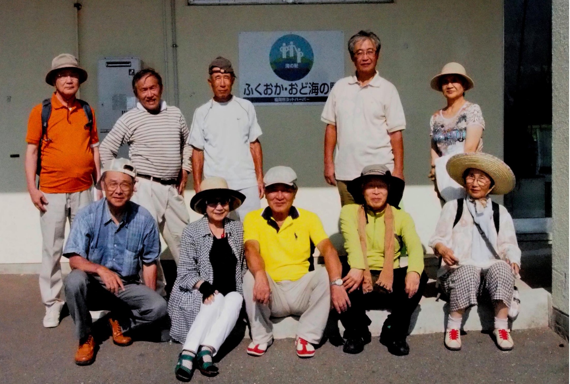
15:56 ふくおか・おど海の駅