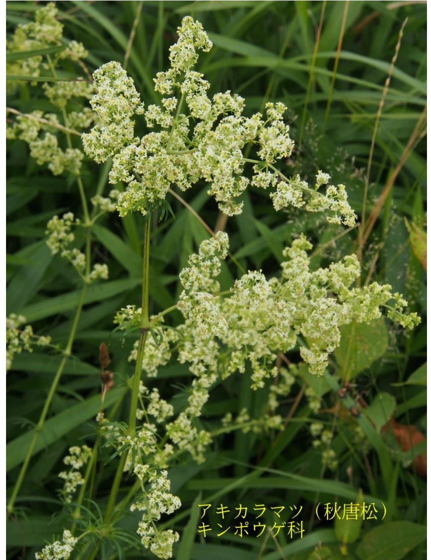
アキカラマツ (秋唐松) キンポウゲ科