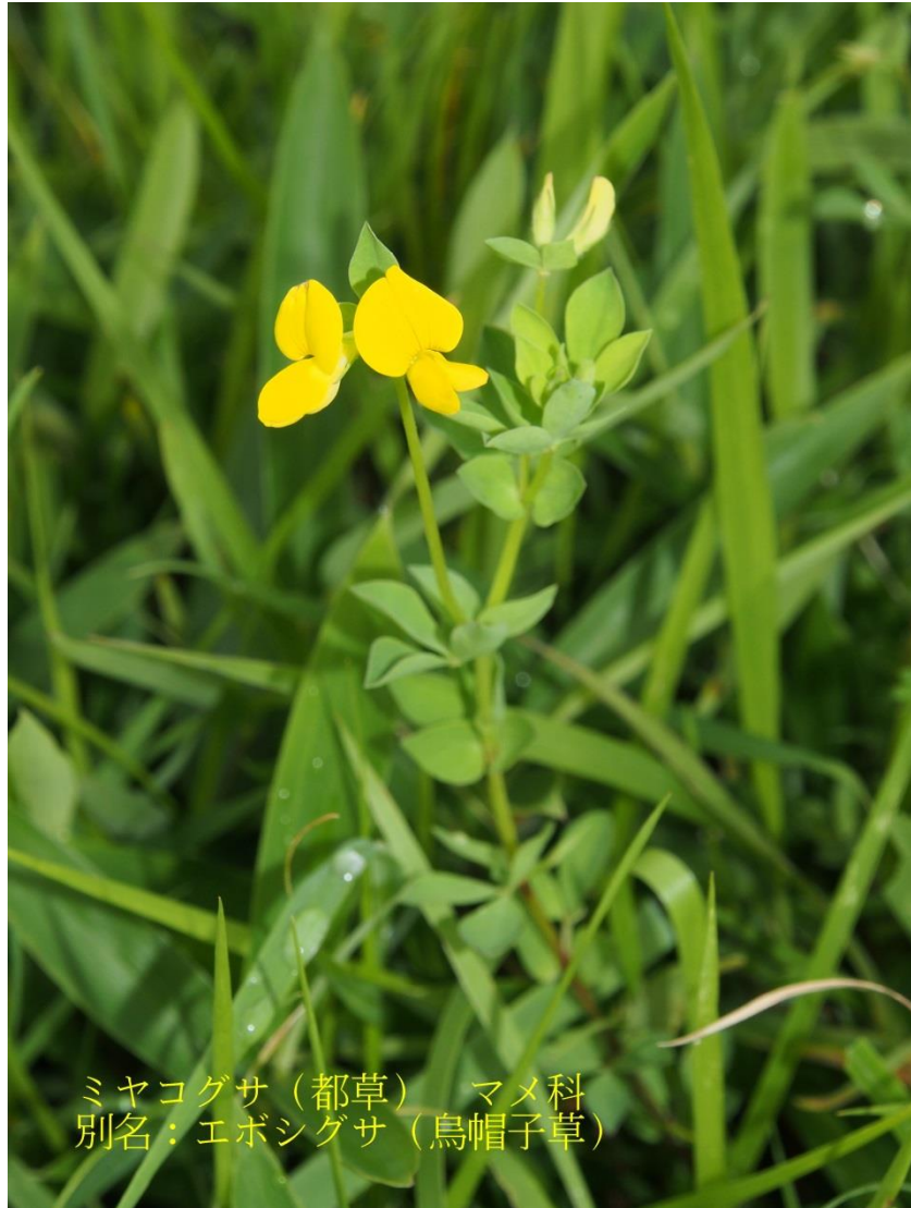
ミヤコグサ (都草) マメ科 別名: エボシグサ (烏帽子草)