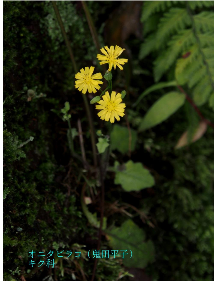
オニタビラコ (鬼田平子) キク科