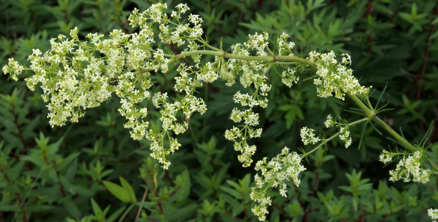
アキカラマツ (秋唐松) キンポウゲ科