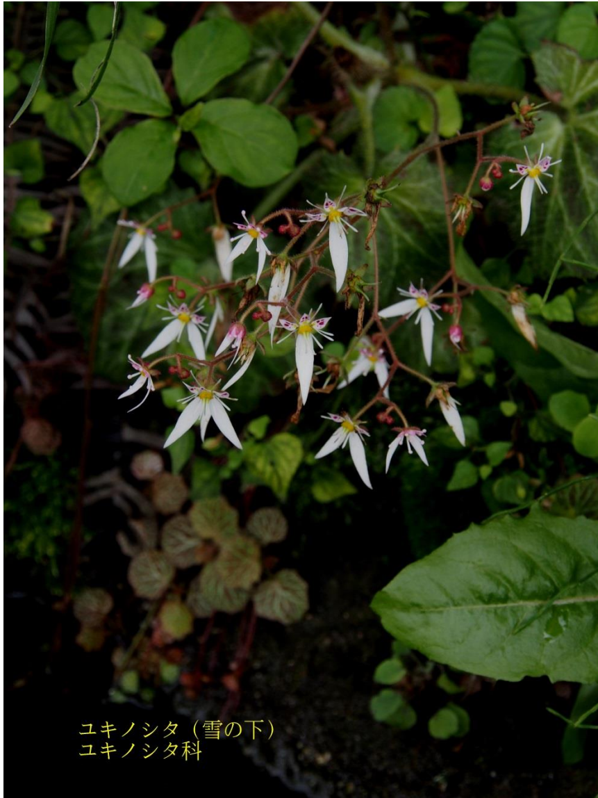
ユキノシタ (雪の下) ユキノシタ科