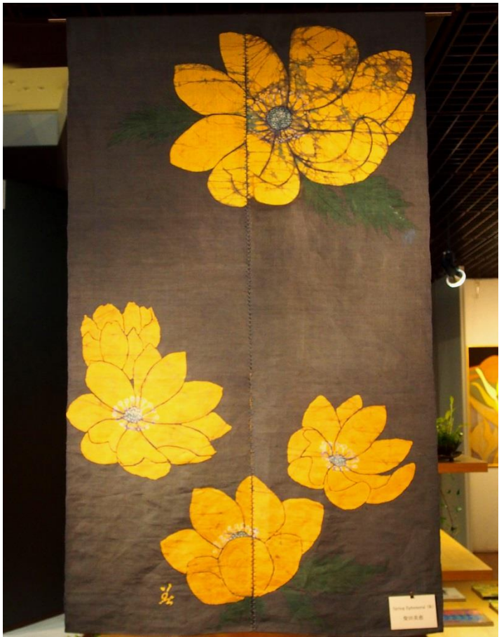
Spring Ephemeral (染) 柴田美恵