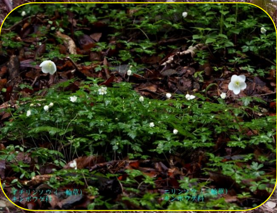
イチリンソウ (一輪草) キンポウゲ科