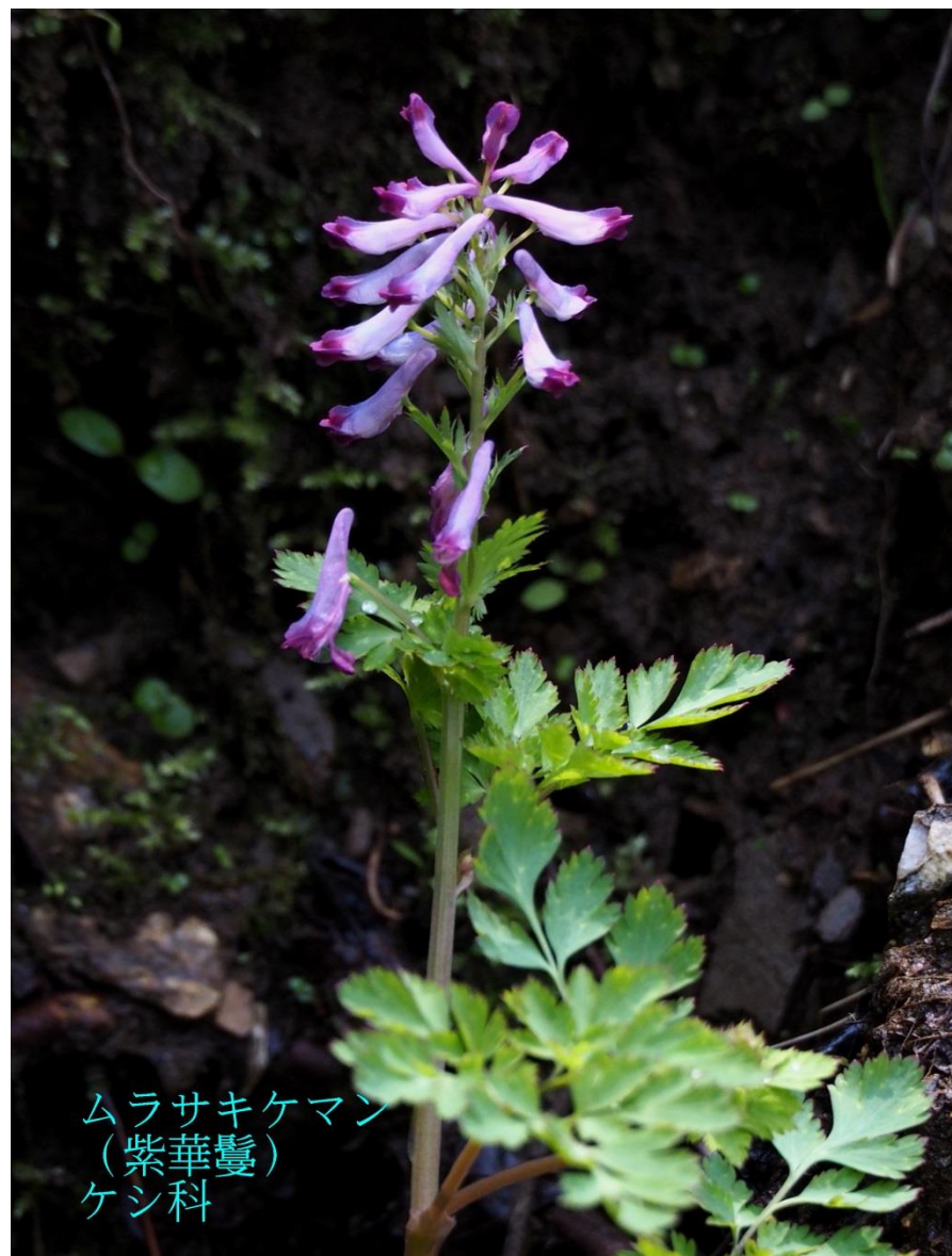
ムラサキケマン (紫華鬘) ケシ科