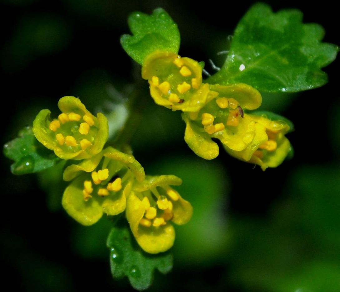
コガネネコノメソウ（黄金猫の目草） ユキノシタ科