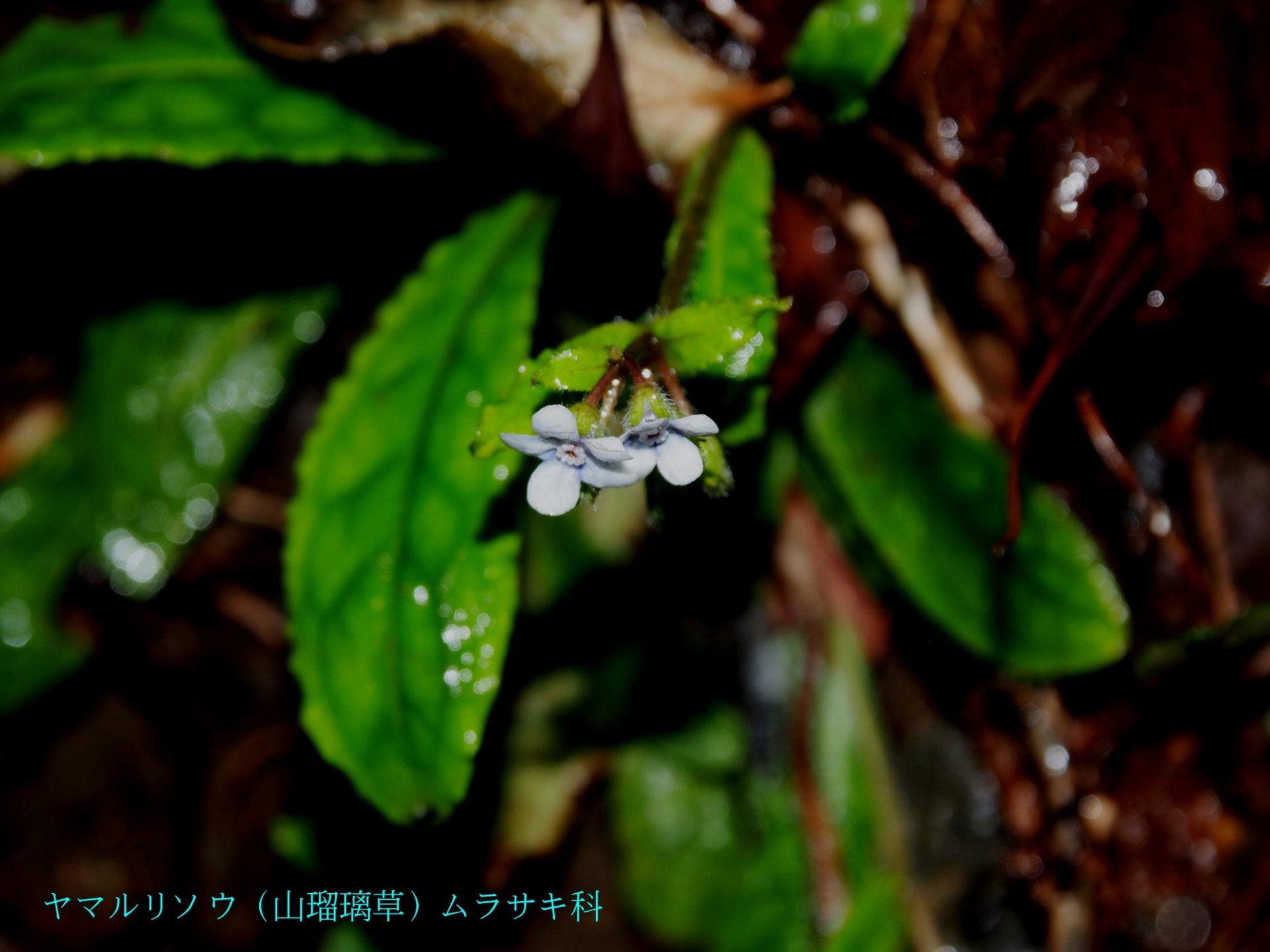
ヤマリソウ（山瑠璃草）ムラサキ科