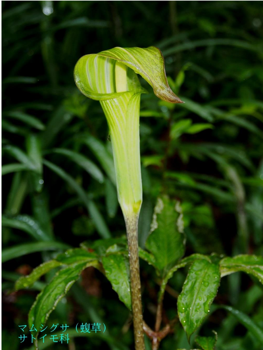
マムシグサ (蝮草) サトイモ科