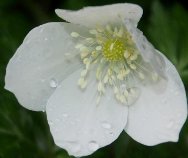
イチリンソウ（一輪草） キンポウゲ科