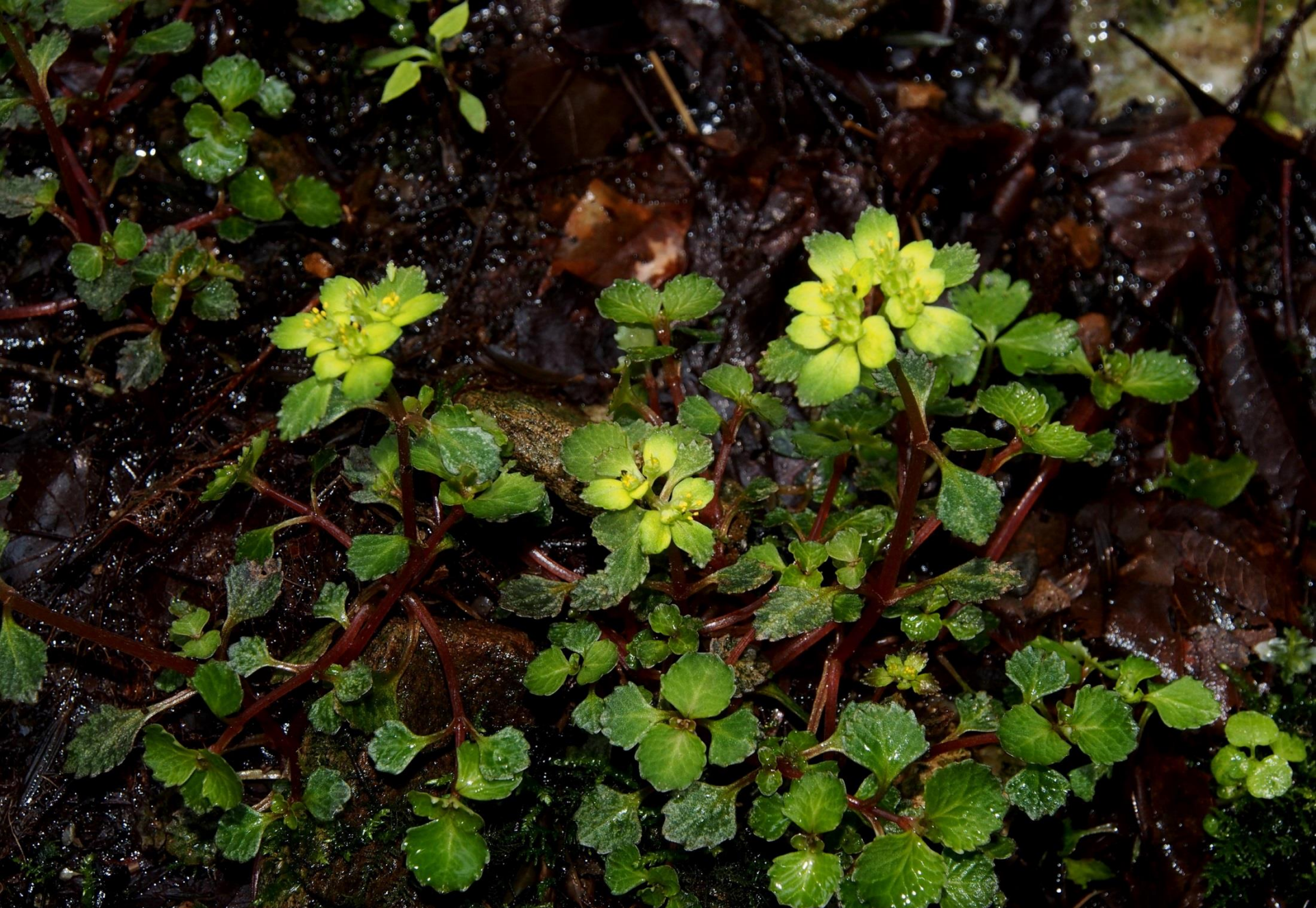
イワボタン（岩牡丹） ユキノシタ科 別名：ミヤマネコノメソウ