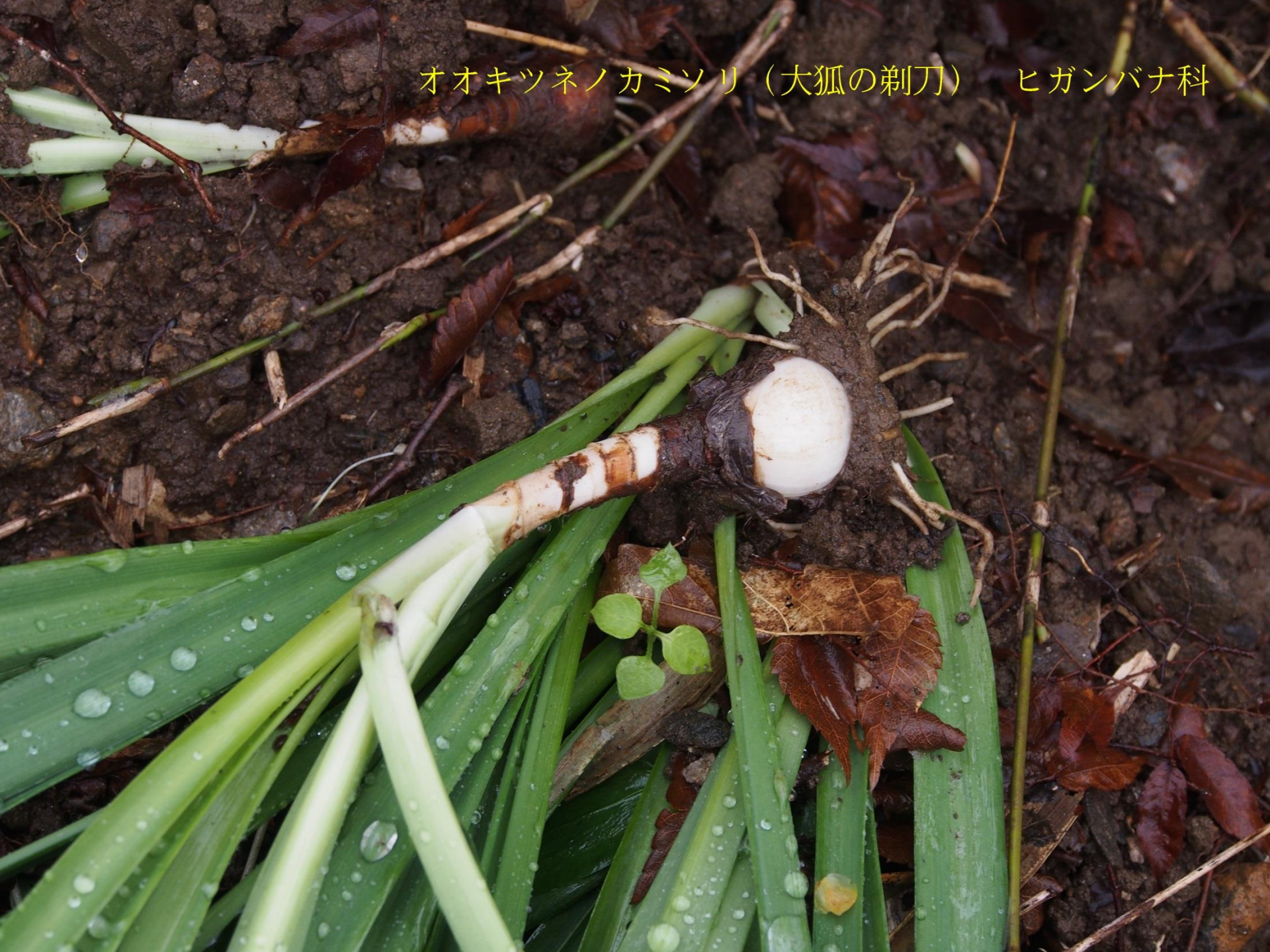
オオキツネノカミソリ (大狐の剃刀) ヒガンバナ科