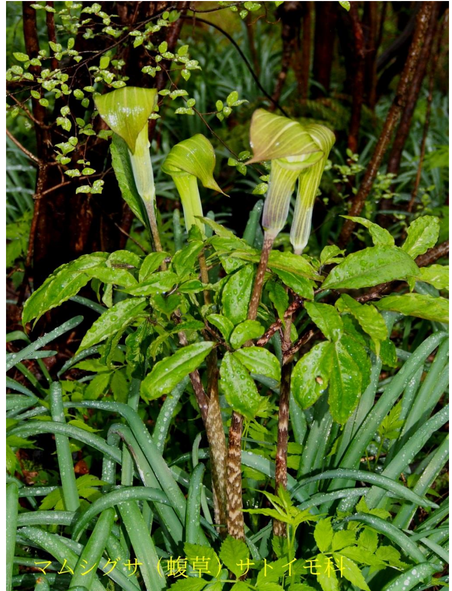
マムシグサ (蝮草) サトイモ科