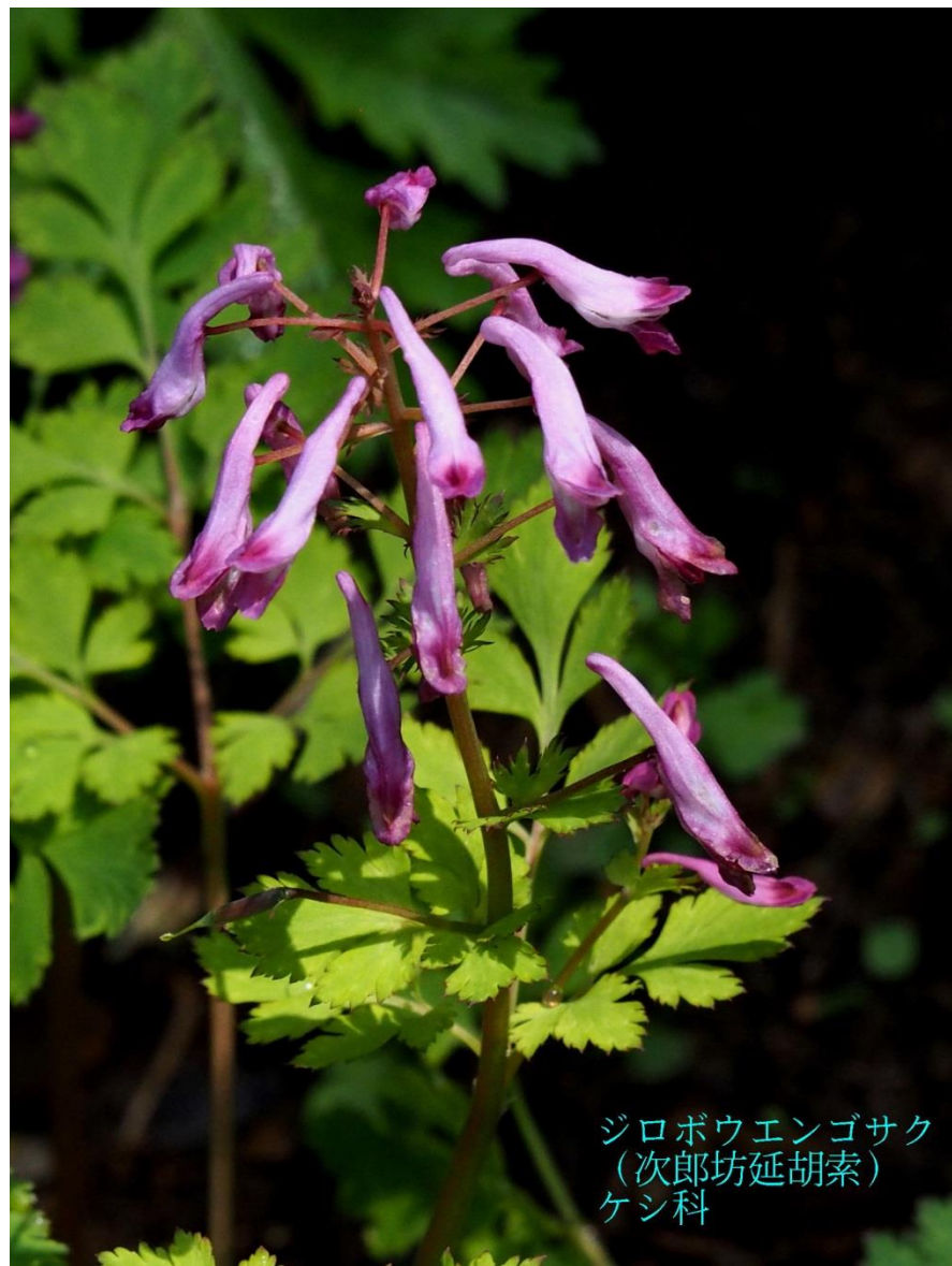
ジロボウエンゴサク (次郎坊延胡索) ケシ科