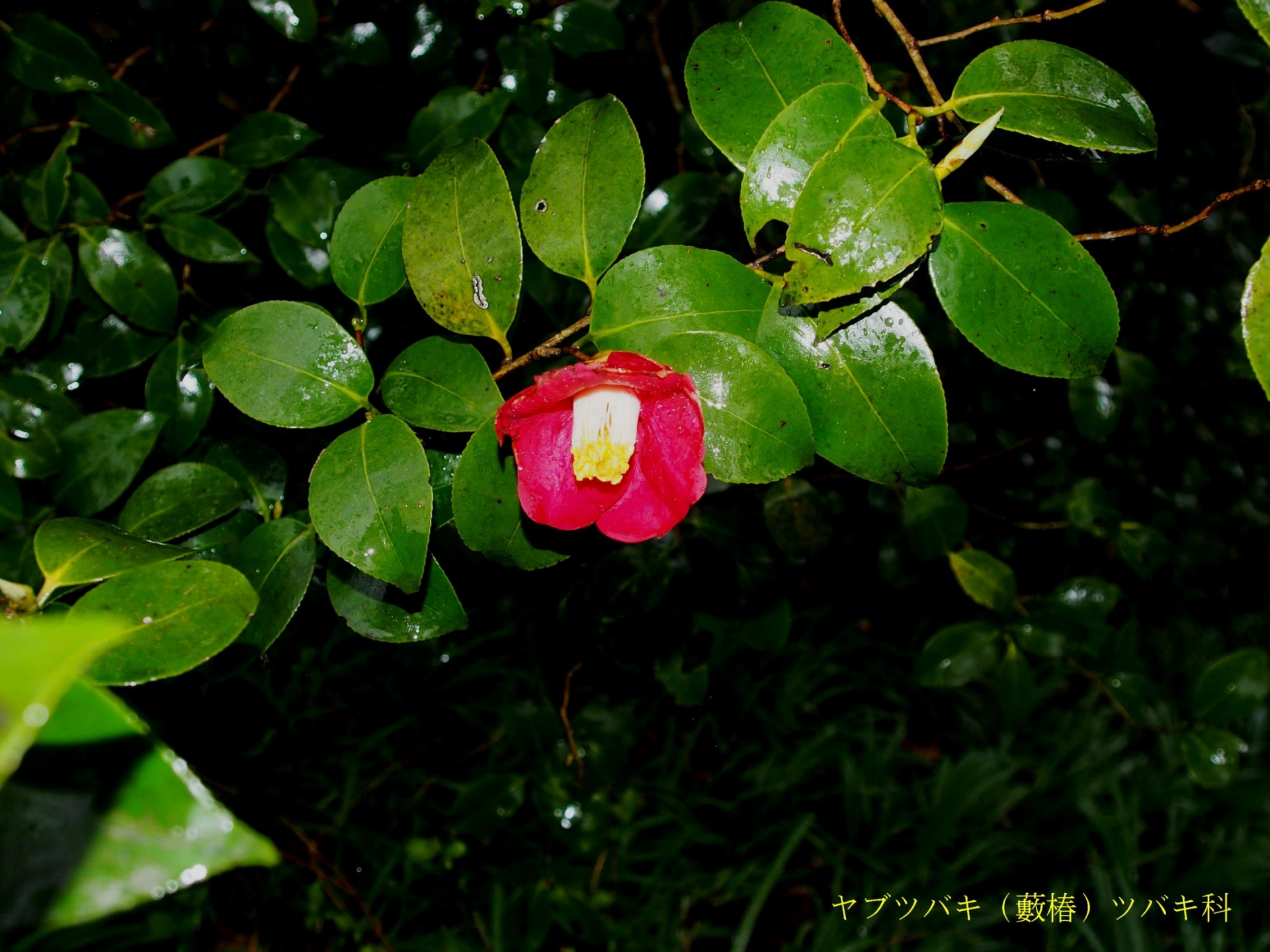
ヤブツバキ（藪椿）ツバキ科