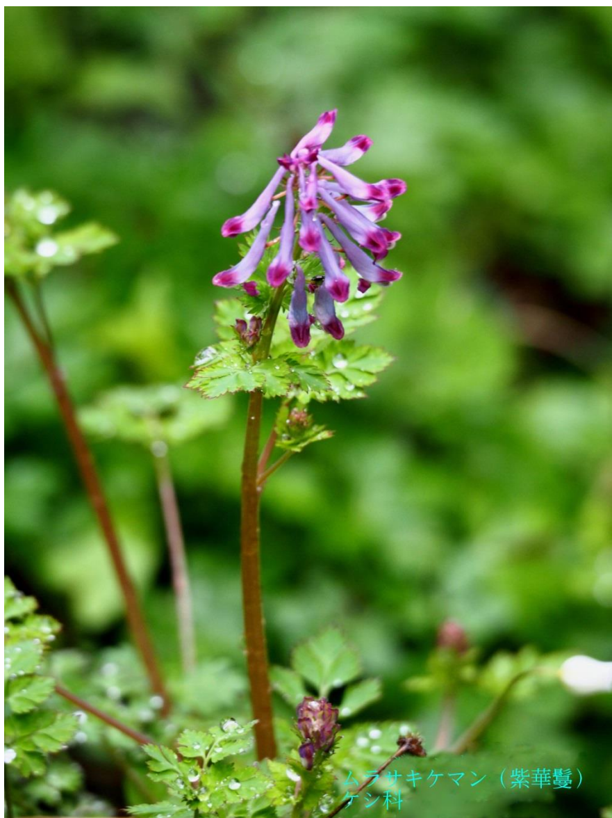
ムラサキケマン (紫華鬘) ケシ科