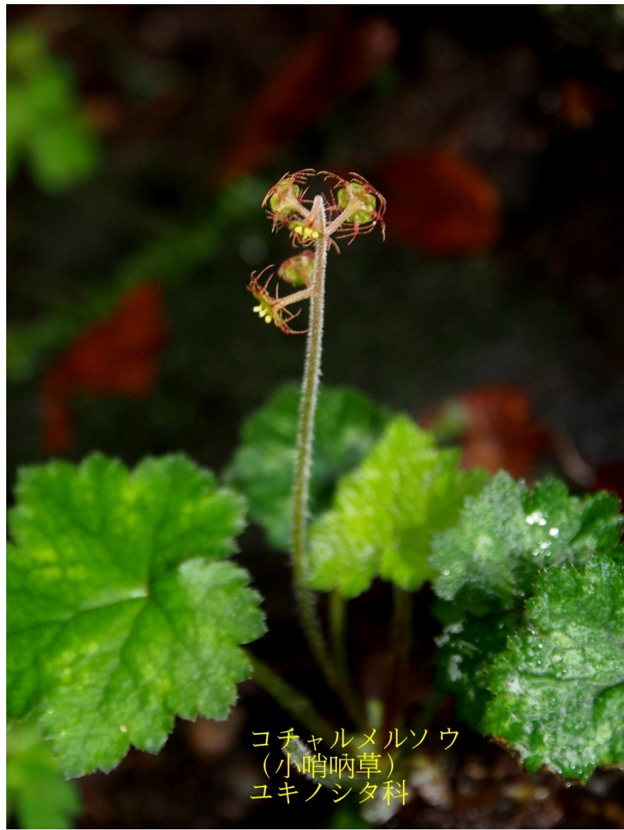
コチャルメルソウ (小哨唸草) ユキノシタ科