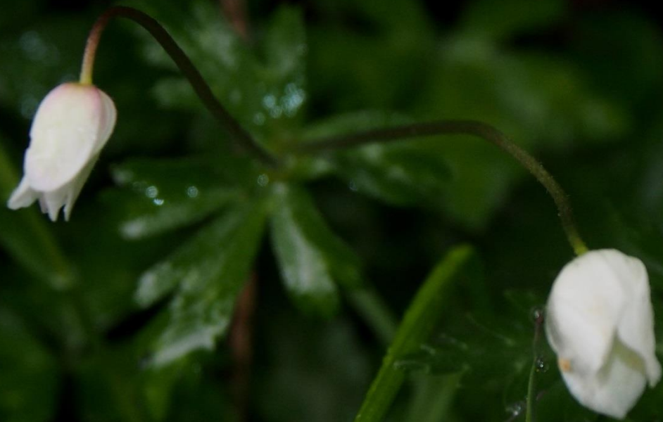
ニリンソウ（二輪草） キンポウゲ科