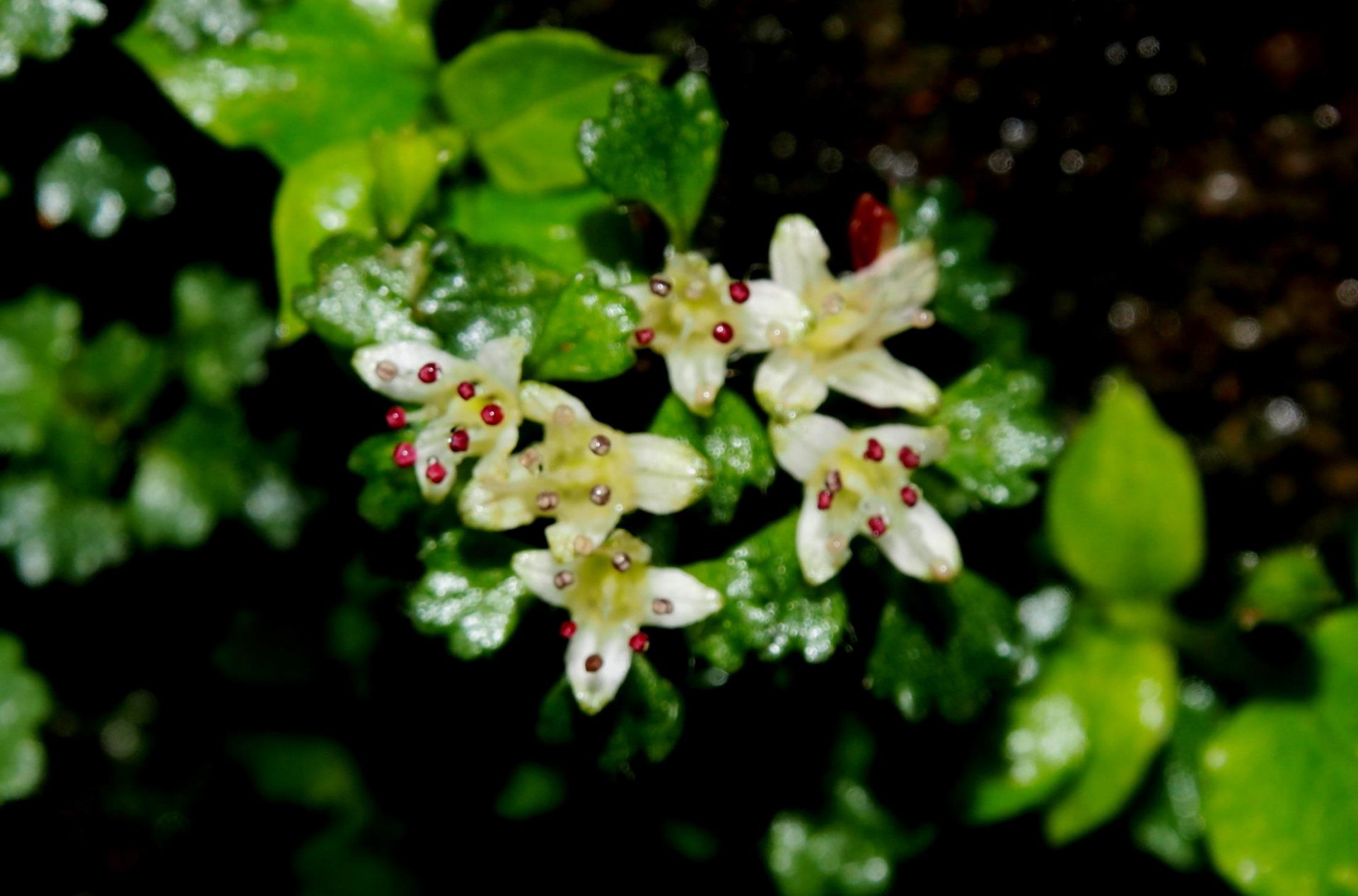
シロバナネコノメソウ（白花猫の目草） ユキノシタ科