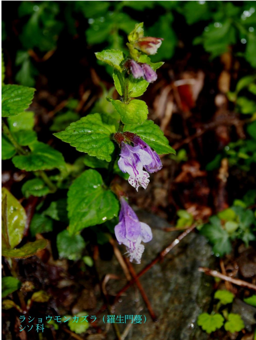
ラショウモンカズラ（羅生門蔓） シソ科