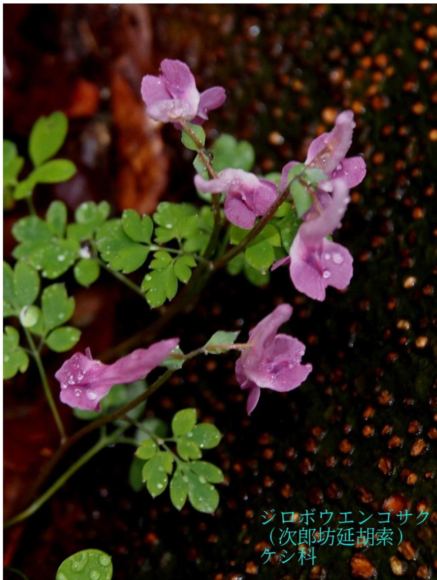
ジロボウエンゴサク (次郎坊延胡索) ケシ科