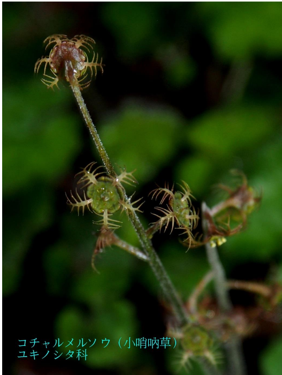
コチャルメルソウ (小哨唸草) ユキノシタ科