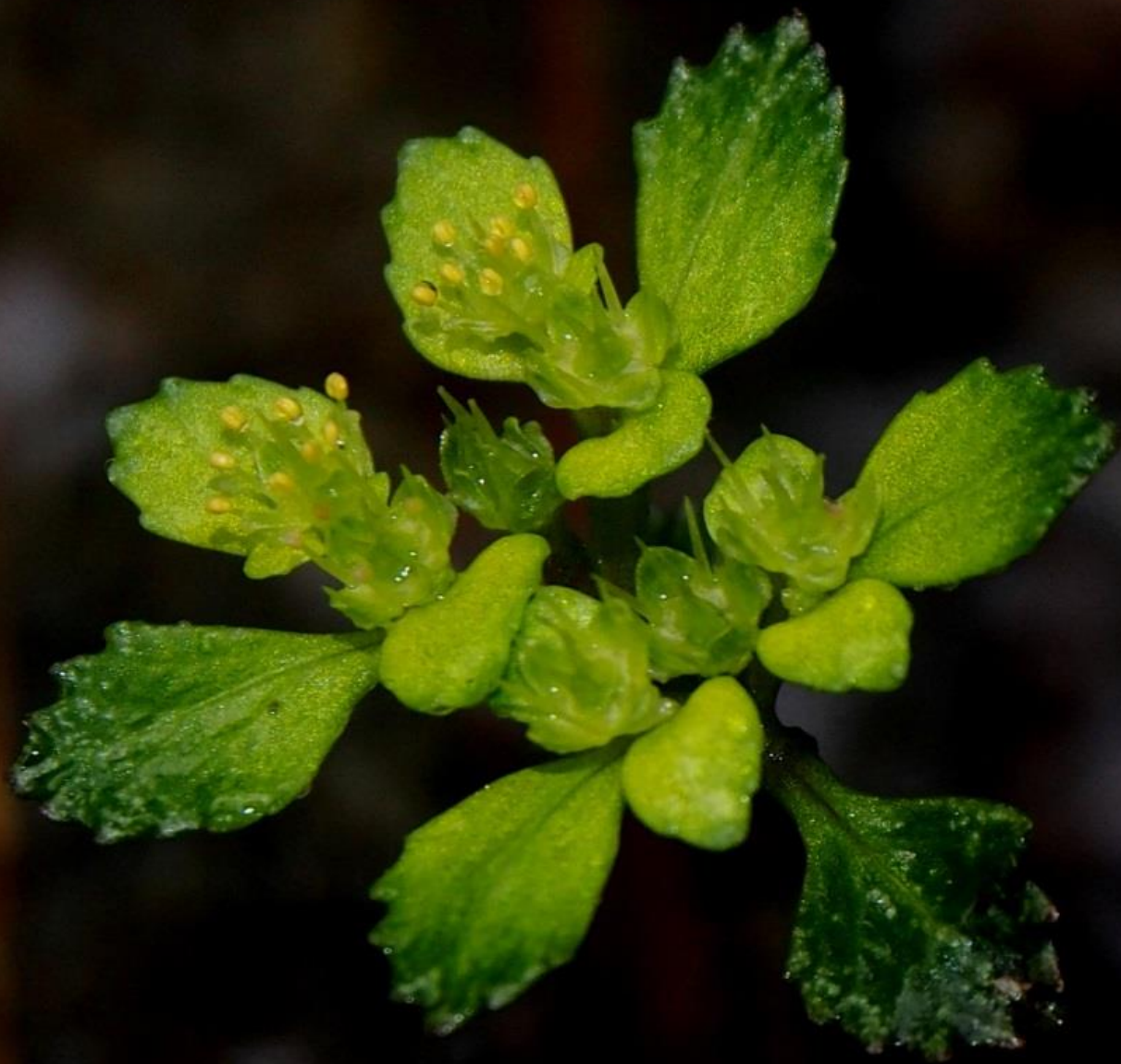
イワボタン（岩牡丹） ユキノシタ科 別名：ミヤマネコノメソウ