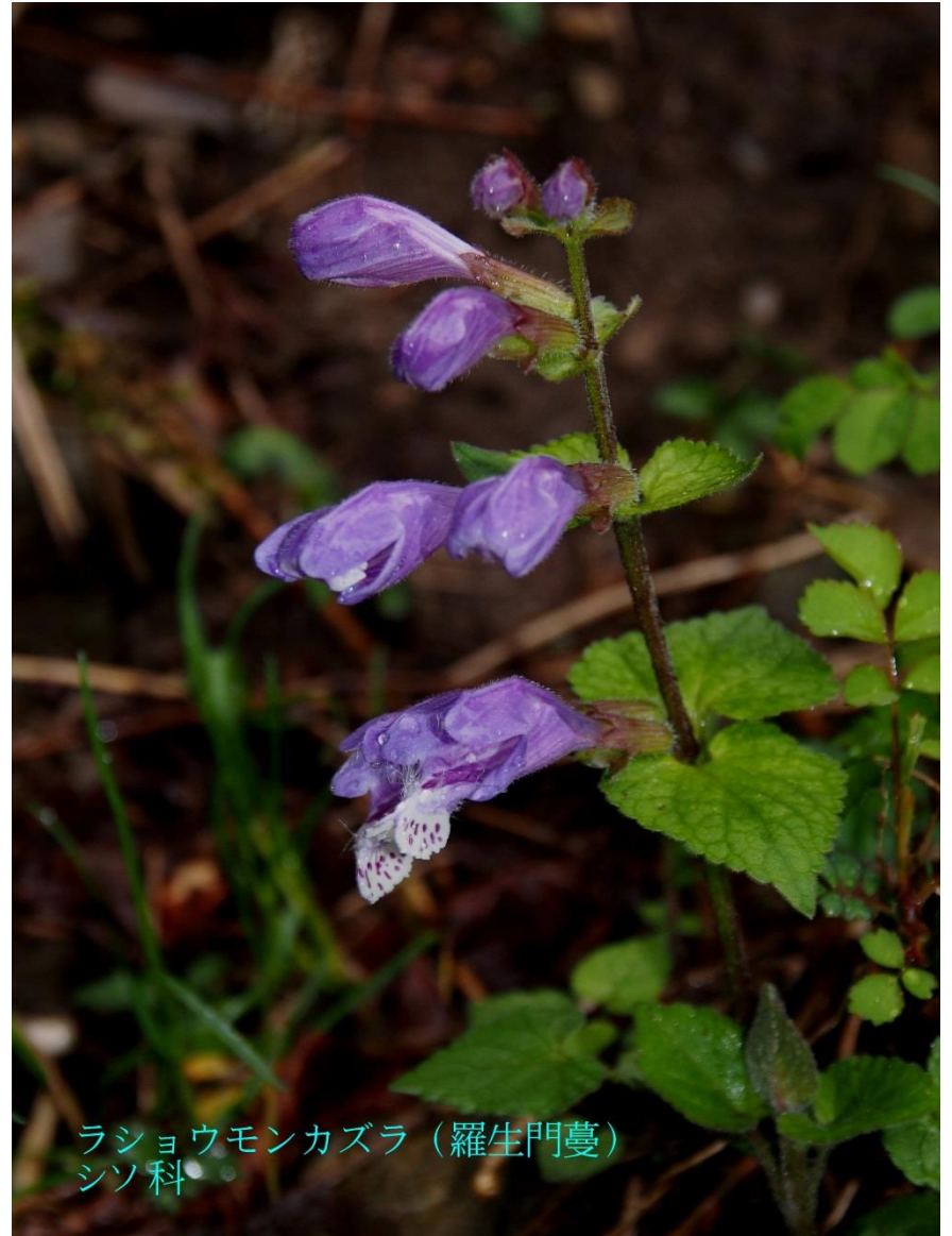
ラショウモンカズラ（羅生門蔓） シソ科