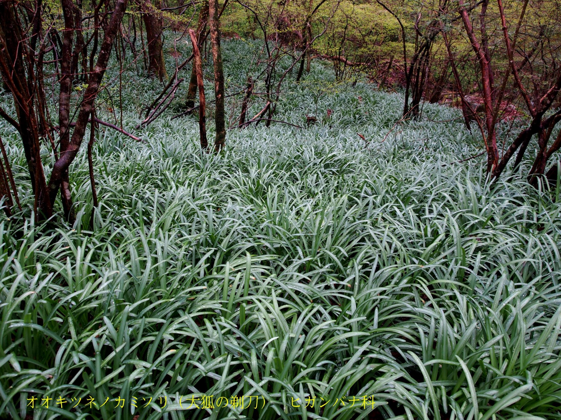
オオキツネノカミヅリ（大狐の剃刀） ヒガンバナ科