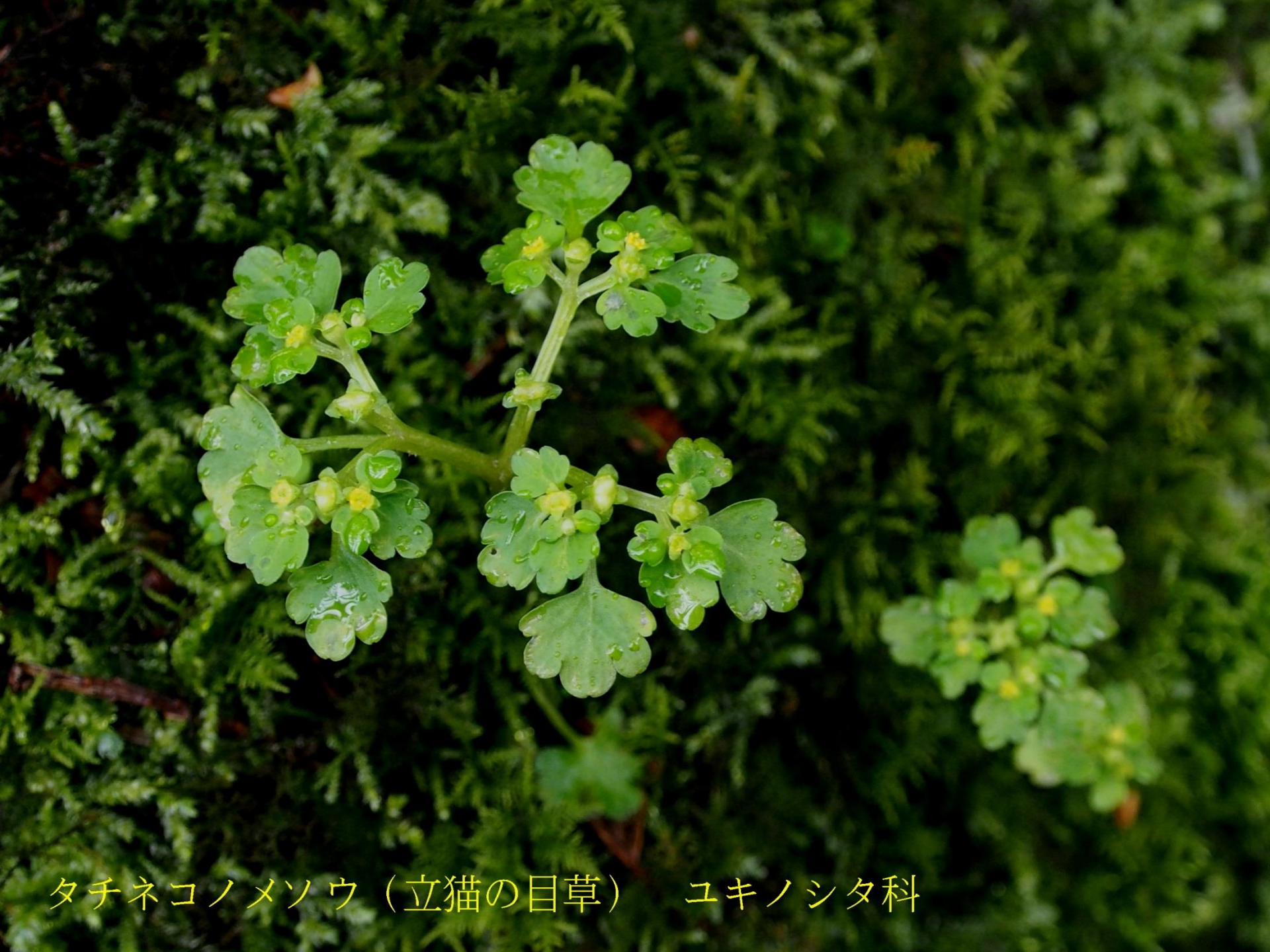
タチネコノメソウ（立猫の目草） ユキノシタ科