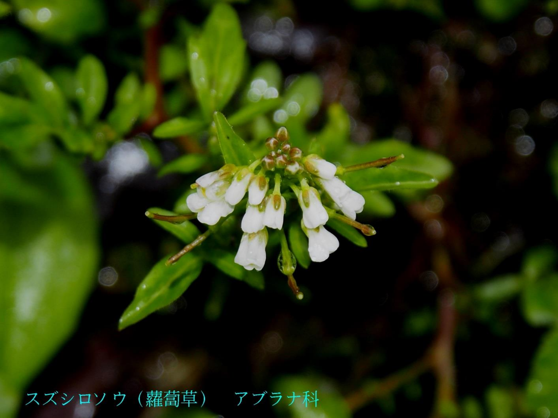
スズシロソウ（蘿蔔草） アブラナ科