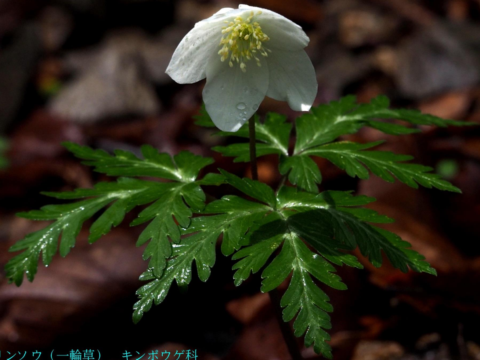
イチリンソウ（一輪草） キンポウゲ科