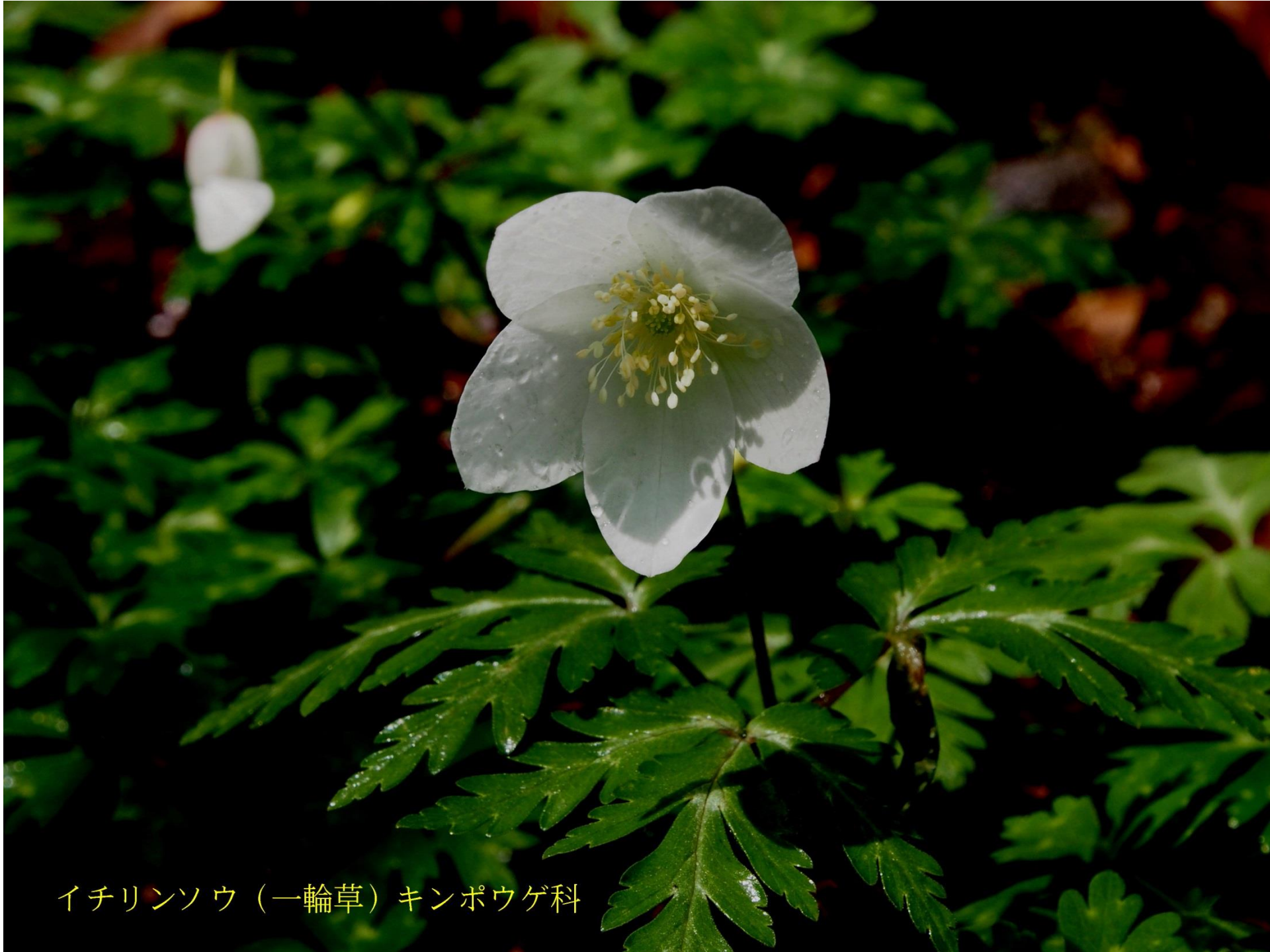
イチリンソウ（一輪草）キンポウゲ科