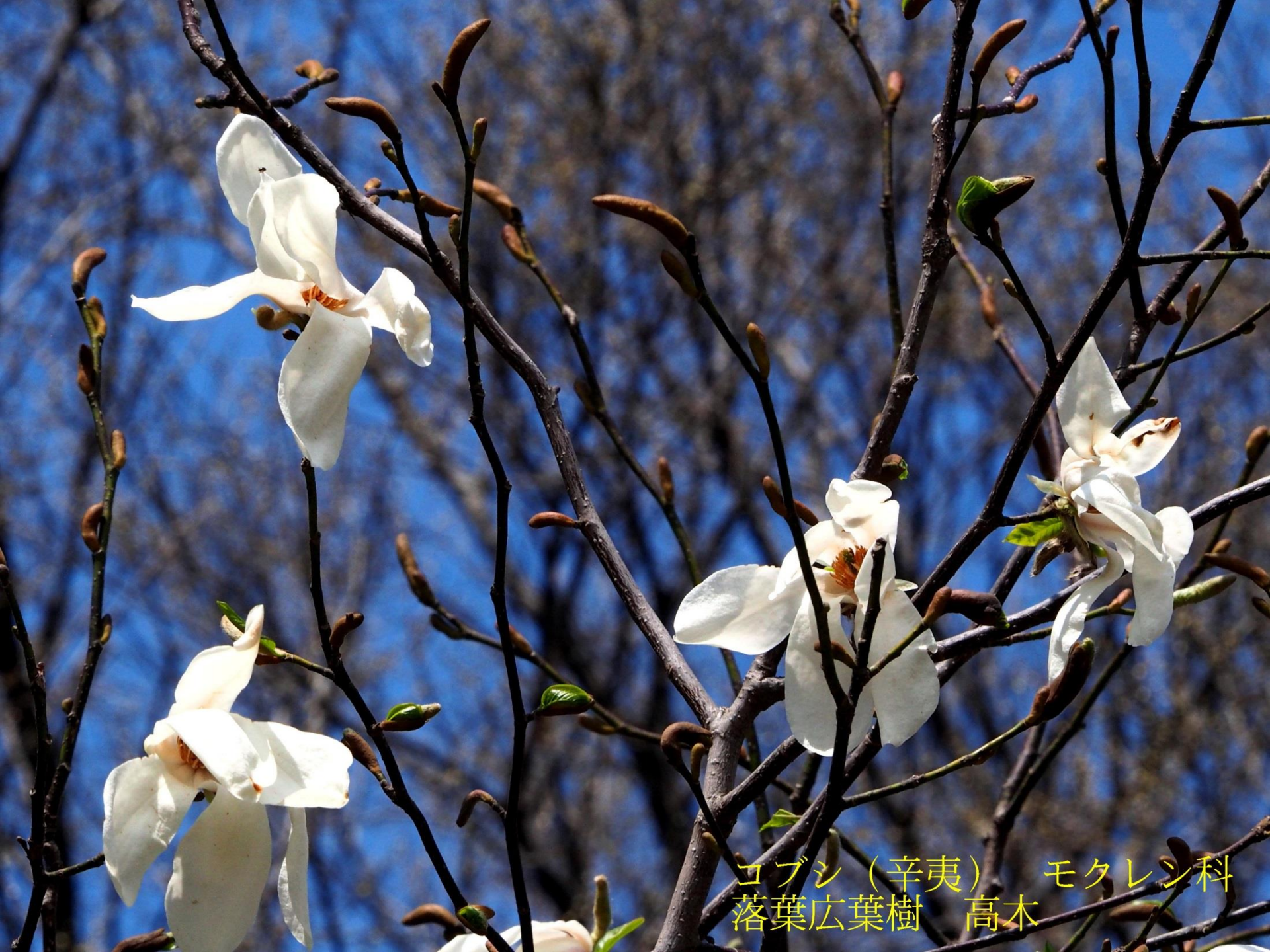
ヨブシ（辛夷） モクレン科 落葉広葉樹 高木