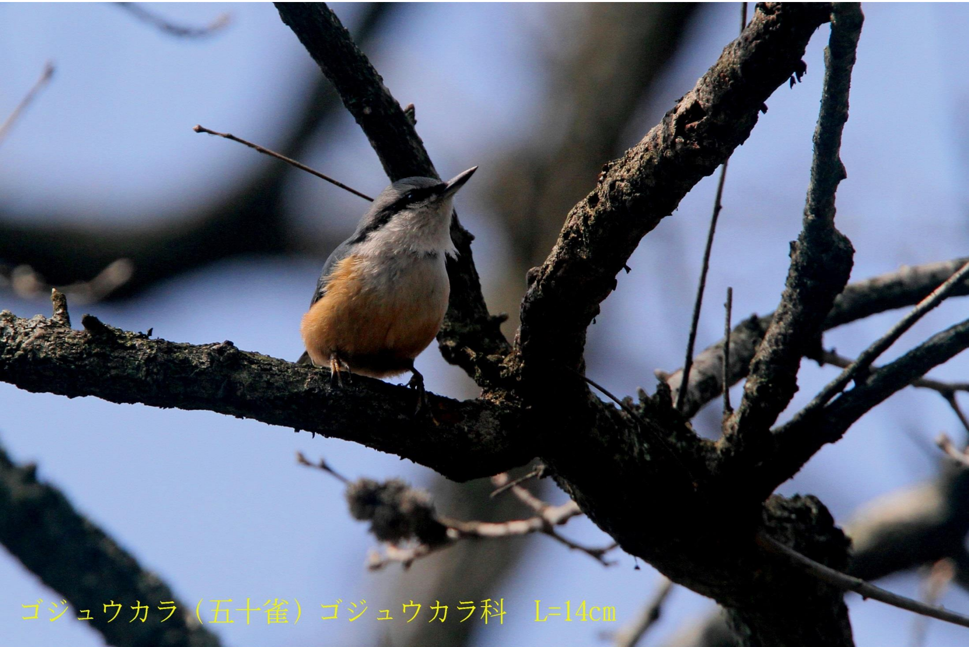
ゴジュウカラ (五十雀) ゴジュウカラ科 L=14cm

食性は 雑食 で、 昆虫類 、 節足動物 、 果実 、 種子 などを食べる。夏季は昆虫類、冬季は種子等を主に食べる。 樹皮の隙間にいる獲物を探したり、逆に樹皮の隙間に食物を蓄えることもある。