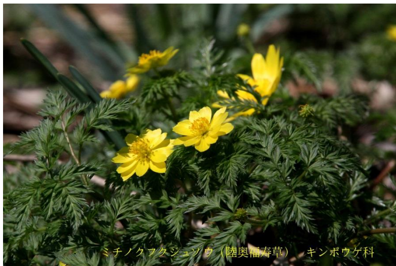
ミチノクフクジュソウ (陸奥福寿草) キンポウゲ科