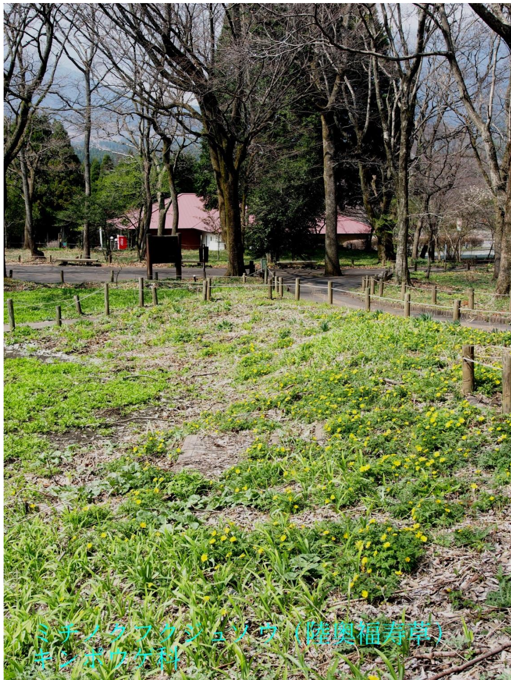
ミチノクフクジュソウ (陸奥福寿草) キンポウゲ科