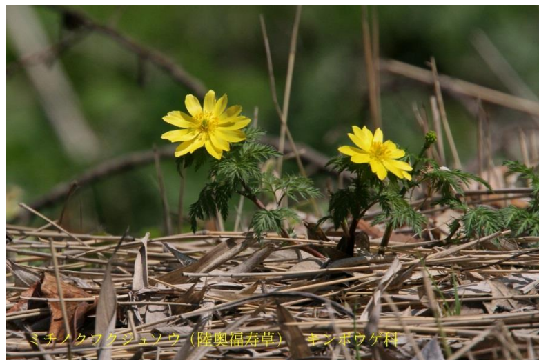
ミチノクフクジュソウ (陸奥福寿草) キンポウゲ科