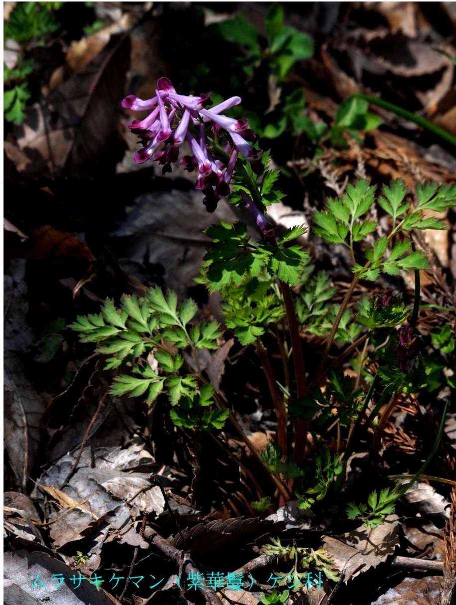
ムラサキケマン (紫華曇) ケシ科