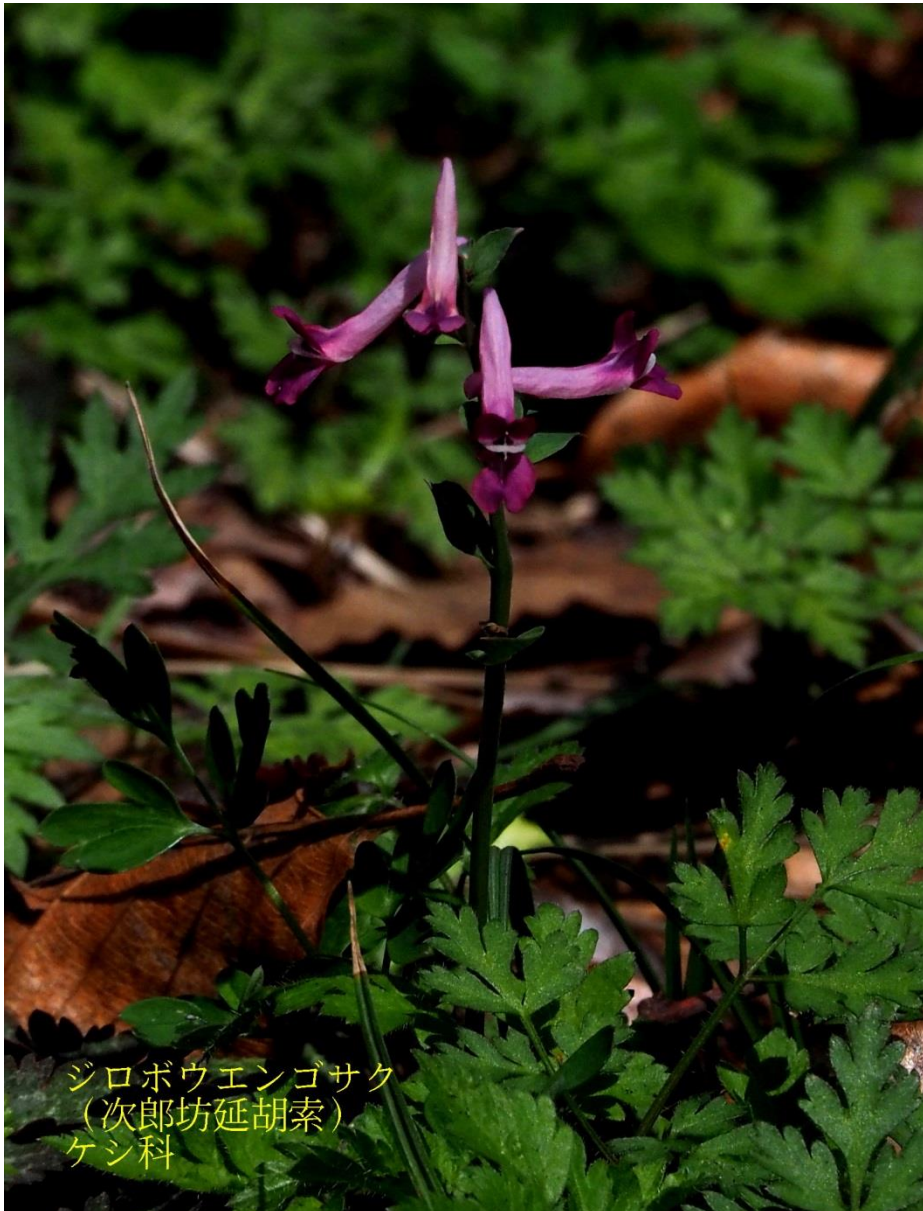
ジロボウエンゴサク (次郎坊延胡索) ケシ科