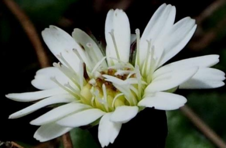
センボンヤリ (千本槍) キク科