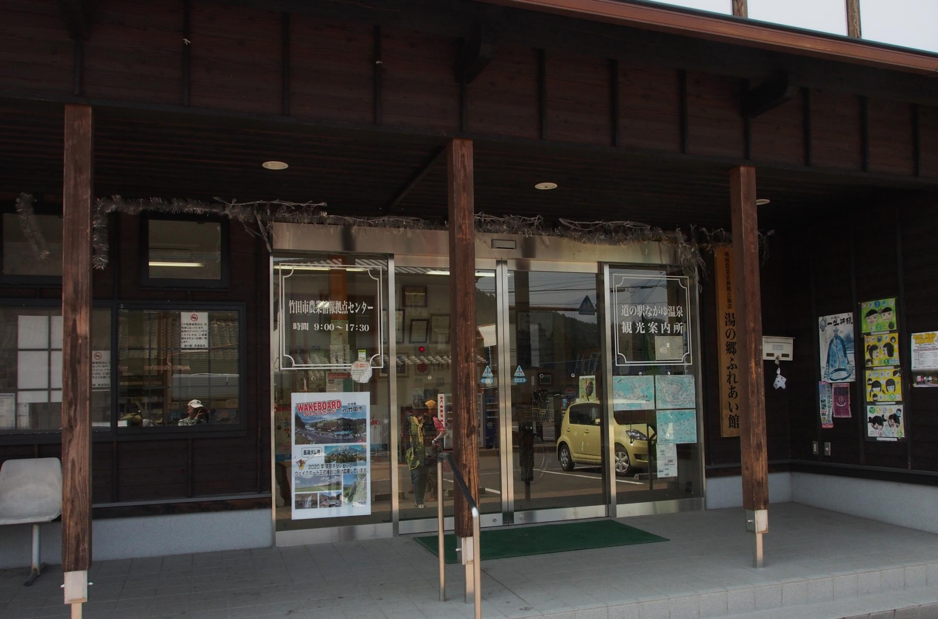
13:27 長湯温泉観光案内所で観光マップを手にして、 遅い昼食をとることにした。