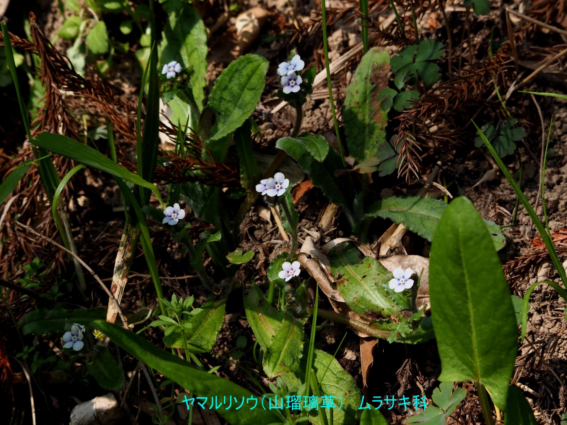
ヤマハリソウ(山瑠璃草) ムラサキ科