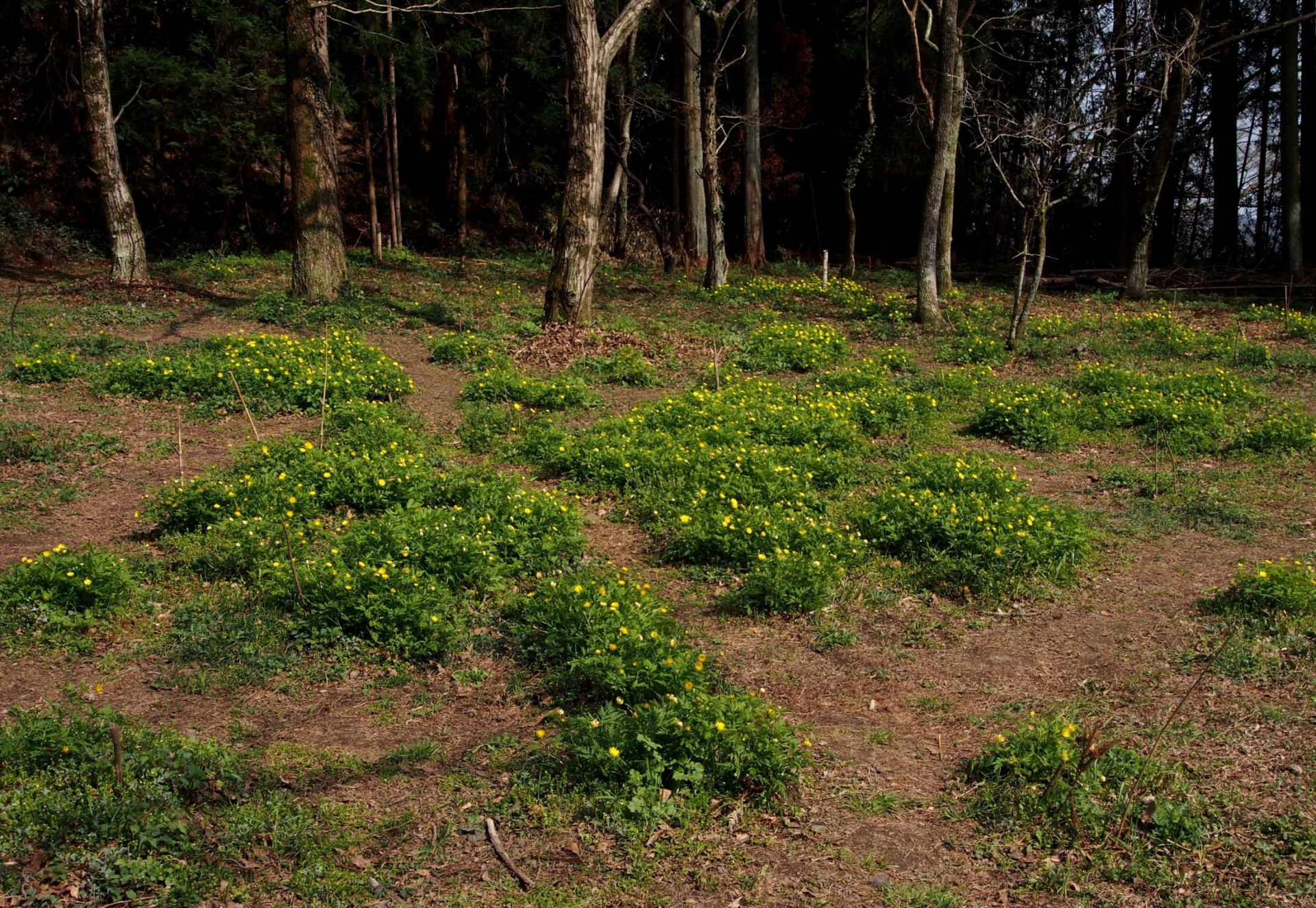
15:19 フクジュソウ (福寿草) キンボウゲ科