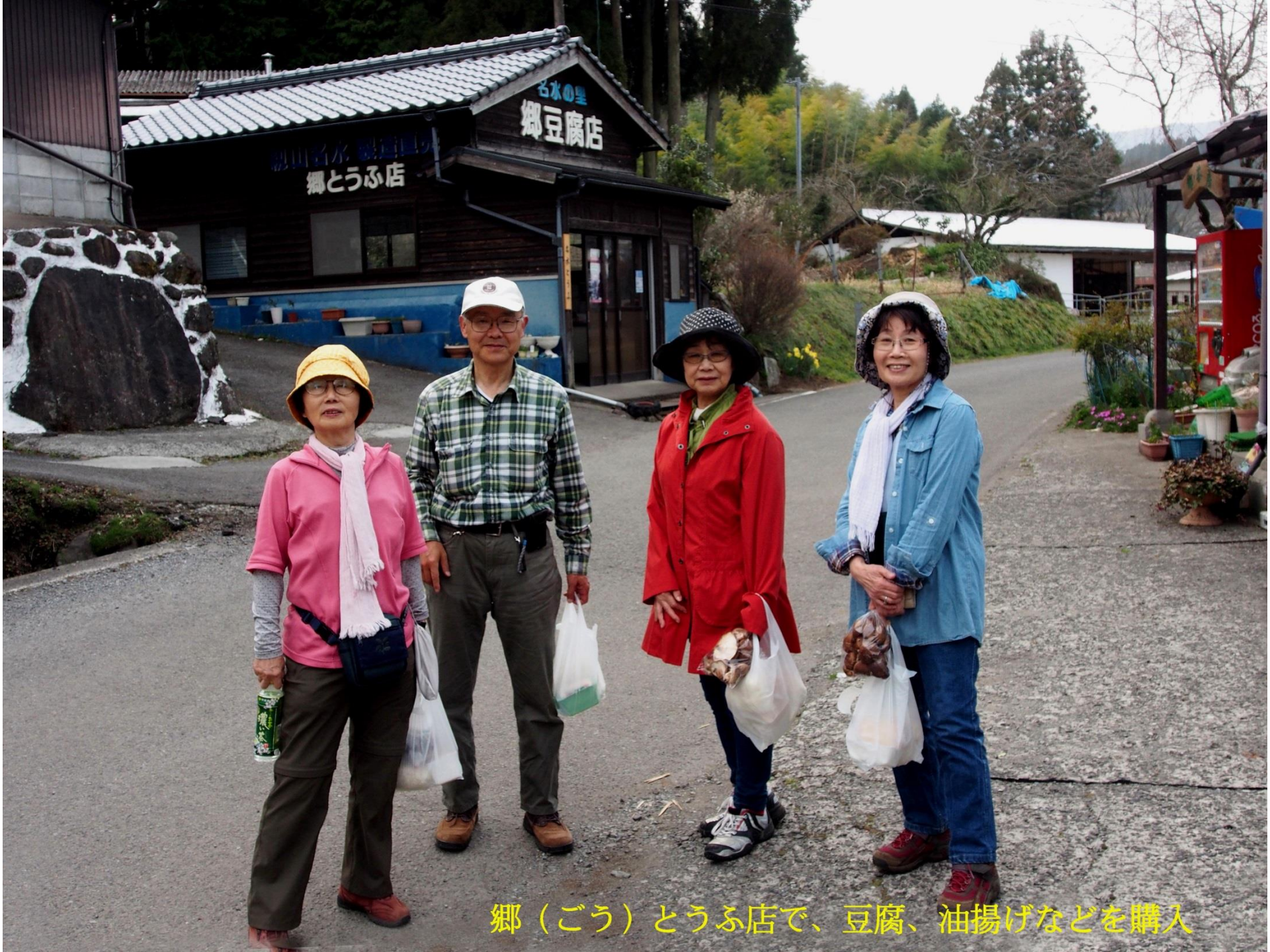
郷（ごう）とうふ店で、豆腐、油揚げなどを購入