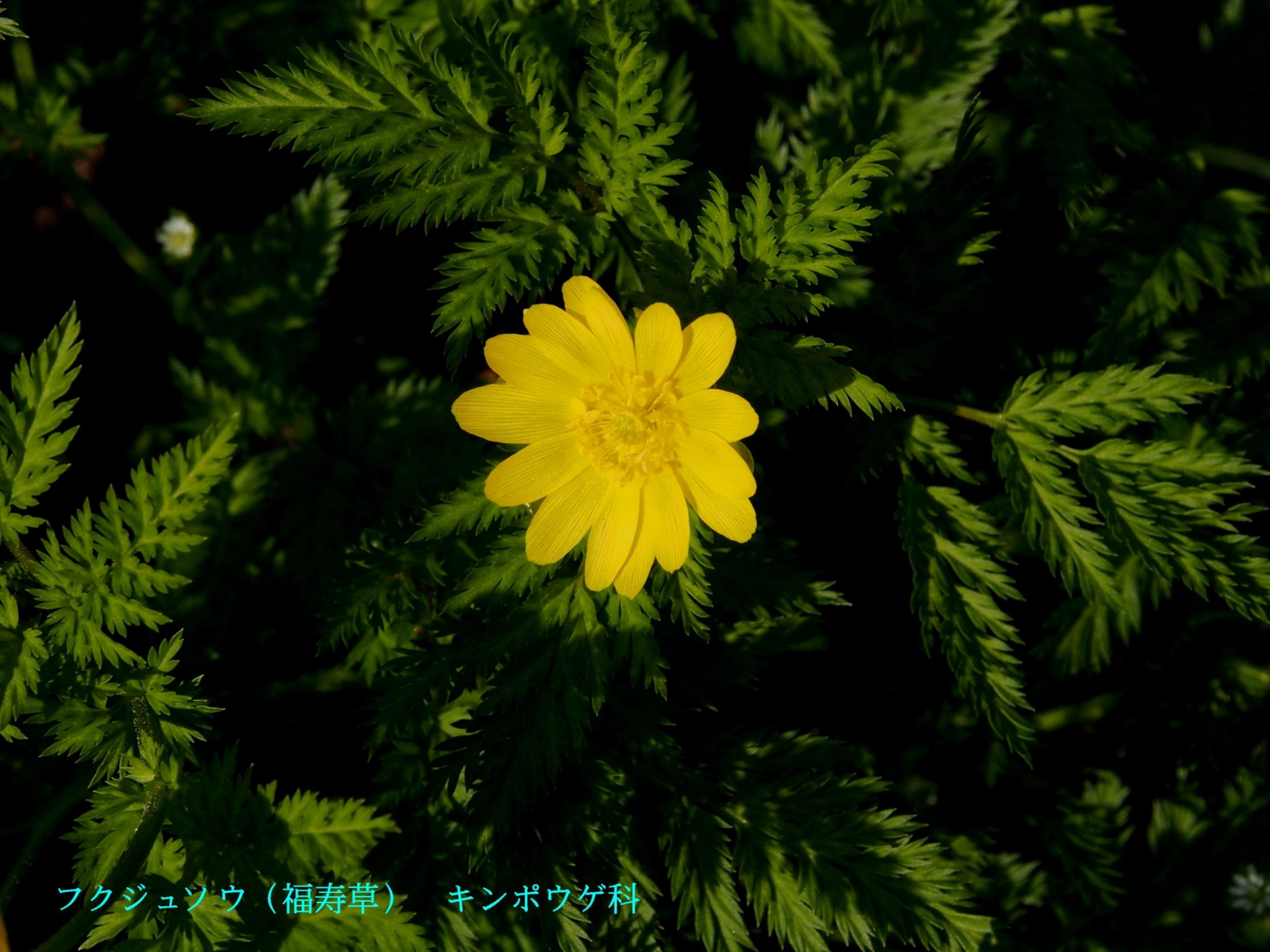
フクジュソウ（福寿草） キンポウゲ科