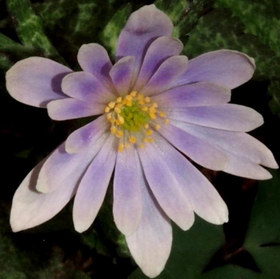
ユキワリイチゲ（雪割一華） キンポウゲ科