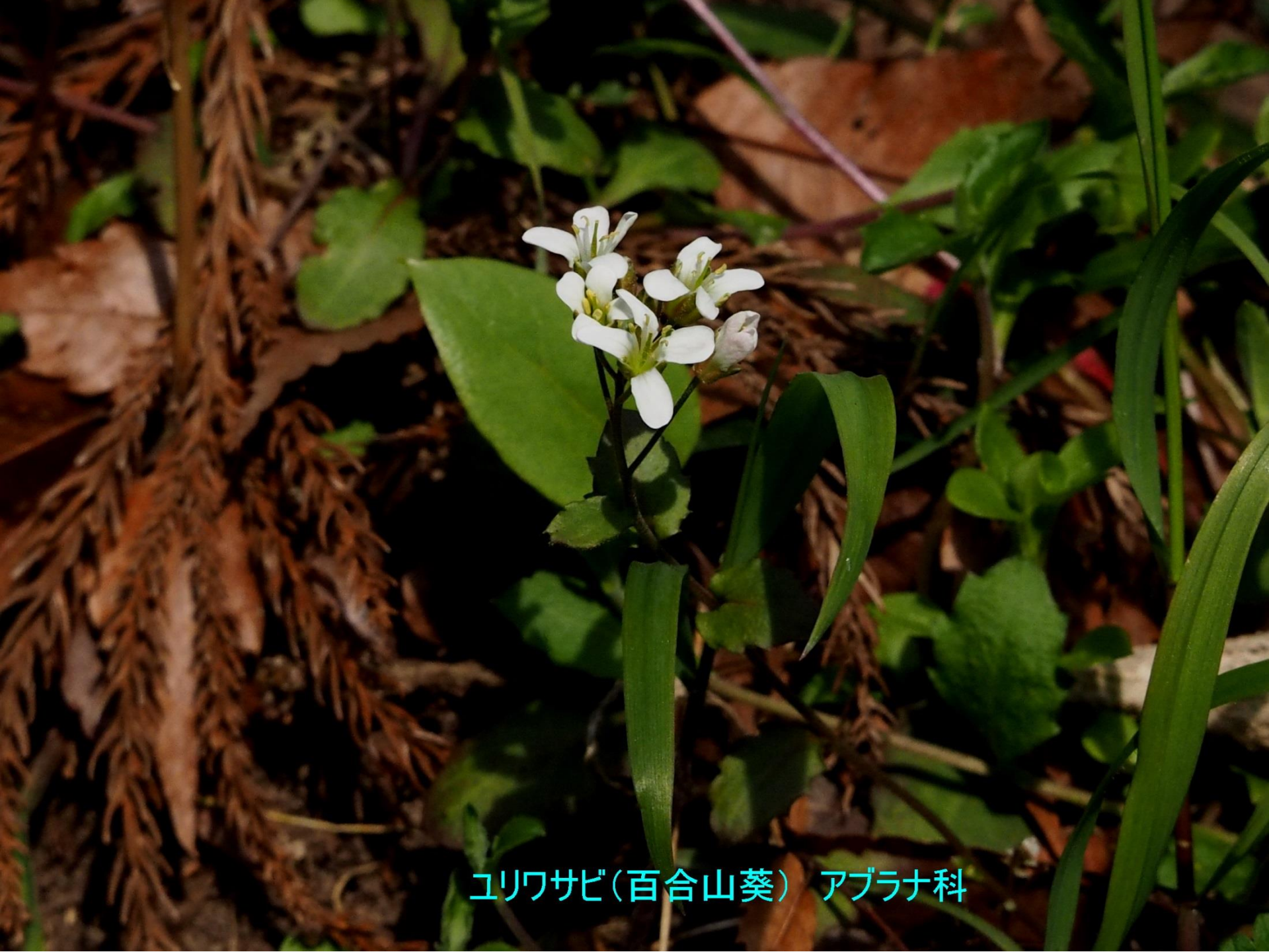
ユリワサビ(百合山葵) アブラナ科