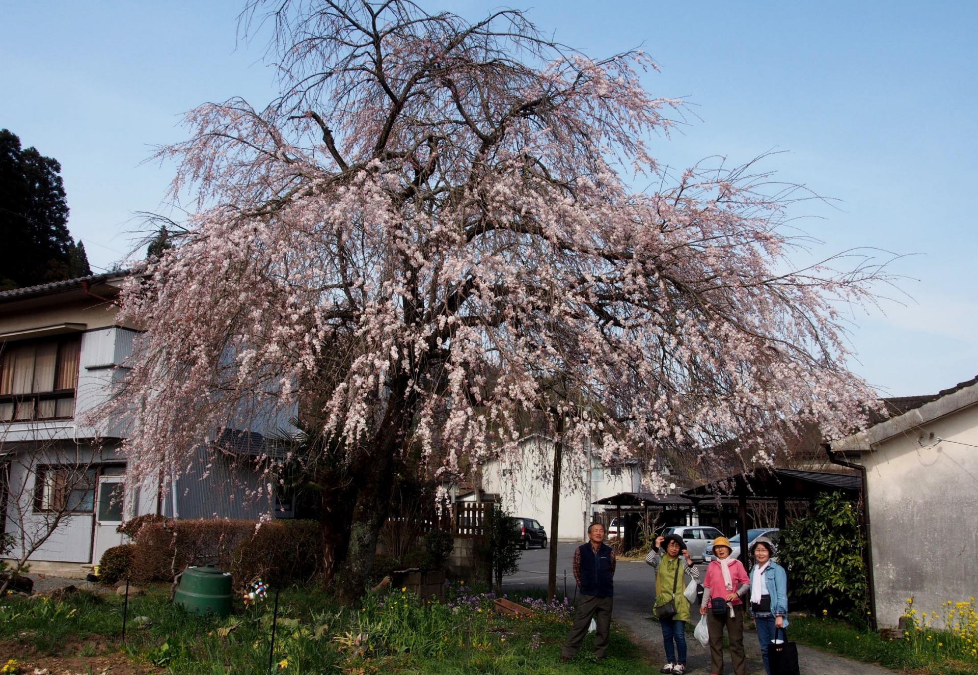
万象の湯（ばんしょうのゆ）のサクラ