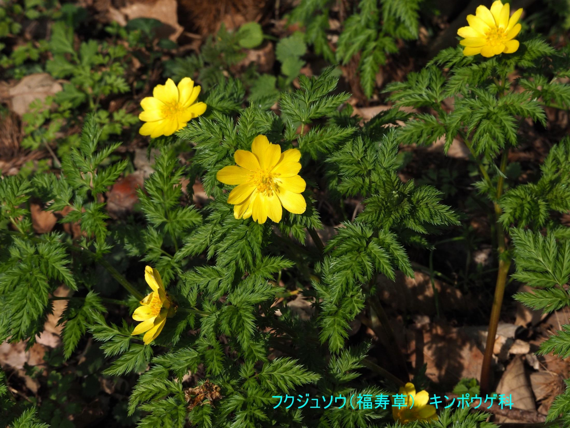
フクジュソウ(福寿草) キンポウゲ科