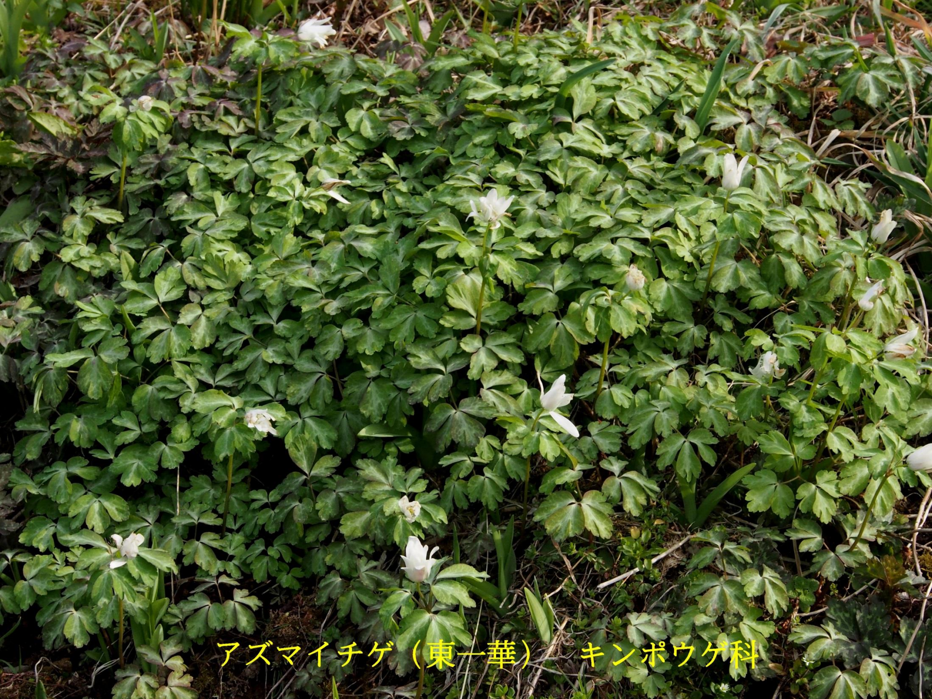
アズマイチゲ (東一華) キンポウゲ科