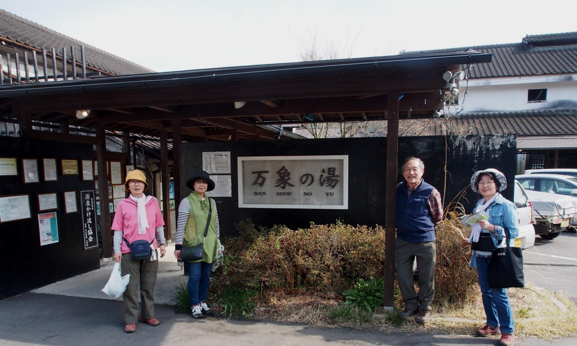
14:59 万象の湯（ばんしょうのゆ）でのバイキング昼食の後