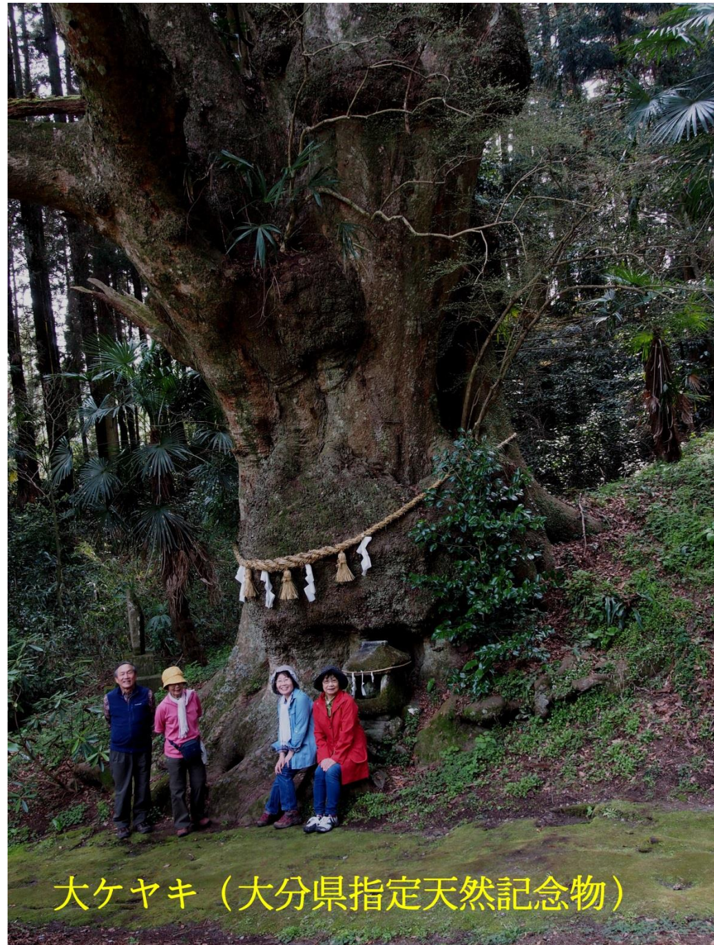
大ケヤキ（大分県指定天然記念物）