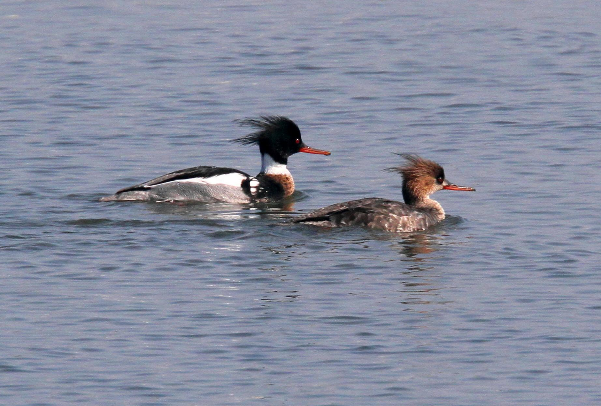
ウミアイサ(海秋沙) ガンカモ科 L=55cm (左オス、右メス)