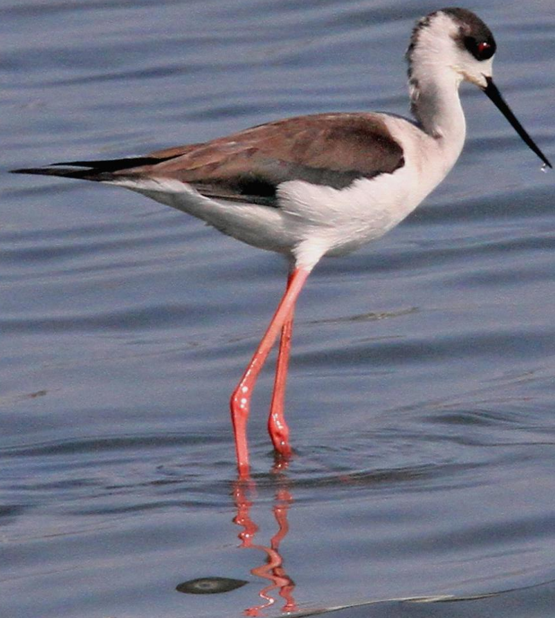
セイタカシギ(丈高鶴)メス セイタカシギ科 L=37cm