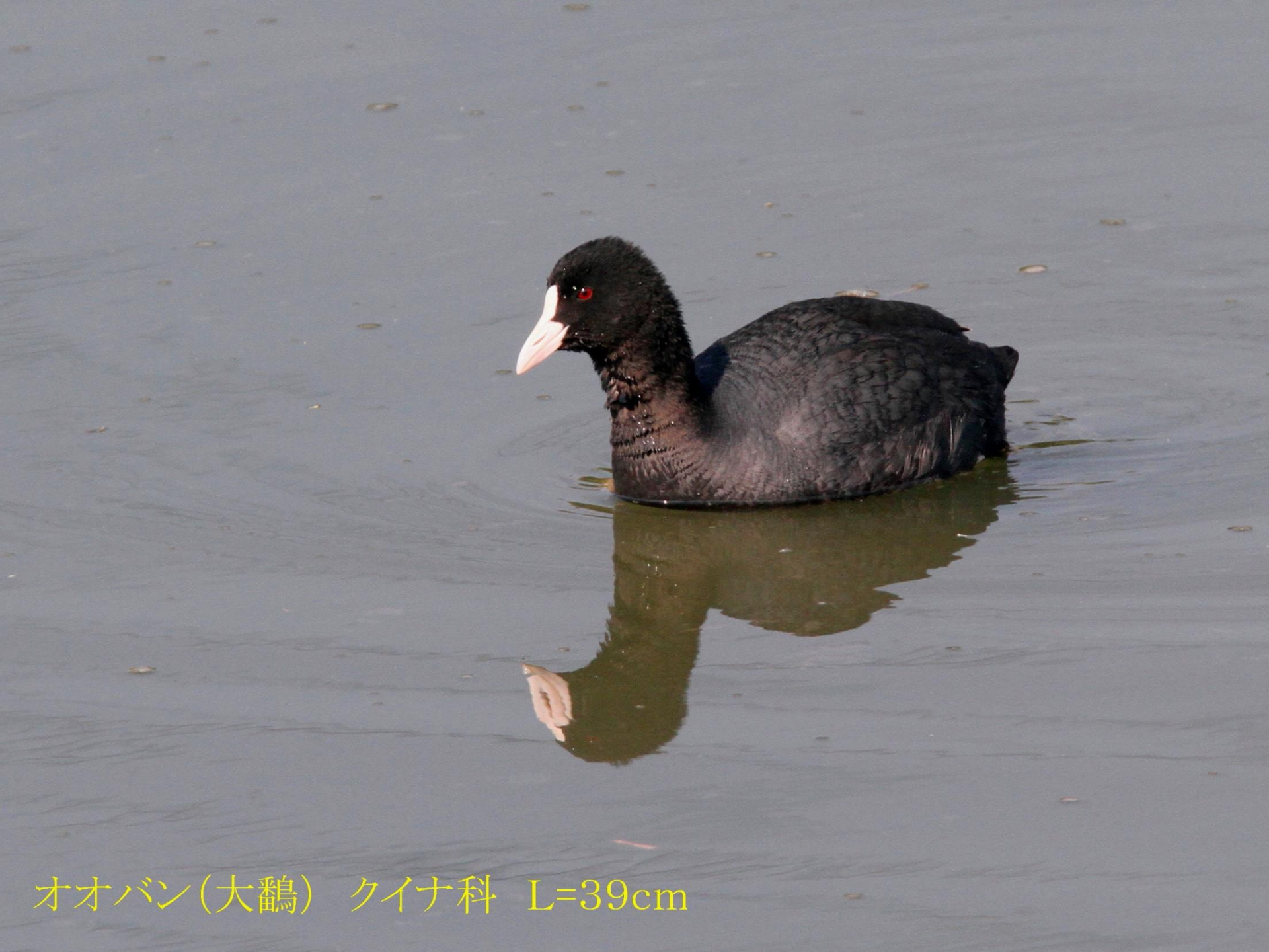
オオバン(大鵜) クイナ科 L=39cm