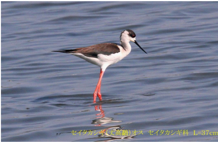
セイタカシギ(丈高鷗)オス セイタカシギ科 L=37cm