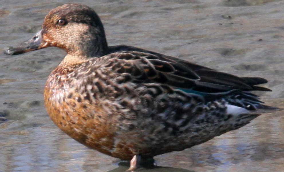
コガモ(小鴨)メス ガンカモ科 L=38cm