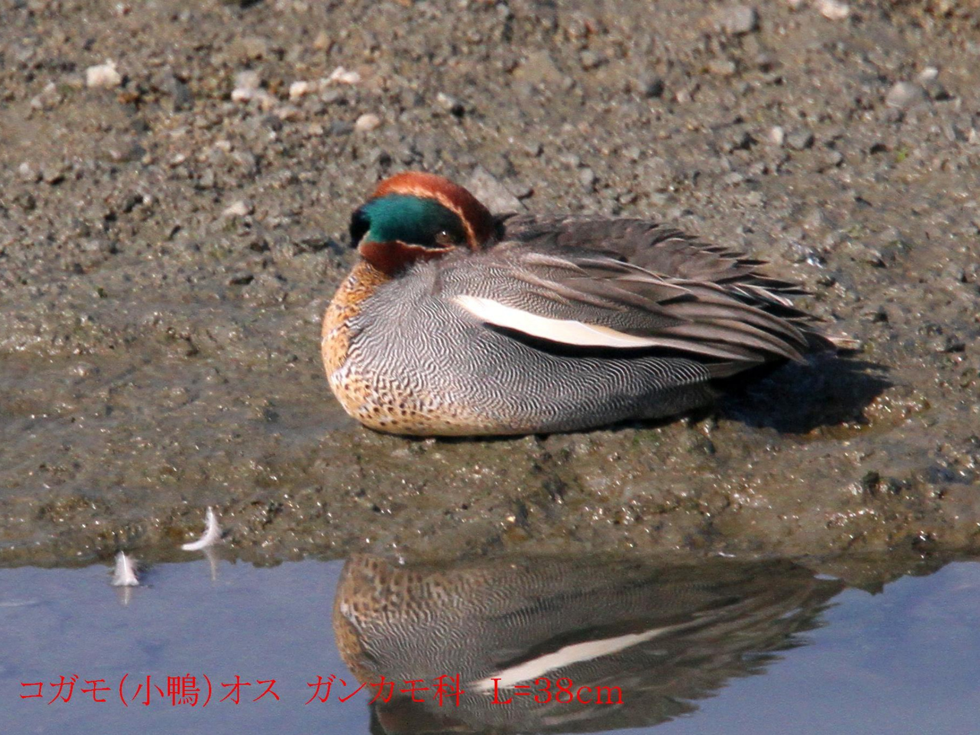
コガモ(小鴨)オス ガンカモ科 L=38cm