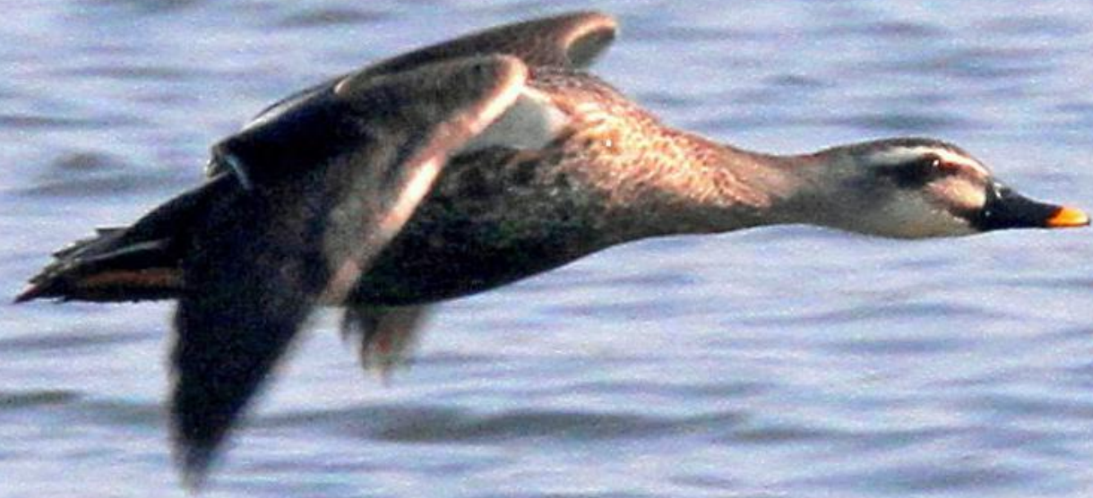
カルガモ(軽鴨) ガンカモ科 L=61cm