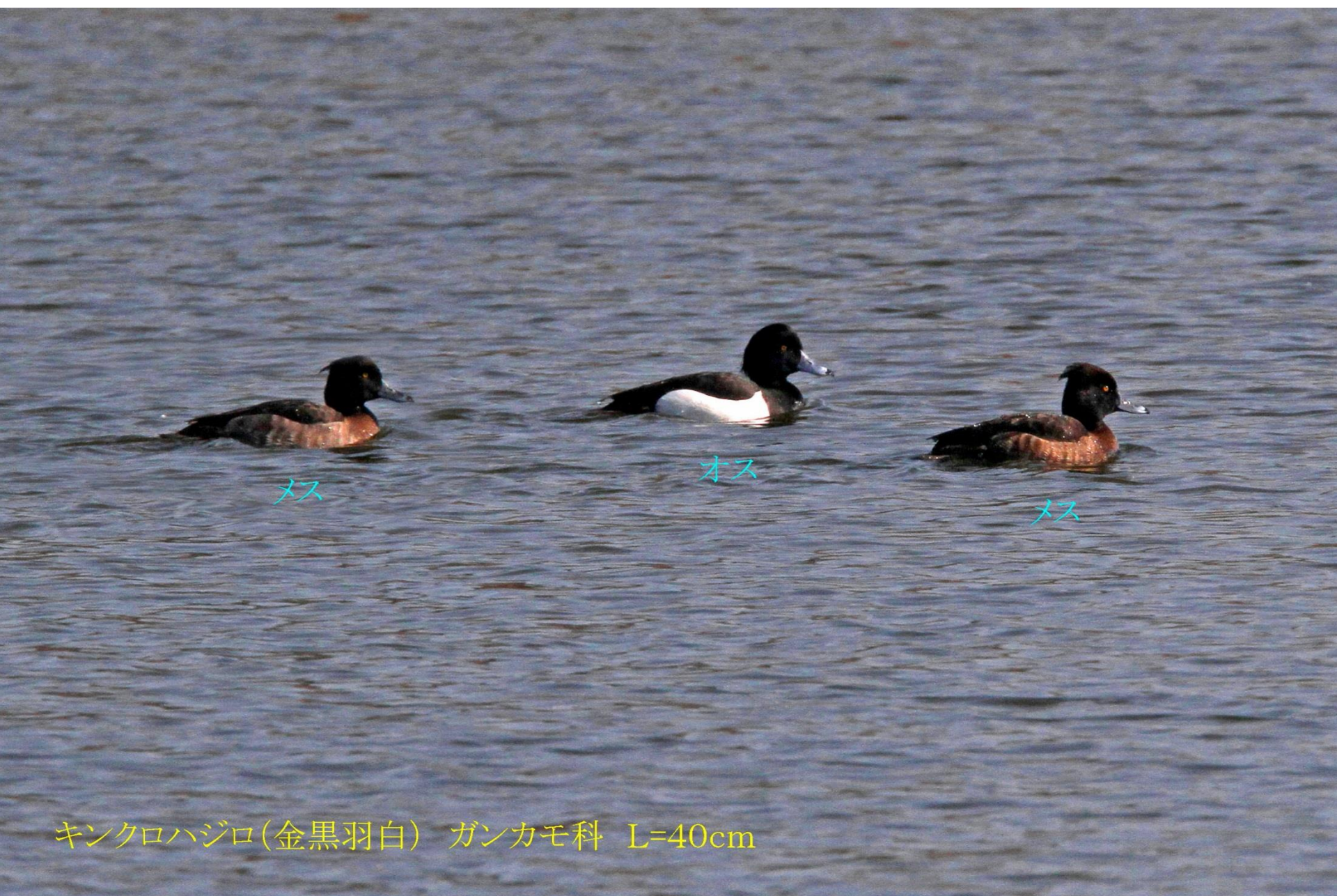
キンクロハジロ(金黒羽白) ガンカモ科 L=40cm

日本では冬季に九州以北に越冬のため飛来し(冬鳥)、北海道では少数が繁殖する。 湖沼 、 河川 、 河口 などに生息する。