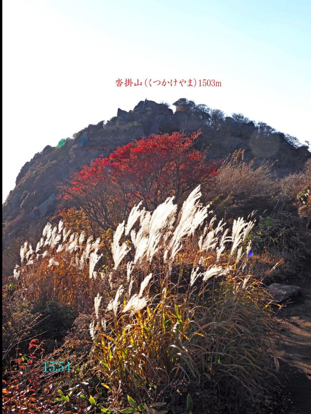
沓掛山(くつかけやま)1503m