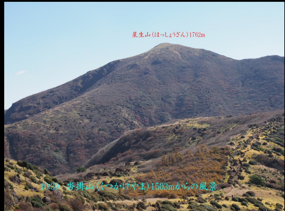
星生山 (ほっしょうざん) 1762m