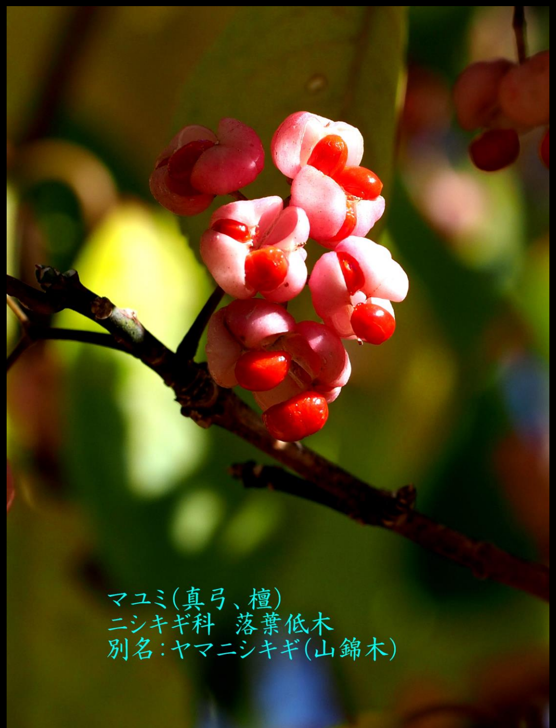
マユミ(真弓、檀) ニシキギ科 落葉低木 別名:ヤマニシキギ(山錦木)