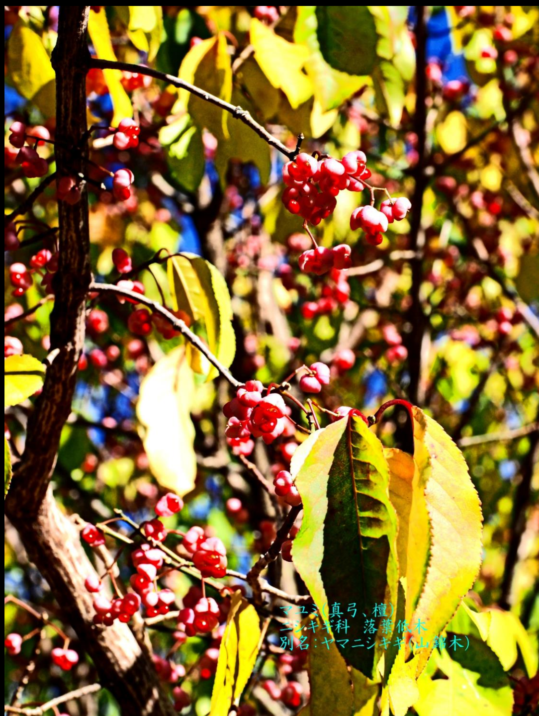
マユミ(真弓、檀) ニシキギ科 落葉低木 別名:ヤマニシキギ(山錦木)