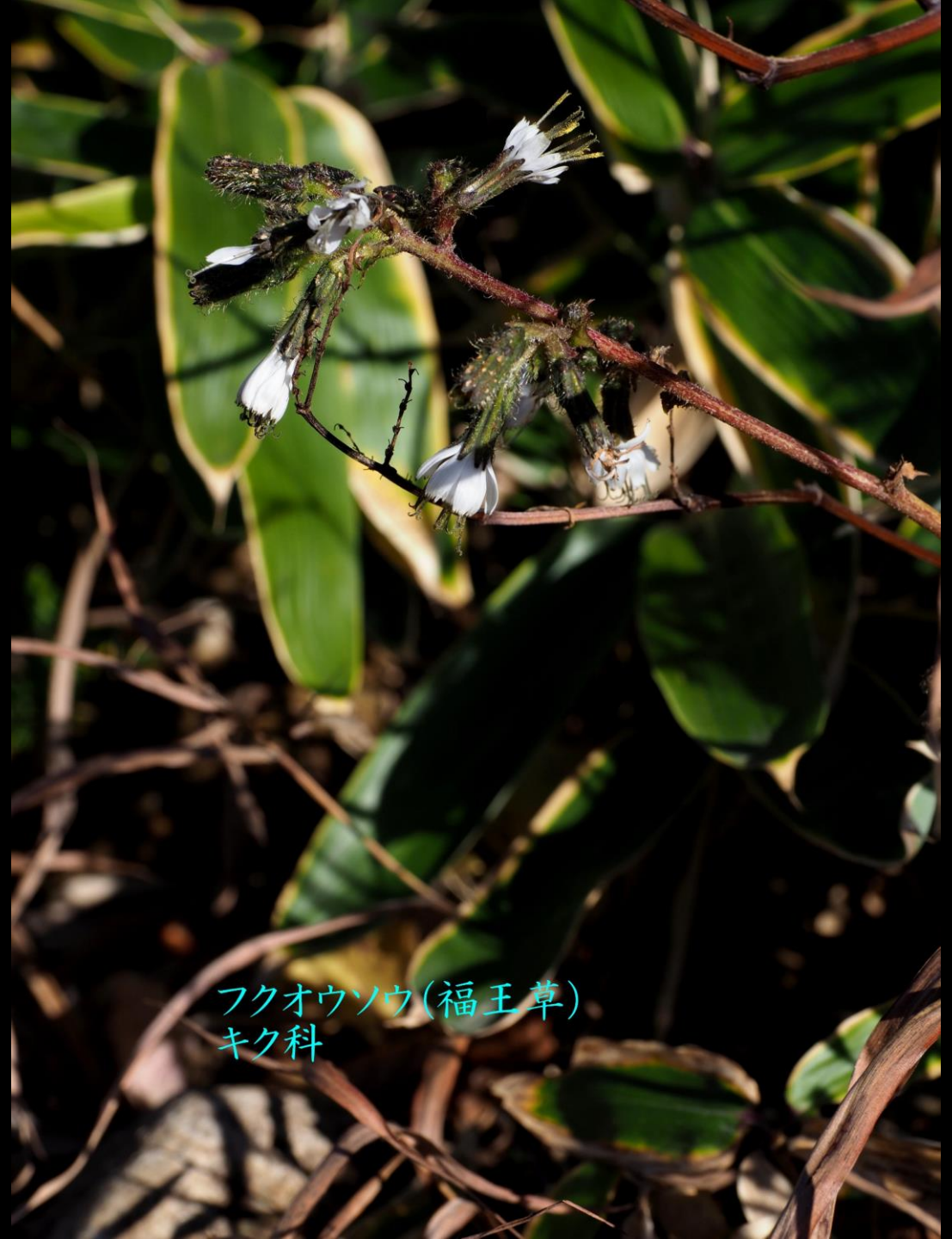
フクオウソウ(福王草) キク科