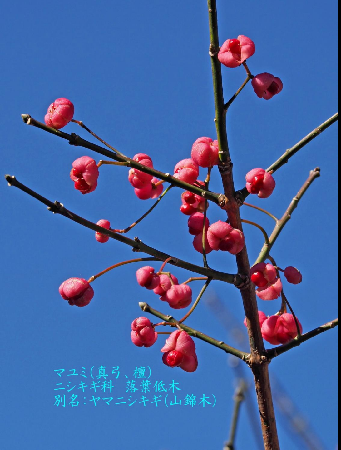
マユミ(真弓、檀) ニシキギ科 落葉低木 別名:ヤマニシキギ(山錦木)