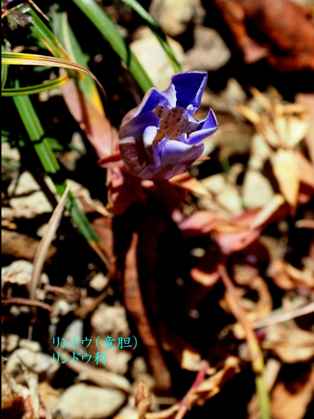
リンドウ(竜胆) リンドウ科