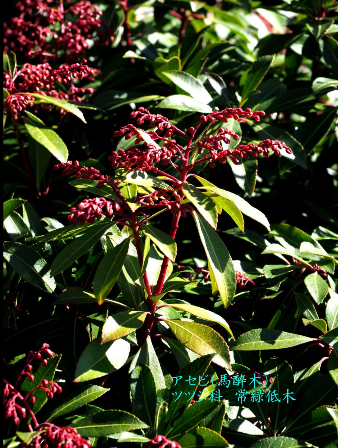
アセビ(馬酔木) ツツジ科 常緑低木