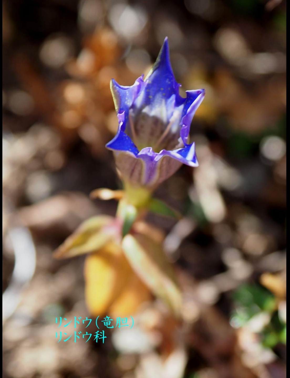
リンドウ(竜胆) リンドウ科