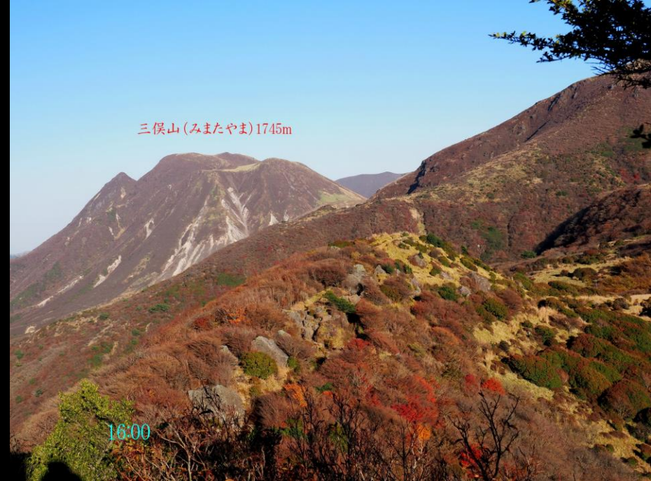
三俣山(みまたやま)1745m