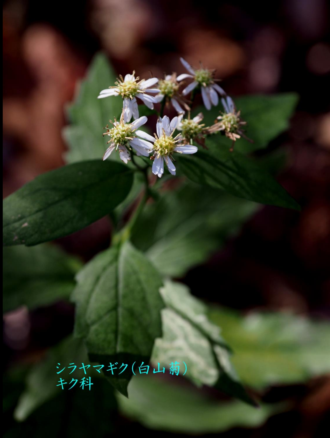
シラヤマギク(白山菊) キク科