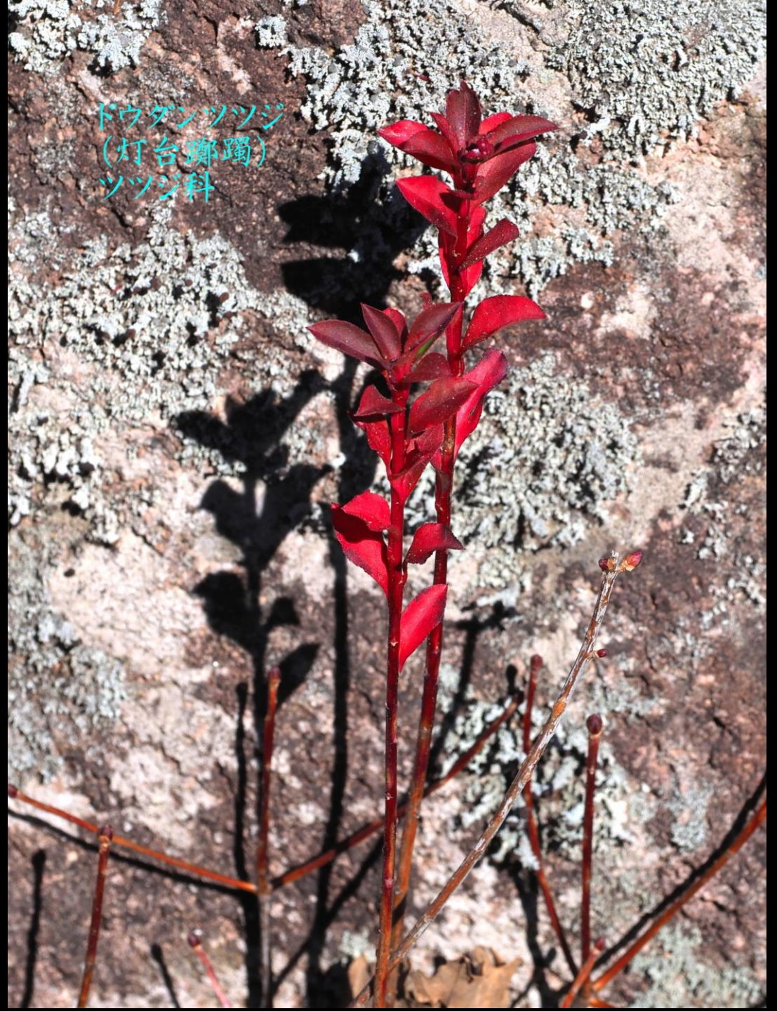
ドウダンツツジ (灯台躑躅) ツツジ科