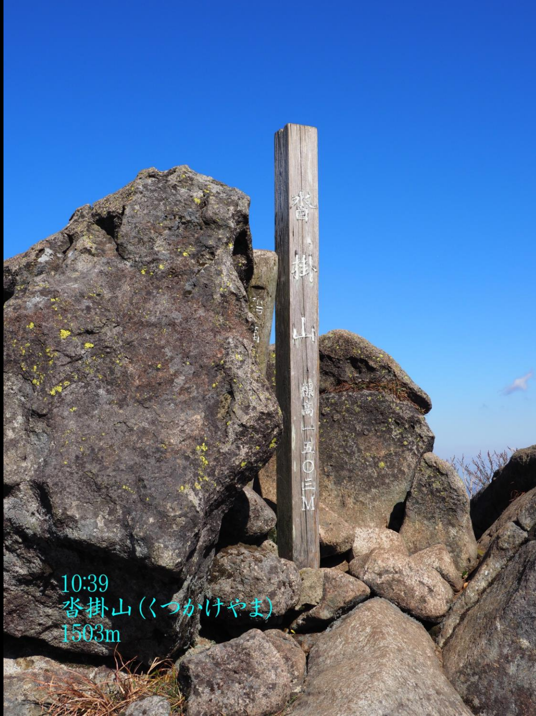
10:39 沓掛山 (くつかけやま) 1503m