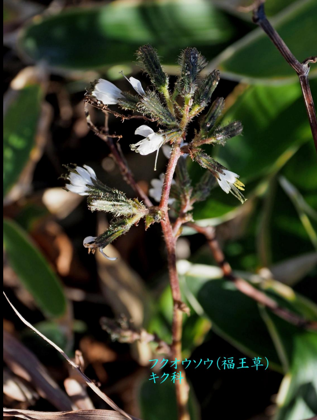
フクオウソウ(福王草) キク科