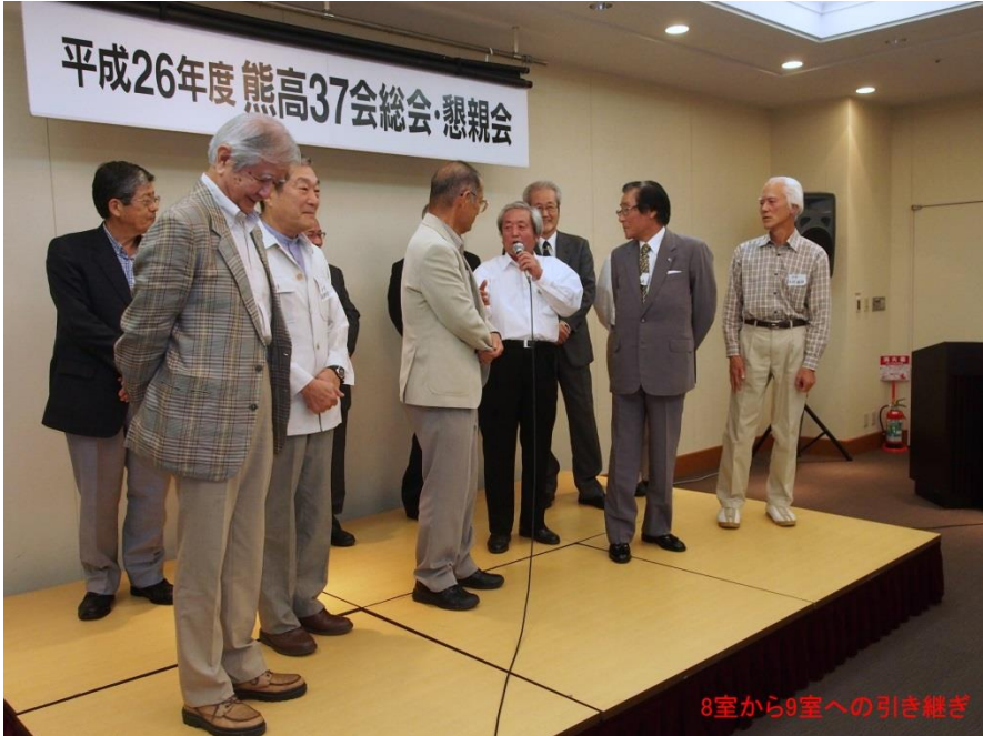
8室から9室への引き継ぎ