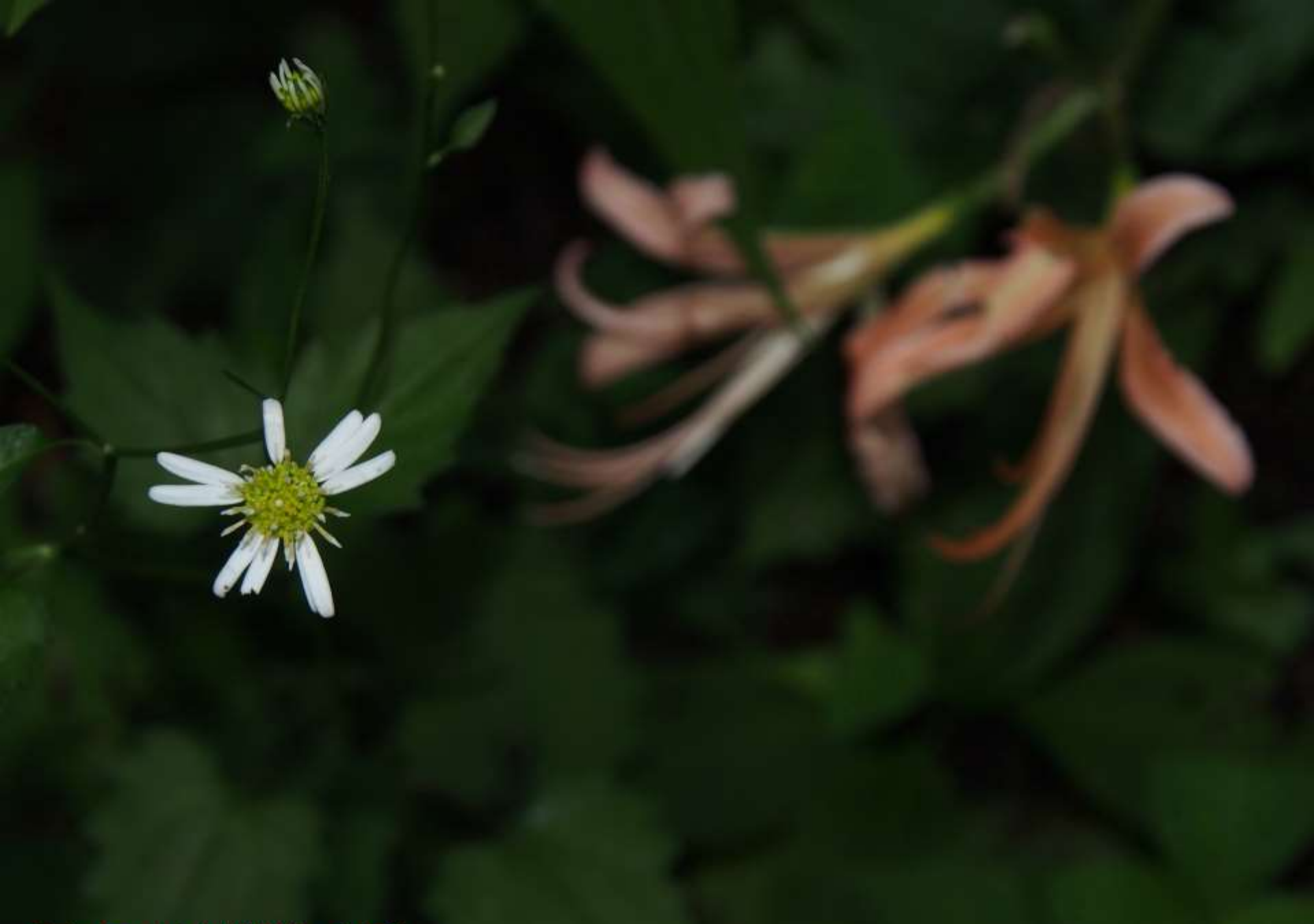
オオバヨメナ(大葉嫁菜) キク科