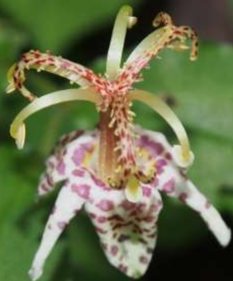
ヤマジノホトギス(山路の杜鵑) ユリ科