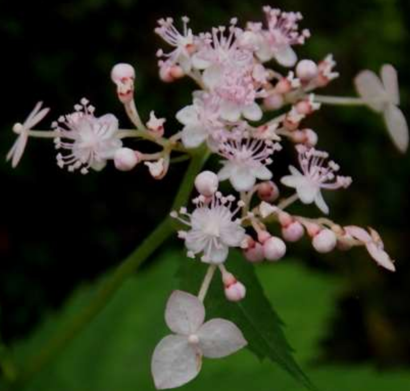
クサアジサイ(草紫陽花) ユキノシタ科