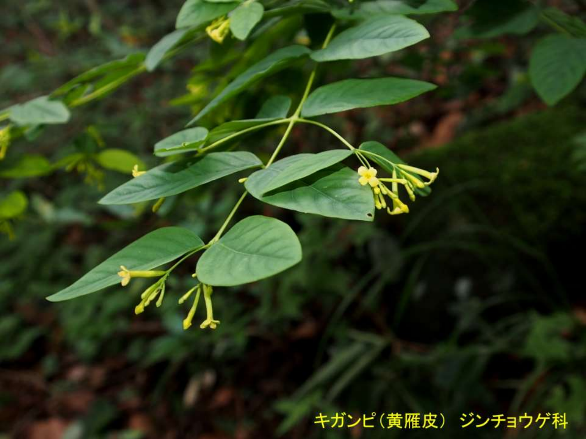
キガンピ(黄雁皮) ジンチョウゲ科