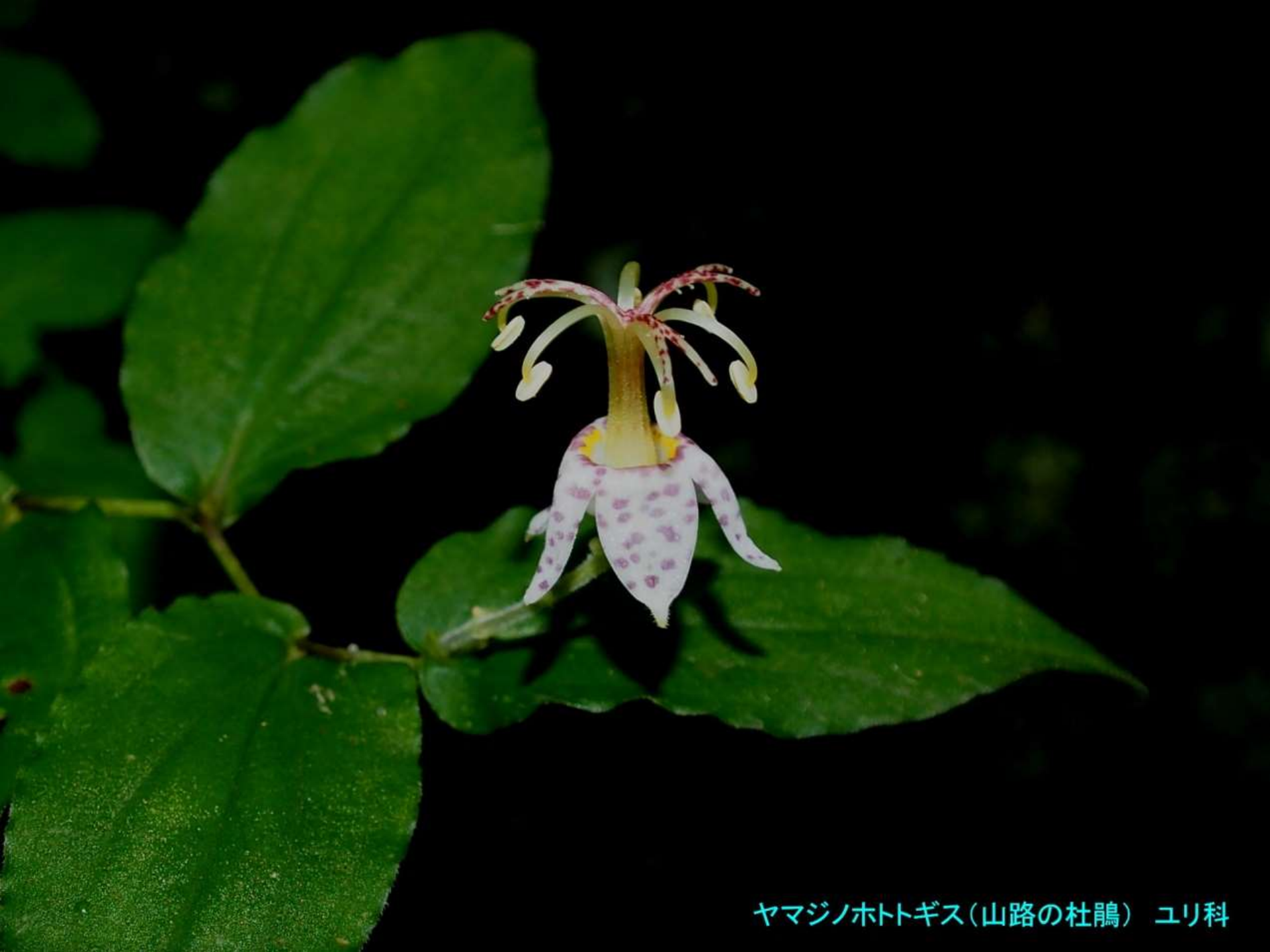
ヤマジノホトトギス(山路の杜鵑) ユリ科