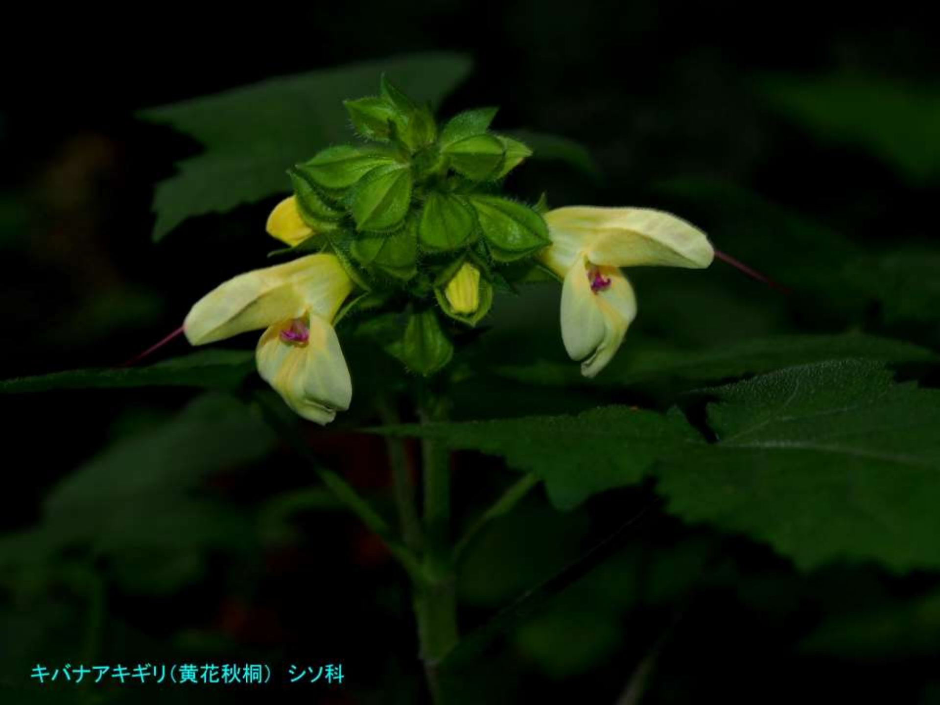
キバナアキギリ(黄花秋桐) シソ科