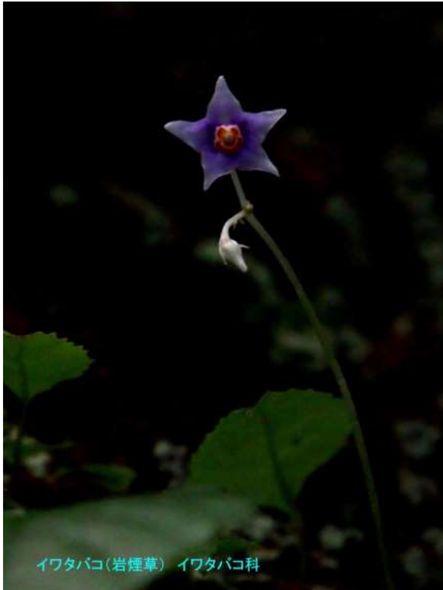
イワタバコ(岩煙草) イワタバコ科