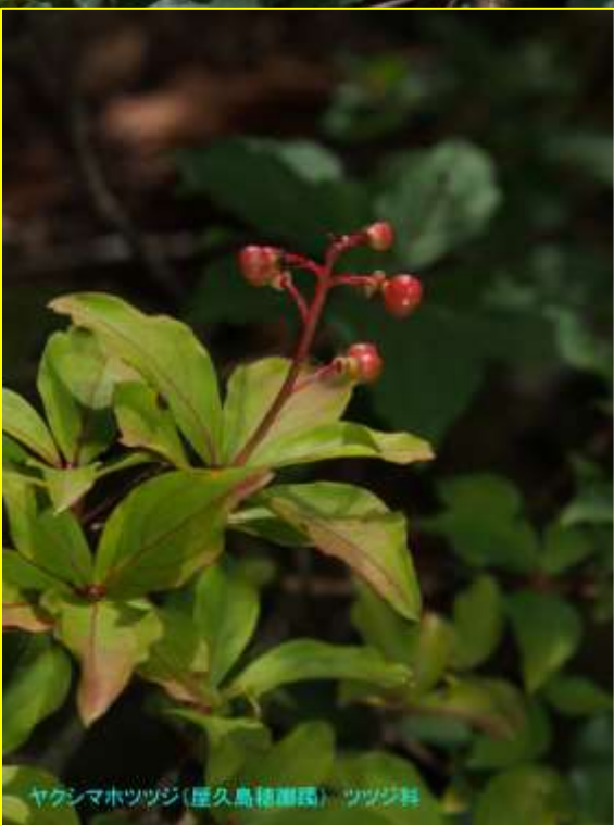
ヤクシマホツツジ(屋久島穂躑躅) ツツジ科