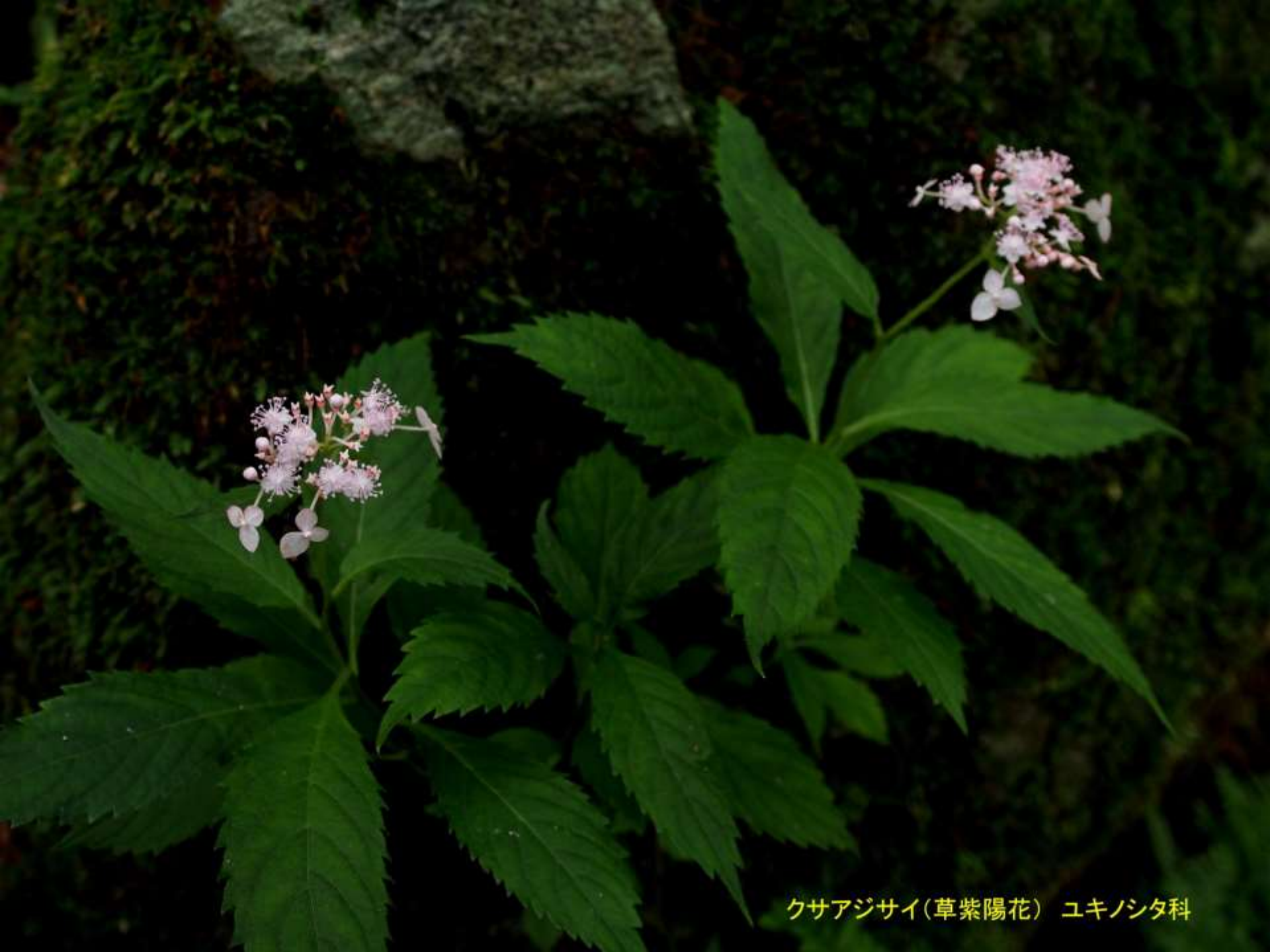
クサアジサイ(草紫陽花) ユキノシタ科