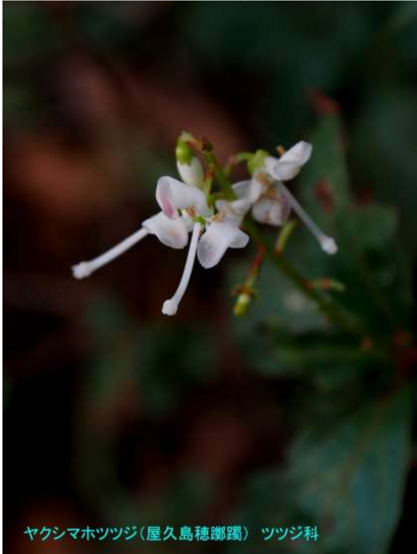
ヤクシマホツツジ(屋久島穂躑躅) ツツジ科