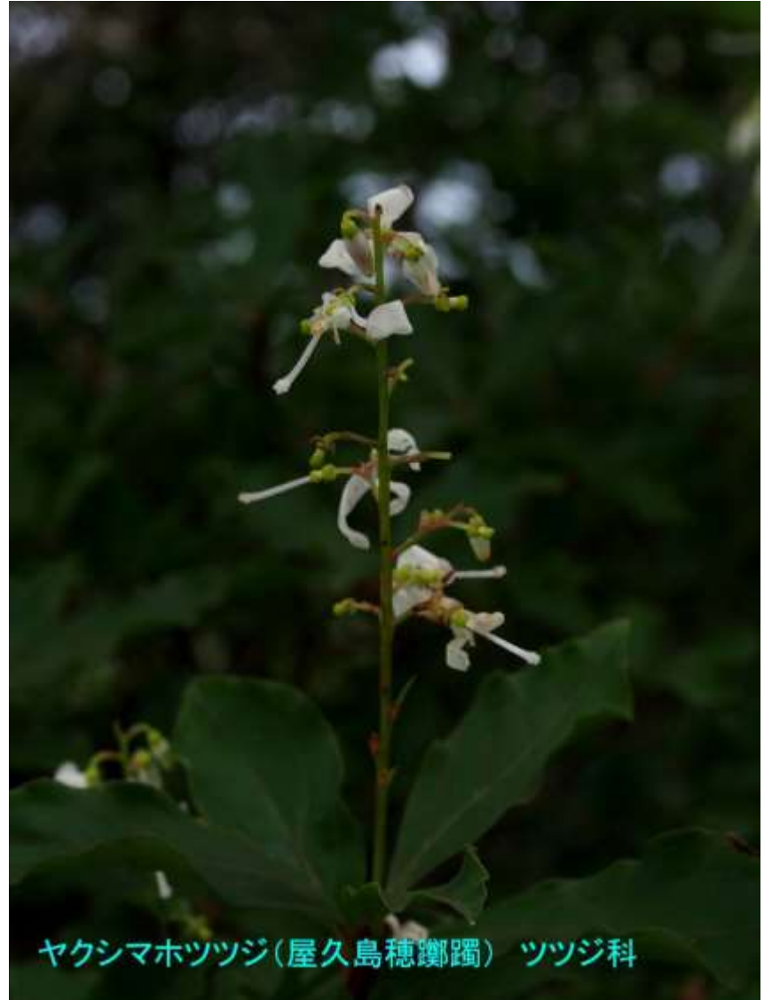
ヤクシマホツツジ(屋久島穂躑躅) ツツジ科