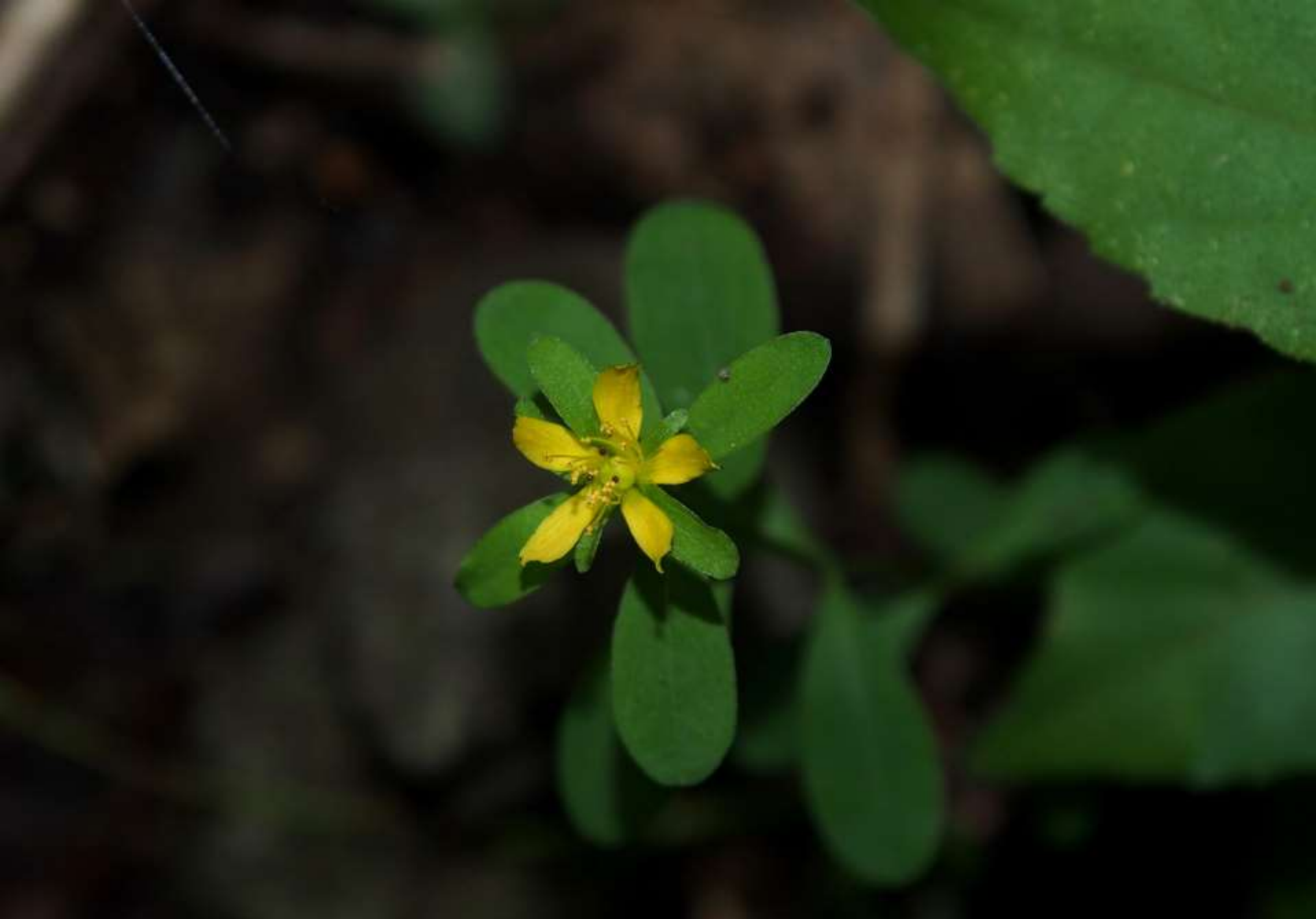
ナガサキオトギリ(長崎弟切) オトギリソウ科