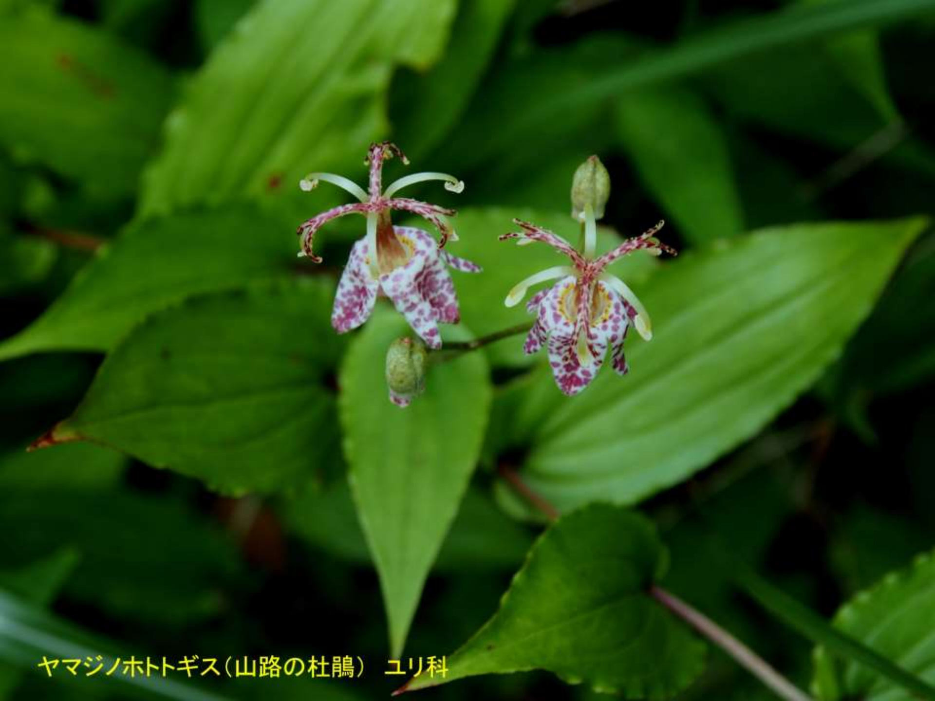
ヤマジノホトトギス(山路の杜鵑) ユリ科