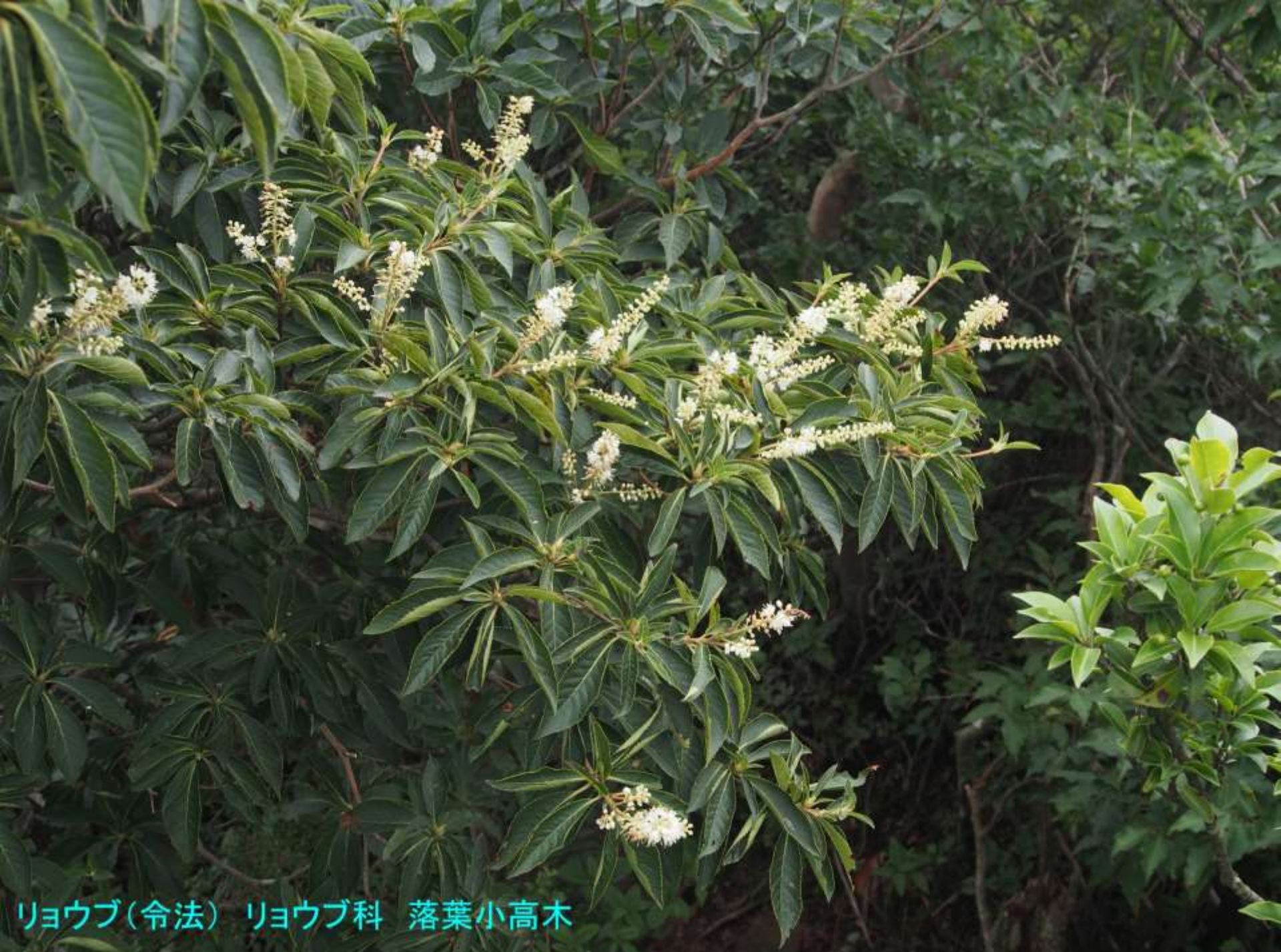
リョウブ(令法) リョウブ科 落葉小高木