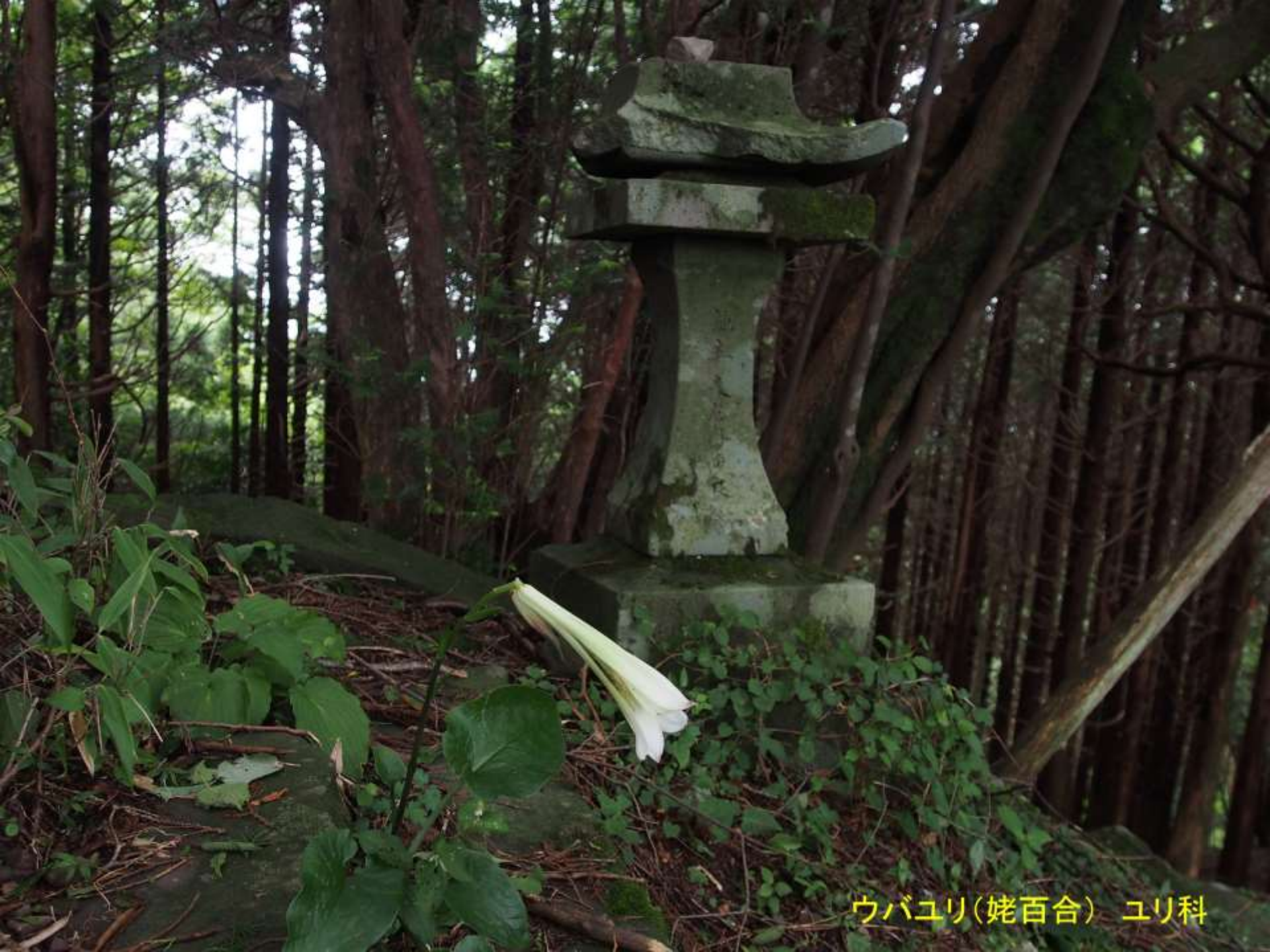
ウバユリ(姥百合) ユリ科