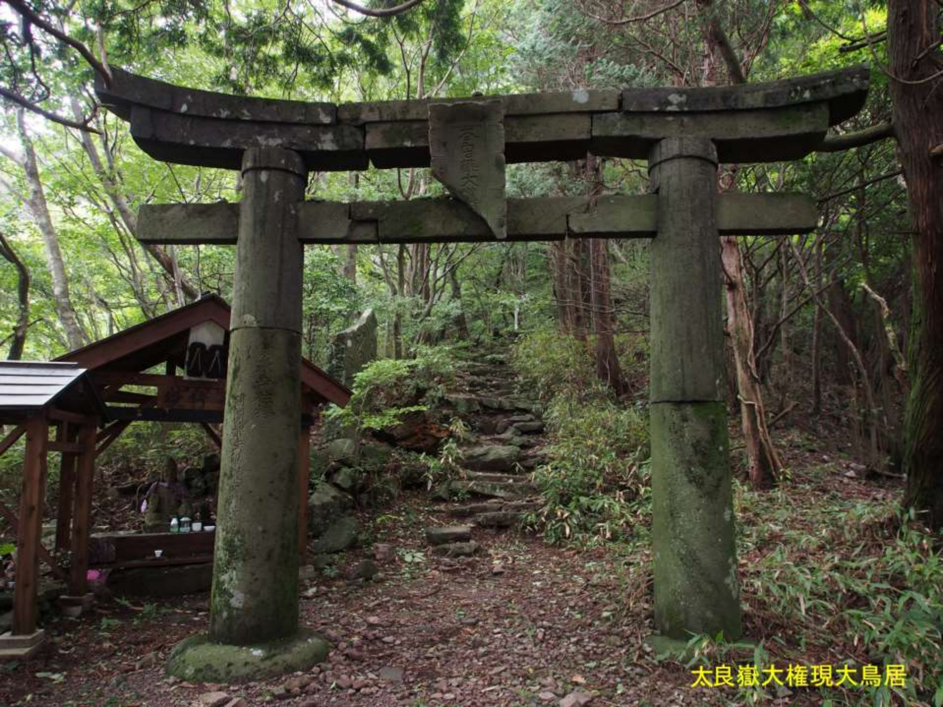
大良嶽大権現大鳥居