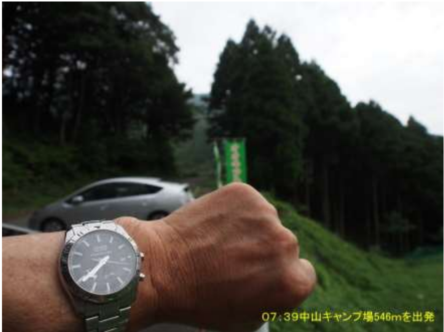
07:39中山キャンプ場546mを出発