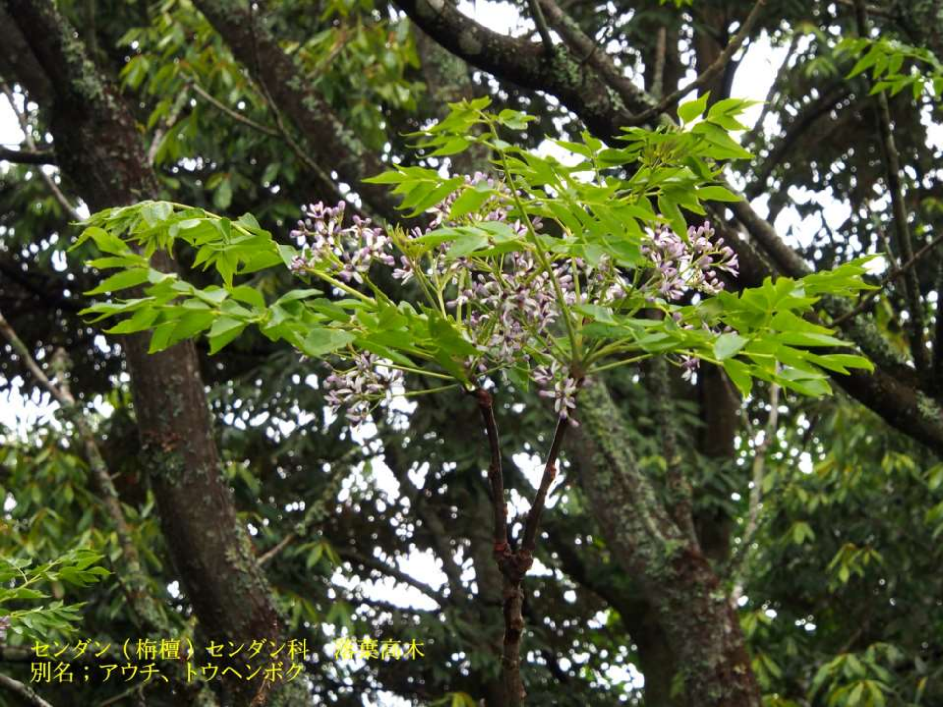
センダン（梅檀）センダン科 落葉高木 別名；アウチ、トウヘンボク