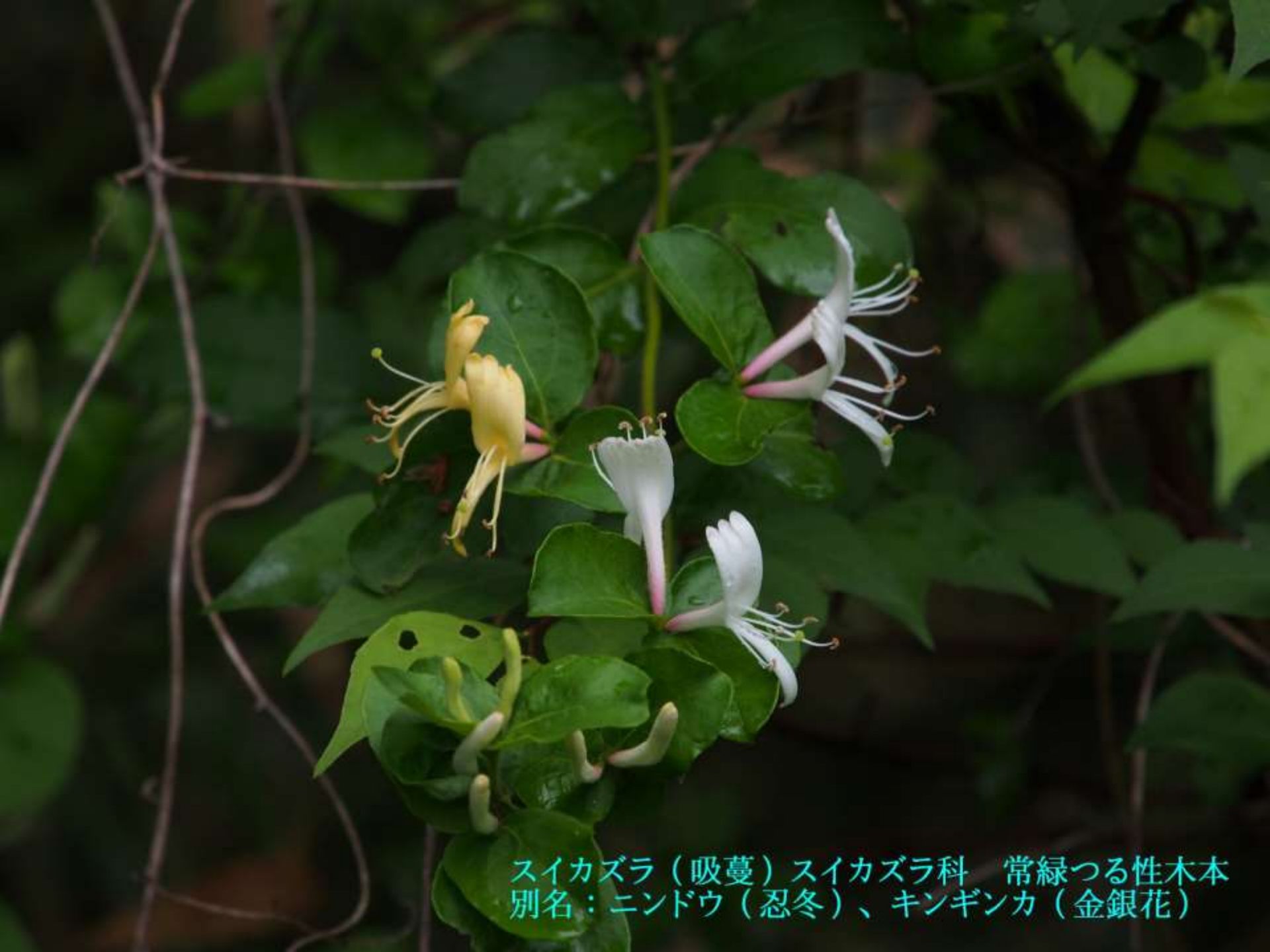
スイカズラ（吸蔓）スイカズラ科 常緑つる性木本 別名：ニンドウ（忍冬）、キンギンカ（金銀花）