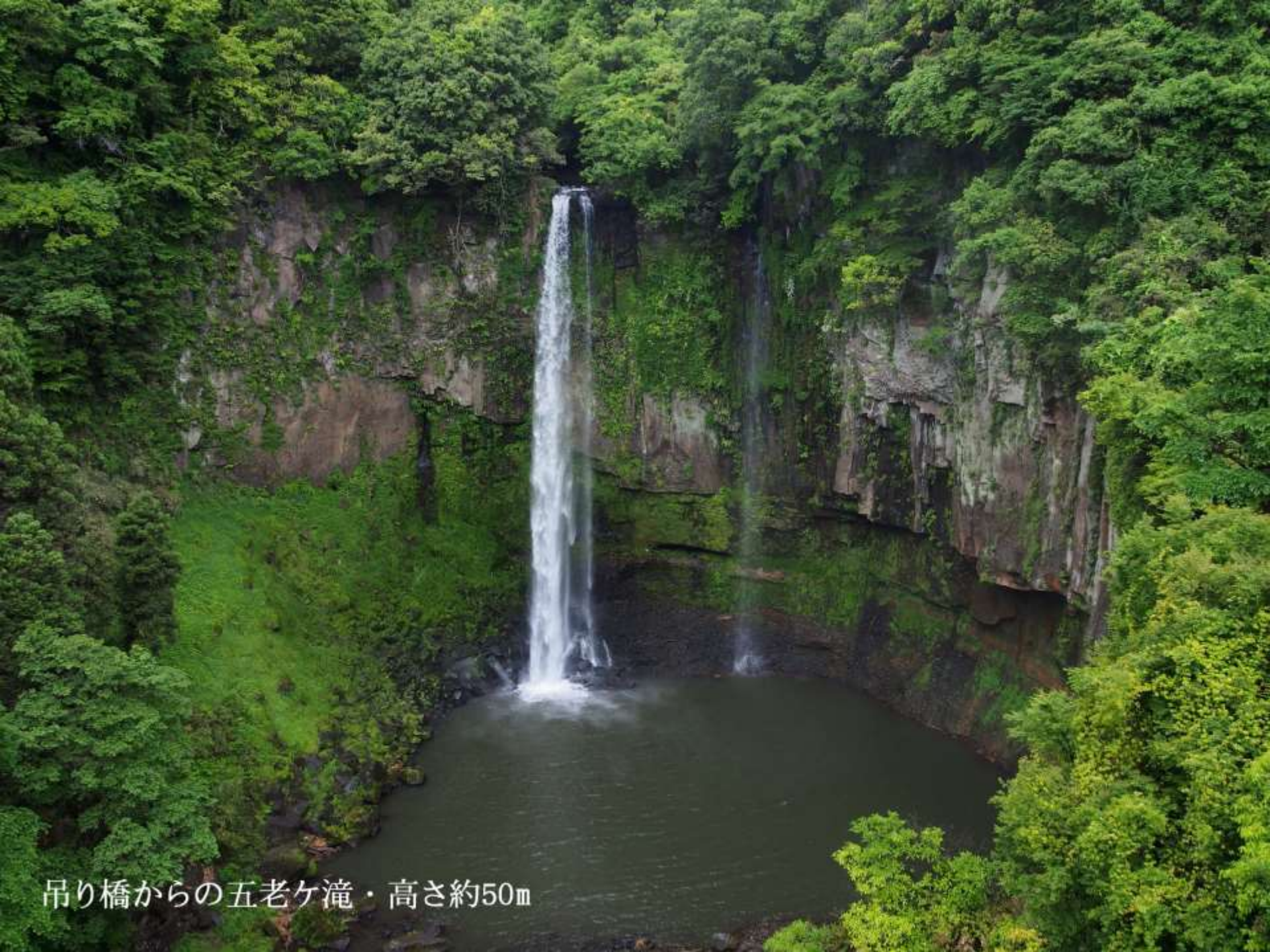
吊り橋からの五老ヶ滝・高さ約50m