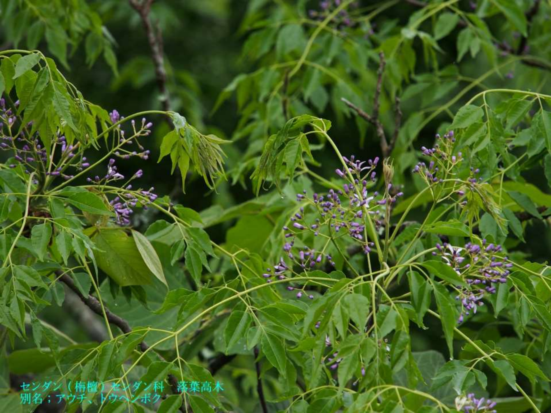
センダン（梅檀）センダン科 落葉高木 別名；アウチ、トウヘンボク