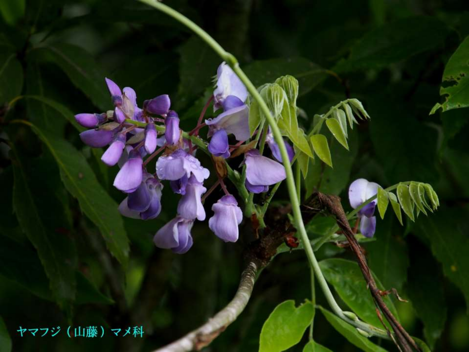
ヤマフジ（山藤）マメ科