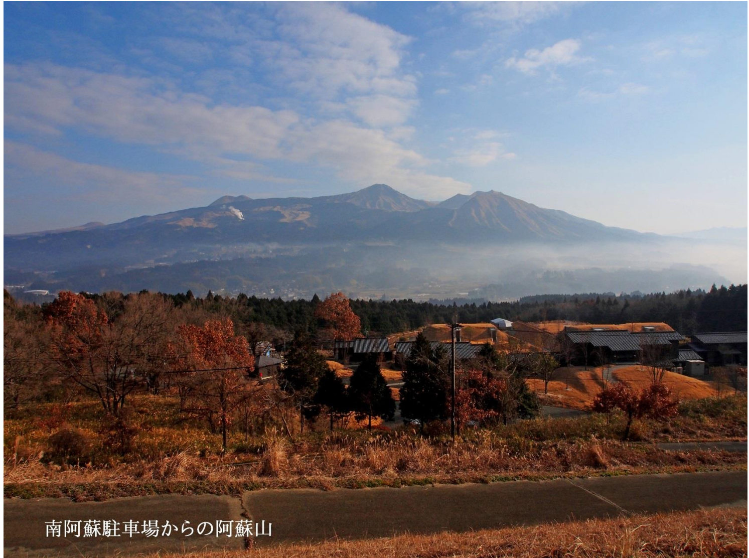
南阿蘇駐車場からの阿蘇山