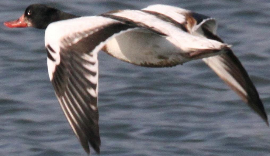
ツクシガモ (筑紫鴨) ガンカモ科 L=63cm