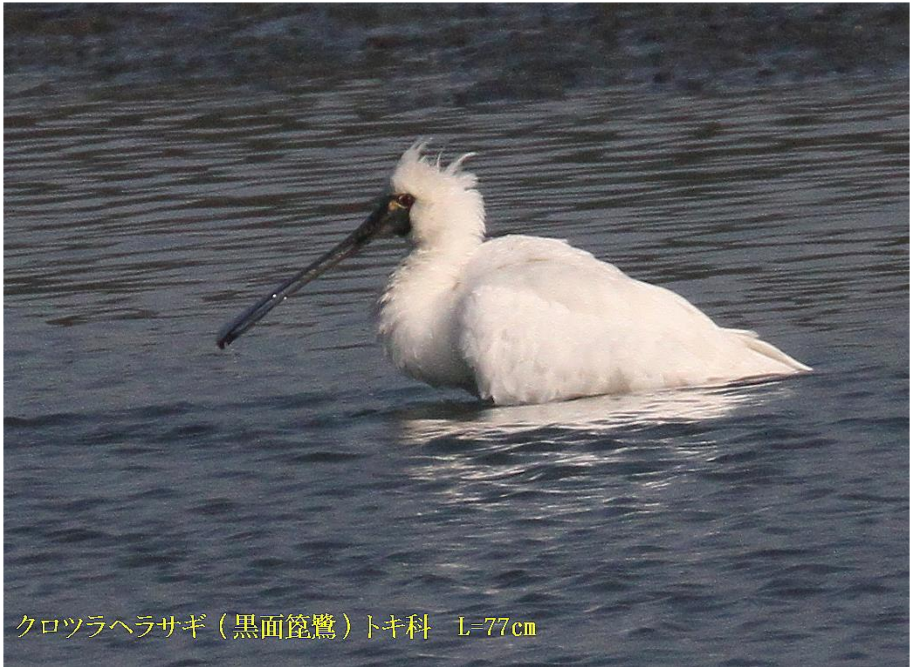
クロツラヘラサギ（黒面篋鷺）トキ科 L=77cm