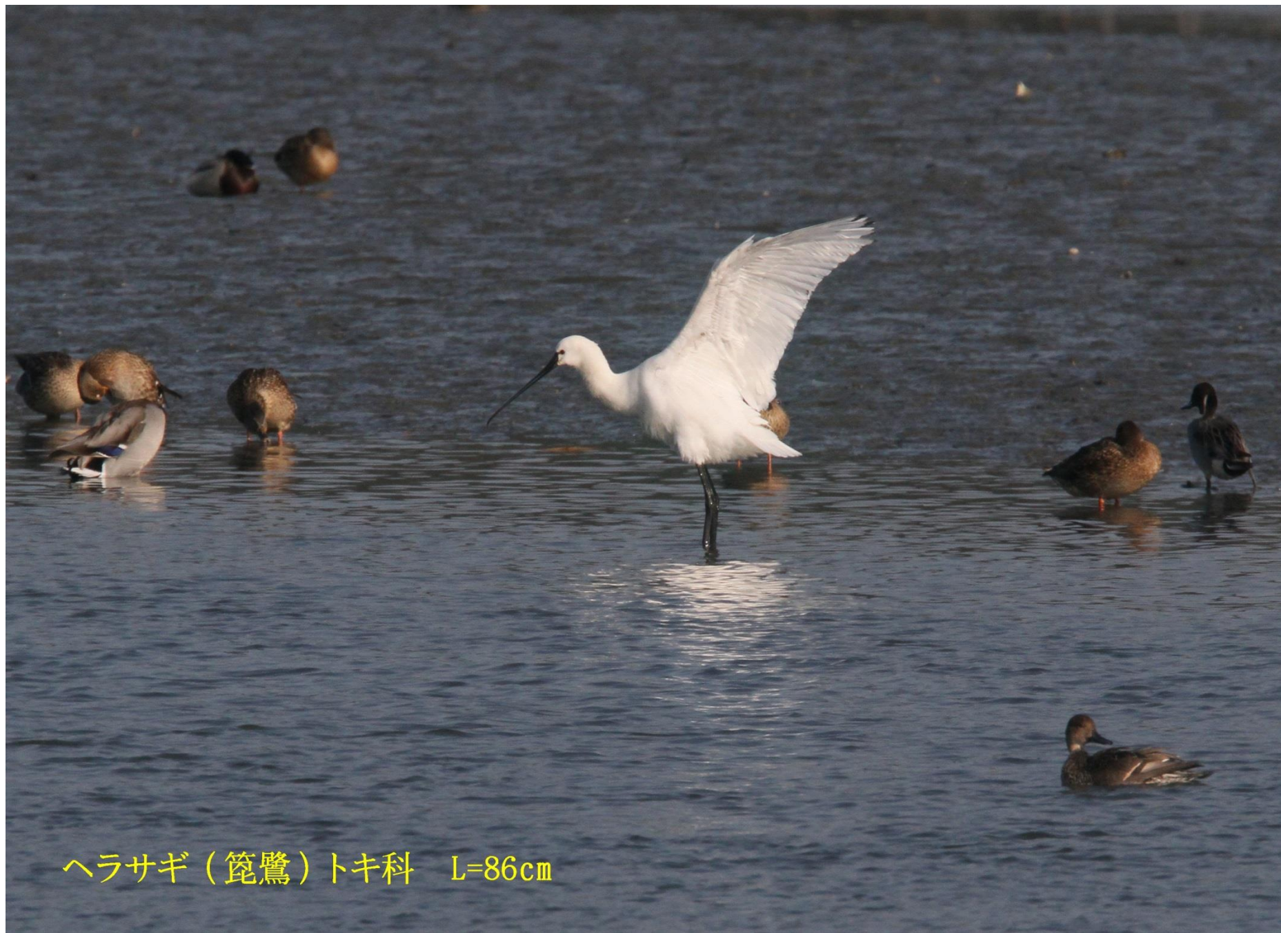
ヘラサギ（篋鷺）トキ科 L=86cm