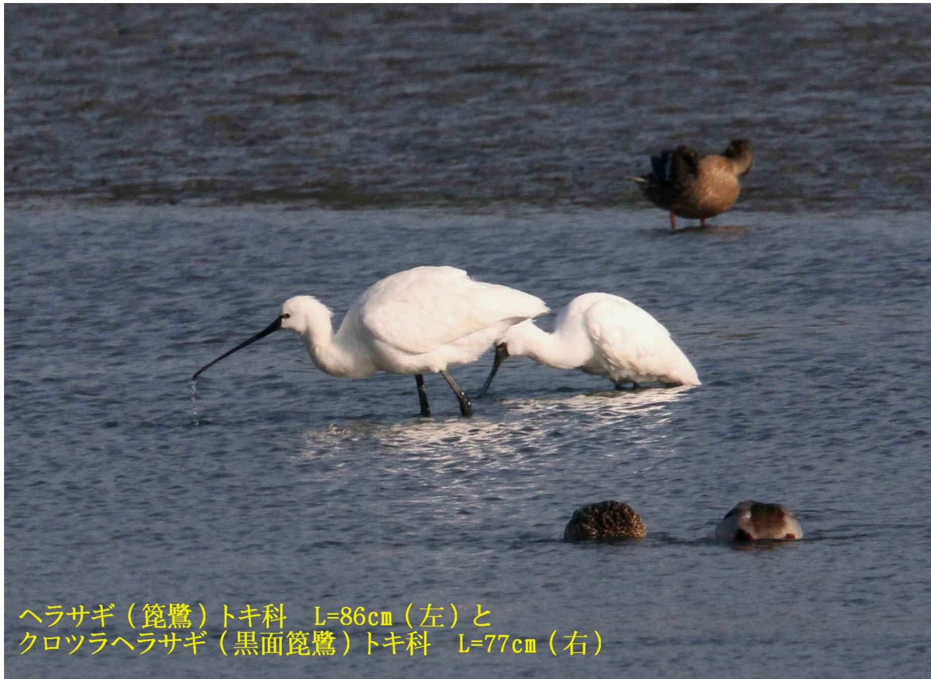
ヘラサギ（篋鷺）トキ科 L=86cm（左）と クロツラヘラサギ（黒面篋鷺）トキ科 L=77cm（右）