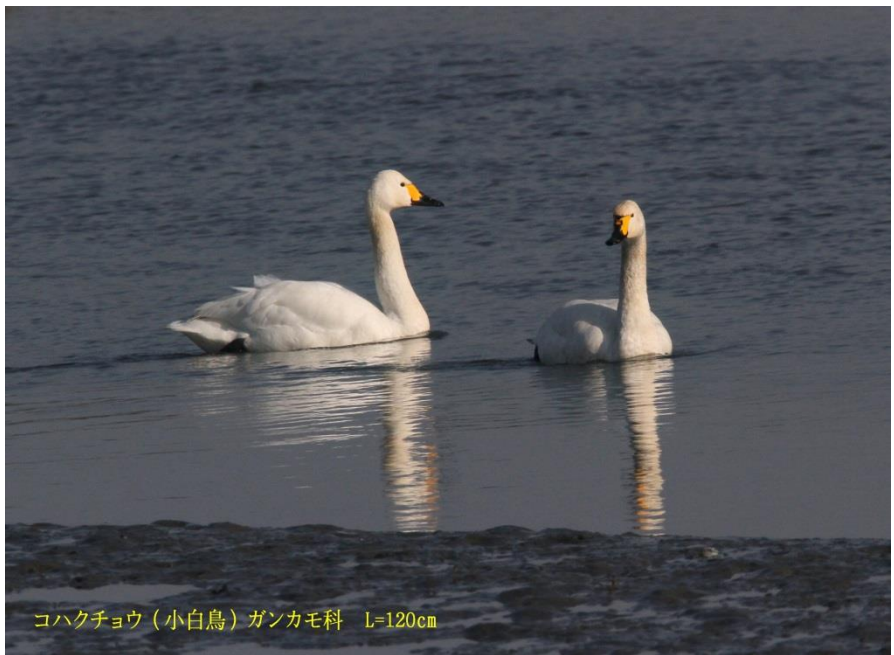
コハクチョウ（小白鳥）ガンカモ科 L=120cm