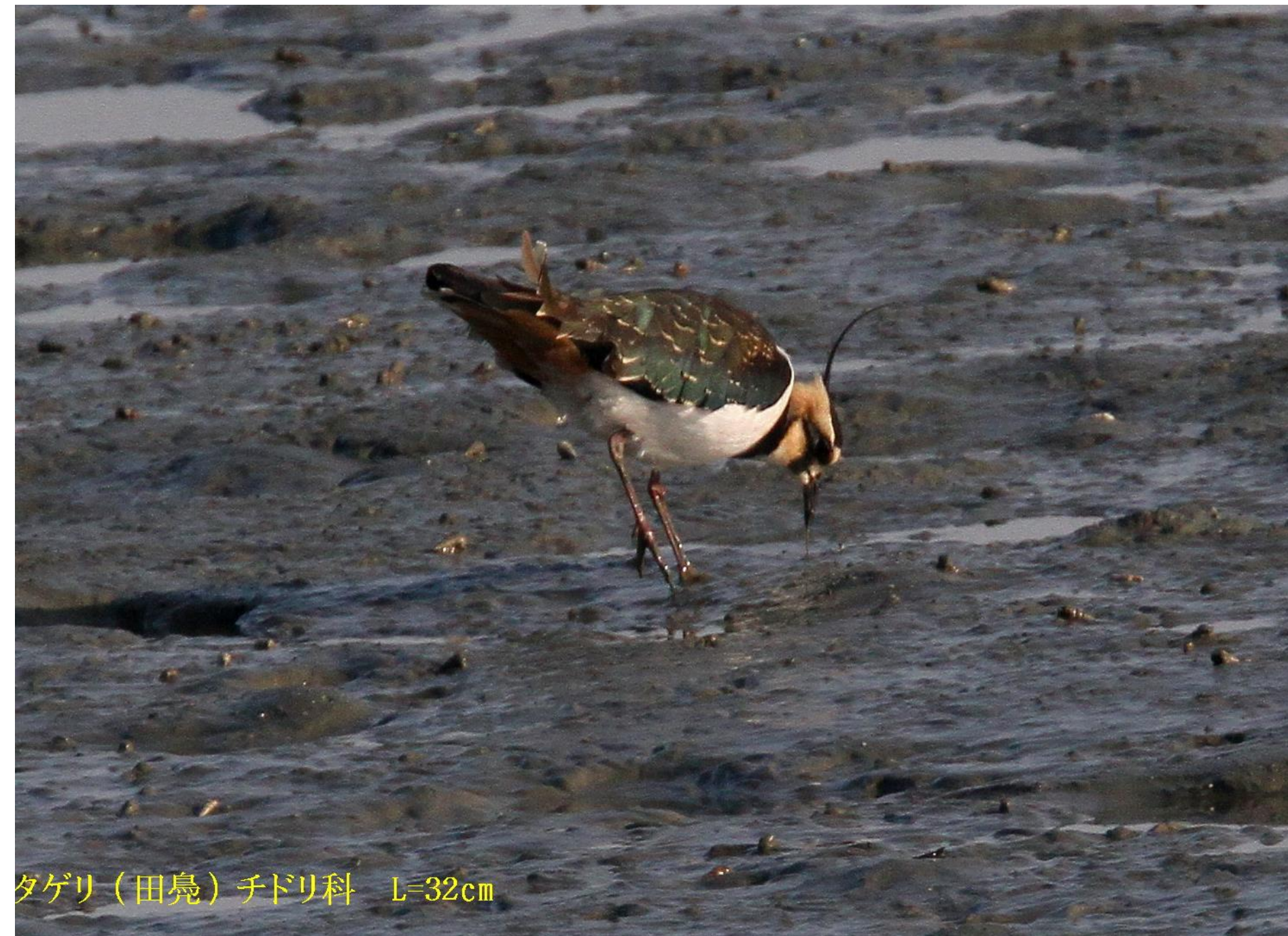
タゲリ (田嶋) チドリ科 L=32cm