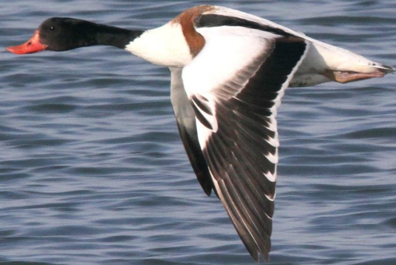
ツクシガモ (筑紫鴨) ガンカモ科 L=63cm