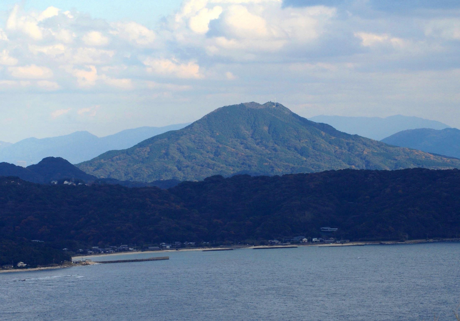
姫島の鎮山(ちんやま)187mからの可也山(かやさん)365m