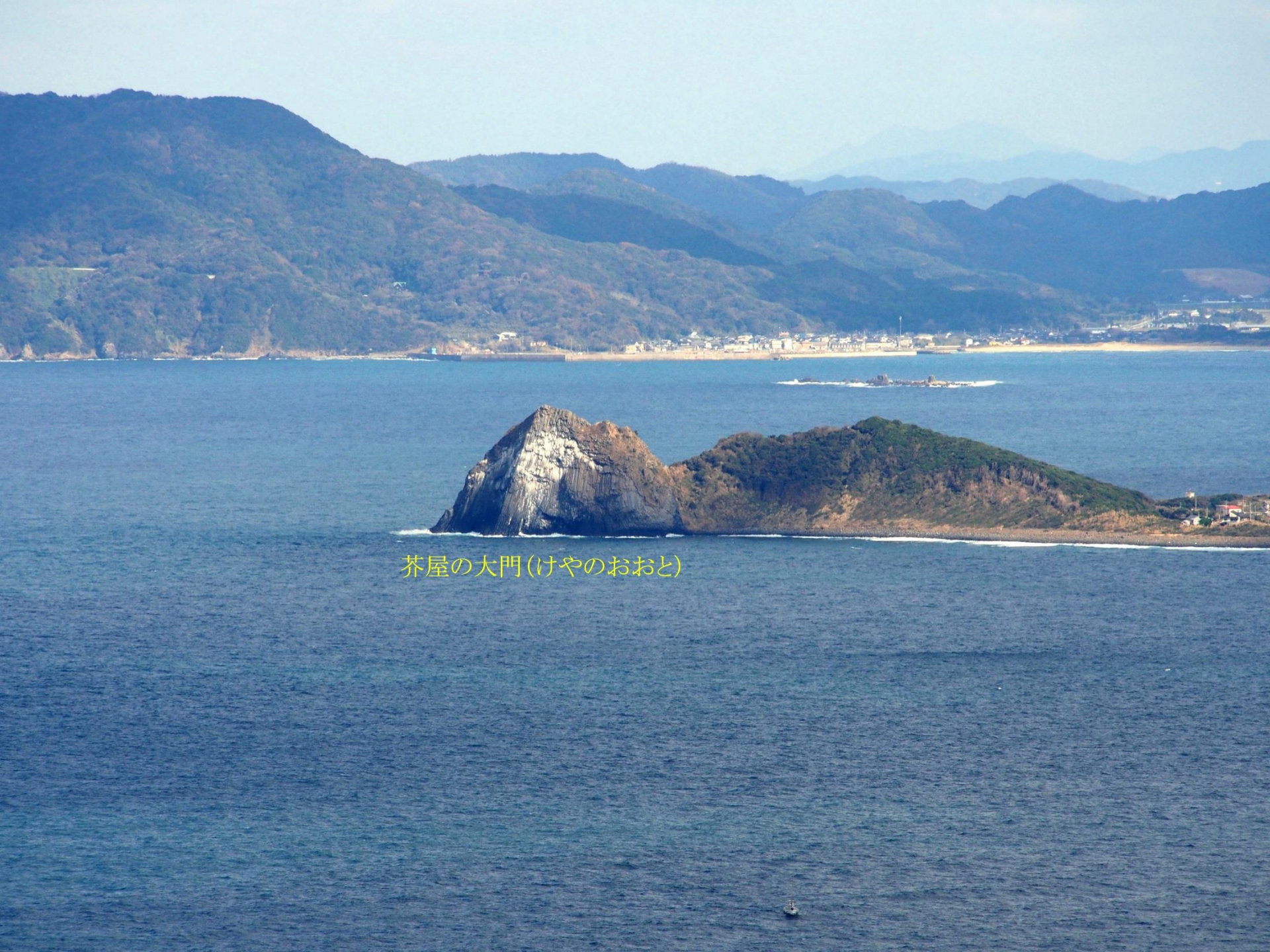
芥屋の大門(けやのおおと)