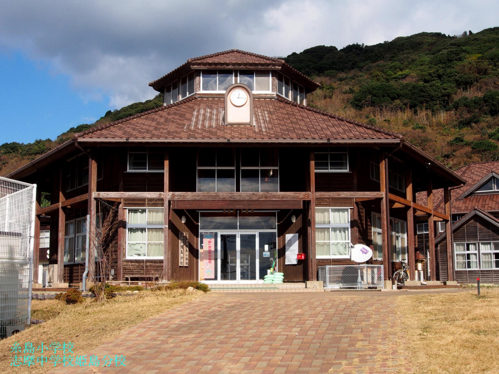
糸島小学校 志摩中学校姫島分校