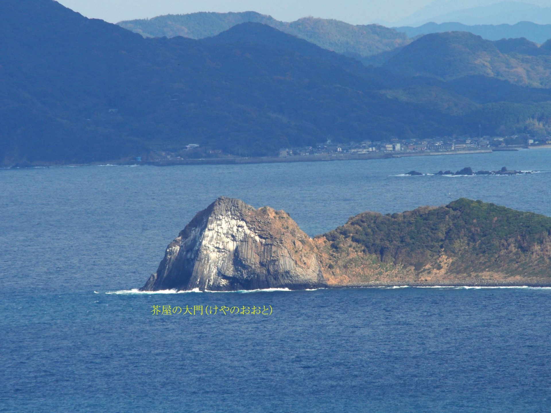
芥屋の大門(けやのおおと)