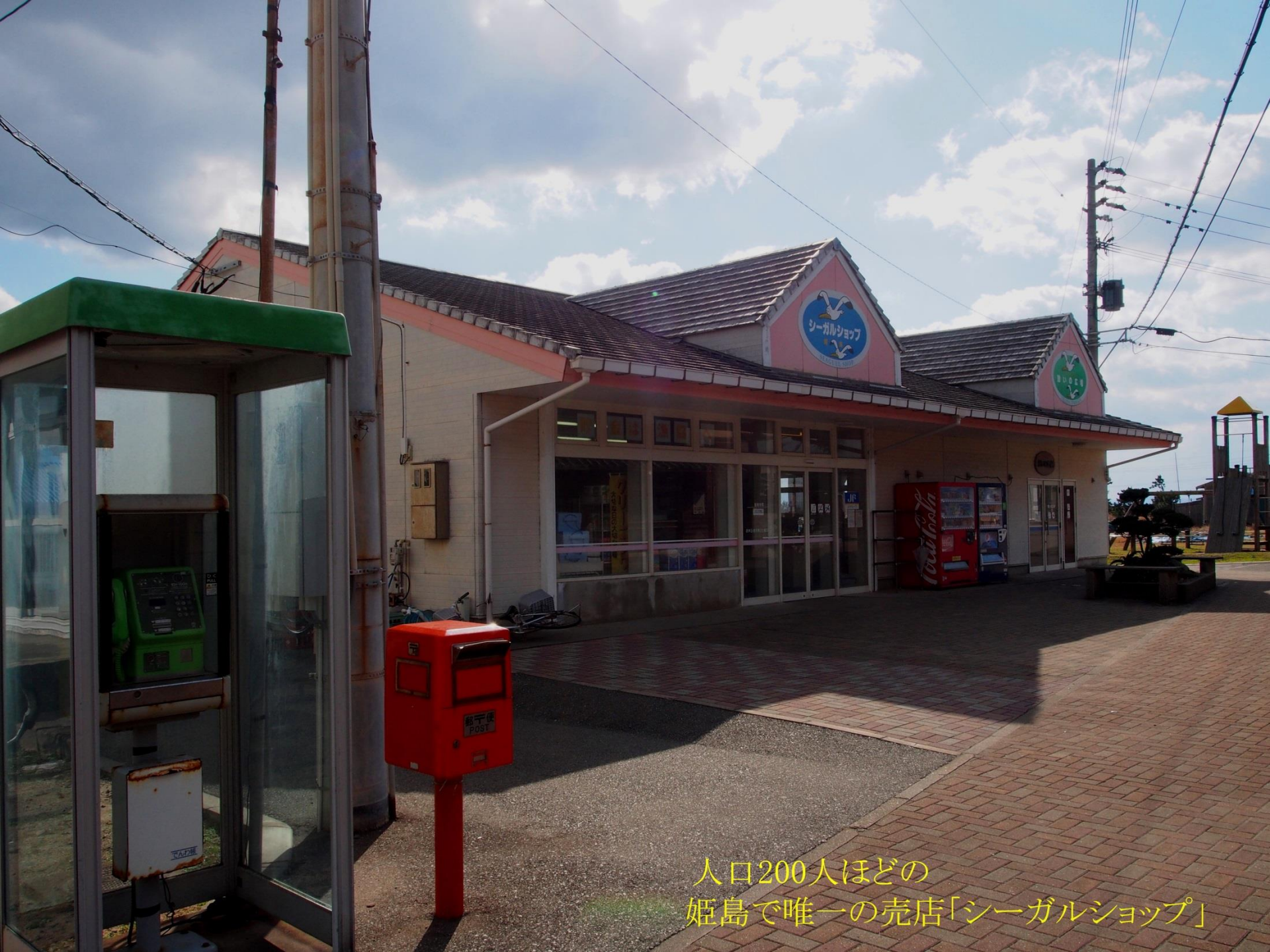
人口200人ほどの 姫島で唯一の売店「シーガルショップ」