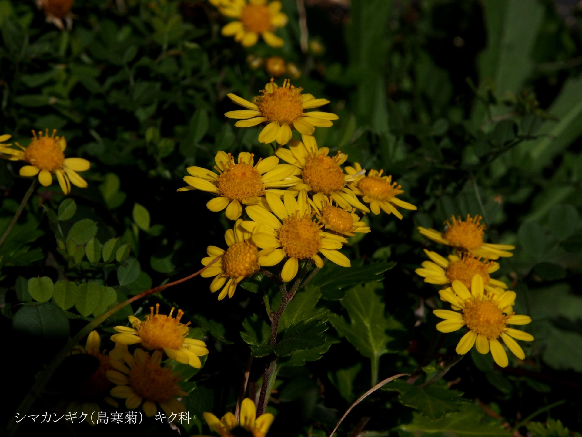
シマカンギク(島寒菊) キク科