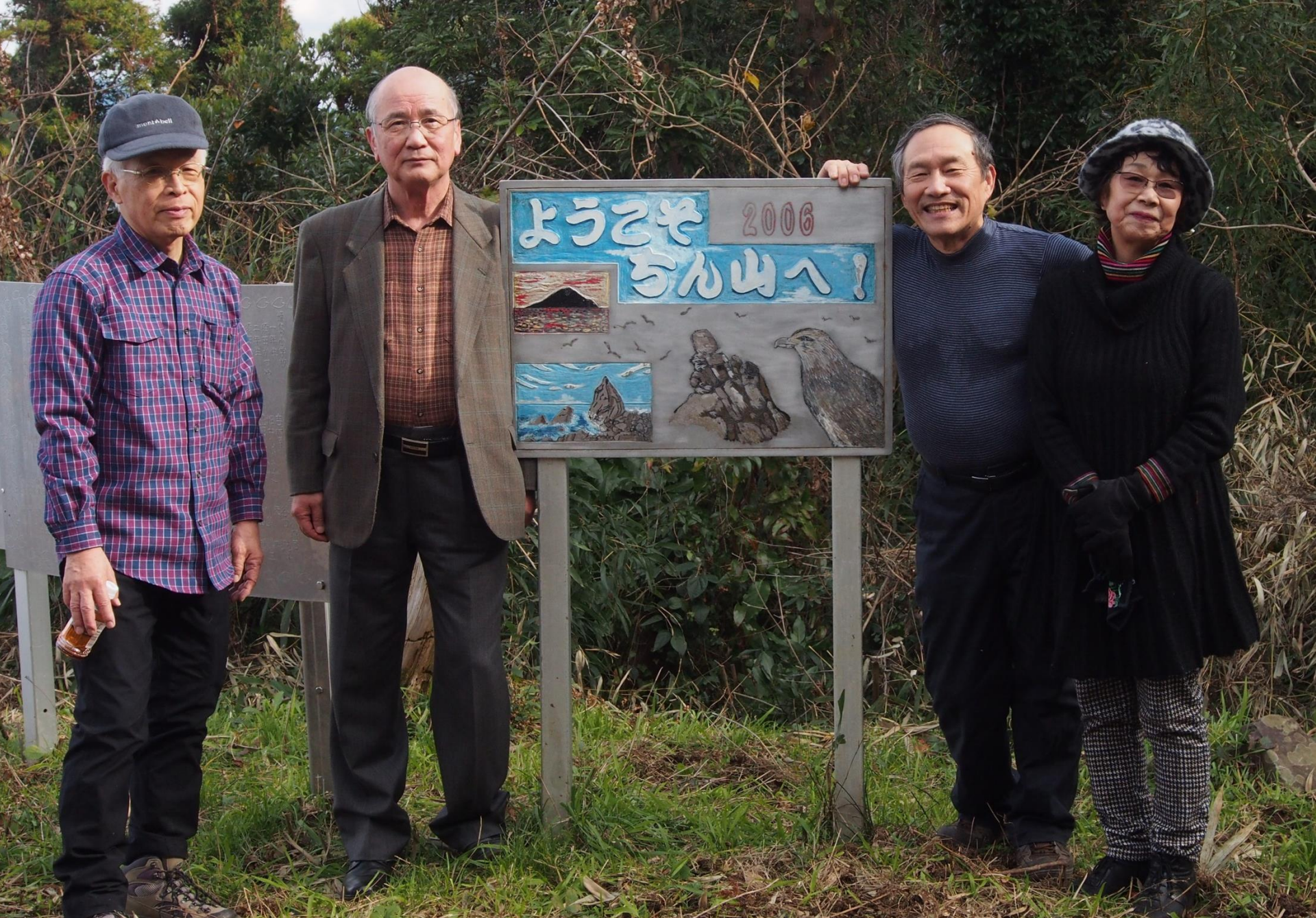
鎮山(ちんやま)山頂187m