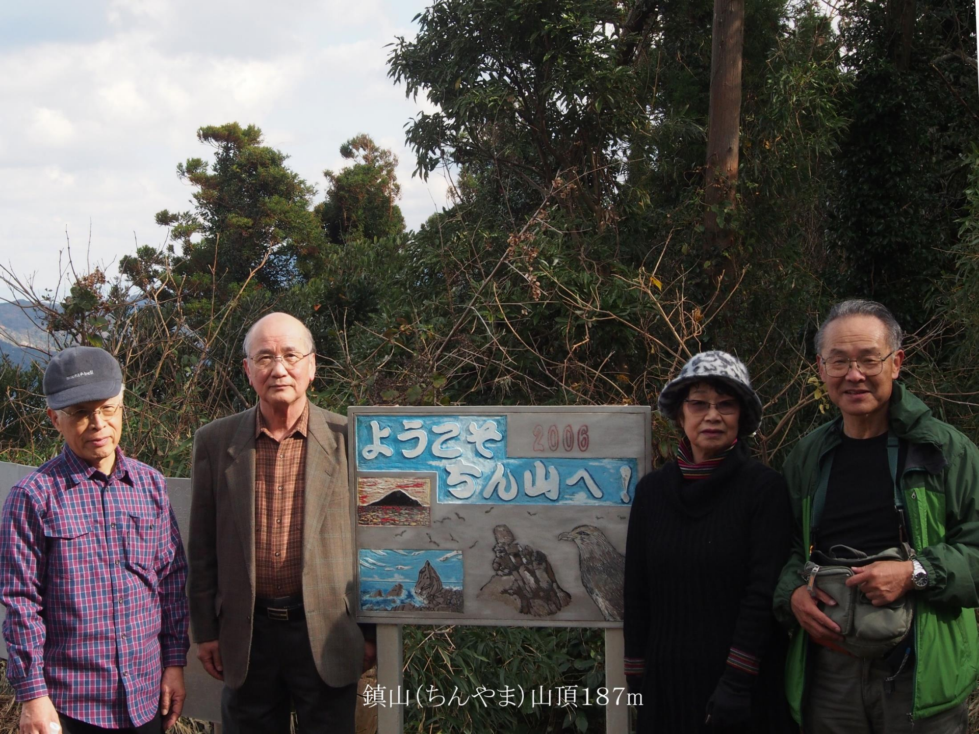
鎮山(ちんやま)山頂187m