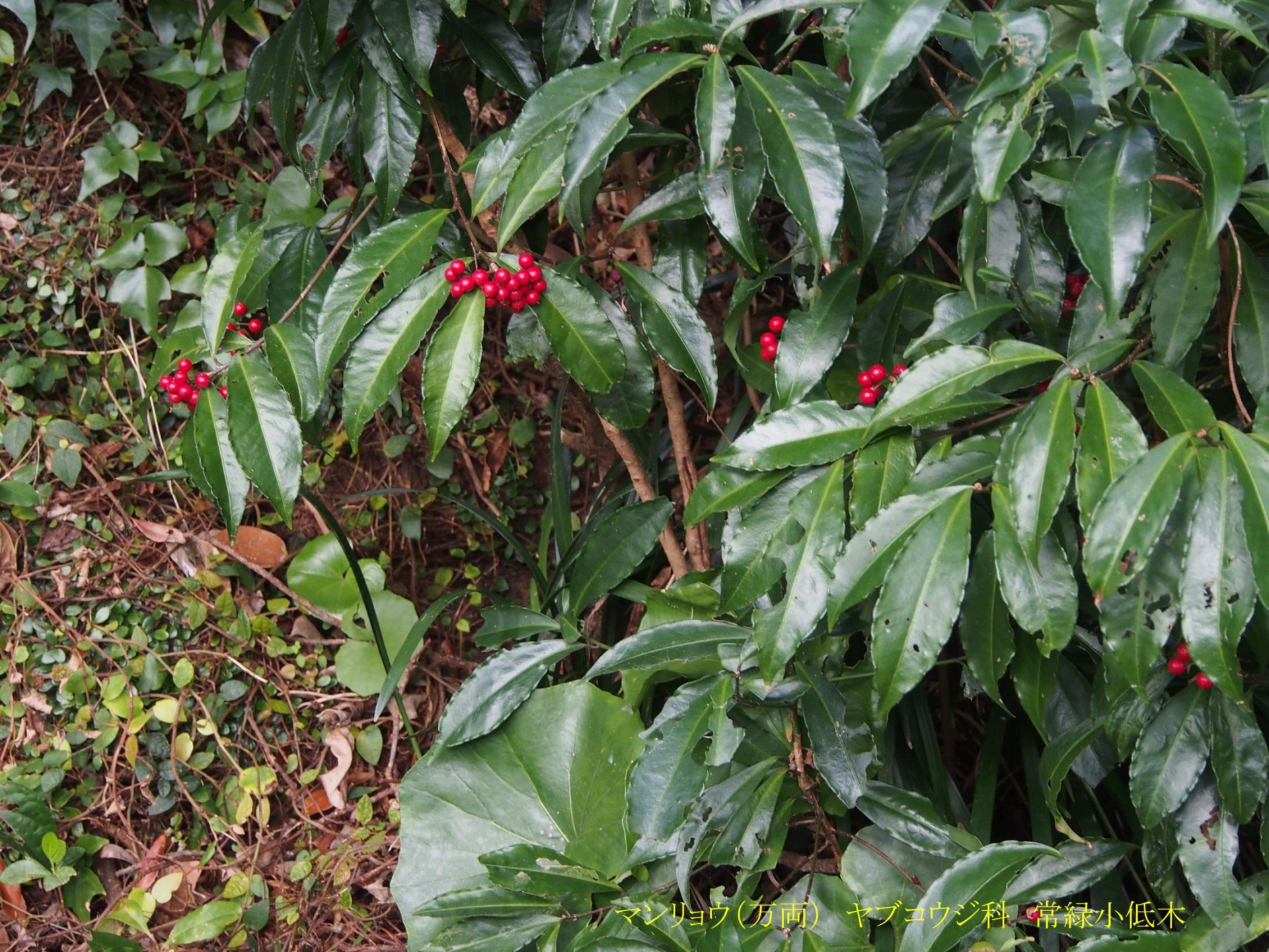
マンリョウ(万両) ヤブコウジ科 常緑小低木