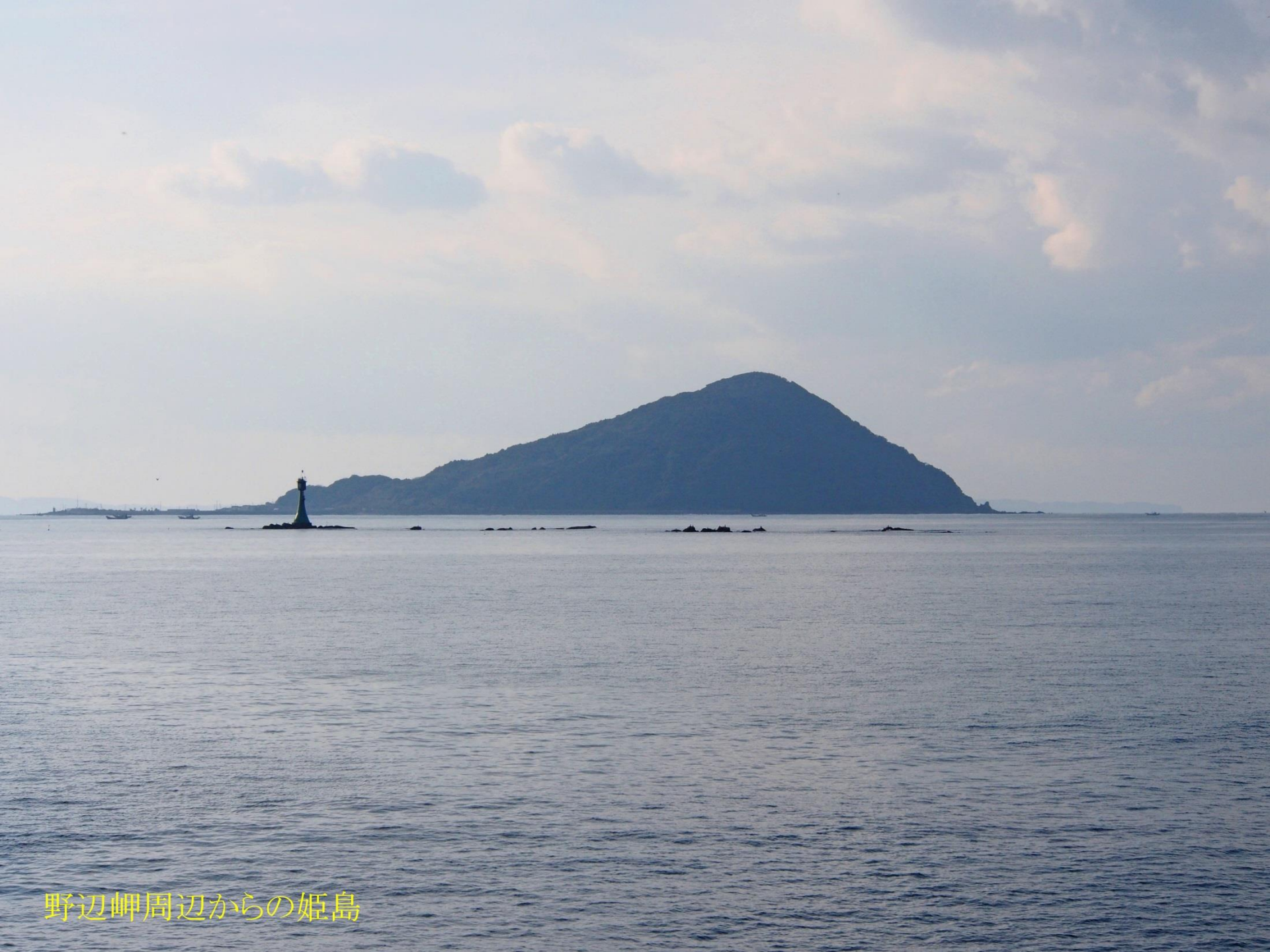
野辺岬周辺からの姫島