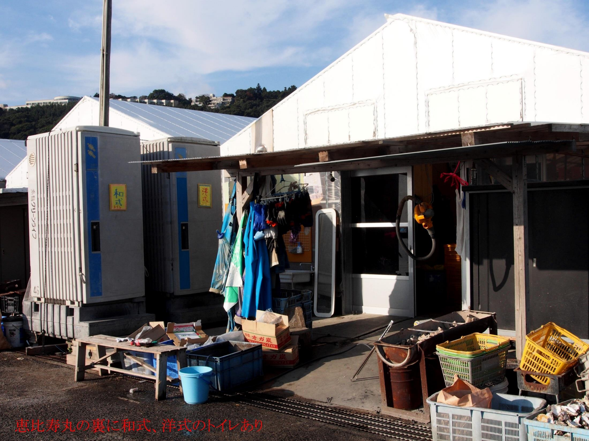
恵比寿丸の裏に和式、洋式のトイレあり