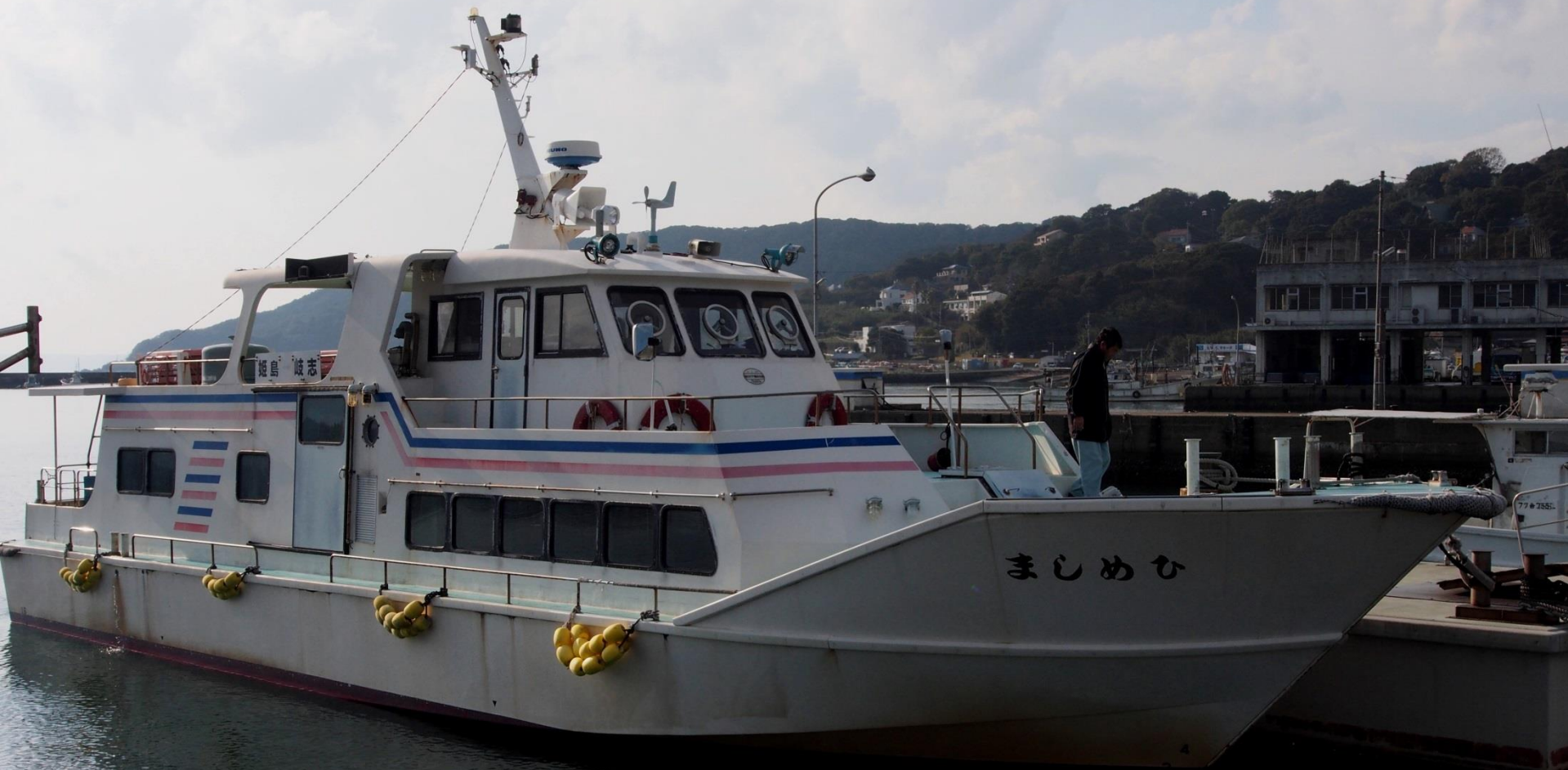
糸島市営渡船「ひめしま」