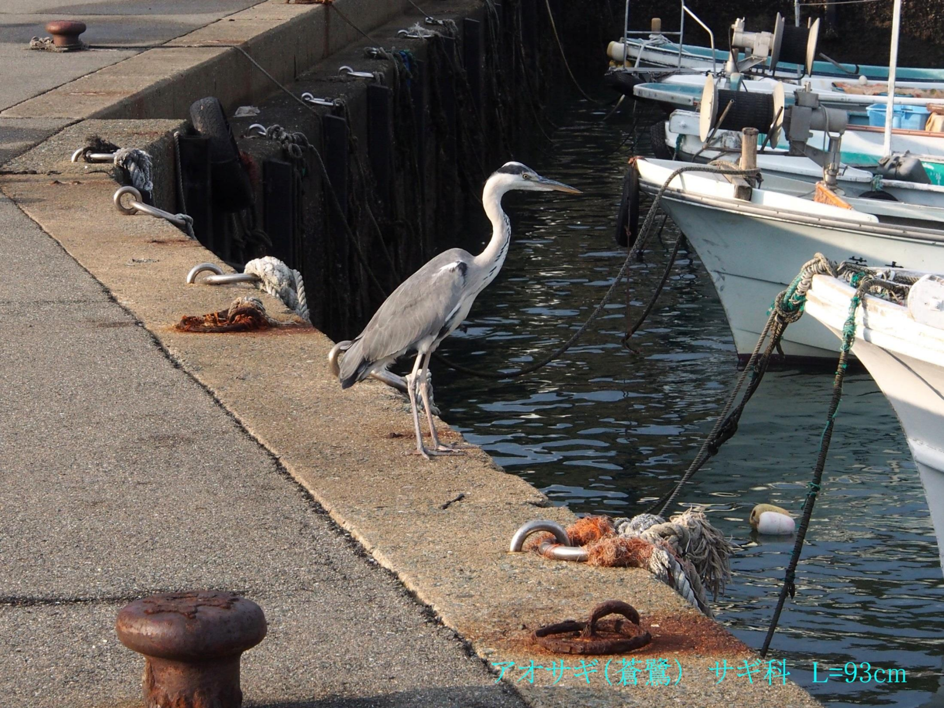
アオサギ(蒼鷺) サギ科 L=93cm