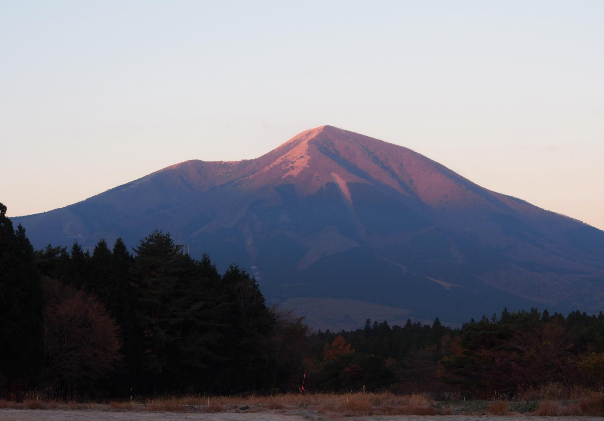
長者原の近くからの涌蓋山(わいたさん) 1500m