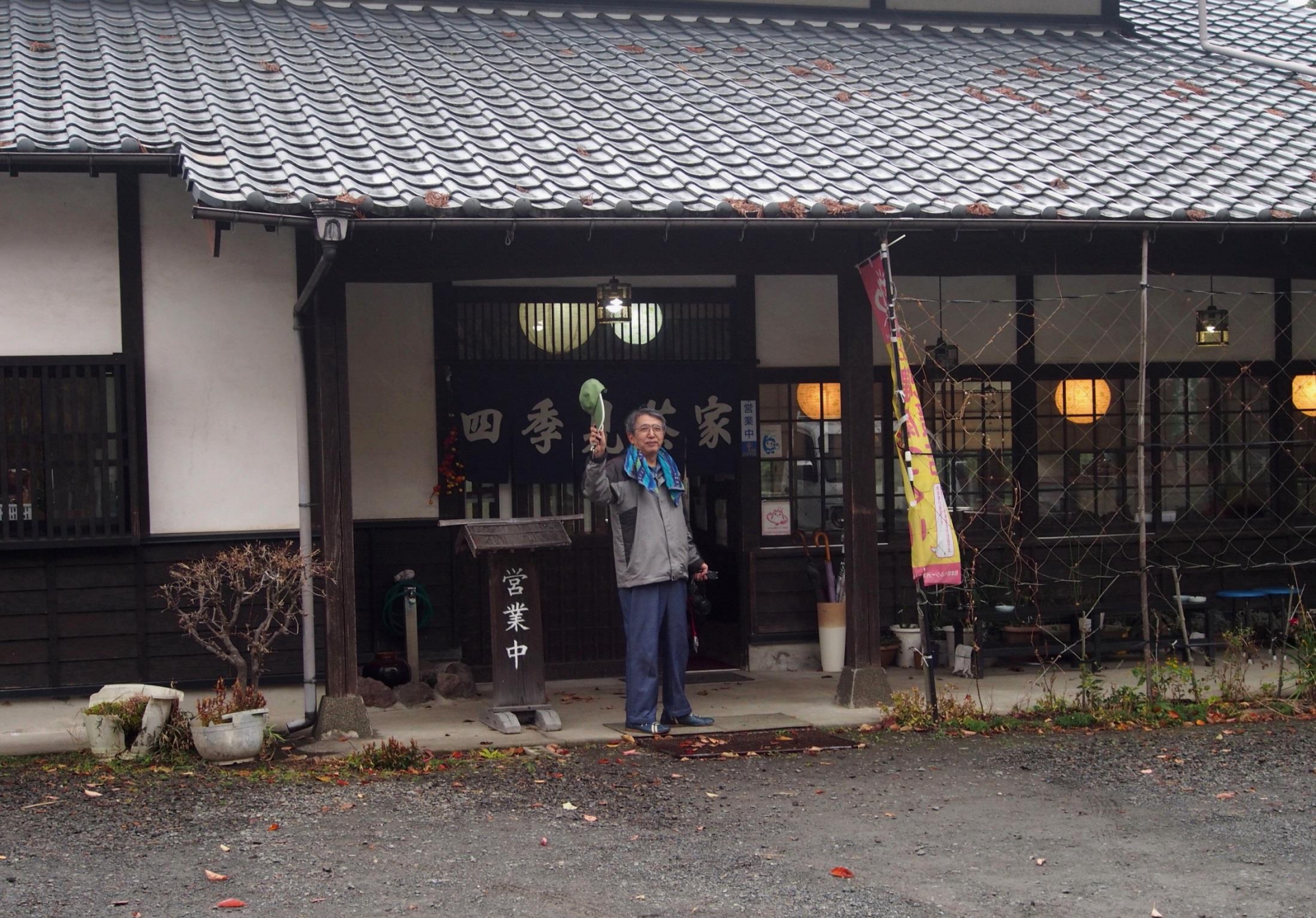
14:05 豆腐料理の四季見茶屋に到着