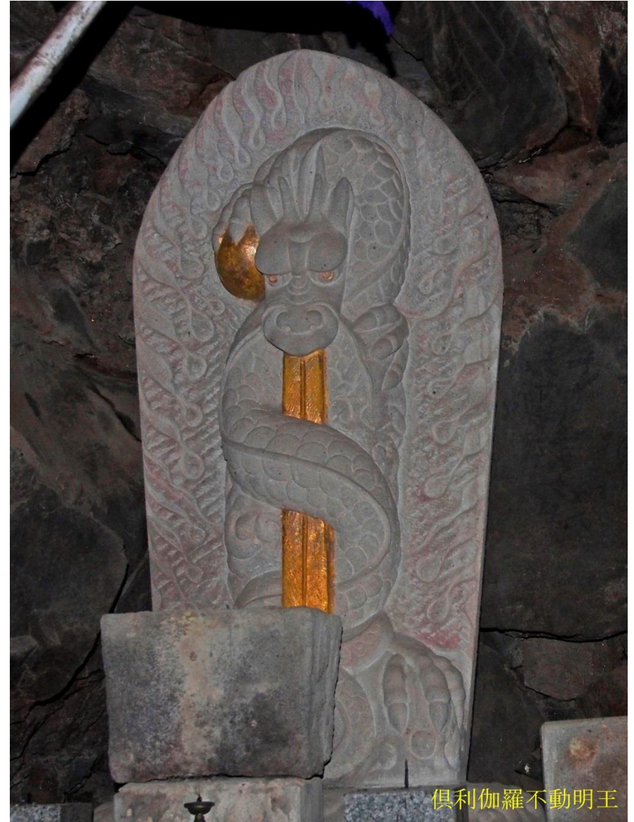
俱利伽羅不動明王