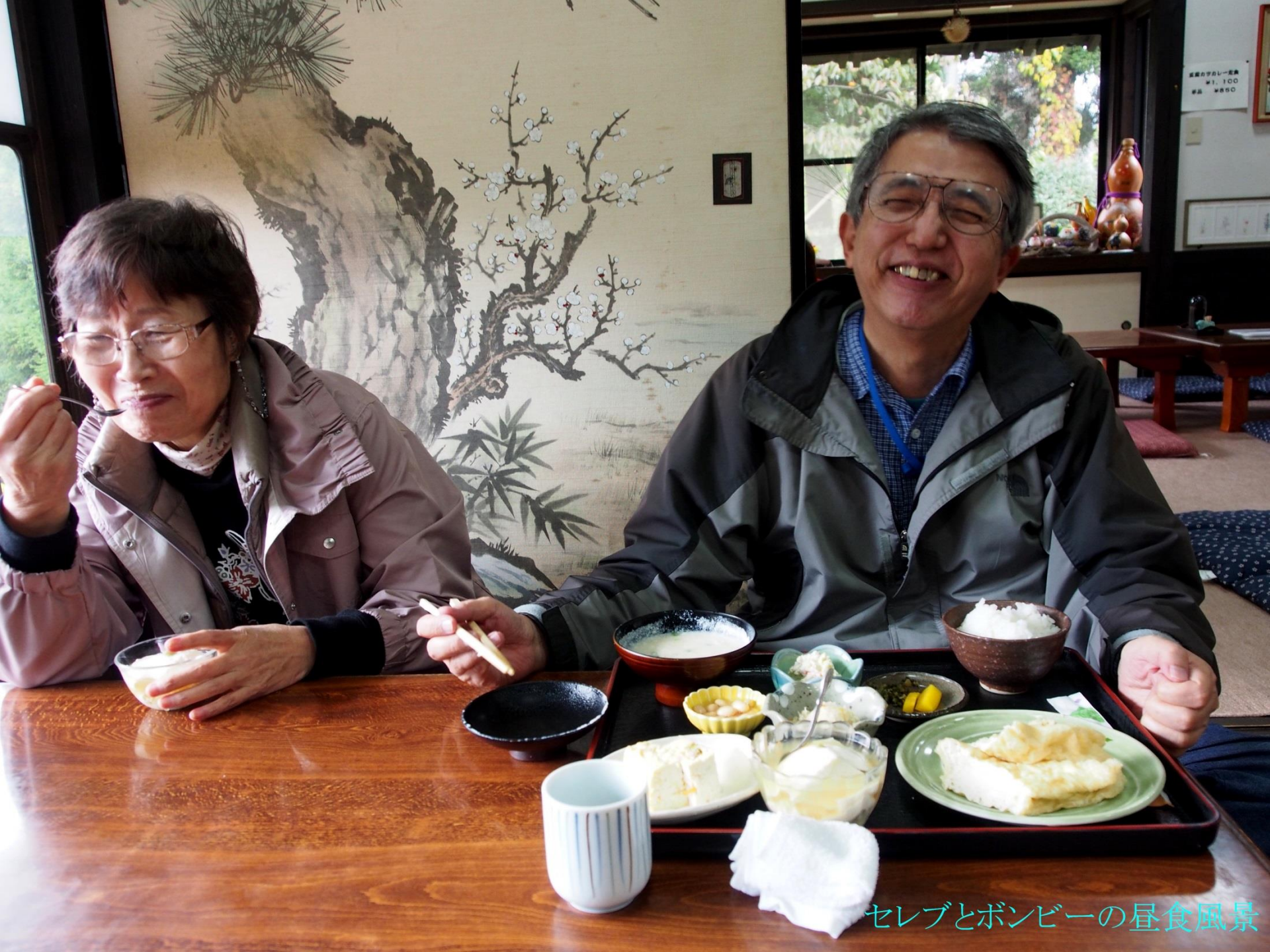
セレブとボンビーの昼食風景