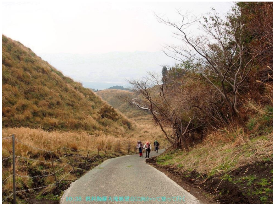
10:36 俱利伽羅大滝展望台に向かう途中の道