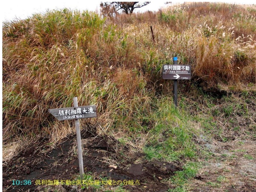
10:36 倶利伽羅不動と倶利伽羅大滝との分岐点