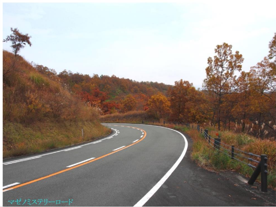
マゼノミステリーロード