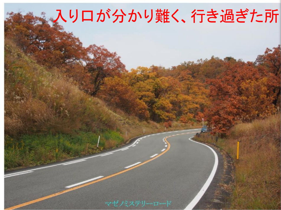
マゼノミステリーロード