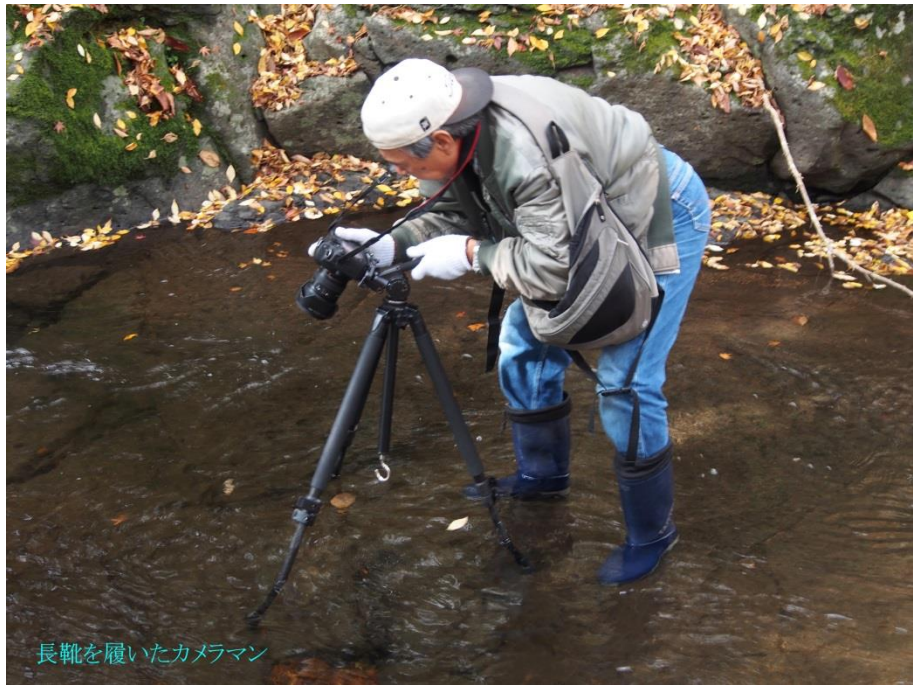
長靴を履いたカメラマン