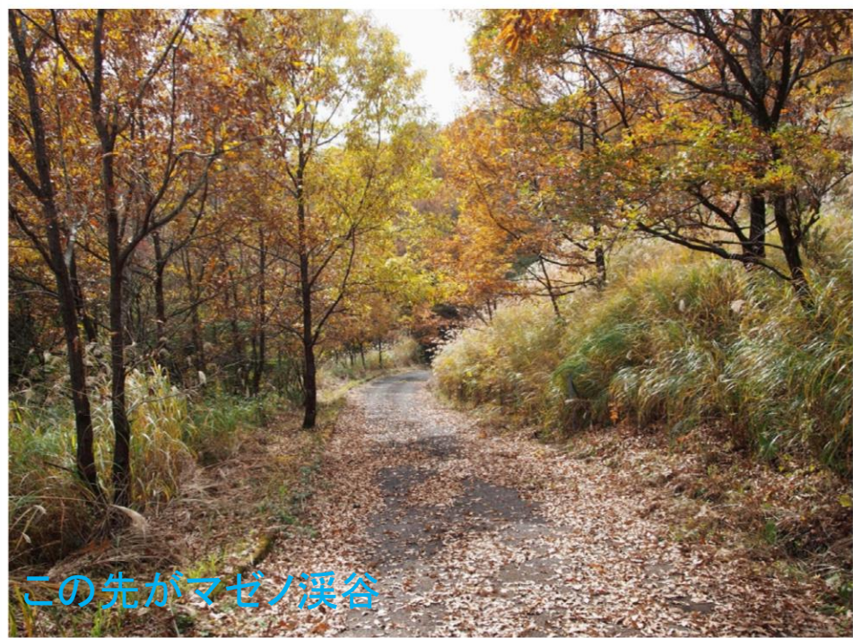
この先がマゼノ溪谷