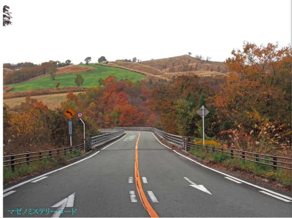
マゼノミステリーロード