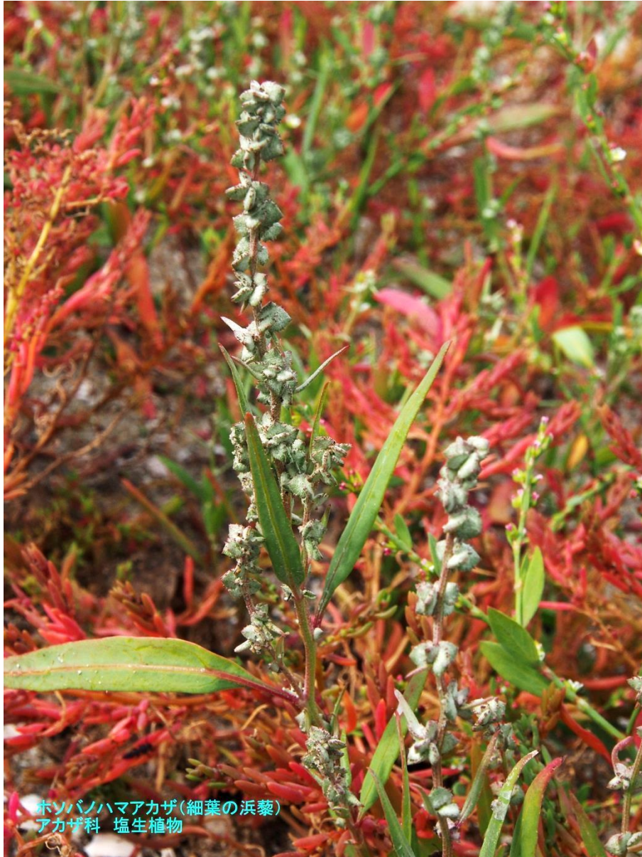
ホソバノハマアカザ(細葉の浜藜) アカザ科 塩生植物