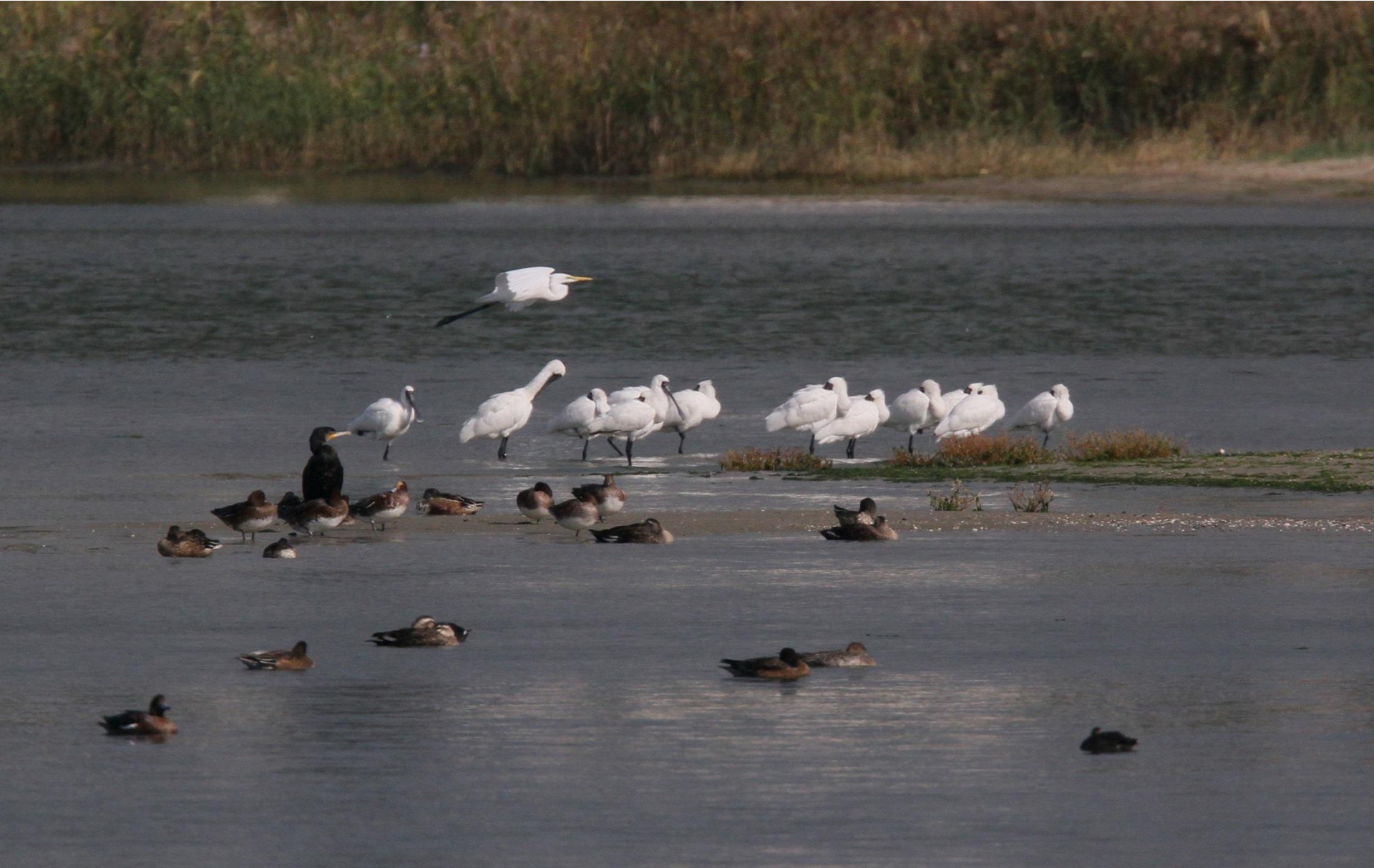
ダイサギ(大鷺) サギ科 L=90cm