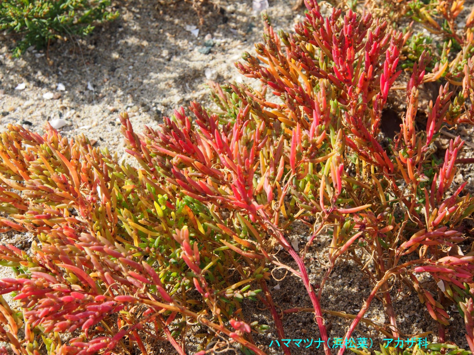
ハママツナ(浜松菜) アカザ科