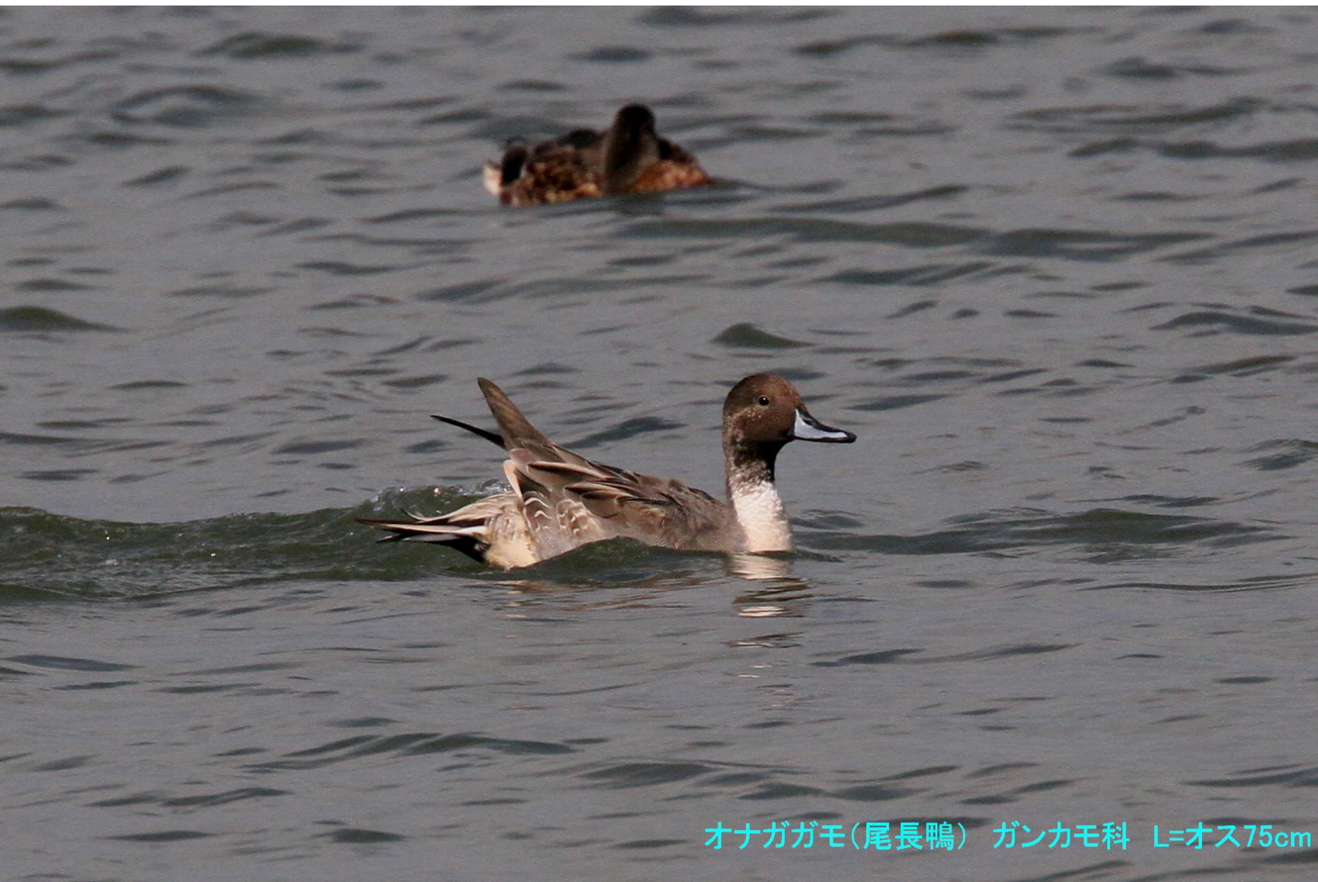
オナガガモ(尾長鴨) ガンカモ科 L=オス75cm