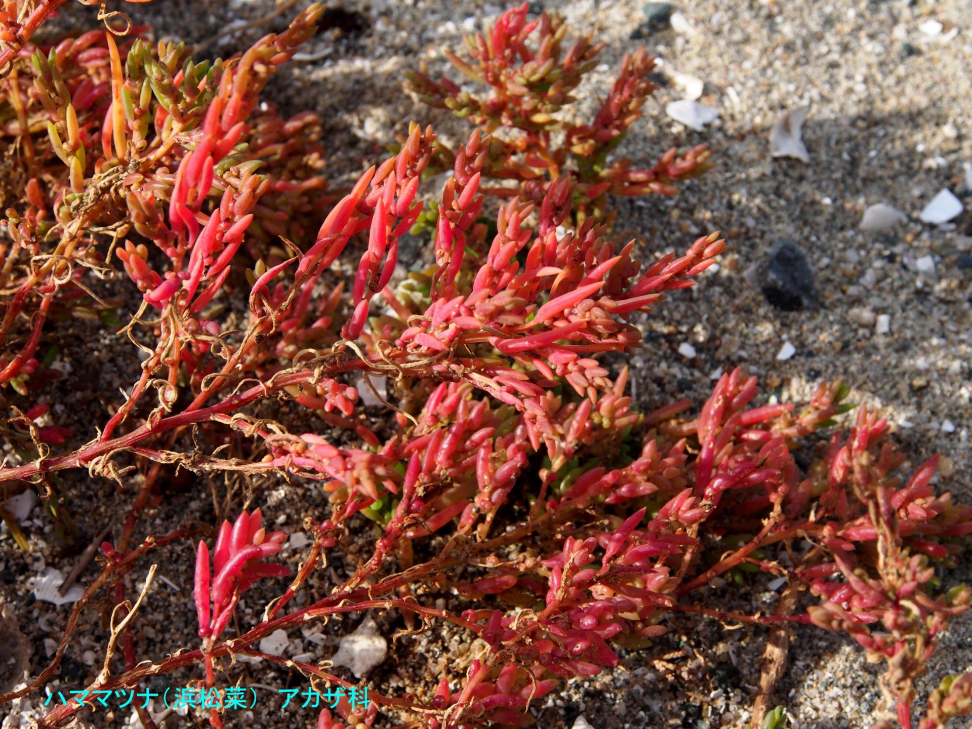
ハママツナ(濱松菜) アカザ科