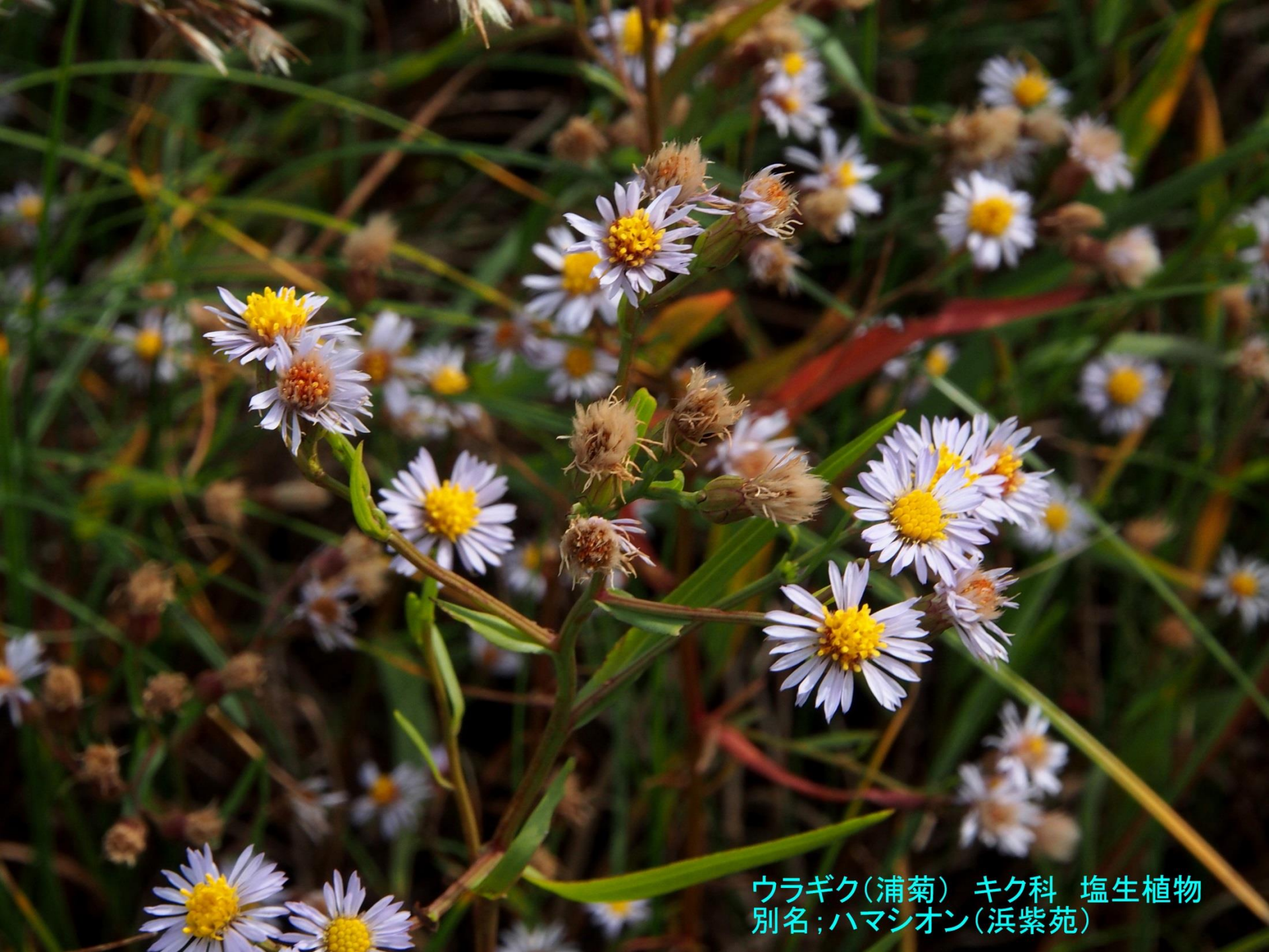
ウラギク(浦菊) キク科 塩生植物 別名;ハマシオン(浜紫苑)