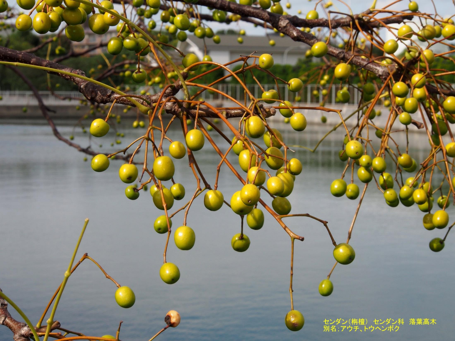
センダン(栴檀) センダン科 落葉高木 別名;アウチ、トウヘンボク