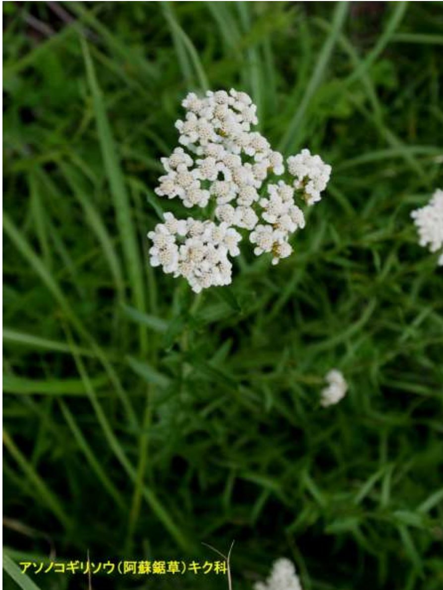
アソノギリソウ(阿蘇鋸草)キク科