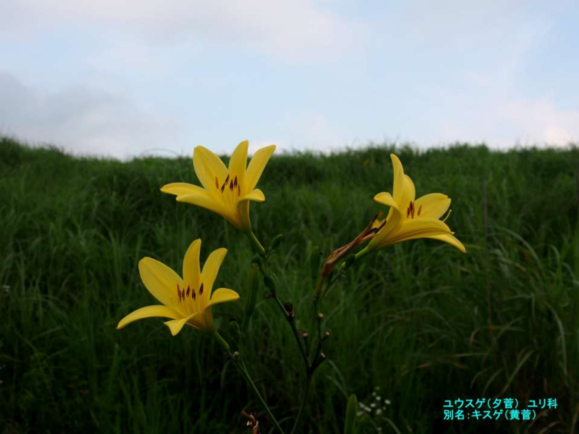
ユウスゲ(夕菅) ユリ科 別名:キスゲ(黄菅)