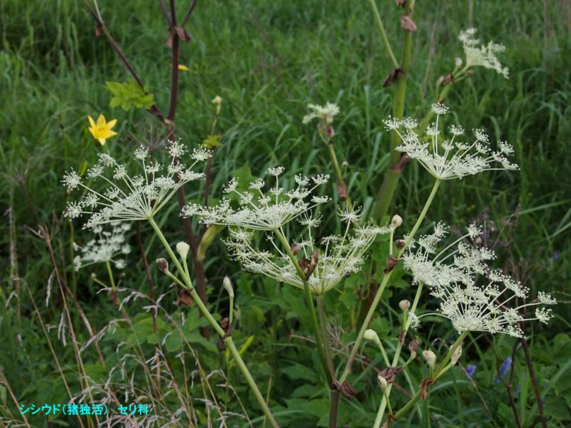
シシウド(猪独活) セリ科