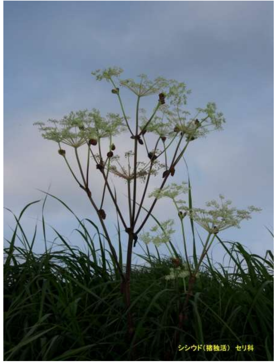
シシウド(猪独活) セリ科