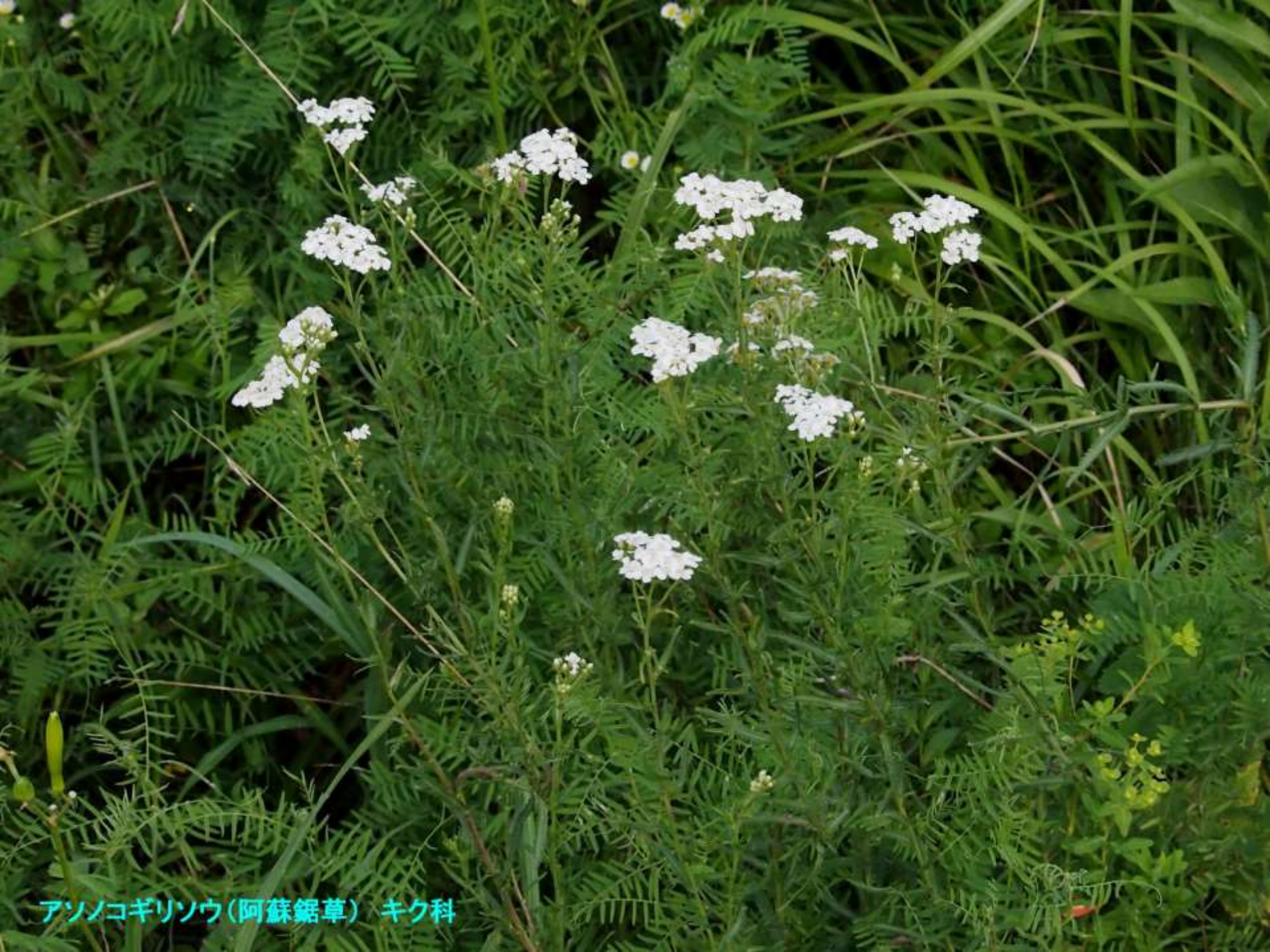
アソノギリソウ(阿蘇鋸草) キク科