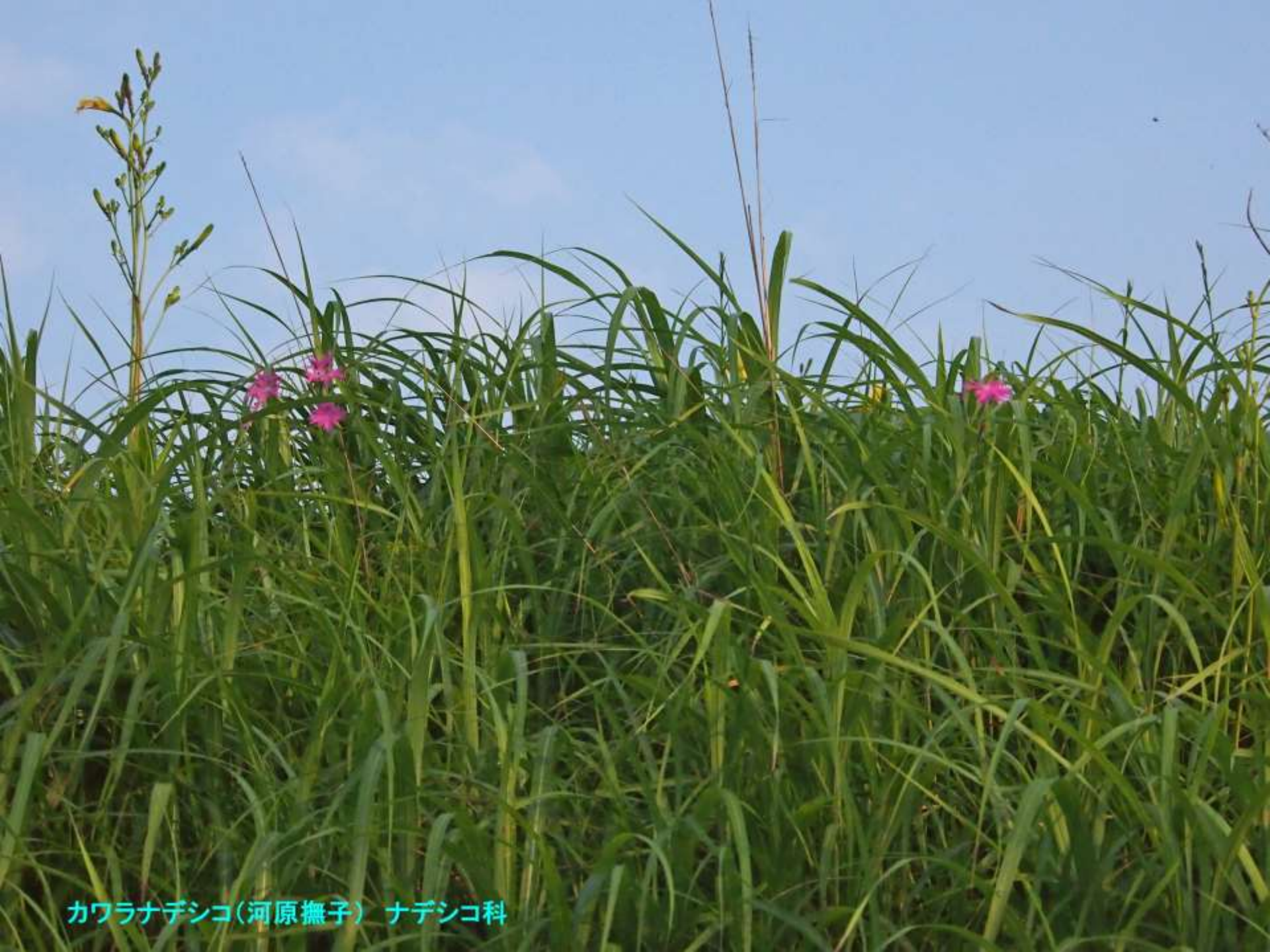
カワラナデシコ(河原撫子) ナデシコ科