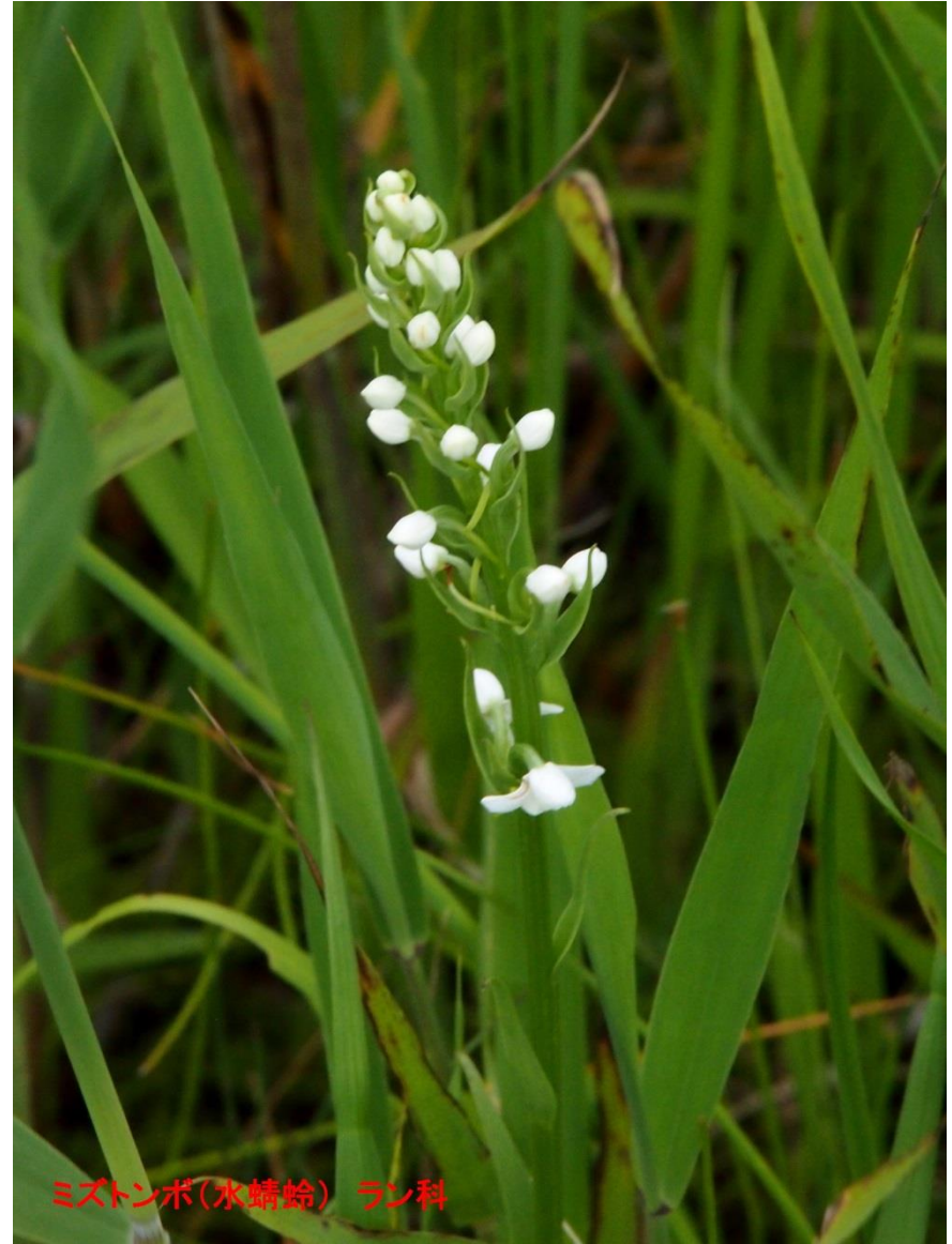
ミズトンボ(水蜻蛉) ラン科