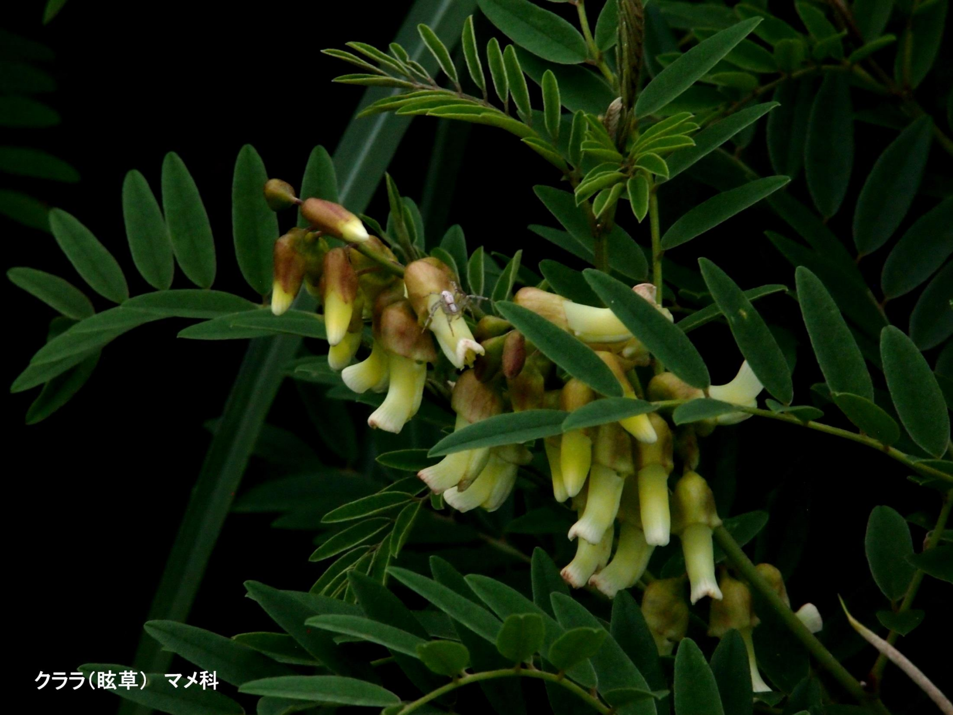
クララ(眩草) マメ科