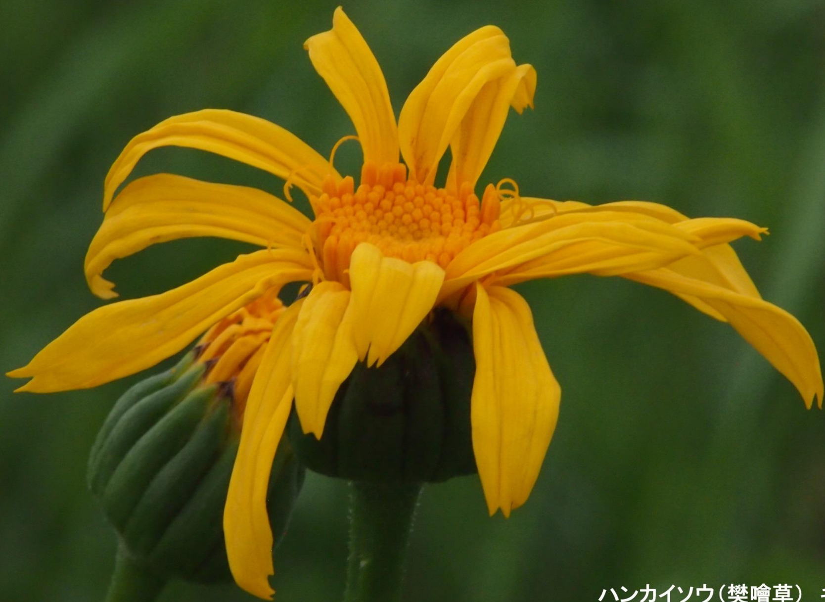
ハンカイソウ(樊噲草) キク科