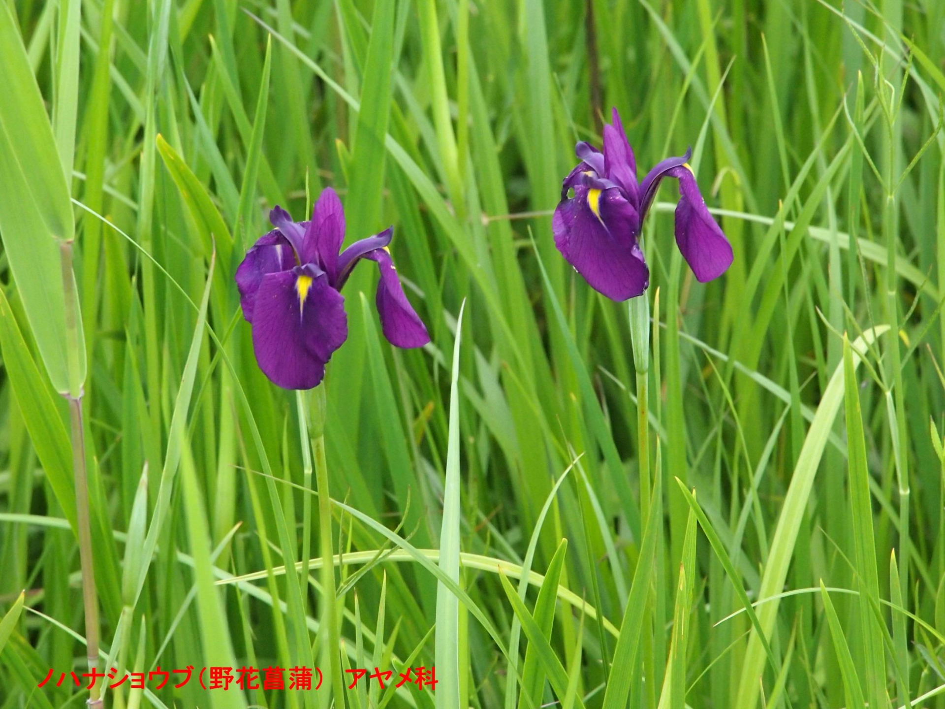
ノハナショウブ(野花菖蒲) アヤメ科