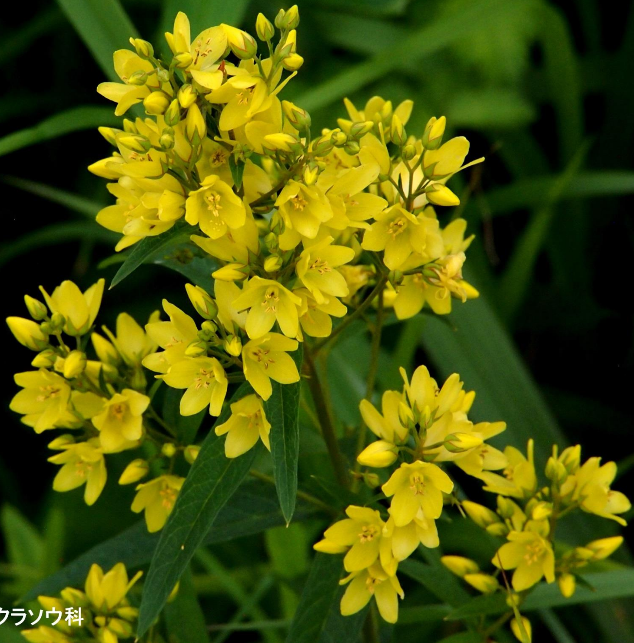
クサレダマ(草蓮玉) サクラソウ科