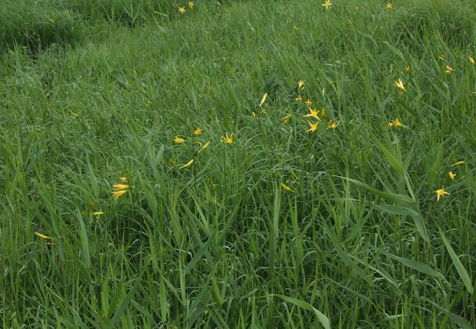
ユウスゲ(夕菅) ユリ科 別名:キスゲ(黄菅)