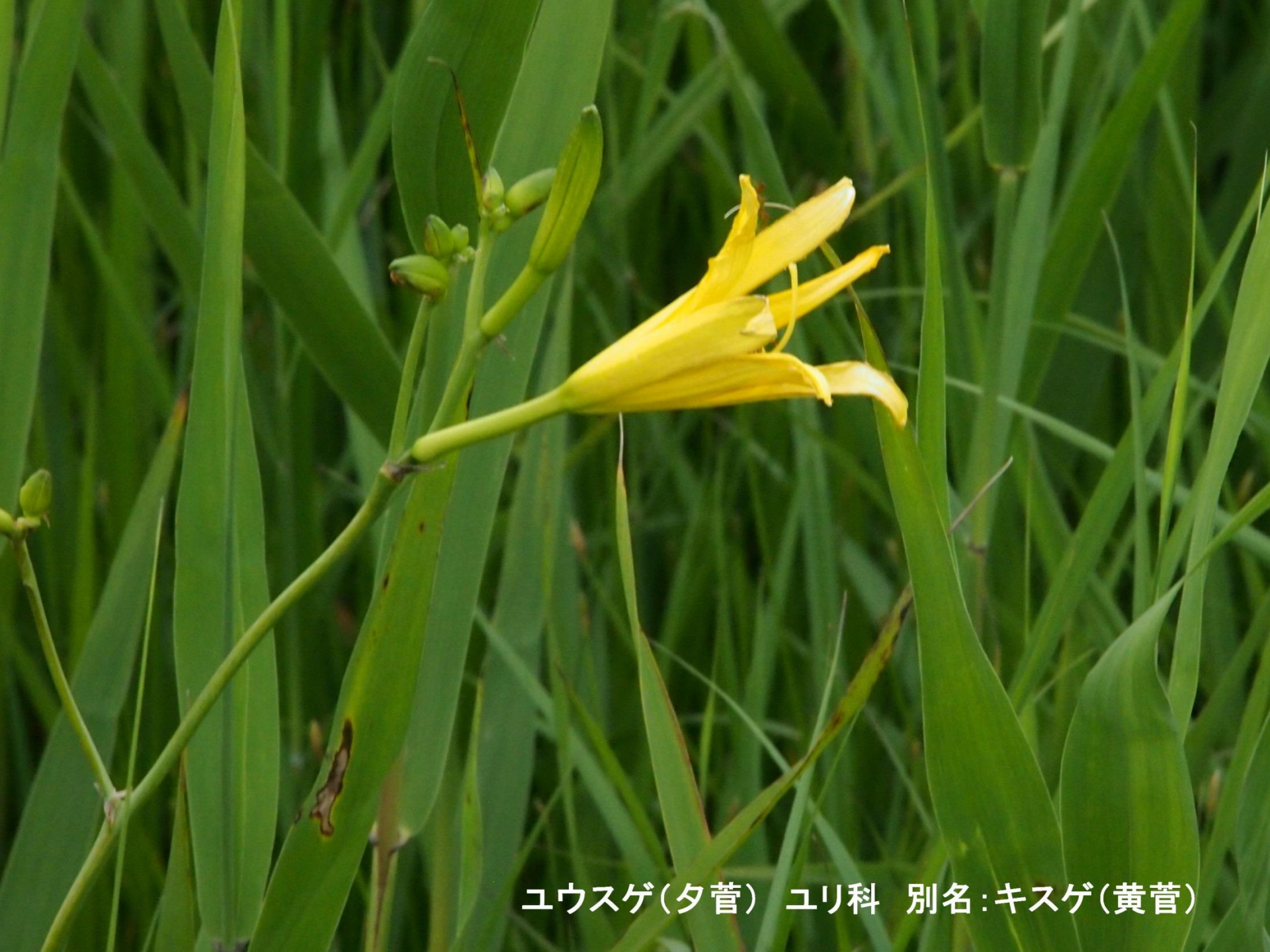
ユウスゲ(夕菅) ユリ科 別名:キスゲ(黄菅)