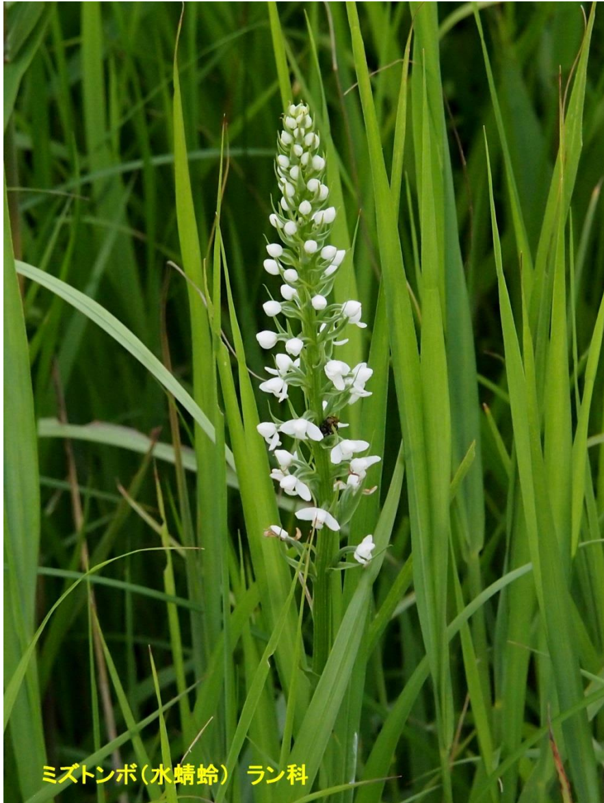
ミズトンボ(水蜻蛉) ラン科