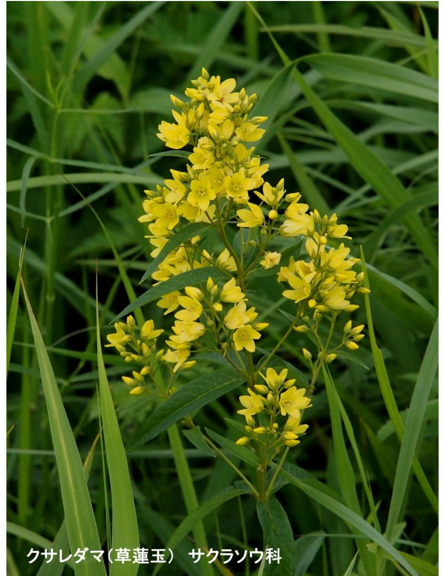
クサレダマ(草蓮玉) サクラソウ科