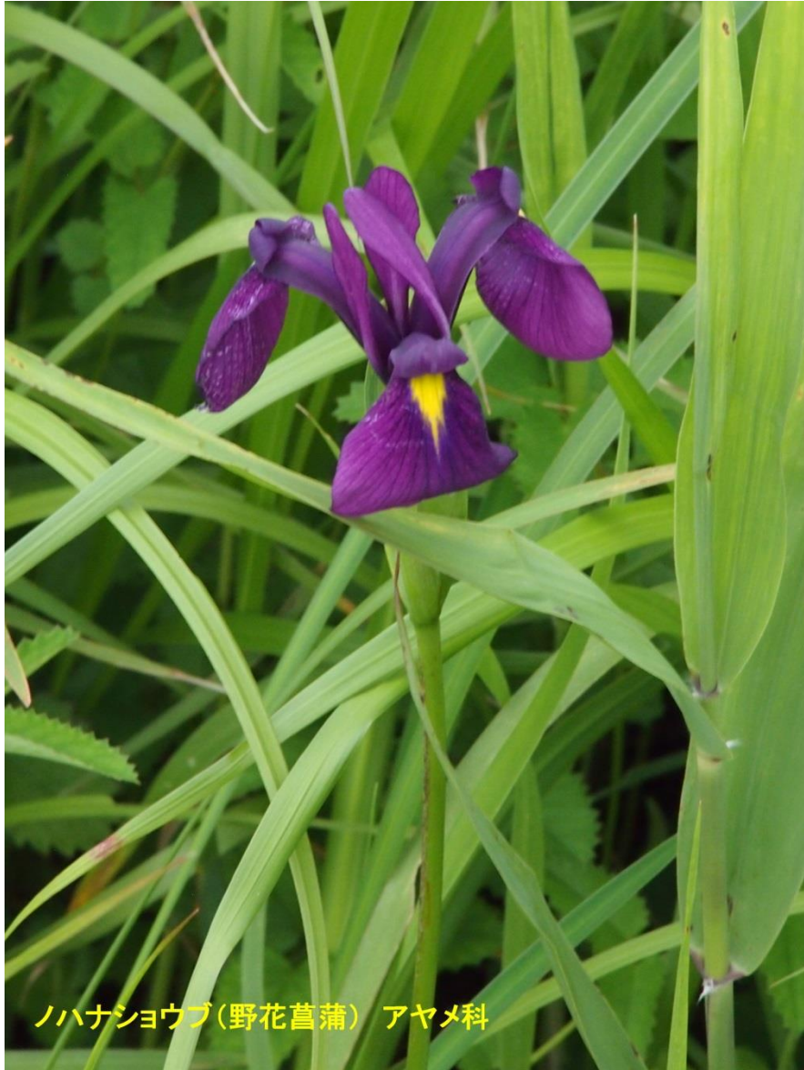
ノハナショウブ(野花菖蒲) アヤメ科