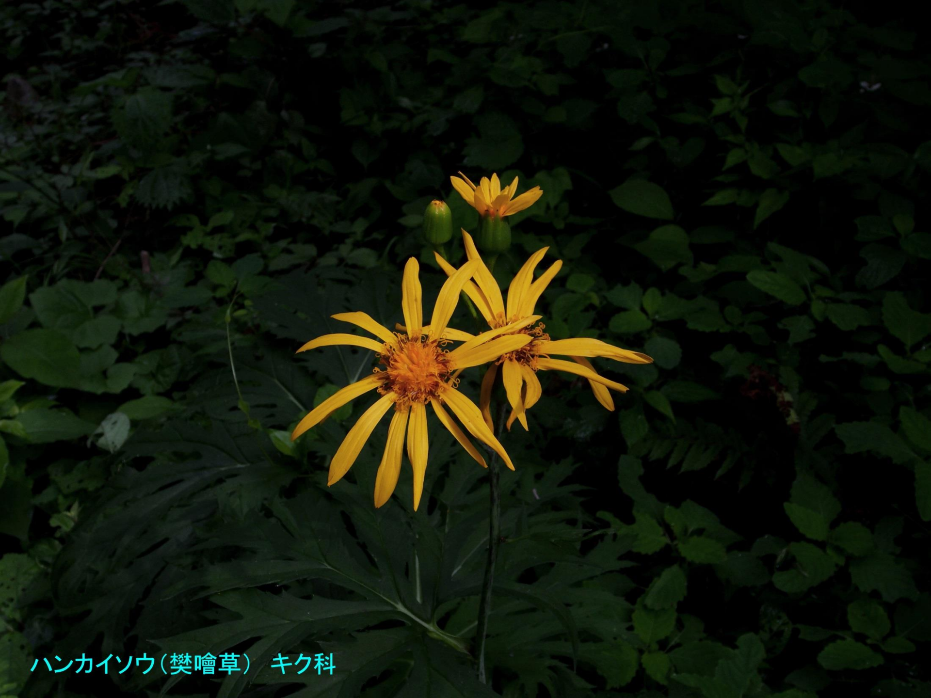
ハンカイソウ(樊噲草) キク科