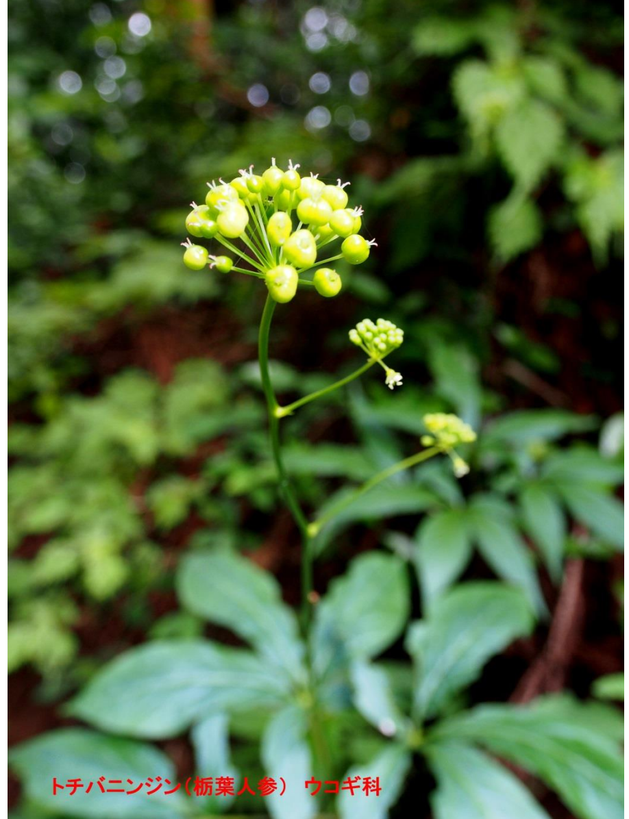
トチバニンジン(栃葉人参) ウコギ科