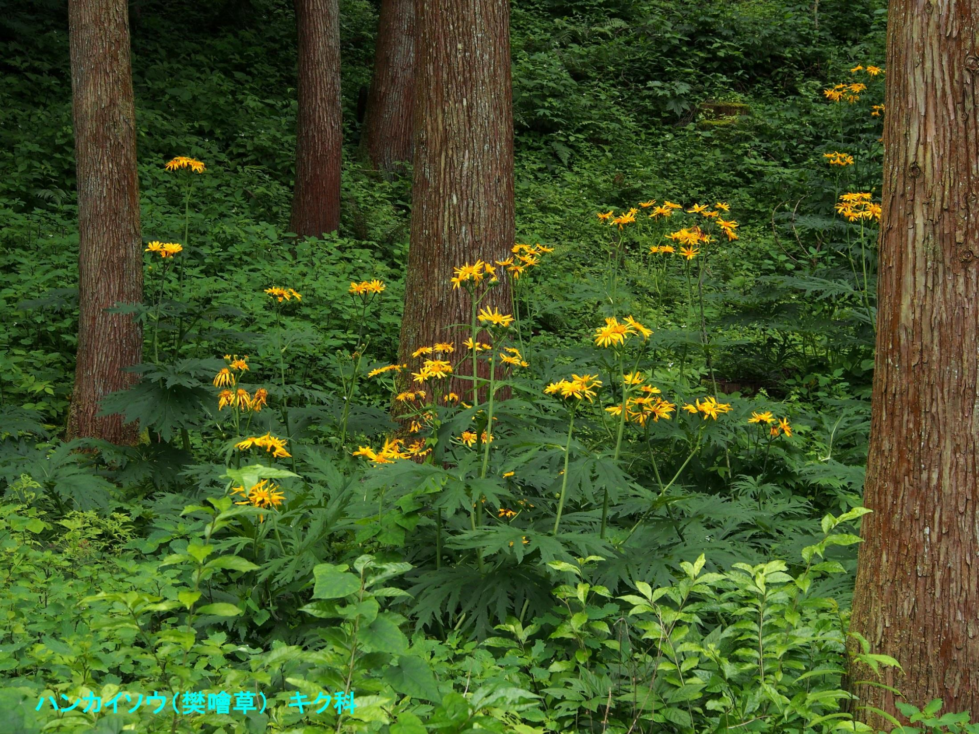
ハンカイソウ(樊嚙草) キク科