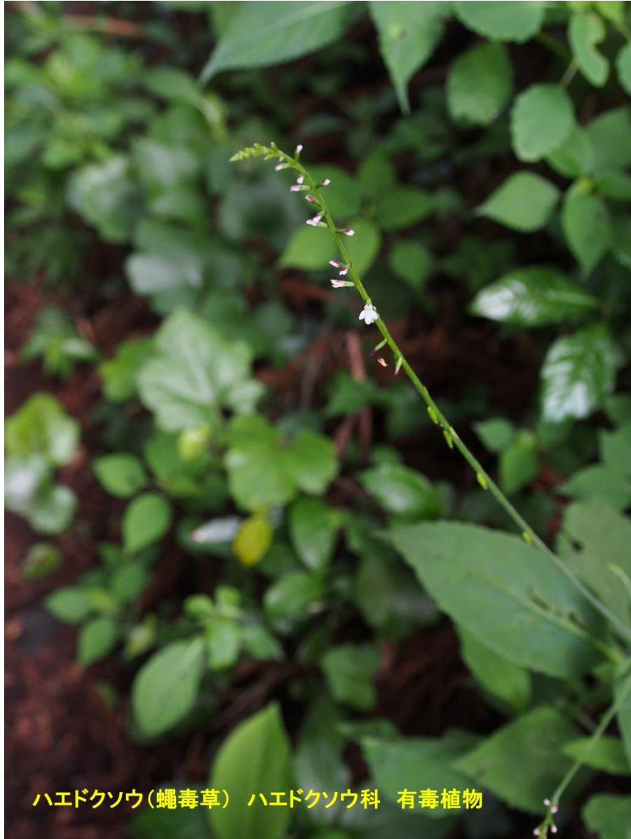
ハエドクソウ(蠅毒草) ハエドクソウ科 有毒植物