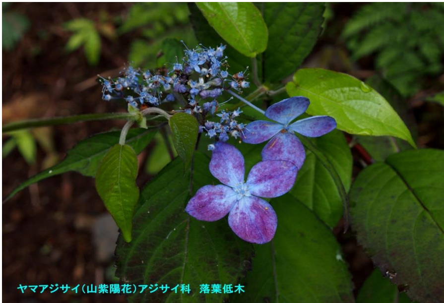
ヤマアジサイ(山紫陽花)アジサイ科 落葉低木