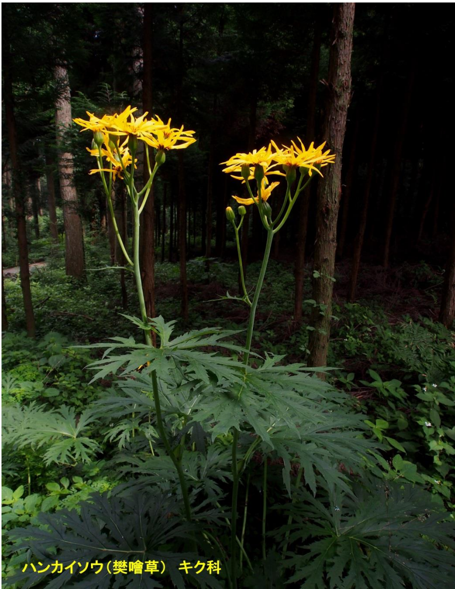
ハンカイソウ(樊噲草) キク科