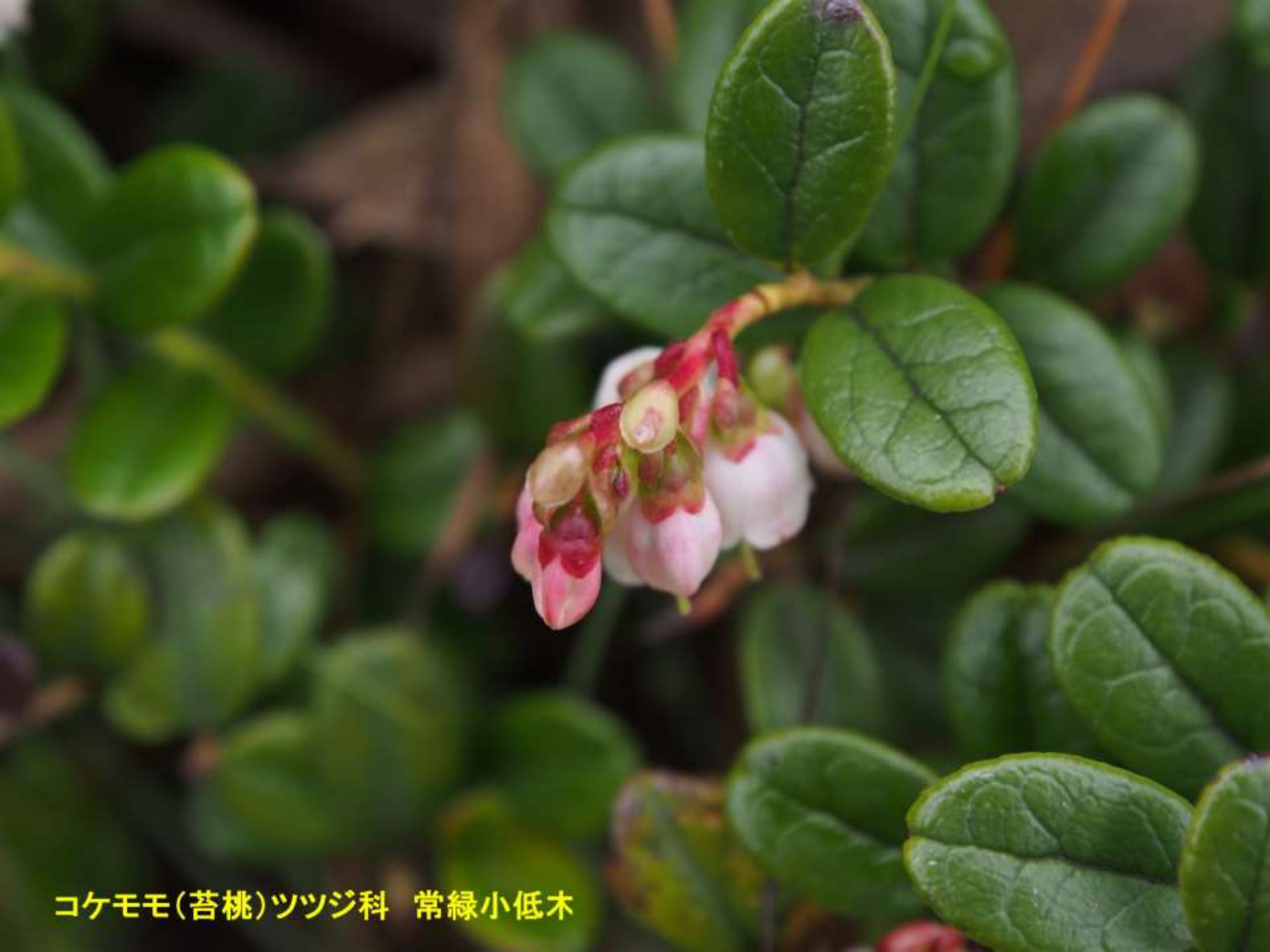
コケモモ(苔桃)ツツジ科 常緑小低木