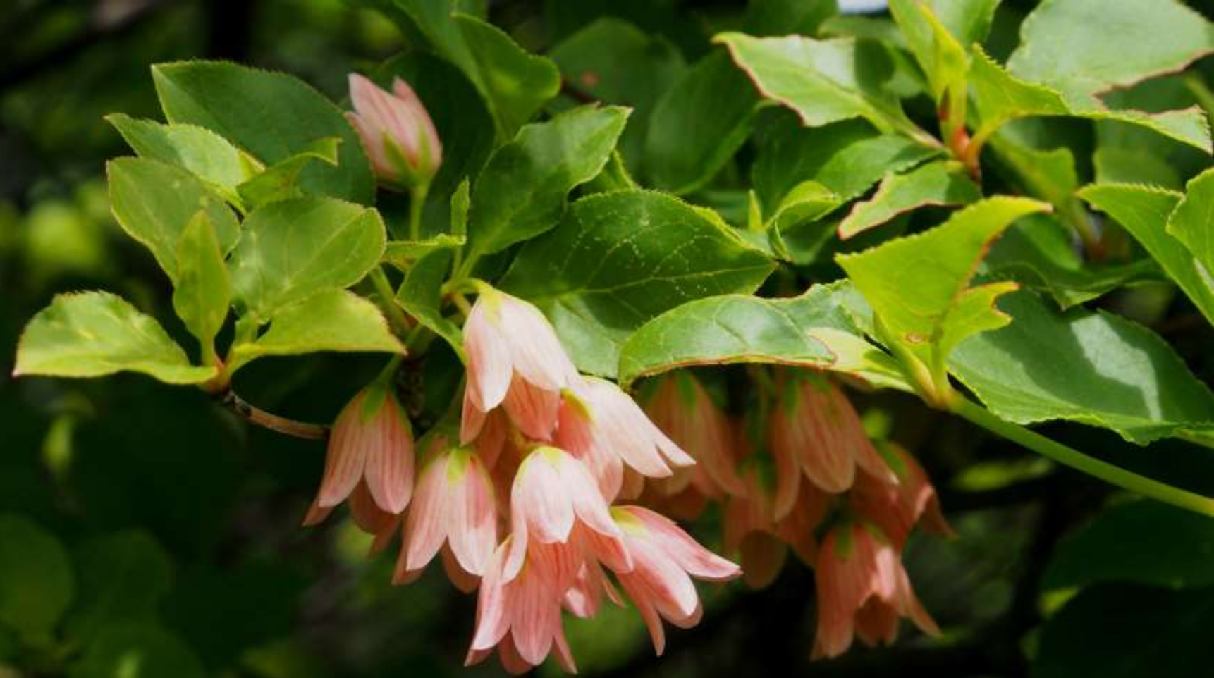
ツクシドウダン(筑紫満天星) ツツジ科 落葉低木