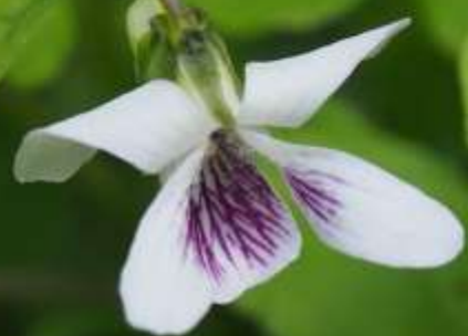
ツボスミレ(坪菫)スミレ科 別名:ニョイスミレ(如意菫)