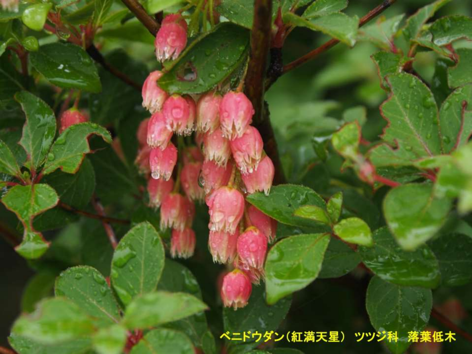
ベニドウダン(紅満天星) ツツジ科 落葉低木