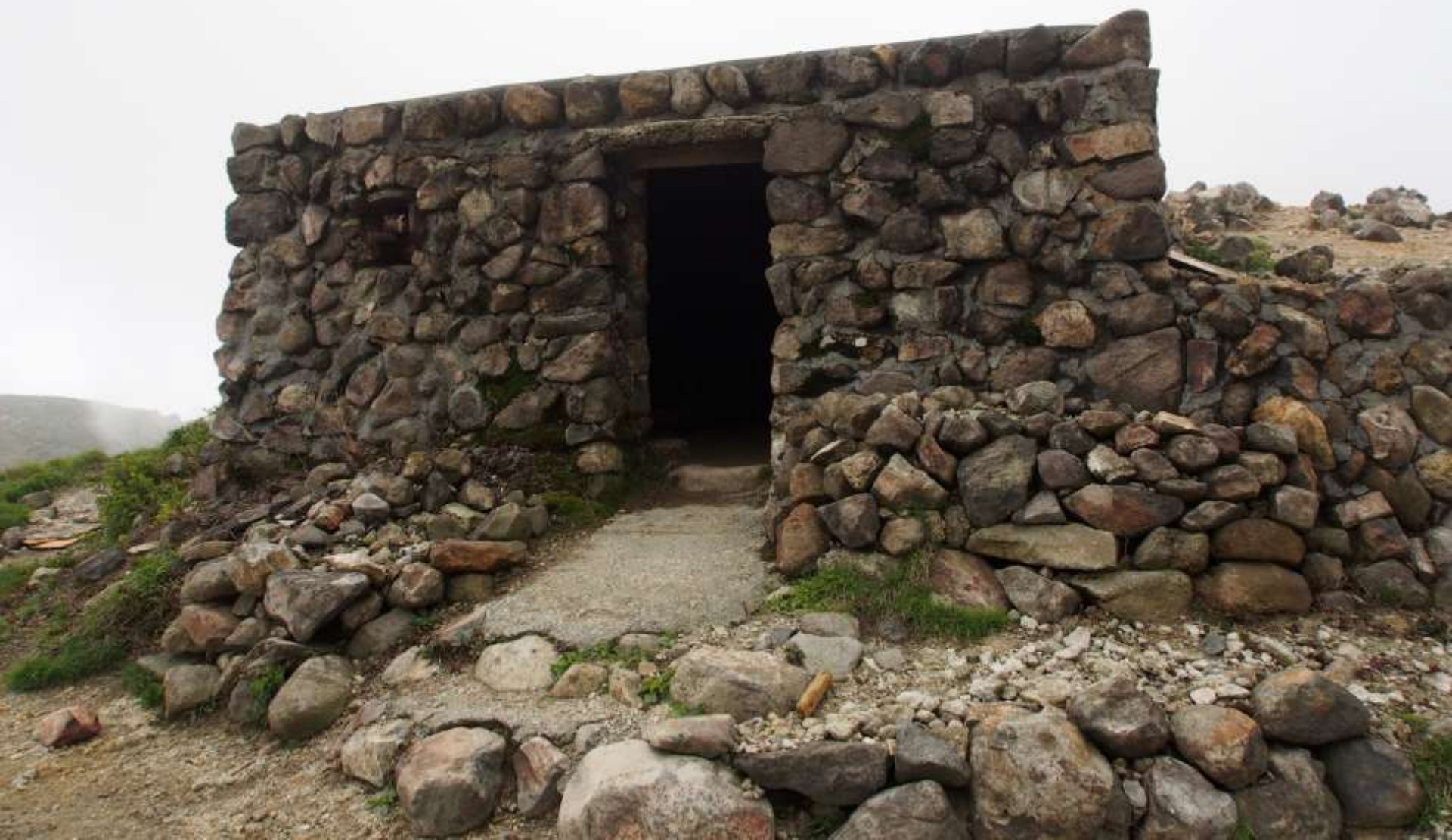
池ノ小屋(中岳1791mの避難小屋)