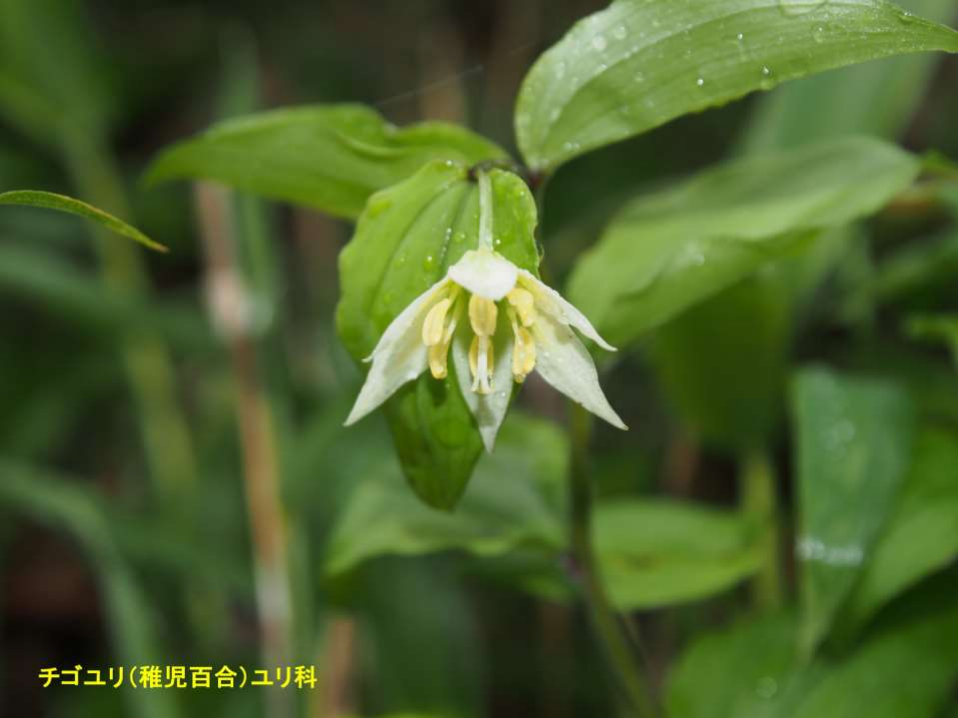
チゴユリ(稚児百合)ユリ科