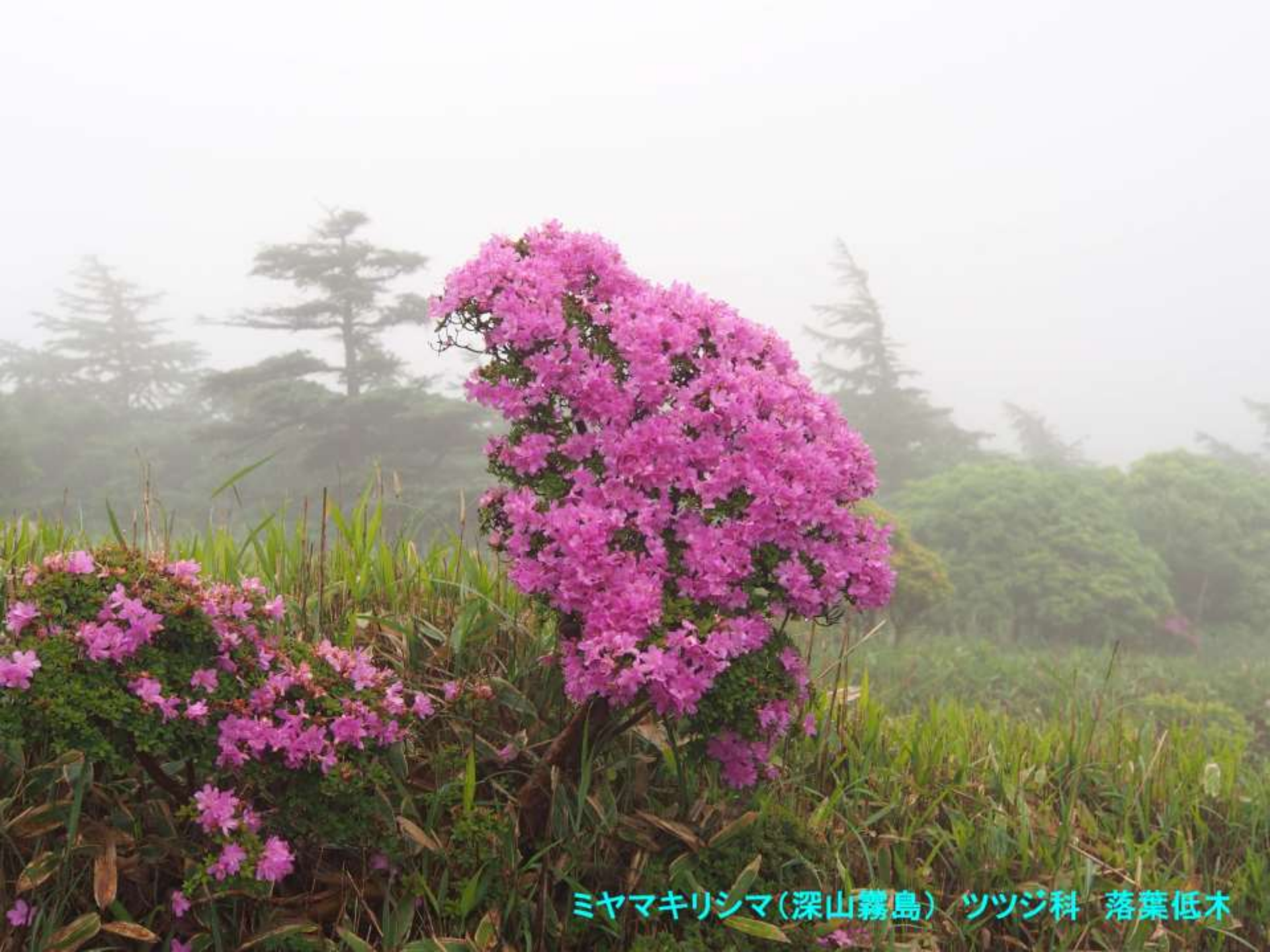
ミヤマキリシマ(深山霧島) ツツジ科 落葉低木