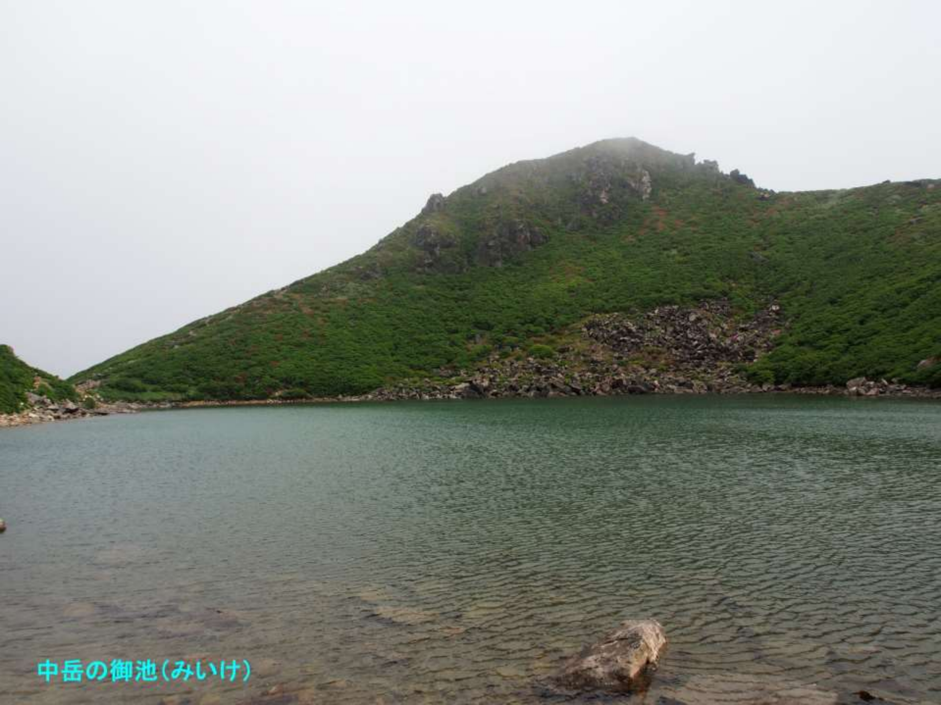
中岳の御池(みいけ)