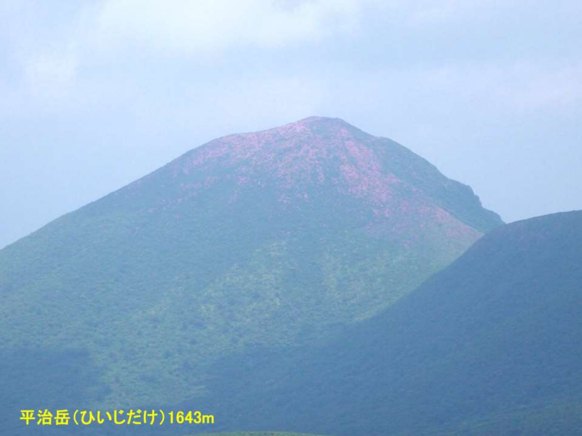
平治岳(ひいじだけ)1643m