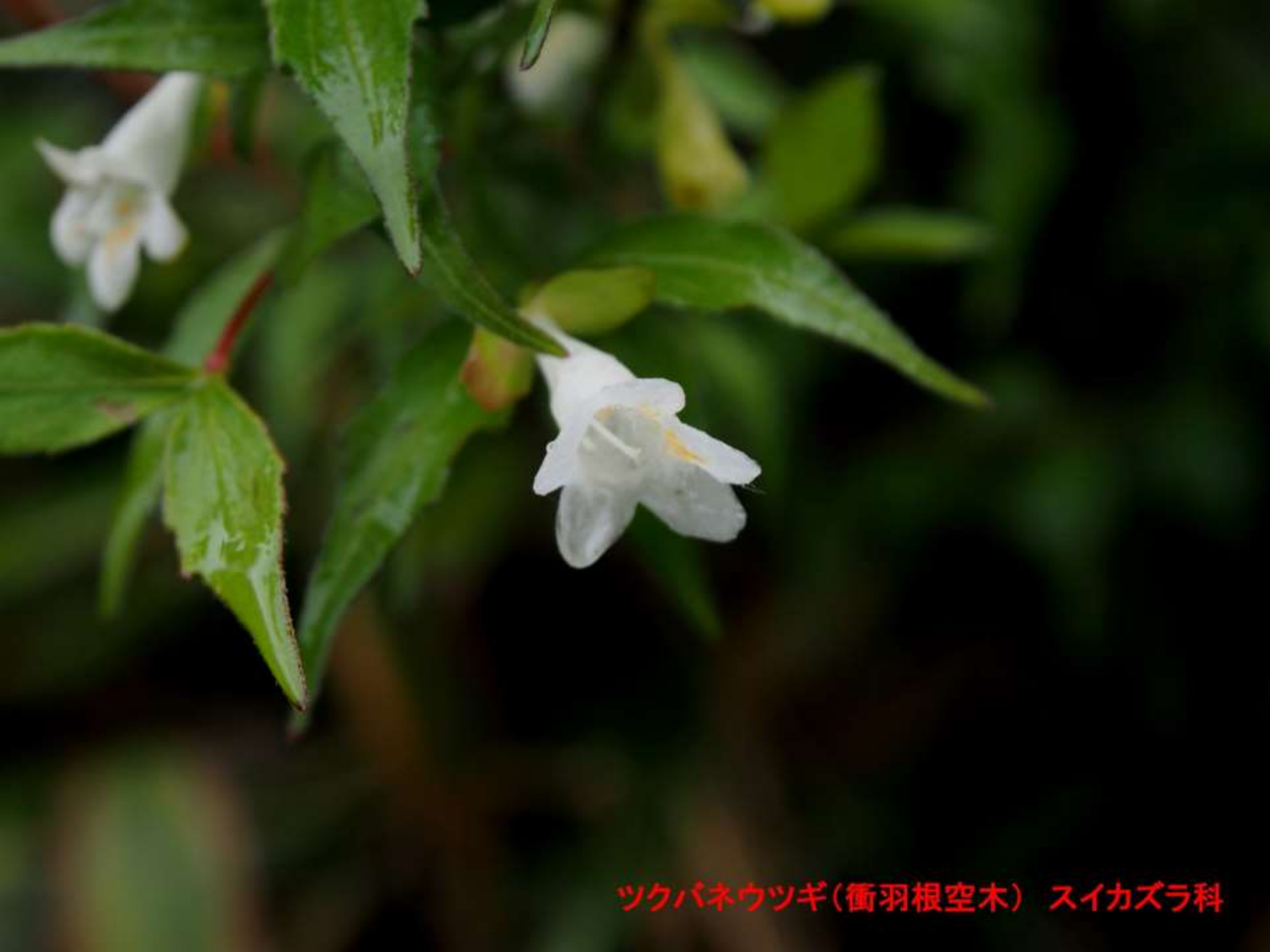
ツクバネウツギ(衝羽根空木) スイカズラ科