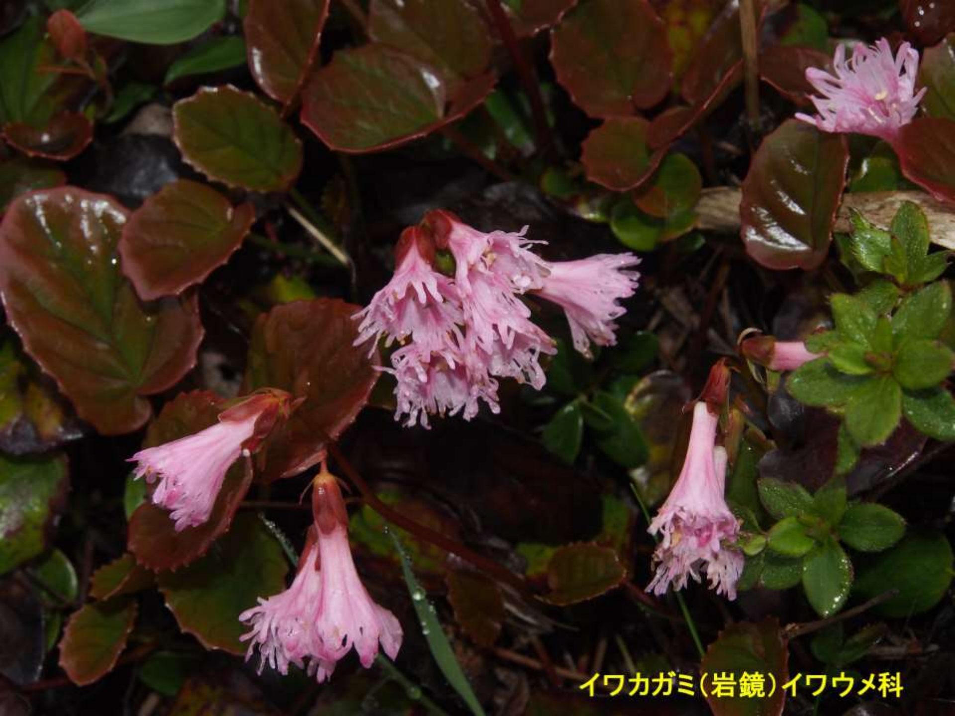
イワカガミ(岩鏡)イワウメ科