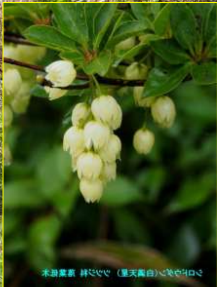
木鈴草 鈴草 (星天白) 花の白