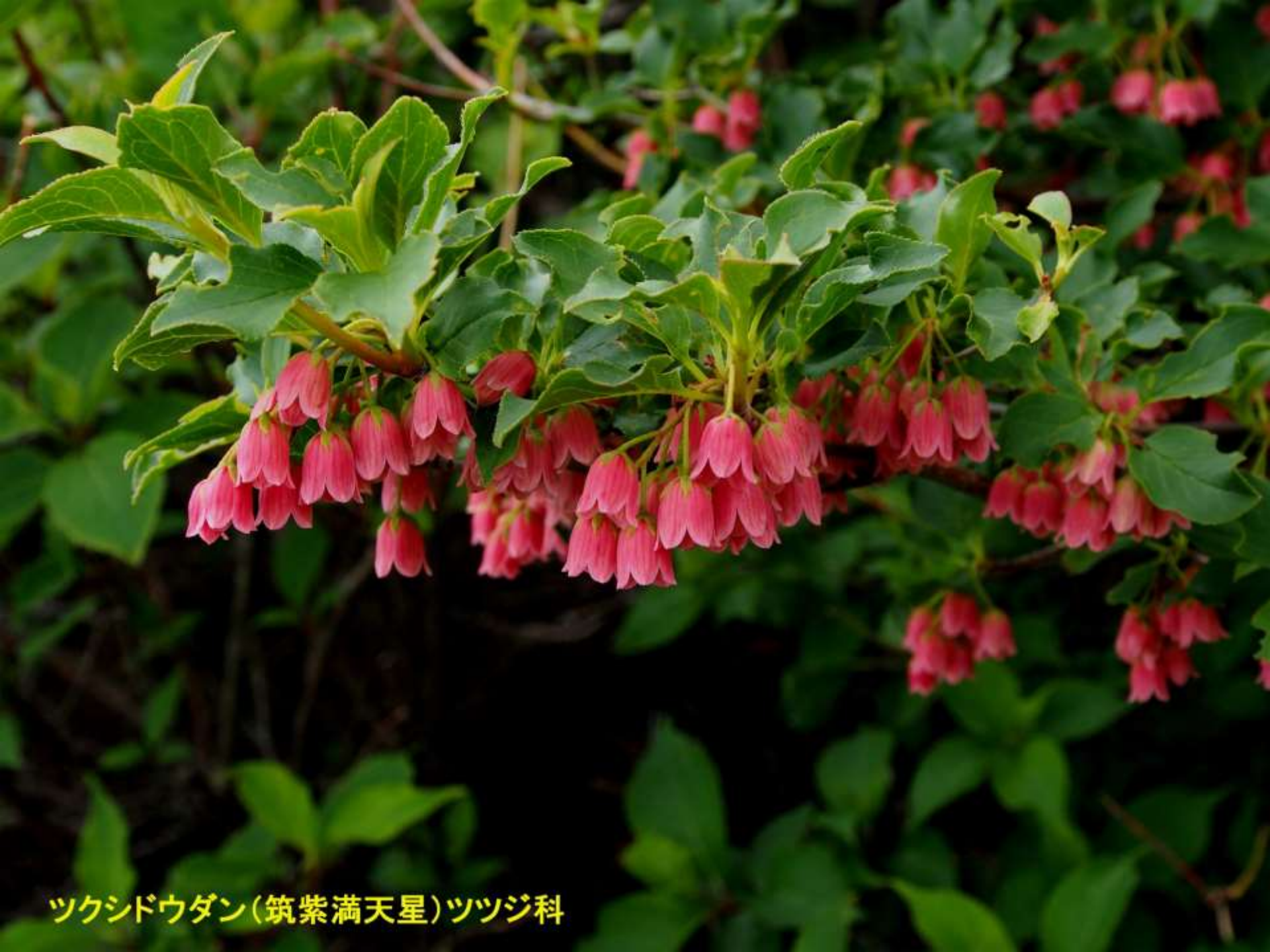
ツクシドウダン(筑紫満天星)ツツジ科