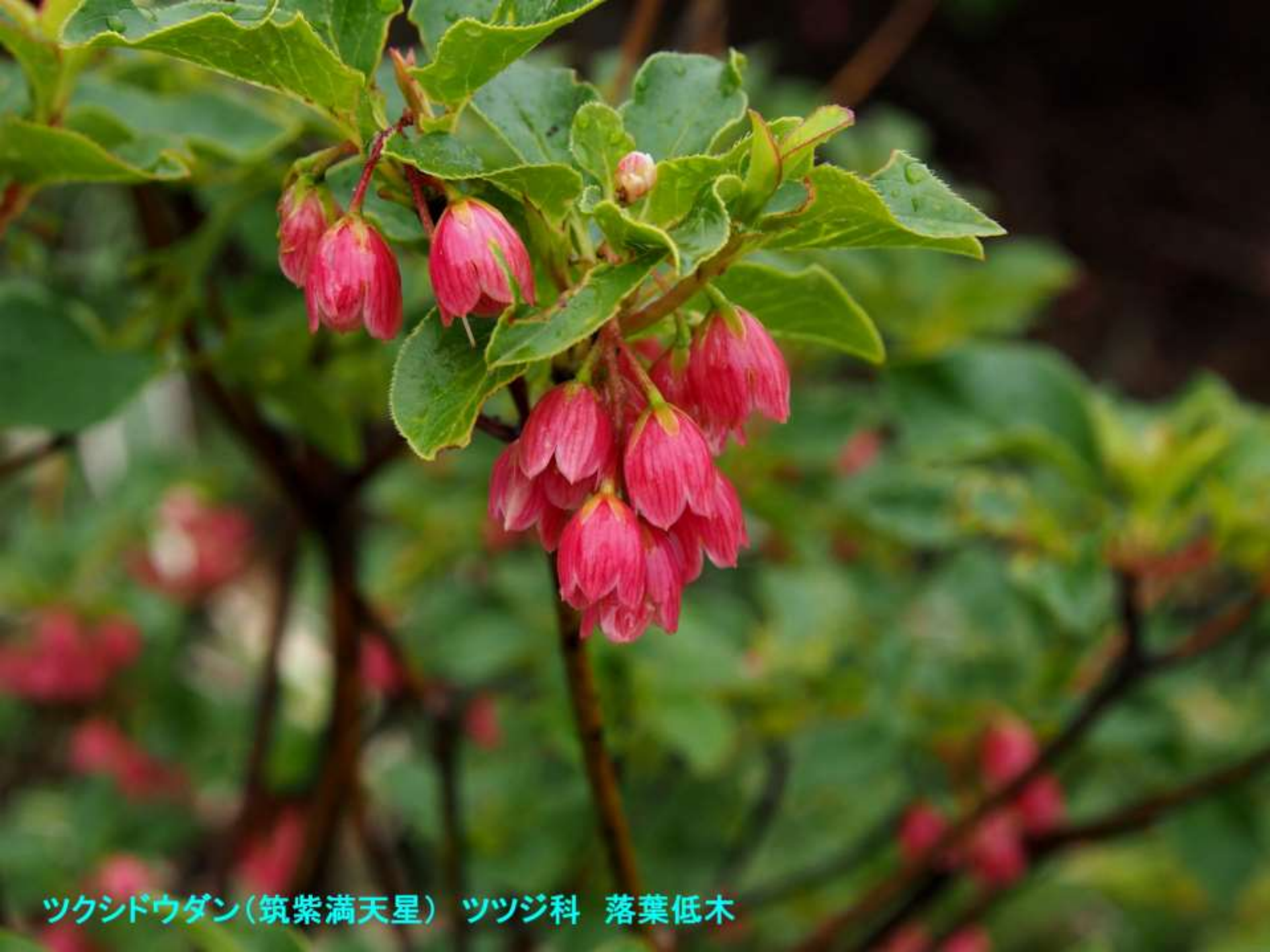
ツクシドウダン(筑紫満天星) ツツジ科 落葉低木