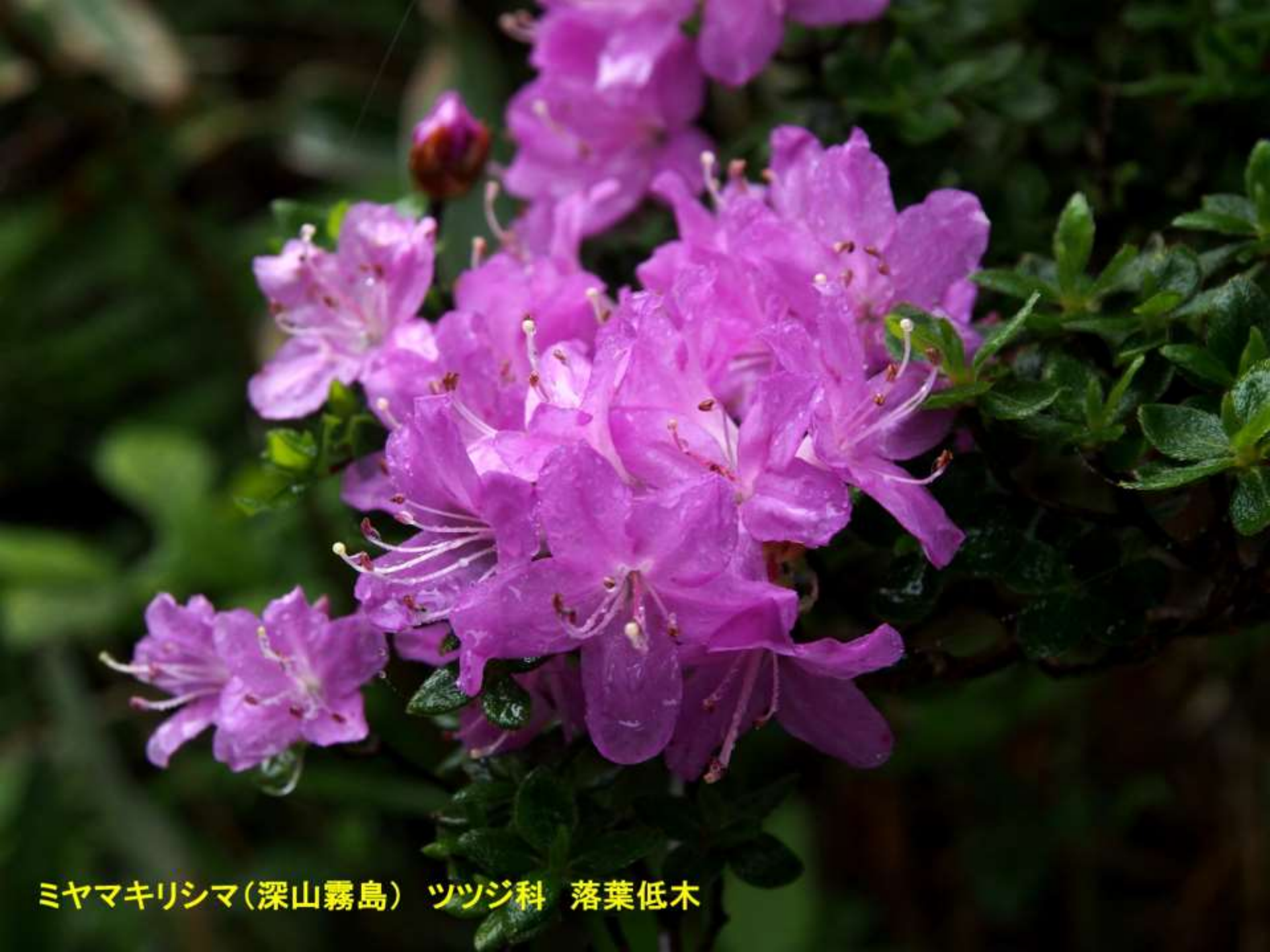
ミヤマキリシマ(深山霧島) ツツジ科 落葉低木