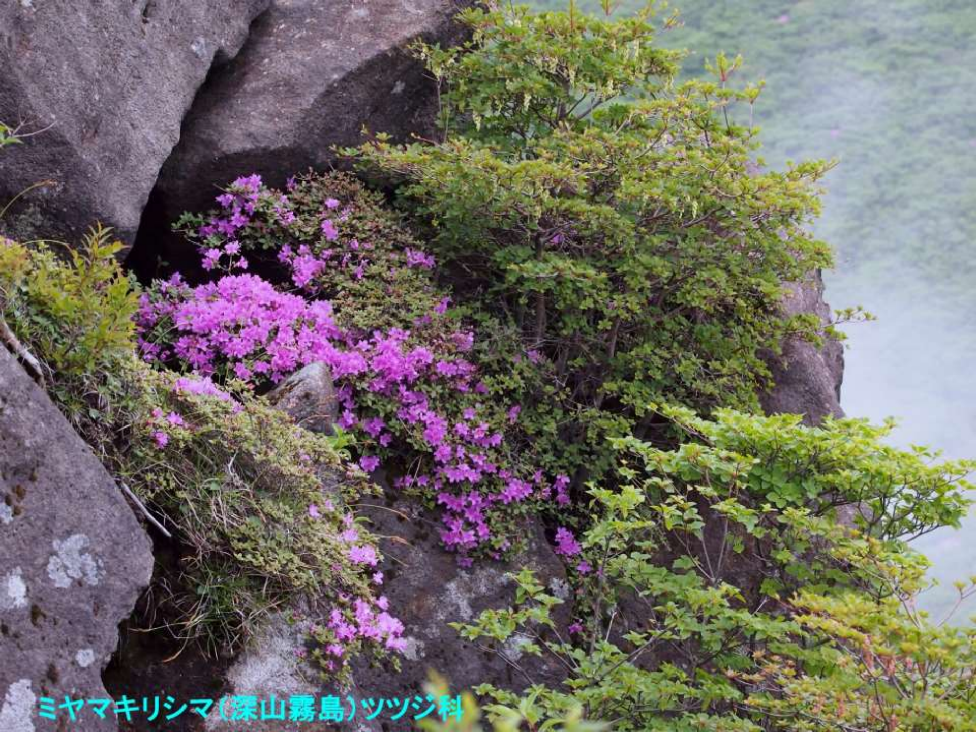
ミヤマキリシマ(深山霧島)ツツジ科