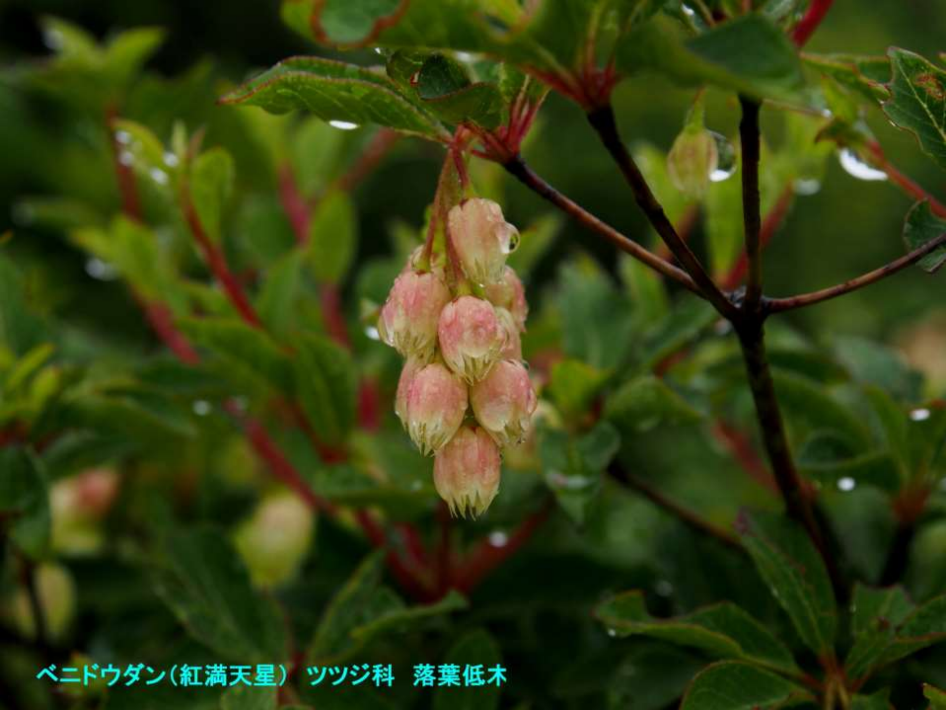
ベニドウダン(紅満天星) ツツジ科 落葉低木