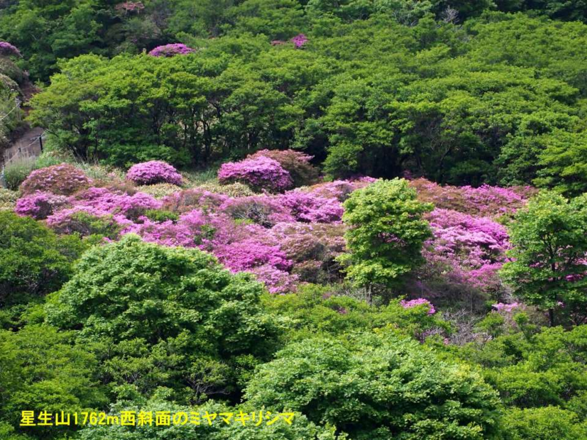
星生山1762m西斜面のミヤマキリシマ