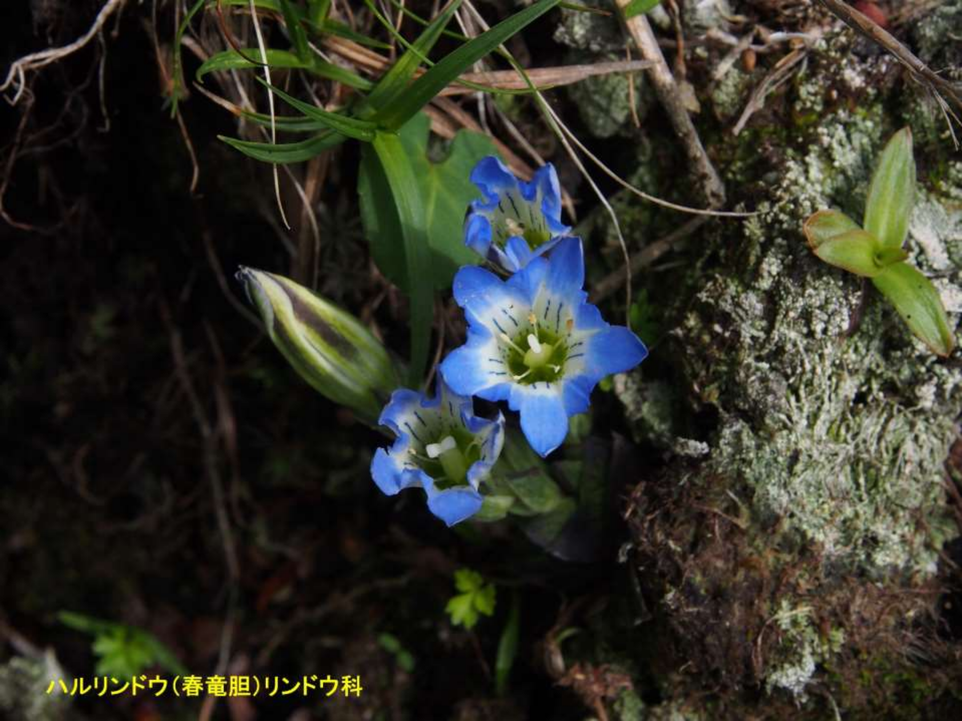
ハルリンドウ(春竜胆)リンドウ科