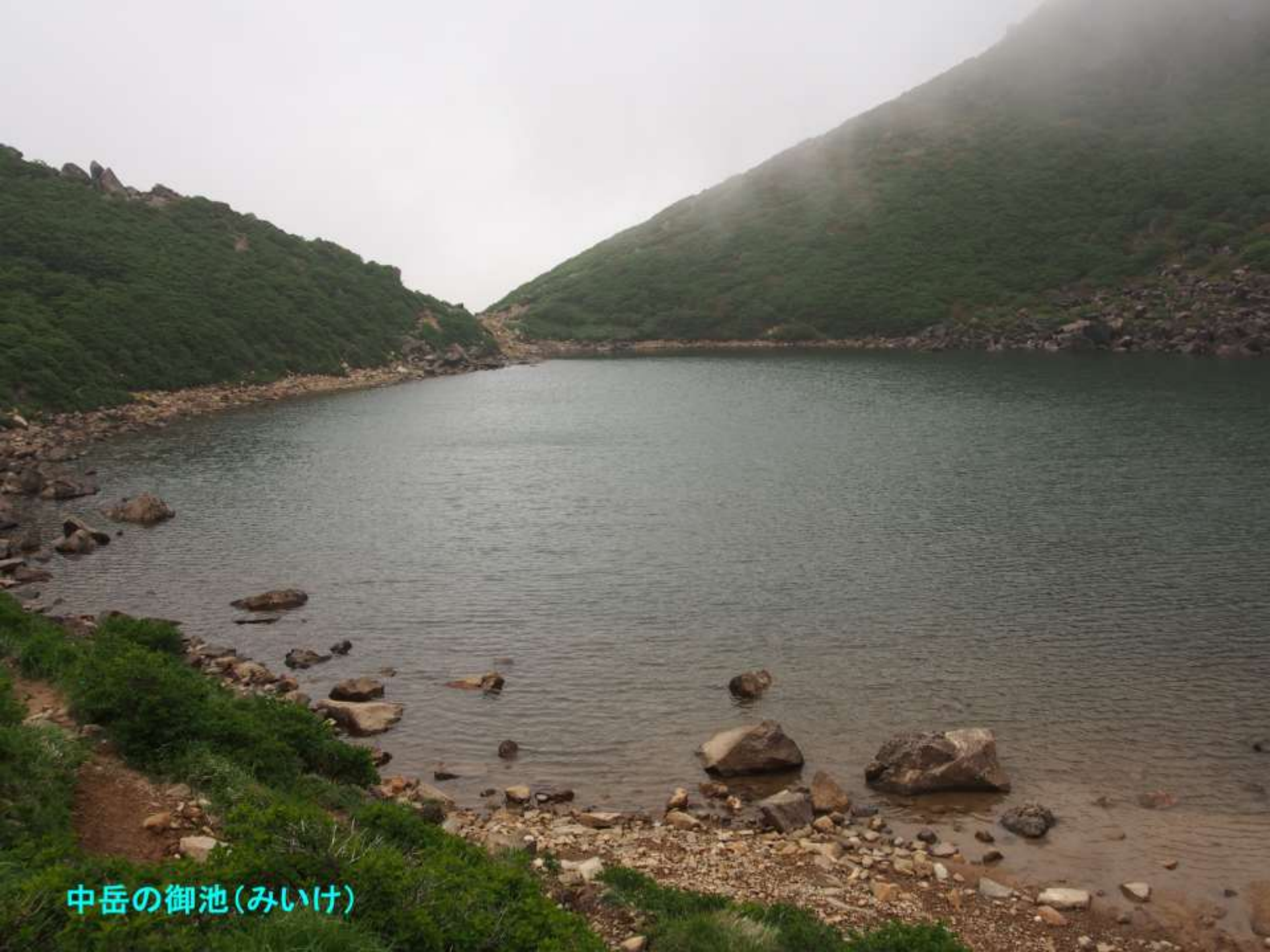
中岳の御池(みいけ)