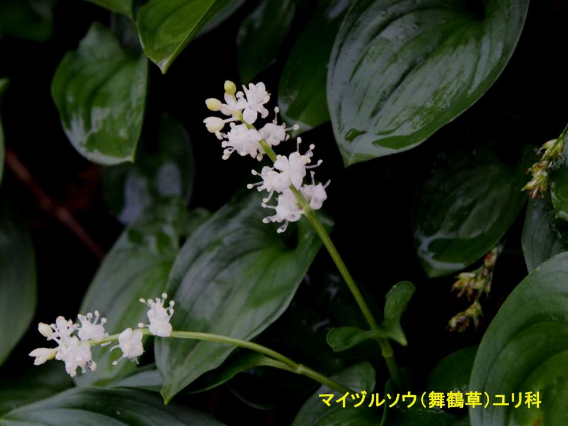
マイヅルソウ(舞鶴草)ユリ科