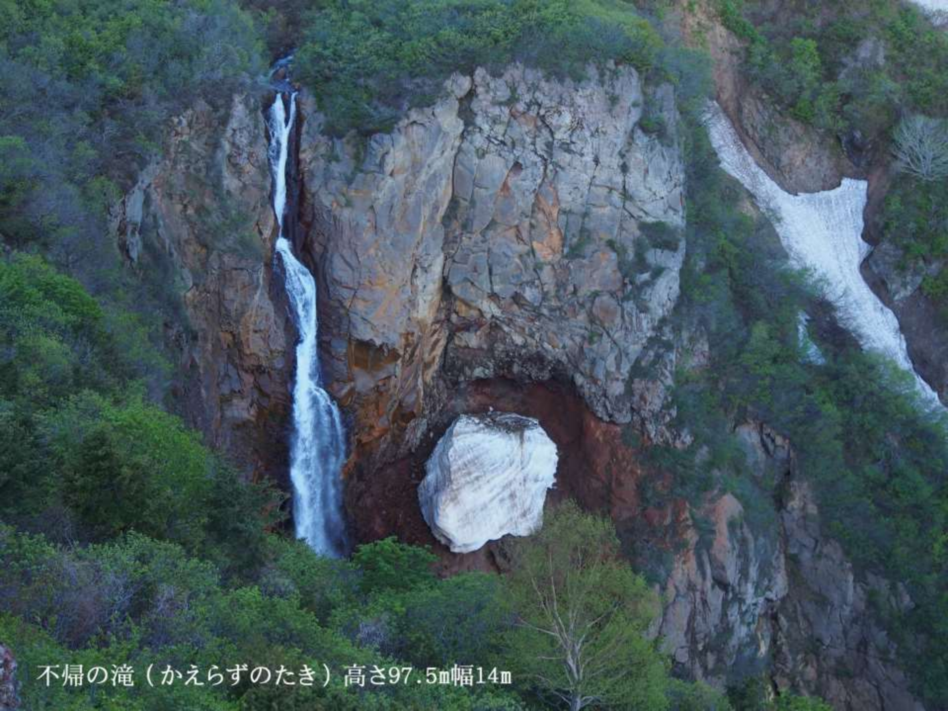
不帰の滝（かえらずのたき）高さ97.5m幅14m