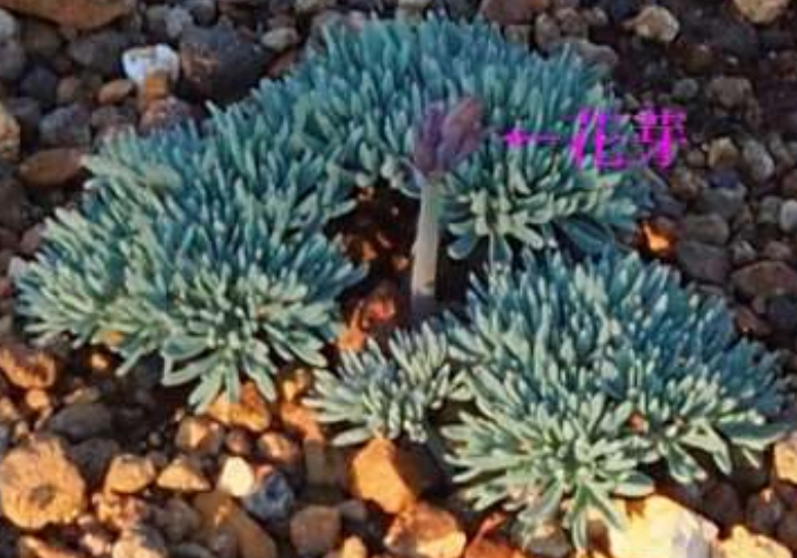
ユマクサ (駒草) ケマンソウ科